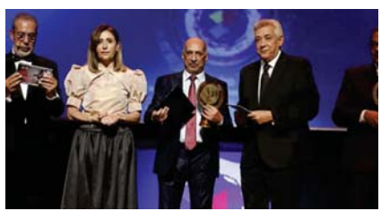
عواد علي أثناء حفل التكريم

كزت وزيرة الثقافة المصرية الدكتور تيفين الكيلاني، الناقد والكاتب المسرحي الكبير عواد علي، من مجموعة من الكرمين من المسرح وهم رموز وصناع المسرح في مصر والعالم العربي، وذلك على هامش مهرجان «القاهرة الدولي للمسرح التجريبي» في دورته الثلاثين. وقال الناقد والكاتب المسرحي العراقي عواد علي في حديثه ل«جريدة الصباح»: أنا سعيد بهذا التكريم وهي حالة نادرة في مهرجان المسرح التجريبي أن يكون هناك تكريم لتأخذ مسرحي وهذا نوع من العرفان بقيمة وأهمية النقد المسرحي وهو تكريم للعراق وقامه المسرحيين. وعن اختياره للتكريم عن العراق قال: لقد رشحتني رئيس المهرجان سامح مهران تاريخي الطويل في النقد والكتابة للمسرح وقد نلت هذا الشرف لأشرف بلدي العزيز. وعن المشاركة العراقية في المهرجان نوه هناك مشاركة واسعة من كتّاب ومؤلفين للمسرح. أما المسرحية المشاركة (ملفت 12) فهي نتاج موضوعاً مهماً جداً وهو هجرة الشباب وراء الجبل هرباً من المأساة التي يعيشها، ومع الأسف يصعبون عرضة للخطاير وغداً للأسماك عبر