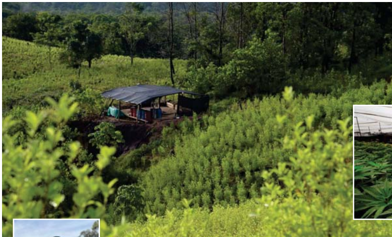
● زراعة النباتات المخدرة تزدهر في كولومبيا

قبل عدة أسابيع، تجتمع نحو مئتي شخص صباحا في بلدة كاجيبيو الصغيرة الواقعة جنوب غربي كولومبيا، لغرض الاستماع للحكومة التي كانت تواصل مداواة جروحها بعد فشل مبادرة لتشريع الماريجوانا الترفيهية داخل البرلمان قبلها بأقل من عشرة أيام.