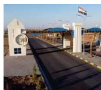
نينوى تزهر، محررة، بيد أهنا

أثف الموسيقار قيس حاضر، سمفونية برح شرقية، ستعزفها الأوركسترا الوطنية ضمن حفلات موسمه على المسرح الوطني.