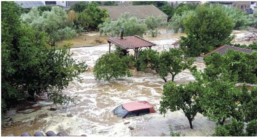
كشفت الحصار مياه السيول عن آثار دمار خلفها عاصفة مطيرة وفيضانات استمرت 3 أيام وسط اليونان، وتسببت في غرق فرى بأكثر من 6 أشخاص من المياه، وتسببت مياه السيول في مقتل ما لا يقل عن 6 أشخاص وأضرار بمباني وأضرار بمباني الدورات، بينما ظل المئات محاصرين أس الجمعة في منازلهم أو في أرض مرتفعة بمنطقة سهل لسياليا اليونانية التي ضربتها السيول التابعة عن العاصف-إتالي-