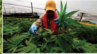
● مزارع كولومبي يعتني بمحصوله من نبات الماريجوانا

قبل عدة أسابيع، تجتمع نحو مئتي شخص صباحا في بلدة كاجيبيو الصغيرة الواقعة جنوب غربي كولومبيا، لغرض الاستماع للحكومة التي كانت تواصل مداواة جروحها بعد فشل مبادرة لتشريع الماريجوانا الترفيهية داخل البرلمان قبلها بأقل من عشرة أيام.