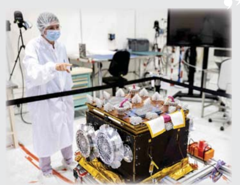
• وزن العربة الجوّالة على القمر المريخي يكاد لا يتجاوز عشرة غرامات