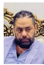
حيدر حمون الفرع

قال رئيس مؤسسة الإعلام العراقي حيدر حمون الفرع إن ملاكات المؤسسة نفذت مقررات منهاج الجلسات الحوارية، التي تعطي ماتبقى من العام الحالي 2023، فخلال تنوع الجلسات في قضايا الساعة السائدة في المجتمع، تناولها