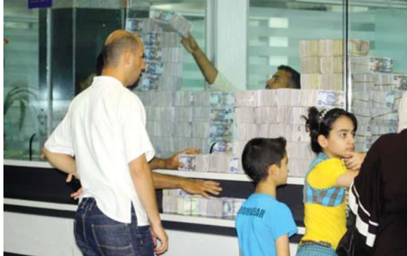
● زيادة حجم الكتلة النقدية

كشف مستشار رئيس الوزراء محمد النجار عن بلوغ الكتلة النقدية للعملة الحلقية حاجز 116 ترليون دينار، مشيراً إلى أن مبادرات التوسع بالدفع الإلكتروني تنسجم مع توجهات الحكومة وأعلن البنك المركزي مؤخرًا مبادرة التوسع باعتماد الدفع الإلكتروني بهدف تشجيع المجتمع على الإفادة من الاستقلال المالي الذي توفره منظومة المدفوعات غير النقدية وأثرها الاقتصادي في البلاد. وقال النجار في تصريح لـ"الصباح": إن "الدفع الإلكتروني يعد محوراً مهماً لتطوير قطاع المال العراقي ونقله لمرحلة متطورة في السياسة النقدية بالبلاد". مشيراً إلى أن "حجم الكتلة النقدية العراقية يبلغ 116 ترليون دينار يتداول منها داخل الجهاز المصرفي ما بين 30-40 ترليون دينار. وأضاف أن "حملة التشجيع على الدفع الإلكتروني تتناغم مع توجهات رئيس الوزراء محمد شياع السوداني لتحقيق تعاملات مالية آمنة، ويهدف لتحقيق منفعة كبرى للمواطنين، إذ يمثل الدفع الإلكتروني مرحلة مهمة يجب أن يدرك الجميع منافعها". وأشار وزير المشرق ماريو الكاروي لـ"الصباح" أن "حملة دعم الدفع الإلكتروني في العراق التي تستهدف جميع شرائح المجتمع من أبناء لها هدف مهم وهو تحقيق منفعة كبرى للبلاد، لأنها تأتي بدعم من رئيس الوزراء وبالتعاون مع البنك المركزي العراقي". وذكر أن "الحملة التي تنظم بالتعاون مع مكتب رؤساء الوزراء والبنك المركزي العراقي والجهات المعنية بهذا الأمر من أجل توسيع دائرة اعتماد الدفع الإلكتروني ومسرّاته الآمنة، تهدف إلى