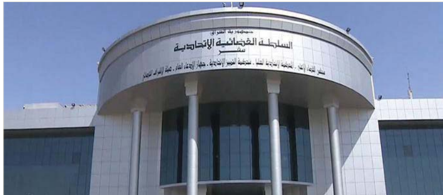
● المحكمة الاتحادية تقر بعدم دستورية اتفاقية الملاحة