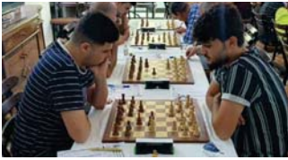
• تطبيق التواضع الدولية في بطولة العراق

وتابع أن المنافسات تمام وفق النظام السويسري بإقاع تسع جولات ويكون زمن اللعب لكل لعبة 70 دقيقة مع إضافة 30 ثانية لكل نقلة متجزئة بينما يكون كسر التعادل من خلال نتيجة اللقاء المباشر.