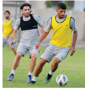
• تحضير فتيور للصقور قبل التعرّك الآسيوي

أعلن فريق القوة الهوائية خوض 3 مباريات ودية أمام أندية كردستان على هامش تحضيرات مواجهة سيهان الإيراني ضمن منافسات الجولة الأولى من المجموعة الثالثة لدوري أبطال آسيا لكرة القدم.