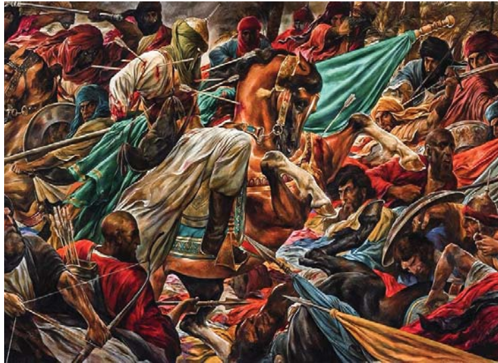
● لوحة الفنان حسن روح الأمين

خفايا جموح النفس تمتد في العشا وتلقي به الأيام في كل مقتل رويدك .. ما كان العناء قد انزوى إلى فسحة تشيك عن طول منزل كأن احتطاب البؤس قد زاد بيننا لهيب انثيال منذ آخر مقتل ولم ينتهج يوماً بأقرب فسحة بها من مرايا البوح .. لا حزن ينجلي وكم شاقني أنني أبنت مسهداً وأرقت وقع اللآء في صوت منزل وكم بصمطيتي عند همس مواجع صداها وحيث القلب ينأي بمجمل فليت الذي أضناك خلف رحيله تأسئ .. ولن يلقاك دون توسل وأمض طويلاً في رجاء وحسرة إذا ما تسئ في مطبات موحل وأرخى كثيراً من قيامات صدم ولم يقترح إلا ضراوة مؤغل أيا طيبة ما كان أجمل عيشنا إذا ما انبرى أمرز أطلحنا بمحمل وإن بلوغ القلب لاشيء بعده وحسب الدنى تهفو بخدلة أرجل فلا تتركيني عند أول معبر يخطئ بلا عينين في رسم منزل ولم يتق يوماً بتاريخ شاعر وكان كما التهميش أفة أمل فلست سماًوياً بحمل جناحه لهرقى إلى الأفلاك في سز مرسل كريباً إذا ما الريح عقت بمنسم تراخى كنعن من فداحة جندل يكابر كالمخدول يلتف حوله شروءاً ولن ينسى براعة مذهل لدى هفوات الحئي أعنان سابع يعاني طويلاً بين حبس ونجول فكان كمن ألقى مشاعر معدم أسبراً بذاك الربع من دون محفل ومتضي به اللحظات بندي بظلمها ولكنها الأمل تبرق كالخلي تعلل .. لا يبيغي طرائد ناس وأخر مغترز ينوء بكلال صبوراً يعجز للحظ أضغاث حالم كذاب يراه البعض في ثوب محفل ألا أيها الجاني ترفق فما الهوى سوى حالة تفريك دون تأمل وإن اصطياد البحر قد هاج مزنة فألتقت خمأها فوق عثرات محفل شعوري تهادى دون أي وسيلة وحسبي من الإنصات ديدن مقبل فما جف صوتي إن يبست كشتلة فإن حصاداً ما تراخي بمنجلي وإن سنئي العوز تلهف خلفنا فهل تعذريني .. إن لعتت بأول