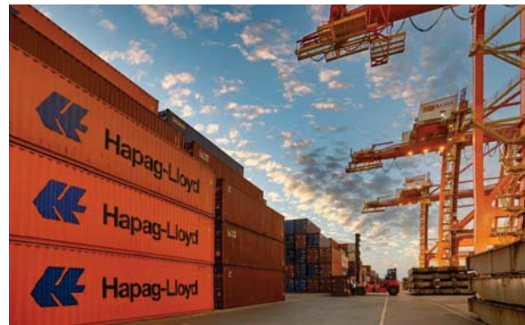
● عوامات بحرية ذكية تستخدم في الموانئ العراقية للمرة الأولى