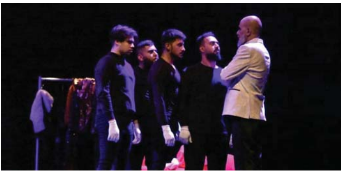
● حاول المؤلف أن يجعل من الموت بوابة لنباهة حياة جديدة