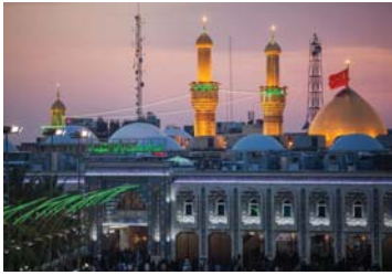
● عزز الطقوس الدينية الانتماء الاجتماعي

كيفية استجابة الدين والتكيف مع التغيير الاجتماعي. تخضع المجتمعات للتحويلات مع مرور الوقت، وغالباً ما تتعرض المؤسسات الدينية للتغيير من أجل البقاء. يدرس العلماء كيف يتفاعل المجتمع الديني مع التغيرات المجتمعية، مثل التطورات التكنولوجية والعلوية والتحديث. توفر هذه العلاقة الديناميكية بين الدين والتغيير الاجتماعي رؤى قيمة حول مرونة وقابلية الإيمان في عالم متغير باستمرار. تعتبر سوسولوجيا الطقوس الدينية فرعاً مهماً من علم الاجتماع يركز على فهم وتحليل الأبعاد الاجتماعية للطقوس الدينية في المجتمعات. تعكس الطقوس الدينية الممارسات والتصورات الروحية والتعليم الدينية لفئة معينة من الأتباع وتشمل الطقوس الدينية مجموعة متنوعة من الأفعال والتصرفات، مثل الصلوات، والتضحيات، والأعياد، والشعائر الزوجية والجنائزية، والتجمعات الدينية. الخ. وتعتبر هذه الطقوس أحد أهم وسائل التعبير