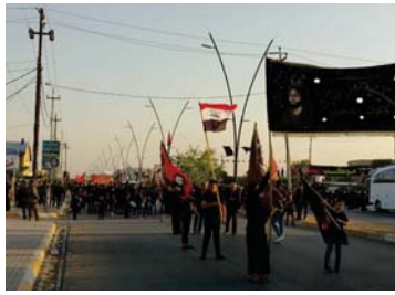
طيف كركوكي مزم