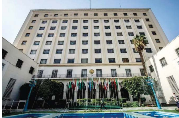
مقر جامعة الدول العربية

يشارك العراق في المؤتمر العالمي للبحوث العلمي، والبعث العلمي، في أعمال المؤتمر العربي الخامس (حول) والخاص بدور الجامعات في تحقيق أهداف التنمية المستدامة للتعليم، والذي تعهده المنظمة العربية للتنمية الإدارية التابعة لجامعة الدول العربية، غدا الأحد بمقرها في العاصمة المصرية.