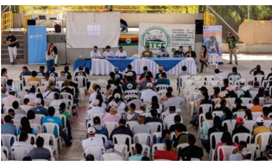
● جلسة حوار مفتوح بين الحكومة والمزارعين لمناقشة إنتاج المواد المخدرة

شأنه شأن الكثيرين من مزارعي كولومبيا، يقول مستند قانوني تقطعة الأرض التي يزرعها، ويضيف: "لقد ورتت الأرض من أبي، وبياتالي فهي ملك لي، لكن لا توجد أية ورقة يمكنكم أن تمنع أي فرد من التحرك وأخذها مني"