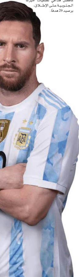
● برلين، أ ف ب

وتابع ميسي المائز بالكرة الذهبية سبع مرات علينا أن نردك أننا استمتعنا بكل شيء كثيراً، لكن ما فعلناه انتهى، علينا أن نتطلع إلى الأمام. وفيما لم يؤكد قط ميسي استمراره مع المنتخب الوطني حتى مونديال 2026، إلا أنه أثبت مرة أخرى أنه الروح الناضجة لفرقة من خلال هدفة الحاسم الذي منح النقاط الثلاث لفرق المدرب لويس سكالوني. وحصل لوتارو مارتينيز على خطأ في منطقة حساسة خارج منطقة الجزاء يماثلها في الدقيقة 78، وتمكن لاعب انتر ميامي الأميركي من التنفيذ بطريقة مثالية بعدما اصمدت كرتة من ركلة حرة في القائم ثم مباشرة داخل الحرمي.