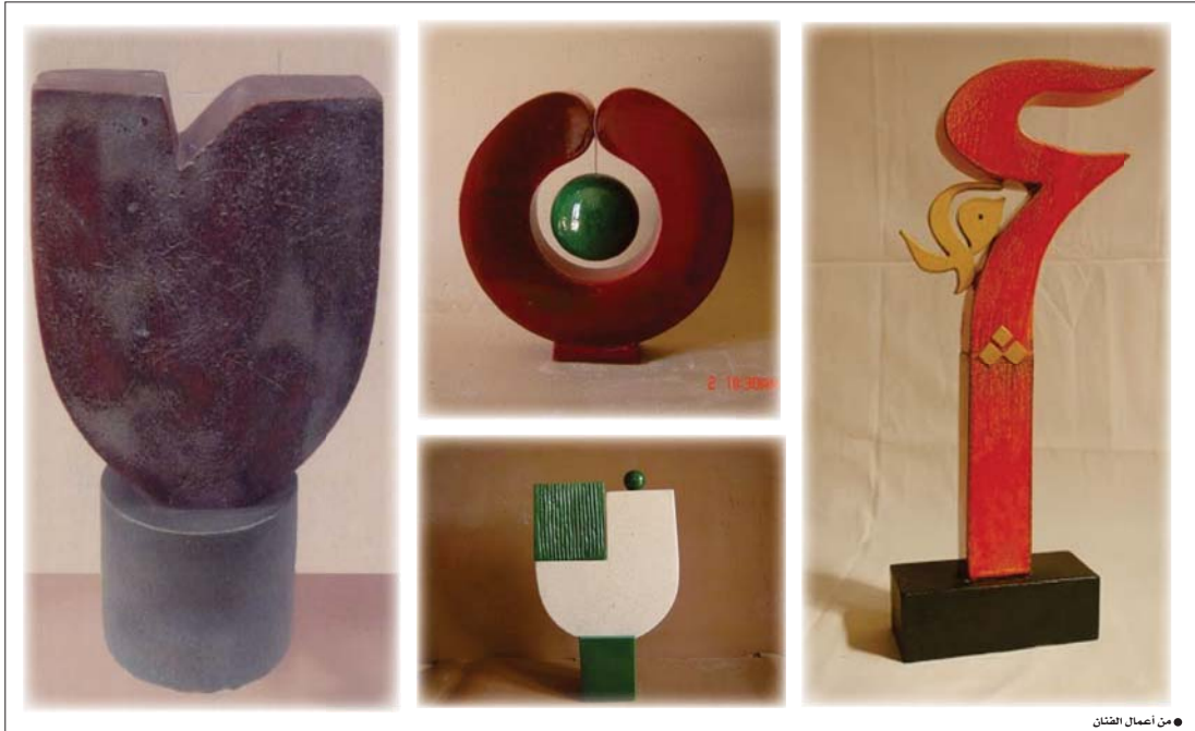
● من أعمال الفنان

لهوية شرفية تسمي لتعبير الأهداف وترتبط معالم التربة وطبيعتها بكيان الإنسان، فكانت طرائق فنه تهييم في مخيلة تماكي الفن التقليدي وتحافظ عليه، وتتكامل ما ينتج لها من إحاطة في خطاب الحدثة، ووجدت ذلك حينما تشاهد له وضع علامات وحروف وأشكال بيضية، تصعد من