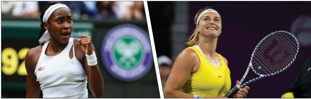
● تويوروك، أ ف ب

المناخ وبلغت أبنفة الـ 19 عاماً أول نهائي لها في فلاديفينغ ميدوز. وتبحث غوف التي أصبحت أصغر لاعبة أميركية تبلغ نهائي البطولة منذ سيرينا ويليامس عام 1999، عن لقبها الكبير الأول. قالت إنه على الرغم من أن الإيقاف القسري كان صعباً، إلا أنها أبدت عاطفتها مع التشجيع وفضيحتهم. وأوضحت غوف أنها بالتأكيد آتية بتغيير المناخ. اعتقدت أن هناك أشياء يمكنك القيام بها بشكل أفضل، أفضل الأبعاد ذلك في مبارياتي، لكنني لم أكن غاضبة من المتظاهرين. وشرحت من الواضح أنني لأزيد أن يحدث ذلك عندما أكون متقدمة 6-4، 0-1، وأردت أن يستمر الزخم لكن مهلاً، إذا كانوا قد شعروا أنهم بحاجة إلى القيام بذلك لإيصال أصواتهم، لا أستطيع أن أزعج.