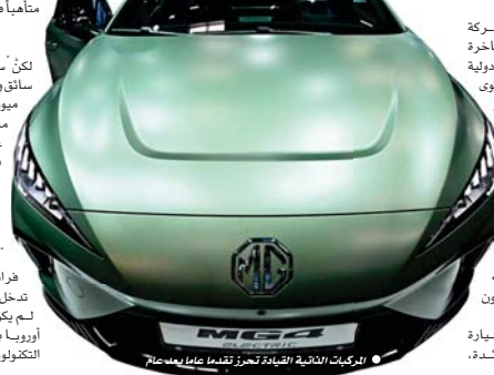
المركبات الذاتية القيادة تعزز تقدماً عالياً بعد عام

والتي يصل سعرها إلى مبلغ مؤلف من ستة أرقام. وحصلت شركة هوندا على موافقة أولي على مستوى العالم لبيع سيارات