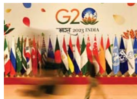
• اجتماع زعماء مجموعة العشرين