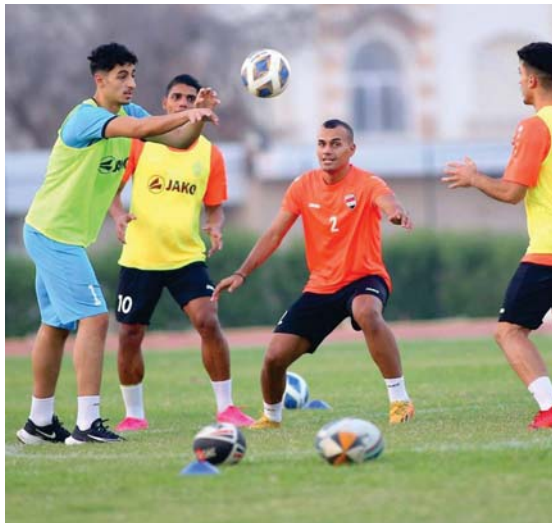
• بغداد، الصباح الرياضي

يخوض منتخبنا الأولمبي لكرة القدم مساء اليوم السبت، مواجهة الثانية أمام نظيره تيمور الشرقية، التي يعتمدها ملعب نادي الكويت الكويتي لتتطلب البطولة الثانية من المجموعة السادسة لتصفيات كأس آسيا تحت 23 سنة، تعقيها مباراة ثانية، تجمع صاحب الأرض ونظيره منتخب ماكاو. ويعد تكتيكاً راضياً شغشغل في هذا اللقاء عن انتصار ثانٍ على تيمور الشرقية، ويعد وأقدم من الأهداف مع إمكانية اجتياز منافسه الآسيوي بسهولة لاسيما أن الأخير تلقى هزيمة بأربعة أهداف نظيفة أمام الكويت في الجولة الأولى، التي جاب رغبة مدربنا في التمسك بصدارة المجموعة قبل مواجهة الأزرق في الجولة الثالثة الحاسمة يوم الثلاثاء المقبل.