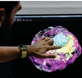
• تكوين نموذج لجنين بواسطة الخلايا الجذعية الجنينية البشرية

وأكد الباحثون أن دراستهم تختلف عن سابقتها حول هذا الموضوع، لأنهم يستخدمون خلايا معدلة كيميائياً لا وراثياً، ولأن نماذجهم، مع الكيس المحي والتجوييف السليوي، تشبه إلى حد كبير الأجنة البشرية. وقال جيمس بروسكو من معهد فرانسنيس كريك في لندن إن أوجه التشابه هذه تجعل هذه النماذج أكثر فاعلية في البحوث المتعلقة بحالات الإجهاض اللاإرادي والتشوهات الخلقية والغم. وأشار إلى أن النموذج الذي تم إنشاؤه يتعلم على ما يبدو مختلف أنواع الخلايا التي تشكل الأنسجة في هذه المرحلة