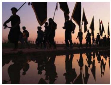
● السائرون إلى كيرلا، يظعنون بعنا جديداً يتمثل بمحاولة من الاستيقاظ الروحي