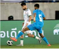
• اناه أسود الراغبين (مقلق)