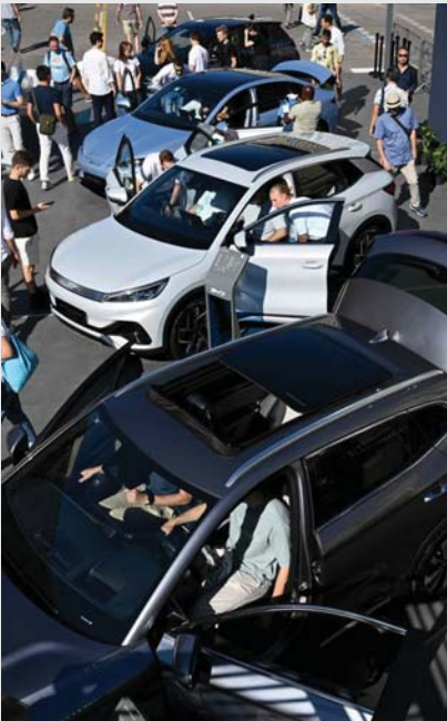
• كل المركبات من دون استثناء، تجمع بيانات شخصية أكثر من المتفرغ

أخضعت للدراسة، وهدمها رينو ودايسا المتعمتان إلى المجموعة نفسها، تشيران إلى أن سائقي السيارات من حضم طلب حذف البيانات الشخصية التي جمعت خلال استخدام السيارات.