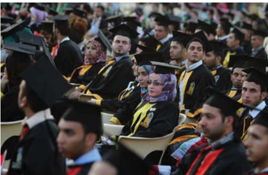
● العراقي يُخرج العشرات من المهندسين والأطباء والصيدلة