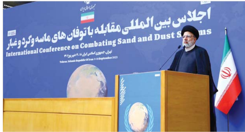
• جانب من الاجتماع الدولي لمكافحة التصحر