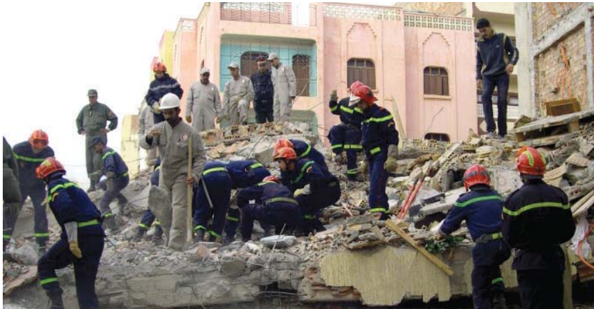
● رفع أنقاض الزلزال الذي راح ضحيته مئات

أبدت دول العالم تعاطفها مع ضحايا الزلزال العنيف الذي ضرب المغرب ليل أمس الأول الجمعة، وخلفت مئات الضحايا وتسبب بأضرار كبيرة في مراكش والمناطق المحيطة بها، واستنفر الزلزال القوات المسلحة الملكية التي هرعت تجاه أقاليم الحوز وشيخاوة وتارودانت المتضررة. وذكرت جريدة "هسبريس" المحلية، أن عددا كبيرا من أليات القوات المسلحة الملكية توجهت صباح أمس السبت من الدار البيضاء إلى مراكش، للمساعدة في عملية البحث عن الضحايا وإنقاذ المواطنين الذين ما زالوا تحت الأنقاض.