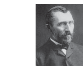
● فان جوخ