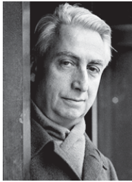
• رولان بارت