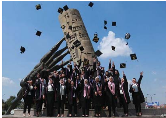
● المجموعة الطبية مرغوبة لدى الأغلبية من المجتمع العراقي