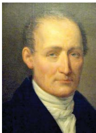
• نيسبور نيسس

ودفاتحه رغبة منه في إفساح المجال لعين الكاميرا أن تلت مكان عين الرسام، في لحظة مثالية في فشل الرسام في خلق ظروفها، (في غرفة التطهير) رسم رولان بارت فكرة (التصوير المرضي) يعمل المجتمع في عقلنة الصورة، وعلى نهضة الجنون الذي يهدد باستمرار، بالانفجار في وجه من ينظر إليها (-) ويعلق بارت في مجال آخر (الموت المبط) حول حمى التصوير الخارجي الذي ابتكرته الكاميرا الرقمية المحمولة (كل هؤلاء المصورين الشباب الذين يتحركون في العالم، ويهتفون أنسهم للإسلاك بما يجد من أخبار رائعة، لا يعملون بأنهم وسطاء