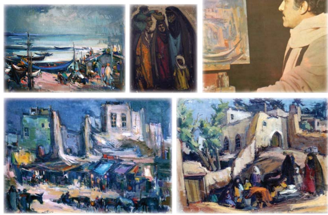
من أعمال الفنان

خطى الفنان خالد الجادر 1924 - 1988 في حياته بأهم ماتمي الحركة التشكيلية، حيث أقام أول معرض سنة على تله شهادة الدكتوراه بدرجة الشرف من جامعة نيل الفرنسية عن أطروحته عن الخطوط العنقودية المصورة من فترة القرون الوسطى المحفوظة في المكتبة الوطنية في باريس، كما شغل موقع عميد معهد الفنون الجميلة، وأول عميد لأكاديمية الفنون الجميلة العام 1961.