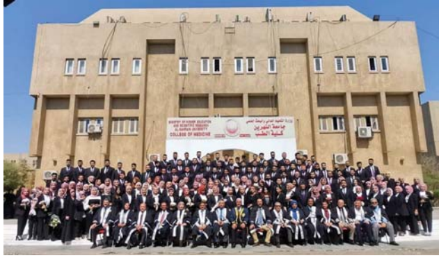
● أصبحت مهنة الطب تجارة مربحة