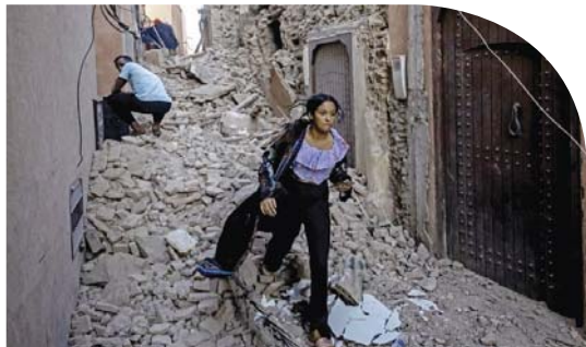
● فتاة تبحث عن ذويها بعد انهيار مبنى منزلها