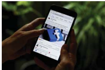
• نشأت نزاعات عدة في مختلف أنحاء العالم بين «ميتا» ومشرّعين ومؤسسات إعلامية

وأكدت المجموعة في مقال على مدونتها أنّ قراره الأخير ومشاركها مستقبان متاحتين للمستخدمين من خلال شريط التوظيف التي أوضحت أنها لن تأخذ على عاتقها من اليوم فصاعداً علامة التويب الأخبار ولن تعقد اتفاقات مع ناشري الأخبار لتوفير المحتوى في هذه