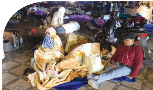
● عائلة تقترش الارض بانتظار فرق الانقاذ

وقد وقع الرئيس الأوكراني فولوديمير زيلينسكي رسالة تعزية في ضحايا هذا الزلزال عبر حسابه على منصة "إكس" وأصرع عن تضامن بلاده مع المغرب خلال هذه الفترة المسارية، ووجه إلى المستشار الألماني أولاف شولتر التعازي إلى أقارب ضحايا زلزال المغرب، قائلا إن الأنباء الصادرة من هناك مروعة، كما قدم وزير الخارجية السويدي توبياس بيلستروم خالص التعازي لجميع ضحايا الزلزال ولأسرهم في المغرب. وقال رئيس الوزراء الهندي ناريندرا مودي تعاطفه مع ضحايا زلزال المغرب، قائلا، "حزين جدا لفقدان أرواح نتيجة الزلزال في المغرب".