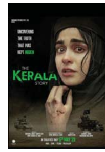
● بيومر الفيلم

يعد "حكاية كيرلا" من بين مجموعة أفلام تثير التلق من أن بوليوود تبت دعاية ثقافية، لحشد الدعم للحزب الحاكم في الهند قبيل الانتخابات. يشير المقطع الترويجي للفيلم، الذي يتعمد شبك التناكر في الهند إلى أن العمل يصور "فتيات بريتان... يتم الانتاج بهن من أجل الارهاب"، بينما يؤكد بأنه "مستلهم من العديد من القصص الحقيقية". الفيلم الذي يروي قصة خيالية عن امرأة هندوسية اعتنقت الإسلام وتطرفت، حل في المرتبة الثانية من جهة الإيرادات عام 2023.