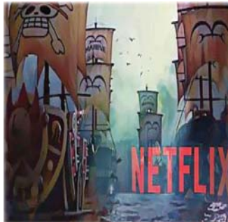
• سلسلة "انمي"، مستوحاة من قصص المانغا

وتحقيقه وغير ذلك من تفاصيل لا نغتر عليها من ضمن الأفلام والمسلسلات الواقعية، من دون مؤثرات "الانمي" اليابانية الخاصة التي تحرك على القصة بالفتش. فكرة تحويل "الانمي" إلى مسلسل واقعي ليست جديدة، فقد سبق وحكم على مثل هذه التجارب بالفشل، مثل فيلم "دوت نوت" وغيره، على التقيض من سلسلة "دي سي وميرفل" التي لاقت عناية شديدة وإنتاج ضخم من جهة الشركات المنتجة، قبل الاعلان عن انطلاق مسلسل "ون بيس". منذ بدء طرح الفكرة والمسلسل يثير الكثير من الجدل مع توقعات عالية بالفشل، وقد انقسم جماهير "الانمي" إلى نصفين، منهم من رفض رفضا قاطعا بما سماه "شبهية الفكرة"، وغيرهم من ساهم بدعم الفكرة. وقد اعترض بعضهم ممن يثيرون الجدل على "صوت الشخصية" التي تجازت عبر اقتراح فكرة عمل طريق ألكه بواسطة الفلم اليابانيين أنفسهم، كأمسوات للمسلسل، لكن تم بعد الاتفاق على ما نعلم أن العالم العربي قد تعرف على "الانمي" من خلال قناة "سبيس تون"، وعند من خلالها إلى خلق قاعدة جماهيرية كبيرة، ومستمرة. من هنا فإننا نأمل ان يكون من تلك المساعير بعد مشاهدة قصة "الانمي" الفلمة لديك. تلك أحداثها التي اجرت معك منذ أيام الطفولة إلى السبنا وصولا إلى الشباب، كيف تبدو وهي تتحول إلى مسلسل واقعي. يتمتع "الانمي" عادة بحرية كبيرة لتصوير خيال غير محدود، فالؤثرات الصوتية والمهافة يمشاهد المارك وتلك التصاعلات المؤثرة والمعيرة في مشاعر الشخصيات من حزن وفرح، عن رسوماتها التي باتت بسمات غربية منها رجل يجسد سمكة ويهيكل معنفا، فضلا عن لسناط طفولية أخرى مثل طريقة طرح قضية الصداقة والبعث عن العلم