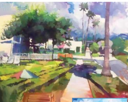
● بعض أعماله

مشيرا إلى أن الأسلوب، الذي يعتمد فيه رسم البورتريت هو الواقعي بعنونه العريض، ولكن مع بعض المشاكسات وإزازات اللحظة ورواسب الخيالية، لذلك يمكن أن نجد مدرستين ويعمل واحد. وعن توجه الفنانين التشكيليين الشباب إلى المدارس الحديثة يبيد رأيه تلك المدارس سبب أن تكون عسكرة جهد جبار قد أنتجت سائقا، لا يمكن التفرض على مرحلة الأكاديمية، وبلا سيكون النتاج سادجا غير مدرسو. ويخصص عزوف الناس عن الحضور، خصوصا المثقفين منهم عن الحضور لصلوات العرض الفنية علل ذلك بأسباب كثيرة، ولقت بعضها أو أهمها وهي ثقافة (الكوريات)، للأسف الذي نشطت في الأونة الأخيرة، وعرفت بها الطبقة المثقفة العراقية، منها أيضا ضعف الإعلام والإعلان معاً، ناهيك عن الضاعف الاقتصادي، إذ أنك تعرض لوحة وبالكاد تباع بسعر زهيد، والقائمة تطول هذا موضوع سألك جدا ومعتد.