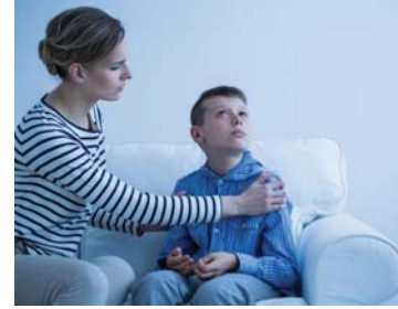
علاقة الطفل التوحد بوالديه مهمة في مرحلة العلاج