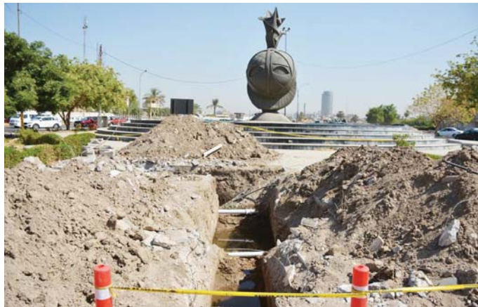
● ثلاثة أنفاق للسيارات ومجرسان ضمن مشروع توسعة ساحة التسور وسط بغداد