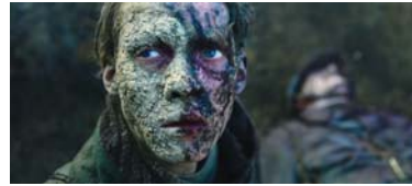
● تغطية مرصية عن أسس الحروب في كل شيء هادئ في الجبهة الغربية

قائمة حكمة مسكون لهم؟ أصيب أحد رفاق بيومر، وقبل أن يتطوعوا سافه، طعن رفيقه بالسفوكة حتى الموت، تلك السفوكة التي كانت رمزاً للعدنية على موائد الطعام. بعضي القليل من إشارة إلى رمز، مؤكداً على عبثية الحرب، فكان ذلك الجندي الذي لعب دور الأب ليومر، استطاع أن يهرب من كل فخاخ الحرب، لكنه لقي حتفه بعدما أطلق طفل فرنسي النار عليه، لأنه سرق البيض من مزعتهم، وبينما كان يختصر سراً بيومر عن الكلمة التي تتوافق مع كلمة عبثية، فأجابته بيومر بأنها رصاصة. كان كات بولفد أغنية ويبحث عن قافية مناسبة.