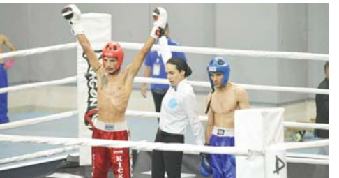
● 22 وسماً حميلة منتخب الكيك بوكسينغ

توج منتخبنا الوطني للكيك بوكسينغ بلقب البطولة العربية بتسببها 14، التي ضمنتها قاعة كلية التربية البدنية وعلوم الرياضة في محافظة السليمانية. عقب حصوله على أكبر عدد من الأوسمة الذهبية وقال الناطق الإعلامي لاتحاد اللعبة أحمد رحيم نعمة لـ ( الصباح الرياضي ) : إن المسابقة أقيمت على مدار 4 أيام في السليمانية بمشاركة 8 منتخبات عربية وهي المغرب والأردن وسوريا والجزائر ومصر وفلسطين واليمن المثيرة عن العراق، مضيفاً أن المسابقة تميزت بالمناصاة المثيرة من بلوغ الأوزار النهائية، وتيل المباريات الملونة، وأشار إلى أن النتائج أسفرت عن فوز فريقنا بالمركز الأول في المجموع العام، بعد حصوله على 22 وسماً ذهبياً، توجت على 3 أئمة، وحل الأردن ثانياً، في