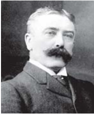
● فرديناد دي سوسير