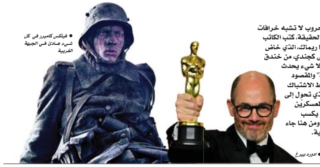
● فيليكس كامبر في كل شبه هادئ في الجبهة الغربية

رغم ما حسن حظ عشاق السينما أن كستان احتج يوماً إلى غاية طابعية في مكتبه، فتقدمت إلى الوظيفة الشاعرة فرورغ خرداد، وحقق كل ما قديه من شعر هو جيد لك، لكن عمالك هنا هو الكتابة على الطابع، انتمى عكس زودي على التنقيب، ولأنها عبودية انتمرت في العمل السينمائي، مثله ومخرجه كاكايه سيانور، ويعدو إن شخصية كستان الرسوم والمبدع أثرت وفجرت منابع الإبداع في هذه السروح التواقة إلى الحرية والسلام، لتكتشف أن قصة حب مثلهه نسبت بين حدين المقيرين، وطلت سريرة حتى نشرتها مذكراتها، حيث تقول في إحدى قصصنا هنا: أنا عاشقة كل ما يحمل اسمك، ورغم غضبي امتص دم حفاظك الحارفة.