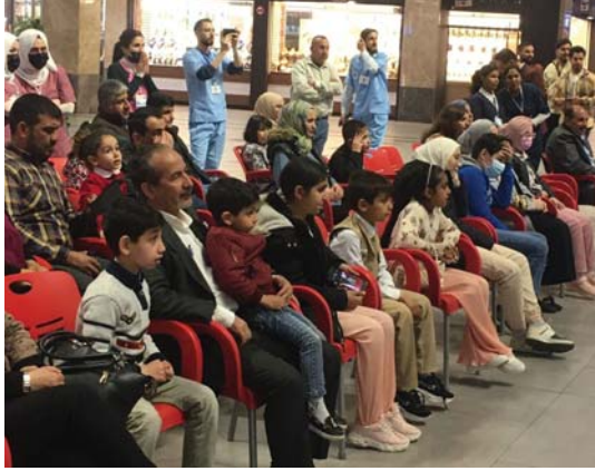
إقامة أنشطة ثقافية لدعم أطفال التوحد

يعيش أغلب أطفال التوحد وذويهم في حالة من الضياع في ظل غياب مراكز ومعاهد علاج وتأهيل أطفال التوحد الحكومية، خاصة أصحاب الدخل المحدود والطبقات الاجتماعية الفقيرة، إذا علمنا أن التكاليف المطلوبة في المعاهد الأهلية لا تقل عن 200 ألف دينار شهريا.