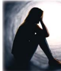
• أحد يبعس للتهووس بواقع الطبّ النفسي

الكيميائي. وتضيف انفتحت اموالا طائلة على ابني بسبب اعتقادات اجتماعية وتدخلات الآخرين الذين اومئوتوا بأن ابني يعاني من تلبس جنين ولكن الامر لم يكن كذلك وفي لحظة صحو واردة فوية قشرت اللجوء للطب وسأرت به إلى أماكن عدة إلى أن صارت صعبة ابني على افضل ما يكون وقالت على الحكومة إدارة صفحات الذين يروجون للشعوذة ضمن الآمات غير اللائق وهذا يتلطف وفقه وقبضة من حديد كي لا يقع المواطن ضحية لهؤلاء.