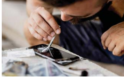
● سرور العلي

واسع، لاسيما أن هناك الكثير من المثقفين، هم تجار لها بخاصة من دول الجوار يتقنونها إلى البلاد، ولا تنكر أن هناك حتى طلبة مدارس وجامعات مجتدين، اتزدها وشهرها بين زملائهم، وهي كثيرة واستخداماتها متنوعة، والشباب هم أكثر فئة مستهدفة، وسبب فقدان العقل والتشاط والحوية والخمول، ويرغم من أن هناك مديريات لمكافحة المخدرات في عموم العراق، وهم يقومون بجهود كبيرة، ولكن تصارة المخدرات وإدخالها عن طريق مسلمين ومثقفين، وبذلك فهي غير قادرة على الوقوف أمام هذا النشاط وردعه بشكل نهائي، وكما نعلم أن تلك التجارة مربحة جدا في العراق، وتأثيراتها كبيرة وسلبية.