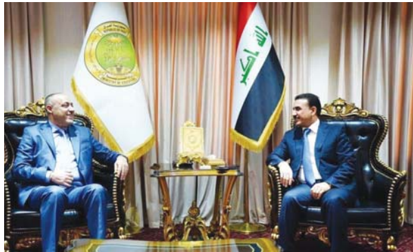
وزير التربية يستقبل رئيس شبكة الإعلام العراقي في مكتبه أمس الأحد

التقى رئيس شبكة الإعلام العراقي الدكتور نبيل جاسم، ووزير التربية إبراهيم ناسم الجبوري، أمس الأحد، وبحث أهمية توظيف الإعلام لهدف القطاع التربوي. وقالت وزارة التربية في بيان أطلعت عليه "الصباح"، إن رئيس شبكة الإعلام العراقي الدكتور نبيل جاسم التقى وزير التربية إبراهيم ناسم الجبوري في مقر الوزارة، مؤمناً بأن الطرفين تداولوا طرق استثمار الأفكار الإعلامية وتوظيفها بتوظيف الإعلام لهدف القطاع التربوي بكل جديد لكونه الأداة الرئيسية لترسيخ الثقافة والقيم التربوية عبر الدروس التعليمية ودعم التلفزيون التربوي. ولفت البيان إلى أنه تم الاتفاق على توظيف وتوثيق الحقائق ونقلها إلى المتلقي بكل شفافية ومن جهة وصف وزير التربية الإعلام العراقي بالمرآة الماسكة للحقيقة الناصية ومفتاح إيصال الرسالة التربوية بمعانيها السامية.