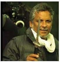
● مخرج الفيلم سويديتو سين

وتزامن صدور فيلم "حكاية كيرلا" في آيار مع الانتخابات في ولاية كارناتاكا الجنوبية، التي سخر لها حزب مودي بهاراتيا جاناتا (حزب الشعب) كل إمكانياته، وأدت إلى اندلاع اشتباكات بالحجارة في ولاية ماهاراشترا الجسورة أسفرت عن سقوط قتيل، ودعم مودي الفيلم خلال تجنّب انتخابي، منها حزب المؤتمر المعارض بتأييد التوجهات الإلهامية، ويرى البعض أن الفيلم قبيل الكلفة يستند إلى نظريات الحب والجهاد، التي تهّم رجالاً مسلمين بالعمى لعبد الهندوسيات، وترجع مساندة الفيلم عن مزاعم باطلة صدرت عنهم سابقا تفيد بأن تنظيم الدولة الإسلامية جسد 32 ألف امرأة هندوسية ومسيحية من كيرلا ذات التنوع الديني، ونظم أعضاء حزب مودي مروضاً مجانيته للفيلم، الذي قال