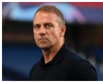
● انتهاء حقبة فليك مع المانشافت