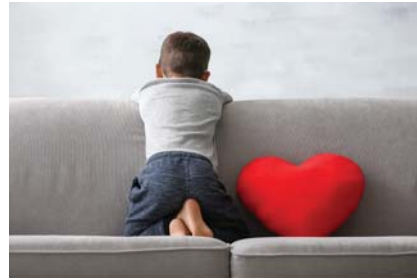
لا يوجد اهتمام حقيقي من قبل الجهات المعنية في العراق