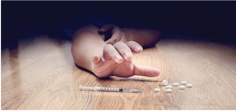
● طريق الضياع