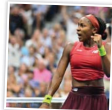
● غوف في المركز الثالث في التصفيات العالمي

التبوء بلندنية مطلع العام الحالي) إلى المركز الثالث في التصفيات العالمي لرابطة اللاعبين المحترفات الذي سيصدر اليوم الاثنين خلف سابالينكا التي ستفتتح الصدارة من البولندية إينا شفيوتيتك بطلة فلاشينغ ميدوز العام الماضي. وستصعد غوف أيضاً إلى صدارة التصفيات العالمي للزوجي، إلى جانب شريكها ومقاتلتها جيسيل بيجولا بعدما بلغتا ربع نهائي فلاشينغ ميدوز.