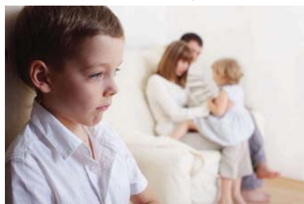
مشاركة الآباء في اللعب تساعد "طفل التوحد" على التعلم

تعيب الأسرة دورا رئيسيا في تربية وتعليم الأطفال المصابين باضطراب طيف التوحد، مما يعرضهم للعديد من المعوقات والصعوبات، لذلك وجهت المختصة في علم النفس التربوي في الجامعة المستنصرية الدكتورة إيمان بونس إبراهيم، وجهة نظرها إلى دراسة المطالب الاجتماعية للأسر، التي لديها أطفال مصابون باضطراب طيف التوحد، وكان الهدف أولا حدد هذه الأسئلة والتزم بها، ثم قدم معلومات إلى المسؤولين عن تعليم الأطفال المصابين بالتوحد، لإرشادهم في تقديم الدعم المناسب للأسر، حتى يتمكنوا من التقدم في التربية والتعليم، تعليم الأطفال وتزويدهم في نهاية المطاف بالاستقلال المناسب، على الرغم من عدم وجود أرقام دقيقة لأعداد المصابين بالتوحد في العراق، إلا أن انتشار معاهد الرعاية والتأهيل الخاصة بالتوحد