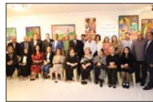
قاعة كاليبري الصابونجي للفنون والثقافة. مثلما نقت فراءه بعض أشعار العراقي على أنغام (عزاز عدنا).