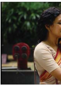
● مشهد من الفيلم

بعد فيلم سين واحد من بين عدة أفلام بدأت تعتمد على الأسلوب التقليدي المتبع في بوليوود والفيلم على الرقص والغناء، إذ ركزت مجموعة أفلام صدرت مؤخرا على الجيش،