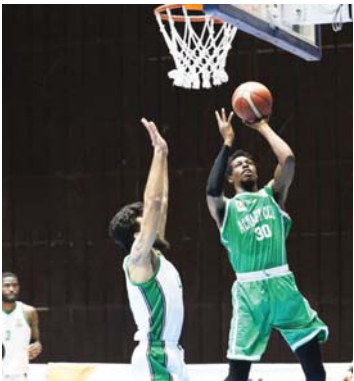
● 11 فريقاً في دوري السلة للقب

وختم عبد الستار حديثه بالإشارة إلى أن باكورة نشاط الاتحاد ستجري قبل مباراة كأس المنارة يوم الجمعة المقبل في قاعة الشعب المغلقة، التي تجمع بطال الدوري المنقطع مع زاخو بدلاً من الوصيف للشرطة الذي يفقد اعتزاده عن حوض هذا القاء.