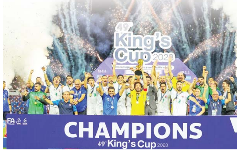
● أول منتخب عربي يحرز لقب كأس ملك تايلاند