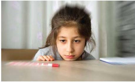
إجحاف بحق هذه الفئة من الأطفال