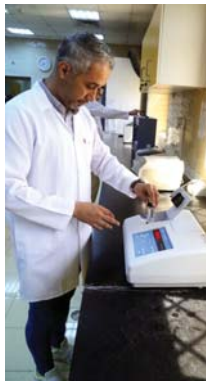
يُحقق الشروط وفق المواصفات العالمية لجياه الشرب