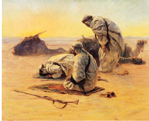
• لوحة لعمامة لشبان في مدينة بيتان