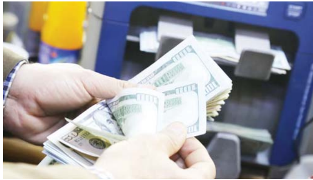
● معلومات مشللة يروجها مفرضون تتسبب بارتفاع سعر صرف الدولار

فيه، ومع وجود مصدر واحد فقط لعرض الدولار هو البنك المركزي (ناقد بيع العملة) ومن خلال وسائل وأساليب المصارف التجارية التي تعمل تلك المبادلات خصوصاً التجارة الخارجية؛ مقابل محدودة هذا العرض، فإن المشكلة تبقى قائمة بشكل جوة حقيقية بين طلب المعاملات الدولية للتزايد، ومحدودية العرض، وأشار إلى أنه هنا تكمن خطورة تخفيض سعر الصرف من قبل البنك المركزي فقدان جداره ما لم يتم تفتيش وسائل تمويل التجارة وتقليل حجم المبادلات الدولية المحلية.