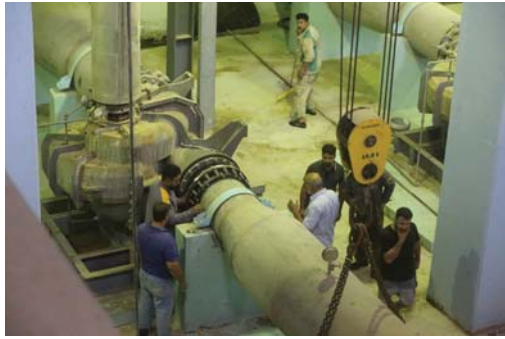
مشروع ماء الرصافة - الأكبر في الشرق الأوسط