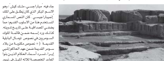
• آثار مدينة كيش القديمة خلال التنقيبات أوائل القرن الماضي

التاريخ الأسطوري إلى التاريخ الفعلي؛ طالما أنه كان أقدم حاكم من قائمة الملوك جرى إثبات اسمه مباشرة في علم الآثار. توجد في المتحف العراقي نسخة من قفلة من مزهرية مصنوعة من اللاباستر (= الحجر المرصق) تعود إلى عصر السلالات المبكرة (حوالي سنوات 2800-2900 ق.م)، تحمل نقشا