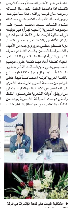
احتفالية أقيمت على قاعة التومرات في المركز الاكاديمي الاجتماعي

وأوضح الشاعر لـ الصباح، سبب تسميته الديوان "أخيله نهراً"، فأقال كان بيتي في الموصل قريباً من نهر دجلة الذي يقسم المدينة إلى جانبين أيمن وأيسر، وكنت أجلس على إحدى ضفتيه أكتب الشعر وبعد التهجير القسري عشيت بمدن عديدة في تركيا ولم يكن فيها نهر، فكثرت أشعاري وأنا أخيل أممي نهر دجلة كما في السابق، وشعر رائد عزيز عن زاية في الإبداع والجمال الطبيعي لدى الشاعر فقد يكسب واحد؛ لذلك فمن الأفضل قراءة المجموعة بفواصل زمئية حتى يتم استيعاب النص وضمه واستكشاف جماليات الترتيب عندها ومآنها وزمانيها والدلالات الناتجة عنها مع ما يفنك بنص آخر بمرامة اللغة وسلطانها وتجاوزها للصور الشعرية إلى المباشرة الغلوية وهي من أصعب أساليب الشعر، كما أن القارئ يستشعر الوجود الشديد في شعره كبرياء الشاعر ومصدافيته يجمالن المثقفي يسترخي وهو يتناول فاكهة آياته لأن في المجموعة جبل الشاعر يبدي زاية في حقبة زمئية تارة مرت بها الشعوب فقصبة الموصل والظلام والظلمين حديث بيداً ولا ينهني.