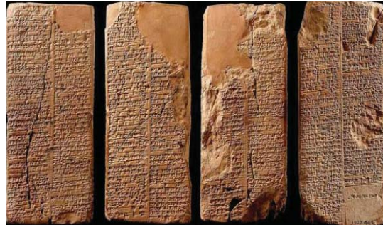
• موشور ويلد بولندي، لوح يراعي من مطين منقوش عليه بالخط السماري (متحف أشموليان - أوكسفورد)