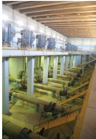
• عد الأنابيب إلى المناطق الزراعية