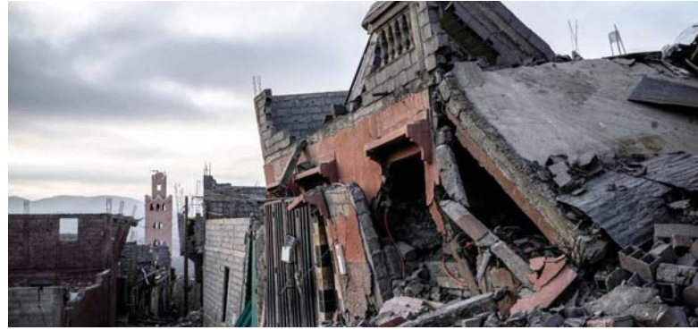
● زلزال المغرب تشييبه إلى ضرورة تشكيل خلية أزمة لمواجهة المخاطر