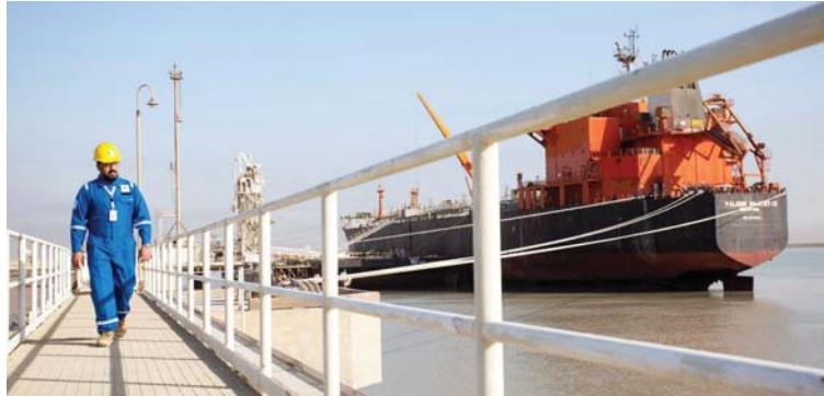
ارتفاع أسعار النفط عالمياً نقطة تحول إيجابية في الموازنة العامة

وضعت وزارة النفط، خططاً مستقبلية تهدف إلى زيادة وإدامة الانتاج، تتمثل في البحث عن المزيد من الرقع الاستكشافية الجديدة، مبيئة أن السوق النفطية واعدة، وأن العراق يتعامل بحكمة مع متطلبات السوق العالمية، مشيرة في الوقت ذاته إلى إعطاء الحكومة الأولوية القصوى لاستثمار الغاز، سواء المصاحب أو الحر، وأن الجولات التي أطلقتها العراق مؤخراً تهدف إلى تعظيم الانتاج الوطني من الغاز، وتحويل الرقع والمواقع الاستكشافية إلى حقول منتجة.