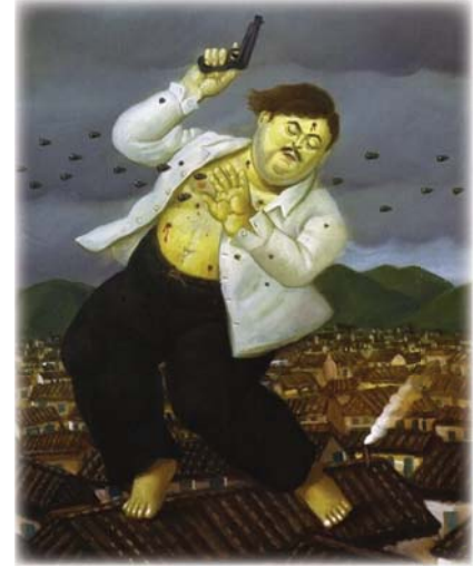
● مقتل بابلو إسكوبار

ليست هناك حاجة لتشرح تكميلني من قبل طرف ثالث للمساعدة في فك رموز العمل أو الإجاب به أو تقديره أو الاستماع به، كما يحدث غالباً في الفن المعاصر. تخليه عن الطرف الثالث مكّنه من التعبير عن قضايا عامة سياسية أغلب الأحيان كما في سلسلة أعماله التي سماها أبو غريب وهي كما ينبتنا الاسم عن الطغاة التي ارتكبت على يد الأميركيان في المعتقل الشهير بغيغاد، أو قضايا بابلو إسكوبار، أو حين فجر الإرهابيون مغنونة له في مدينته التي قام بنصب عمل نحتي آخر حمامة السلام مع إيقاع ناقض المنحوتة المدسّرة على حالتها تذكيراً بأن الحياة تنصّر أخيراً. أثر بوتيرو في كثيرين وأهم كثيرين، لكن تأثيره الأكبر هو في نجاح رهانه الممثل بقدره الفن هو أن يكون رفاقاً لنفسه ونقضياً عصره من دون تدخل طرف ثالث.