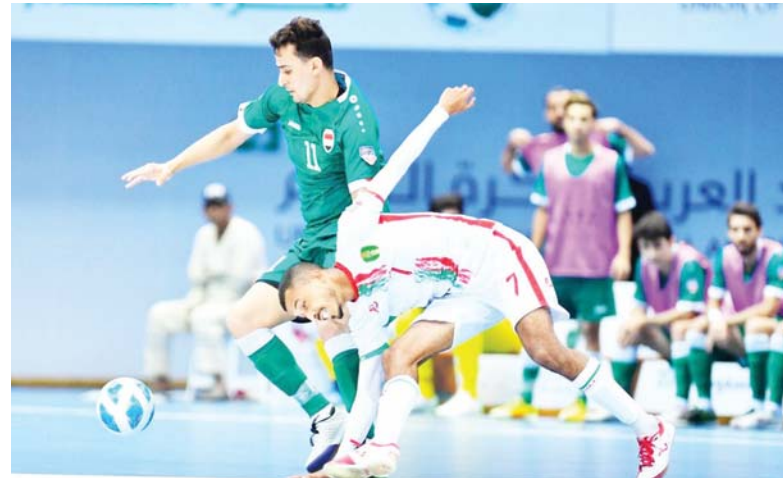
● الصالات يفتن معسكره التدريبي بملاقاة لبنان

المشاركة في التصفيات إلى فئتي مجموعات من خلال القرعة كل مجموعة تضم أربعة فرق باستثناء المجموعة الثامنة التي تتألف فقط من ثلاثة منتخبات. مؤكداً أن مباريات كل مجموعة تقام بنظام الدورى الجزأ من مرحلة واحدة، وتواجه المنتخبات الثمانية المتصدرة وأفضل سبعة تحت الوصافة إلى نهائيات كأس آسيا لكرة الصالات لعام 2024.