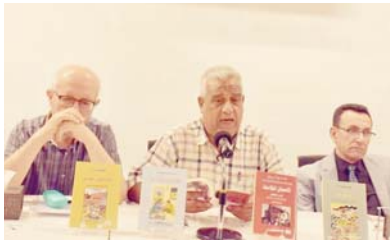
الجلسة تناولت التجربة السردية للحضنى به في ادب الاطفال

وسكارا جدي، وهديا جدي) في محاولة منه إلى رسم هوية جديدة في مجال الكتابة السردية، تصاف إلى هويته المجددة، الكتابة السردية في قصة القصيرة، والنص القصيرة جداً، وهي الرواية، والرواية القصيرة، ولعل أهم بصمة تحاول أن تتركها الذات المبدعة هنا هي خلق عالم الفتيان في جرحها إلى عالم السيرة ببقية السردية، والذاتي، وهذا عمل تجريدي مهم تحته الذات لتكون هويتها في هذا المجال.