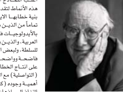
• داريو فو