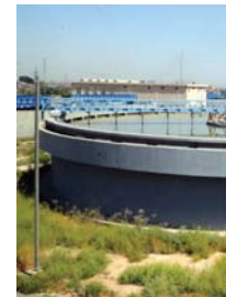
• محطات ساندة