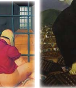
● أبو غريب