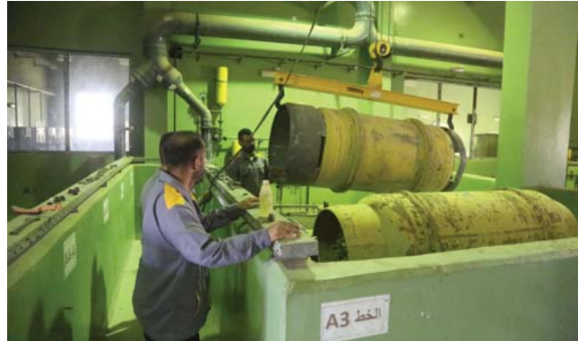
ماء صالح للشرب

• عامر جليل إبراهيم • تصوير: نهاد العزاوي