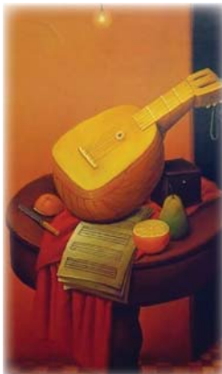
● حياة صامتة مع ماندولين

أعمال الفنانين الخالدين الذين أثروا فيه عميقاً ديلاكروا، غويا ورافنتشي وهو انشغال سيخذه النقّاد لاحقاً موضوعاً لتوجيه انتقادات إليه تتعلّق بـ تهمة التمعّز على هذه الأسماء المكرّسة واتخاذها رافعة للاسمه وأعماله، وبخاصة بعد أن عمد بوتيرو إلى إعادة رسم أوبد فنتية كيري بطريقته الخاصة، كما فعل بلوحة داقتشي الأشهر الموناليزا. قبل ذلك كان يرسم متأثراً بشكل واضح بيكاسو وخوان كريس ويبيع لوحاته أمام أبواب المتاحف ليعيش، لكن الانتعاش الحقيقية التي جعلت بوتيرو يمتلك هويته الفنية الفريدة، ربما تكون قد أتت إليه مصادفة كما يقول في إحدى حواراته حين رسم لوحته طبيعة صامتة مع ماندولين وجمل نسب ألة الماندولين غريبة وفتحة الصوت فيها صغيرة جداً، وحين أنهى لوحته أدرك أنه يمتلك المفتاح الذي سيدخله إلى بيته الخاص بعد أن سكن طويلاً في بيوت الآخرين. أسلوب الـ Bolterismo الذي سببته بطريقة