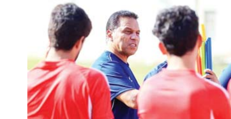
● اختيار خارجي أول للبرع مع الزوراء

● يلقب كأس المثابرة التي جرت أول أمس في قاعة الشعب المغلقة، بعد فوزه على زاخوتيتية 78 / 71 نقطة، وشهدت المباراة التي حضرها جمهور جيد ومستشار رئيس الزوراء لشؤون السليوي الجديد.