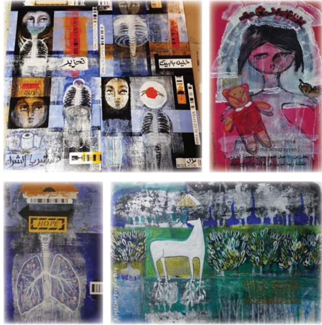
• من أعمال الفنانة