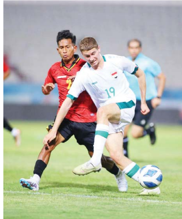
● الألبيني سيشهد تواجد عدد أكبر من محترفي الخارج

الأهم عدم إطلاق الأحكام المتسرعة من قبل المهتم المتفرجين الجدد بانهم لا يصلحون، وبت الأساس في صفوف اللاعبين، والاستسلام مبكراً بالقول إنّ الفريق عاجز عن اللحاق بالآخرين، كرة القدم تقاس بالخواتيم وليست البدايات بما يجعله كل فريق من نقاط، ثم يظهر السواد الأعظم من اللاعبين بالصورة المنتفزة منهم نعم، كراتنا تضيي كلاسيفيكا الهوي نحو السماء دون تركيز نعم، روحنا تنوسع أن ترتفع ونعرف قيمة تواجدنا وأهمية نجاحنا في البطولتين الآسيويتين، ابذروا العمل مجدداً وأصمموا على الفوز كي نحظى بالثقة والمسؤولية للوصول إلى النقاط الكاملة وهو أمر ليس سهواً مع الأسماء الأنسب، الأداء الأفضل والشاملة التناول بين الجميع بأن المستحيل لن يكون عربياً.