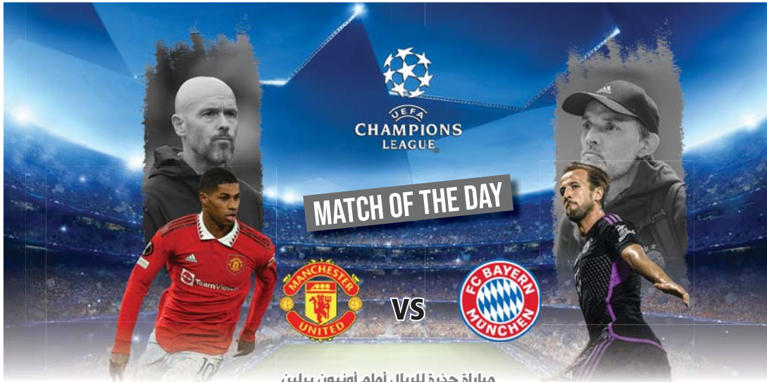
مباراة حذرة للريال أمام أونيون برلين