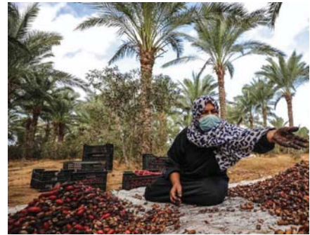
• زيادة صادرات العراق من التمور تحقق مردوداً اقتصادياً كبيراً للبلد

وأكدت الوزارة استمرارها بمنح إجازات إنشاء بساتين النخيل شرط استخدام أساليب الري الحديثة لتقليل الضائعات ومعد المياه الفلاحين بالعمل وفق أساليب الري الحديثة وتقليل من الضائعات المائية، في ظل قلة المياه ويبدو أن الهدف المثل للوزارة