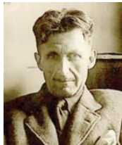
• جورج أرويل