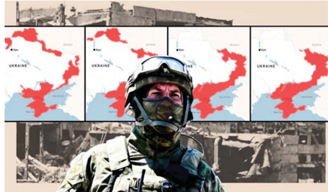
• ميدانين الصراع في خلية جندي اوكراني

بعد كل هذا تبقى أسود كبيرة سببها بناء جيش مجمع جرت لملته من المخزونات الاحتياطية الموجودة في أنحاء متفرقة من العالم. المركبات المدرعة التي تتعرض للتدمير أو التضرر في الجبهة ليس من السهل إصلاحها بسبب المدى الواسع من المواد والصيانة والتدريبات اللازمة لإدامة كل قطعة من تلك المعدات الثقيلة، فمن مدافع هاوتزر عيار 155 ملم وحدها