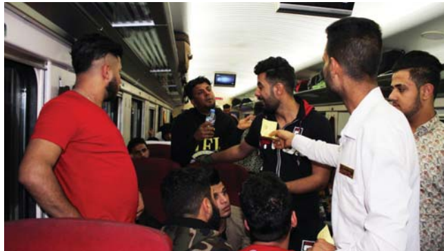
● السفر بالقطارات.. أجور زهيدة وسرعة وأمان