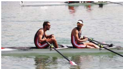
● التجديف أول الواصلين إلى الصين

بجميع المرافق الخدمية والصحية ، موضحاً أنّ وفد التجديف كان أول الواصلين إذ من المقرر انطلاق فعاليات هذه اللعبة بعد يومين وقد شرع اللاعبون بإجراء تمريناتهم اليومية استعداداً للانطلاق التنافسي الرسمية . وأضاف من المؤمل وصول بقية المنتخبات المشاركة تبعاً خلال الأيام المقبلة وهي القوس والسهم واللاكمة والمبارزة والجمبوت والجوجيتسو والكراش والخماسي العديت ورفع الأثقال ، لافتاً إلى أنّ الصين استعدت جيداً لاستضافة الحدث الرياضي الأكبر قارباً التمثل بدورة الألعاب الآسيوية في نسختها التاسعة عشر وقد جرت كافة المرافق والمنشآت إلى جانب تهيئة جميع الأمور الفنية والإدارية للمنتخبات العراقية المشاركة حيث تشير النوايح إلى ضرورة وصول الفرق قبل ثلاثة أيام من انطلاق المسابقات والمغادرة بعد يوم من نهاية التنافس .