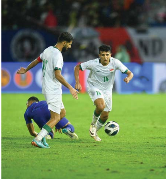
● البطولة الآسيوية أول اختبار جدي للاعبين كاساس مع منتخبنا

تباينت الآراء بشأن مجموعة منتخبنا الوطني لكرة القدم في نهائيات أمم آسيا التي ضمته إلى جانب صاحب الألقاب الأربعة اليابان وفيتنام وإندونيسيا، إذ ذهب قسم من المحللين والنشئين باتجاه صعوبة تلك المجموعة، أما القسم الآخر فأكد أن المجموعة في المتناول، وهناك مجموعة أخرى ترى أن المجموعة متوازنة وتتطلب تعاملًا خاصًا لضمان خطف بطاقة العبور للأدوار اللاحقة.