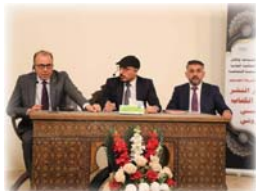
جانب من المؤتمر

عقدت دار الشؤون الثقافية مؤتمر تحديث دور النشر ومستقبل الكتاب الورقي والإلكتروني.