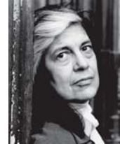
• سوزان سوتنغ