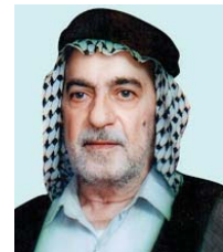
• الروداد (وفاق التجيسي)

ما سألتوا به في هذه المقالة التي حاولت أن أنقصها ما بوسعني، هو استكمال ما نشرته سابقا حول تأثير المرثية المنبرية المشهورة -أو الحسية، سنها ما شئت- بما كان سائدا من الأغان غنائية، عراقية أو عربية. كما عايشتها في منتصف الستينيات ولغاية منع كل أثر لها في نهاية السبعينيات من القرن الفاتح، ذلك ما أفادني به المخضرم من شهداء عهد أساتذة الملاحم التراثية، رواديد وخطباء أو شعراء منبر، منهم من لا يزال تواصلني معه مستمرا في البحث والتقصي عن هذه المعلومة أو تلك، مما يستحق تدوينه، فضلا عن استنادتي أكاديميًا- من الجيل اللاحق الذي يتطلع لمعرفة ما هو غير مدون عن الحقبة أيامها، إضافة لما غمّس من ذلك الإرث-تمسقا- فقد عرف الكثير من مجاهلي تلك الحقبة عن نوبتها، كسلار ربما أو ذرة لدرود الأفعال التي صار كليل التهم كلفسا اتفق لهذا السبب أو ذاك، غاية في السهولة أزاهما.