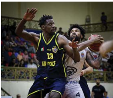
● الإشارة حاضرة في انطلاق دوري السلة

بجائزة رجل المباراة مسجلاً 20 نقطة و8 متابعات. وفي دوري الناشئين تغلب الحلة على الدفاع الجوي 45/25 نقطة. كما فاز الكرخ على الشرطة 78/31.