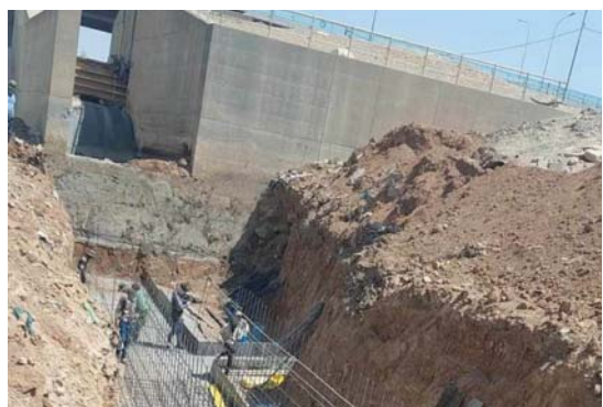
• تحسين البنية العمرانية والجمالية في مركز كركوك