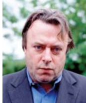
• كريستوفر هيشنيز

لكن ما نجحت فيه سوتنغ هو خلق سوسولوجيا المرض، وعلى طريقة التطليل ما بعد العادي، فإن تركيزها على النصوص يفرض النظر الفكرة للمرض باعتبارها بساطة الويلية التي يختار بها بعض الأشخاص التعبير عن أنفسهم. إنه نهج مضمّن، ويكشف المعنى السوي في المعالجة الأدبية للألم جسدية أخرى، ألا وهي المجاعة. فالجوع، مثل المرض، هو حدث بيولوجي، على عكس المرض، فهو دائمًا عذاب عظيم، لكن استعارة الضالّون من عذاب الابداعي يكشف أن الجوع، مثل المرض، يستدعي استعارات تحوّل من عذاب جسدي إلى تعبير جسدي عن فكرة متماثلة. وكما يلقى بعصر الأصولية الحديثة،