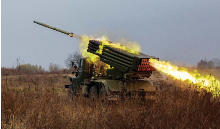
• صواريخ راجمة روسية تغير مسار الحرب

تستخدم أوكرانيا أربعة عشر نوعاً مختلفاً.