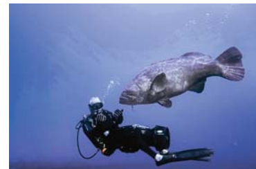
● تختبئ أسماك الهامور العملاقة

الوضع الذي وصلت إليه هذه الأسماك، وقال الدكتور جيمس لوكاسيو إن أسماك ههامور العملاقة التي يمكن أن يصل وزن الواحدة منها إلى 380 كيلوغراماً، لكنّ العلماء يتهمون إسن أن أعدادها تشهد انخفاضاً منذ بضع سنوات، إذ أعادت السلطات في الأونة الأخيرة السماح بصيدها. وقال الدكتور جيمس لوكاسيو من مختبر موني ماريين لايبورتوري البحري من غير الممكن في أي مكان آخر سمكة على تجربة (غوص) إلى جانب سمكة بهذا الحجم وهذا الغريب . وخلال رحلة بحرية قبالة شاطئ بوينتون في فلوريدا في مطلع أيلول، اندهش الغواصون بهذه الأسماك العملاقة التي يمكن أن يصل طولها إلى 2.4 متر ولأنّ زواياهم هذه السمكة التي يمكن أن تعيش أكثر من 30 عاماً مشدودة إلى الأسفل، يخيل للناظر إليها أنها متجمدة، ولكن في إمكان الغواصين أن يلمسوها بأيديهم وقال الغواصين غاليهو لقد دهشنا من كمية أسماك الهامور في المنطقة وأضاف: لكن من حديثي مع السكان، علمت أنّ أعدادها انخفضت في الواقع مقارنة بالسنوات الأخرى. وبالمثل، نشرت أخباراً دراسة حذرت من أن تنخفض أعدادها.