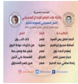
جائزة علاء الجابري