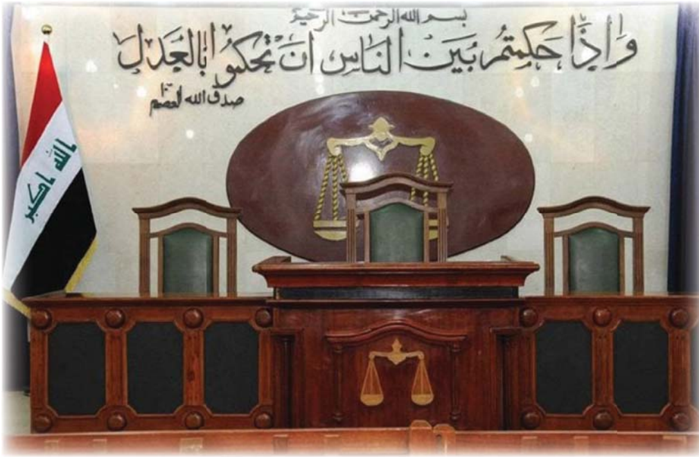
● دور القاضي هو الفصل في المنازعات سواء بالحكم على القانون بالصحة أو الحكم بالقانون لتسوية باقي المنازعات