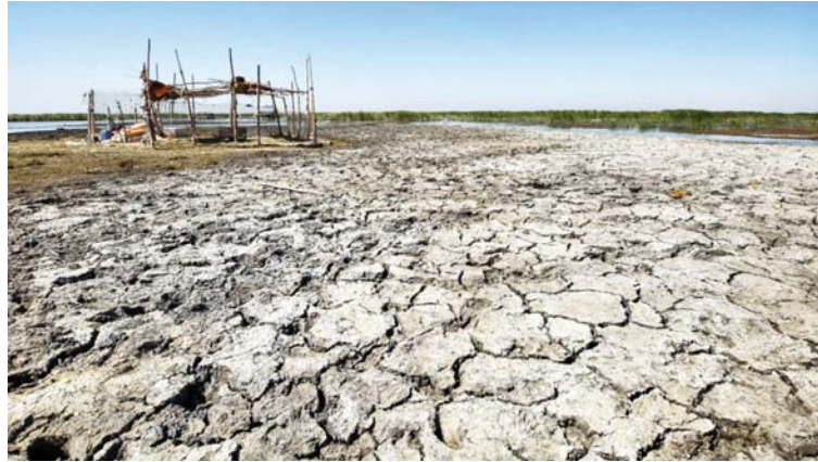
العراق يخسر قرابة 400 ألف دونم من الأراضي المستصلحة سنوياً بسبب التغيرات المناخية

تسبب لآفة حجم المخاوف الناجمة عن التغيرات المناخية على القطاع الزراعي، الذي فقد مساحات واسعة جراء آثار تلك التغيرات التي باتت تهدد مجمل نواحي الحياة في البلاد، وتتشدد بمزيد من الخسائر الاقتصادية الناجمة عن تلوث المياه والتربة واتساع المساحات الصحراوية الراحضة بشكل سريع صوب المدن، الأمر الذي دعا العديد من المختصين في الشأن الاقتصادي والبيئي، إلى المطالبة بضرورة إقرار قوانين يمكن أن تحد من آثار التغيرات المناخية، وتخصيص "موازنة بيئية" لتنفيذ مشاريع قادرة على الحد من تلك الآثار.