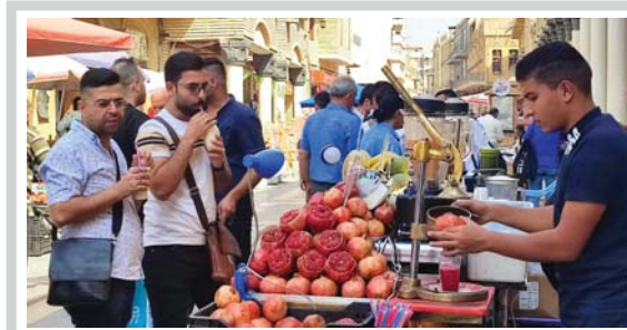
صورة وتعليق عصير الرمان لاطفاء ظمأ الصيف المغادر.