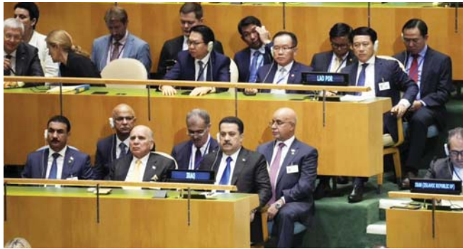
رئيس الوزراء خلال مشاركته في اجتماعات الجمعية العامة للأمم المتحدة بدورتها الثامنة والسبعين