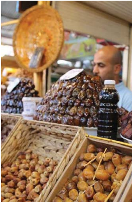
• الحفاظ على بعض الأصناف النادرة من التمور وزيادة غلتها