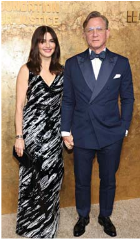
● الممثل البريطاني الأميركي دانييل كريج وزوجته المثلة البريطانية ليزلي وايز لذي حضورهما الحفل اقامته مؤسسة «كلوني» من أجل العدالة، التي أسسها النجم الأميركي جورج كلوني وزوجته العالمية البريطانية من أصل لبناني أمل علم الدين، لتكريم «صانعي التغيير» في العالم خلال الحفل السنوي الثالث للجوائز التي في مدينة نيويورك.