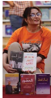
• تشجيع المشاركات النسائية في المعارض الكتابية والتعريفات الثقافية

التعبير طويلة الأمد. معرض بغداد بدوره الرابعة والعشرين الذي استضاف عدداً كبيراً من المثقفين والكتاب العرب تميز بحضور جماهيري كبير، وهو يجتمع بين الأوساط الثقافية وجماهير العامة.