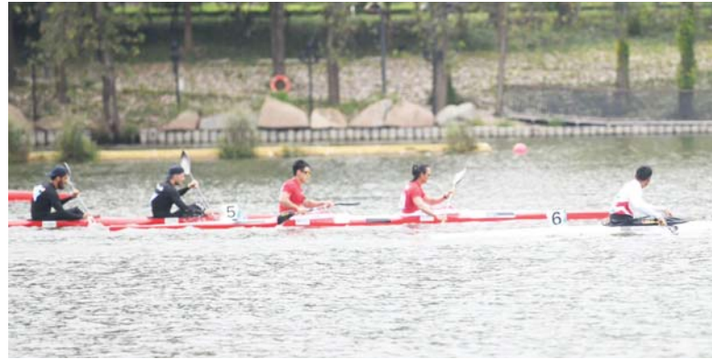
• نتائج جيدة لكاياك

في مركز هيانغينهو الرياضي وستجري منافسات فردي النساء في الساعة التاسعة صباحاً بينما تنطلق منافسات فردي الرجال في الساعة الثانية وعشرين دقيقة بعد الظهر.