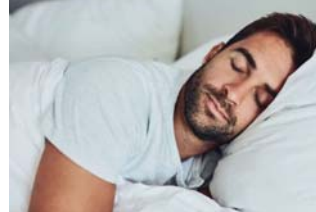
● يحتاج الإنسان إلى ثمان ساعات من النوم ليلا في المتوسط

ست إلى عشر ساعات ونصف الساعة بعد «نطاقا صعبا». لكن أولئك الذين يشعرون دوما بالتعب والانعزال والانفراع ويتحجون إلى الشهوريات السكرية التي تحتوي على الكافيين، ربما يحتاجون إلى مزيد من الوقت في السرير. ومع ذلك، فإن النوم في عطلة نهاية الأسبوع يمكن أن يكون له تأثير غير مباشر على ساعة جسمك البيولوجية إذا كان يمتدك من الخروج في الهواء الطلق في الصباح، كما يقول البروفيسور فوستر، ويوضح أن التعرض لضوء الصباح يساعد الجسم على الدخول في نعتل النوم والاستيقاظ مبكرا. كما يقترح فوستر، على أولئك الذين يعانون من الحرمان من النوم أن يخلدوا للنوم في وقت مبكر من المساء ويلتزموا بروتينهم كإفاح من أجل الأاء، في ذروة نشاطهم، خلال الأسبوع، ولكن تأكد من أنك ويحتاج الإنسان إلى ثمان ساعات من النوم ليلا في المتوسط، لكنه يقول أن من