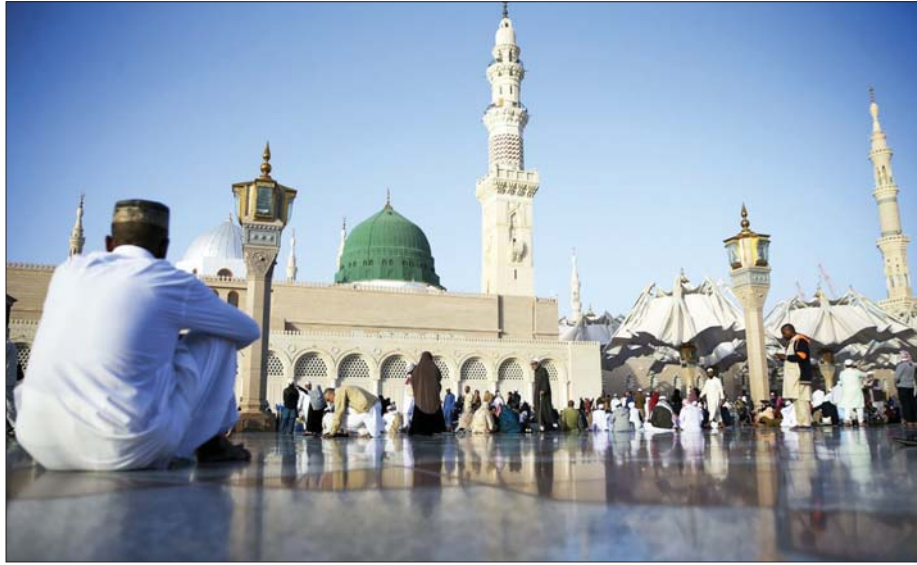
• قلوب المحبين تهفو إلى حضرة

هكذا كان منذ أول أوانه، رجلاً شامخاً علياً، ومضت عظمته مع أول ولادته، وشرقت به الحياة، وأضابت به مقادير الإنسان. ما عاش في بواكير سنه الأولى طفولات غيره، بل كان أبداً ينأى عن ملاهي الصبا. إنه ابن عبد الله، كبيراً وأبداً، وكبيراً عاش بين الكبار، لم تشب حياته ملاعب الأطفال. دار من حوله التاريخ وصار محوراً، وتحولت حياته إلى علم تترامم معارفه، وتنمو منهجياته، لكن ما بقي شخصاً يستعصي على النسيان ويعلو فوق المكان والزمان، هي مواقف الحب لشخصه الكريم، عاشتها خلة وسار على نهجها آخرون، وقد روى لنا التاريخ شيئاً من أنبيائها، وحيث في محكماته بعض أخبارها، مما ستقف على وميض من إيمانه.