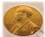
● جائزة نوبل

الرياضيات لماذا لا توجد جائزة نوبل في الرياضيات؟ في ثمانينيات القرن الماضي، دحض باحثون رواية جري تداولها طويلاً، وتفيد بأن ألفريد نوبل تعمد عدم تخصيص جائزة في هذه الفئة انتقاماً من عشيق عشيقته، عالم الرياضيات ماغنوس