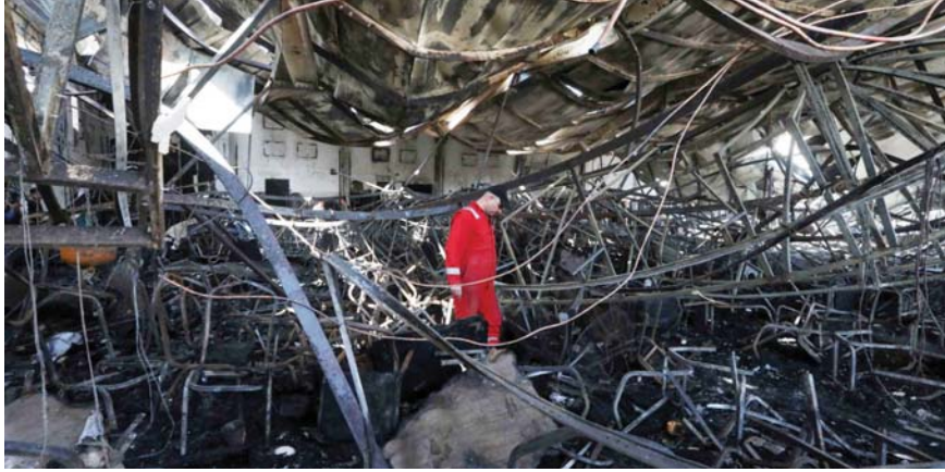
أ ف ب

أعدت تكتية «عرس العمدة» الأليمة إلى النازكة العراقية، مجموع تكتيات سابقة كان سببها الأساس الإهمال في توفير متطلبات السلامة والأمان في الأبنية بمختلف أنواعها، وبهذا الصدد حذر مختصون من فواجع مختبئة خلف 7000 مشروع مخالف لشروط السلامة المهنية في جميع محافظات العراق معاداً إقليم كردستان.