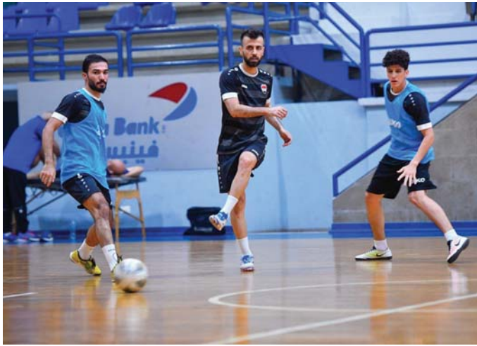
● محطة إعدادية جديدة لوطنى الصالات

يلتقي منتخبنا الوطني لكرة الصالات في الساعة الرابعة من عصر اليوم بتوقيت بغداد، نظيره القيرغستاني في المباراة التجريبية الأولى، على هامش معسكر التحضيرى الخارجى استعداداً للمشاركة في التصفيات الآسيوية المقرر أن تحتضنها مدينة فرغانة الأوزبكية في السابع وتغاية الحادي عشر من شهر تشرين الأول الحالى.