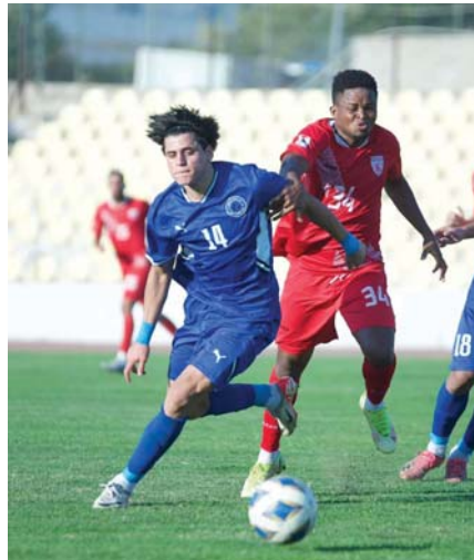
● تحضيرات مكثفة للأثيق