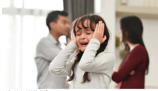
● فتوة الطلاق يدفع ثمنها الأبناء

أرقام مهولة عن أعداد ونسب الطلاق في المجتمع العراقي إذ وصلت حسب الاحصائيات الأخيرة إلى سبعة آلاف حالة طلاق خلال الأشهر الأخيرة. هذا ما حدا إلى معرفة ماتمضي هذه الحالات في حياة الأطفال ومستقبلهم.