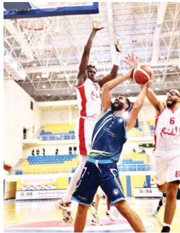
• اختيار مهم لدجلة الجامعة عريبيا

الفتح السعودي، وتحتهم مباريات اليوم بقاء يجمع خدمات البرج الفلسطيني مع فطر القطري في العرافة أربنا