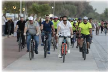
● حملة نداء الأرض في بغداد والمحافظات

والجامعات توجيه الطلبة الى جلب شتلة واحدة، تتصافح مع مبادرة رئيس الوزراء محمد شياع السوداني، بخمسة ملايين شجرة، ولت «سنتطلق عليها إزرع شجرة باسم من تحب».