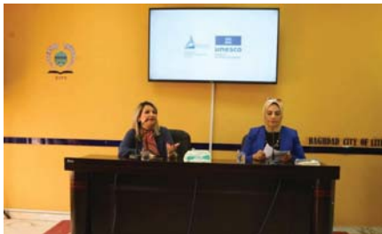
• الصراف تتحدث عن روايتها

وأشارت إلى أنها تنتمي إلى جيل يحب القراءة وهي من المحظوظين في ذلك خصوصاً أن جدما كان يمتلك مكتبة عريقة في منزله. وهي معرض حديثها عن الأحداث والتواريخ فهي معرفة بأنها تذكر الأحداث مع توارخها مثل الحرب العراقية الإيرانية وما نتج من أحداث إنسانية مأساوية وكأثرية من ناحية انعدام الاستقرار الامني والفنسي في تلك الفترة من تاريخ العراق، وقد استغرقت كتابة الرواية 14 عاماً قبل أن تبصر النور.