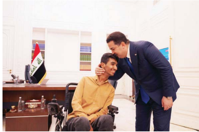
● رئيس الوزراء يكرم الطلبة الأوائل والمتفوقين من خريجي الدراسة الإعدادية للعام الدراسي 2022-2023

خريجي الدراسة الإعدادية للعام الدراسي 2022-2023، وأعرب السوداني، في حديث إلى الطلبة، عن تقديره العالي وتثمينه لمخزهم الدراسي، وتقديرهم، وأصفاً ما قدموه من إنجاز بأنه نتاج صبر ورفق من الطلبة وعوائلهم وصولاً إلى حصاد النتائج المشرفة. وعبر عن تقديره للأساتذة والهيئات التدريسية والأمهات والأباء، الذين أسهموا بشكل مباشر في بناء المدارس نحو برنامج صندوق العراق للتنمية، بمشاركة القطاع الخاص، من أجل تجاوز الأليات المعقدة والبطيئة المتبعة سابقاً، موجهاً مديري التربية في بغداد والمحافظات بضرورة الإسراع في إعداد الخطط وأولويات مشاريع مديرياتهم وتقديمها إلى المحافظين، إلى ذلك، كرم رئيس الوزراء، الطلبة الأوائل والمتفوقين من