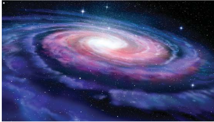
• استنتاجات جريئة بعض الشيء

كذلك، يمكن تمييز الفرق بين مجرة درب التبانة والمجرات الحلزونية الأخرى من خلال طريقة الحركة، التي تعتمد على النجوم في الأروى، وعلى السحب الغازية في الثانية. في غضون ذلك، ترى فرنسواز كومب أن مجرة درب التبانة ليست استثنائية على الإطلاق، أما على مستوى المادة المظلمة في مثل غيرها.