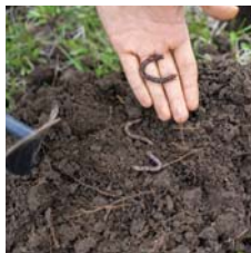
• للديدان دور إيجابي في صحة التربة

وقال ستيفن فونتي، المشارك في إعداد الدراسة، وهو باحث في جامعة كولورادو، يُقدّر أن التربة تحتوي على ما يقرب من نصف التنوع البيولوجي على الكوكب، لذا فهي عنصر حاسم في جهود الحفاظ على التنوع البيولوجي. ولذلك، دعا فونتي إلى الحد من استخدام المبيدات الكيميائية، ولتقليل كثافة أنشطة الحرثة والتروير بها. مع ذلك، فإن نشر السماد الزراعي يمكن أن يساعد في تغذية ديدان الأرض.