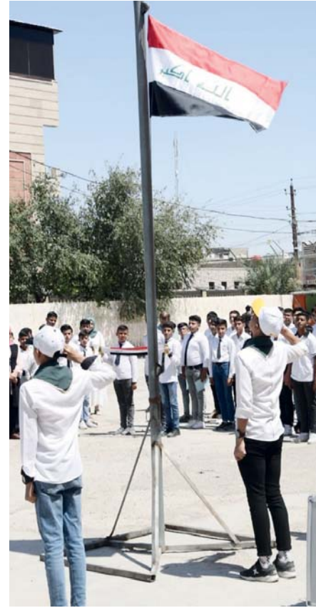
● وزارة التربية أهت استعداداتها لاستقبال الطلبة والتلاميذ