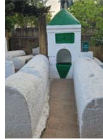
● مرقد الصحابي عبد الرحمن ابن ربيعة وضيقة سلمان