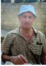
● البروفيسور بيلدرخان بيلدراڤ