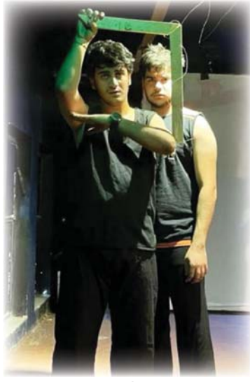
● عرض بدين الاضطهاد والعنصرية

التاريخي هناك نظام عالمي جديد وحالي وجديد وكل منهم خصوصيته وطروحاته وحانه وكأنه بقر تشابه على الجميع ولم يعدوا أن يميزوا بينه وأن هناك تمثّلات عديدة لهذا النظام مناصفاً. فهناك أنظمة جديدة تظهر وأخرى تشتمل ما بين هذا وهذا ويكون الإنسان ضحية لكل ذلك، العنصرية منها والنازي والرأسمالي. (النظام العالمي الجديد) عمل عليه مجموعة من الشباب المسرحي الواعد الذين يعملون عليهم كغيراً في حمل مسؤولية المسرح وهو عرض شباهي يعاين أن يخلق في فضاء التيارات الحديثة في المسرح والتي تقف ضد العبودية وتطعن القيد ومهاجمة الحزمات والعنصرية والتسلط إلى موضوعات تخصهم وترتبط بمتبهم وقضايا سياسية وثقافية والاقتصادية، برؤية مختلفة فكان العرض إعلاناً لوقف نقدي هذه الأنظمة التي تحاول السيطرة على الشعوب حتى وأن تباينت في ظهورها