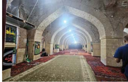
● مسجد الجمعة من الداخل

عدت إلى عاصمة داغستان مع قلعة التي تبعد عن دريند نحو 130 كيلومتراً وطوال الطريق كنت لا أزال متدهشة لكيفية نجاح المسلمين بمرآكهم من تجارز الصد الفيولادي الممتد من الساحل إلى داخل بحر الخزر ثم استغلال المنفذ الوحيد لدخول القلعة الحصينة التي صمدت فورتاً بوجه الأعداء لكنها رضخت في النهاية لدهاء وإرادة الفاتحين المسلمين.