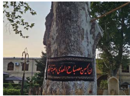
● إحدى أشجار باحة مسجد الجمعة عمرها 760 عاماً