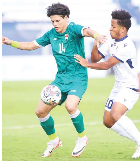
● معسكر ناجح للأولمبي