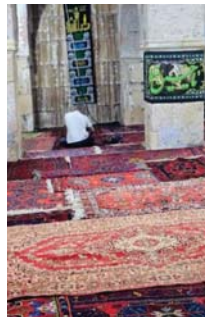
● حرم مسجد الجمعة - دريند