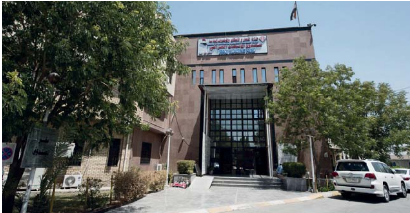
● صندوق الإسكان يحضر من الذهاب إلى المكاتب والوسطاء

يباشر صندوق الإسكان العراقي اليوم الأحد فتح التقديم الإلكتروني للقروض الساعة العاشرة صباحاً، وذكر الصندوق في بيان أن "جدول التقديم تضمن محافظات: بغداد، وديالى، وركوك، والأنبار، وبنين، وصلاح الدين، يوم الأحد الموافق 2023/10/15، فيما ستكون محافظات ذي قار، والمثنى، وواسط يوم الاثنين الموافق 2023/10/16، وستكون محافظات القادسية، وبابل، والتنجف وذي قار، والمثنى، وواسط يوم الثلاثاء الموافق 2023/10/17، أما محافظات ميسان، وكرلاء، والبصرة، فسكنون يوم الأربعاء الموافق 2023/10/18".