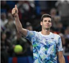
● هوركاتش يشق طريقه بنجاح

شأن البولندي هوركاتش طريقه بسهولة نحو نهائي دورة شنغهاي الصينية لاسترزف الألف نقطة في كرة المضرب، بفوزه أس السببت على الأمريكي سباستيان كوردا 6-3 و6-4. وأرسل البولندي المصنف 17 عالمياً إرسالاً سحافاً، ليخرب موعداً مع الفائز بين الروسي أندريه روبليف السابع عالمياً والبلغاري غريغور ديميتروف التابع عشر. ورضع كوردا، المصنف 26، الذي كان يخوض أول نصف نهائي في دورات الماسترز، أمام ايل من نصريات البولندي. لم يواجه الفائز البالغ 26 عاماً أي كرة لكسر إرساله في المباراة من كرتة الثانية بعد 77 دقيقة. قال هوركاتش المتوج بلبق بست دورات بينها واحدة في الماسترز عام 2021 في ميامي "سبب خصم قوي حقاً، ويتبع برود رائعة، لذا عليك أن تكون جيداً أمامه ولا يستفيد من ضرباتك". وعن ضربه 77 إرسالاً حتى الآن في الدورة، بيتهنا 14