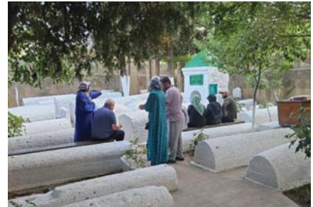
● مقبرة الأربعين صحابي في دريند