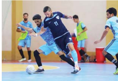
● تواصل مباريات كأس العراق

يشار إلى أن نتائج التصفيات على يد العراق كانت قد أسفرت عن فوز بطل الدوري للموسم السابق نسط البصرة قاعة فاعل نسط البصرة ستجتمع بلدية البصرة وتضمينة القوة الجوية، ويمول الفريق