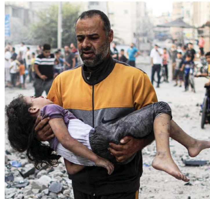
● قوات الاحتلال الصهيوني تواصل عدوانها الهجمي على غزة