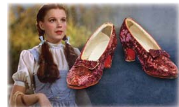
الحذاء الأحمر الشهير للممثلة جودي غارلاند