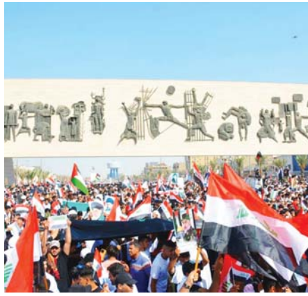
● القضية الفلسطينية حيّة في ضمير العراقيين

السفوطي، مؤكداً أهمية استمرار الجهود الدبلوماسية مع دول العالم من أجل حماية الشعب الفلسطيني. ودعا المجتمعون مجلس النواب إلى تبني مشروع قرار وموقف موحد تجاه هذه التجاوزات. إلى ذلك، اختتمت في القاهرة أعمال الجلسة الأولى من دور الأمانة الرابع والمنظمات طالب بإيجاد موقف لإنهاء تلك المجازر، وإيجاد السبل لإيقاف عملية التهجير والنقل المنهجي الذي يمارسه كيان الاحتلال بحق الفلسطينيين. وتلقى رئيس الوزراء محمد شياع السوداني، أمين السبب، اتصالاً هاتفياً من رئيس الجمهورية الإسلامية الإيرانية إبراهيم رئيسي وشهد الاتصال بحث آخر التطورات التي تشهدها الساحات الإقليمية والدولية، وتناقض الأوضاع الإنسانية في قطاع غزة، إثر العدوان الصهيوني المستمر على الشعب الفلسطيني هناك. وشدد الجانبان، خلال الاتصال، على أهمية وشكر المجتمع الدولي إزاء ما يحصل من انتهاكات خطيرة تستهدف المدنيين في الأراضي المحتلة، ووقع الحصار الطالم عن مدينة غزة وتهجير المرات الأمنة للمدنيين ومسور المساعدات الإنسانية العاجلة للفلسطينيين.