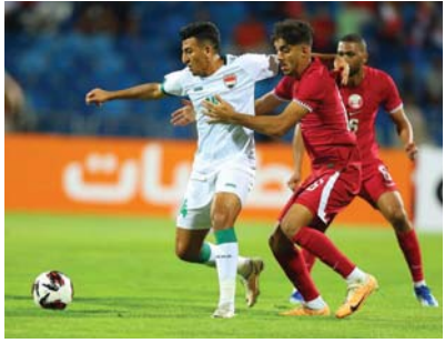
● مباراة متقاربة من التاحيتين الشقية والمهارية

وعلى جاسم، بينما تنتظر جماهيرنا الرياضية لمسات أحمد على وعلى حيدري في مباراة الأردن في حال إشراكهما بالتحديفة. وبين شهد أن الملوك التدريسي على قدر المسؤولية والجميع يساند من أجل الارتقاء بمستوى منتخبنا والمنافسة بقوة في المباريات القادمة.