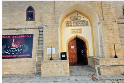
● مدخل حرم مسجد الجمعة - دريند