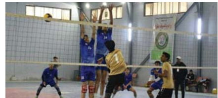
● جهود حثيئة لتوسيع قاعدة اللعبة