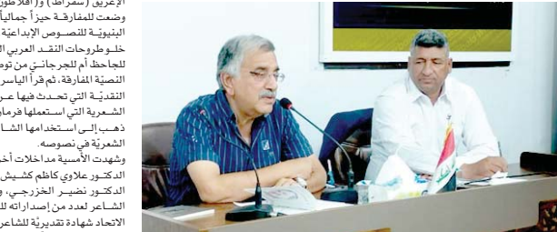
• تناوت الجلسة قضيا الشعر ومومها

مستخدماً الرؤية الفنية في رسم الصوت المنبعث من النص على شكل حركات ثابتة مستمرة الوقائع الحيطية بأشكالها والحركات التي تهرّف حول النص أجنحة الغامرة وتتجسد في عالم الطبيعة، الحالة النفسية، الظواهر الحياتية، العلوم وتقرعاته، سيمائية الناس التراسب بهذا الخزون بمختلف أدواته لجسورة بعضها بالأفئذ والأقمة أجناتاً ونثر متباينات والوضوح والباشرة اللطيفة يواف يفرضه أحياناً أخرى بعيداً عن تقيد مفهوم الخطاب وتكريسه وفق استراتيجيات تنظر إلى عمق مدلولاته بمرأيا التنفّر، ثمولة إليها بإشارات تنير وسائل التعامل المكث مع الظواهر الأسلوبية والتحليلة، لطرح مستويات تناقض العنق الإنساني الحالة التي يشترع فيها الأديبي، بالكتابة والتدوين وسفل الفكرية، وصولاً إلى إغواء المتلقي وسجبة إلى منطقتة وفقاً لجزء الإيقاع التي تتفاوت بين كاتب وآخر، وفقاً إلى الروح البثوية على هيئة خطاب نثني مكتوب لتوحيد ماهية هذا الخطاب مستهدوا بيواعت البلاغة المستخدمة في استدعاء العالمة على نحو إشارات أو تركي بأسلوب خاص بعيداً عن النمطية السائدة واقترا المكلات في عملية بلورة الفكرة والسعي إلى تحييجها بصوم واللحمة وغرائبيتها، وهي تأخذ الحوار الداخلي منح ليداء، هربي بيمات متآخية مع الخط البياني المنطق والنمذخ من الإيحاء، مة بأزوة توحى في تعدية الصور للماهية وفق سياق النص. تتخذ الدلالات التقنية المتساعده ويجيات نظر متعدد لولنا مهمأ في المعالجة الضمنية، التي تستغل على تخفيف حدة الفكرة وتحريبرها من الأقتعة الزلادة التي يلبأ إليها الشاعر في صياغة مكثواته المعنوية وفق لغة تعتمد تجريد معطقات التوير وتخليص روح الشعر من شوائب الراهن، ليكون خاصاً لوجه الشعر من دون غيره، بجوية منقطعة النص