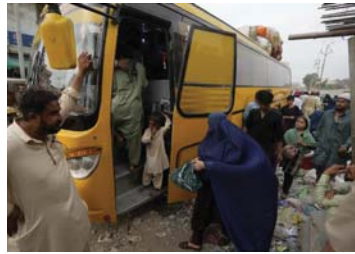
• مهاجرون أفغان يستقلون الحافلة للعودة إلى بلادهم

أعلنت وزارة الخارجية الباكستانية مؤخراً أن باكستان ستندد خططها التي أعلنتها قبل عدة أسابيع لترحيل جميع المهاجرين الموجودين في البلاد بشكل غير قانوني، بما في ذلك مليون و700 أفغاني، بطريقة تدريجية ومنظمة.