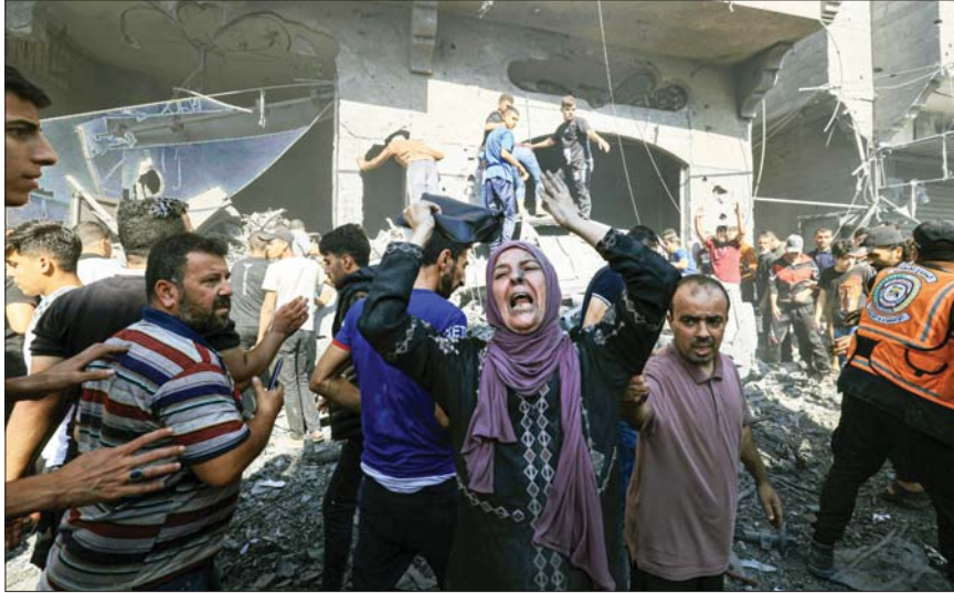
أ ف ب

حملت حركة المقاومة الإسلامية "حماس" الدول التي رفضت مشروع القرار الروسي في مجلس الأمن لوقف القتال وفتح ممرات إنسانية، مسؤولية استمرار نزيف دماء المدنيين في قطاع غزة. وجاء في بيان الحركة، "نعر في حركة المقاومة الإسلامية (حماس) عن بالغ استهجاننا واستنكارنا لمواقف الدول التي صوتت ضد مشروع القرار الروسي في مجلس الأمن والذي يدعو إلى وقف (إطلاق نار إنساني) لفتح ممرات إنسانية لمساعدة وإغاثة المدنيين في قطاع غزة".