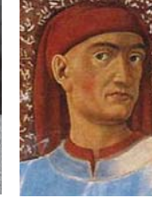
• جيوفاني بوكاتشيو

التلقي، أو بنظريات التلقي، التي تقوم كلها على علاقة المبدع بالنص والمتلقي بهذا النص والمبدع على اعتبار أن تلك الحالة من العلاقة الإشكالية بين النص والمتلقي. فالنتج الأدبي لا يعتبر مكملاً من دون متن، والتلقي هنا معني بالناحية الجمالية، أما الناحية الفنية فهي مسؤولية الكاتب. هذه النظرية تقوم على أسس معرفية والنرائ والتش، والتحقيق والتأويل، أفق التوجهات، المتلقي المثالي والافتراض لكن في إطار هذه النظرية يبقى لكل جنس أدبي خصوصيته، والسؤال الذي يطرح نفسه هنا هو هل أسهمت تلك النظرية في النقد عموماً في الأقران بالذاتة الفنية للمتلقى؟ أسهمت الدورات، مجلات وصحف في توسيع دائرة التلقي للقصة