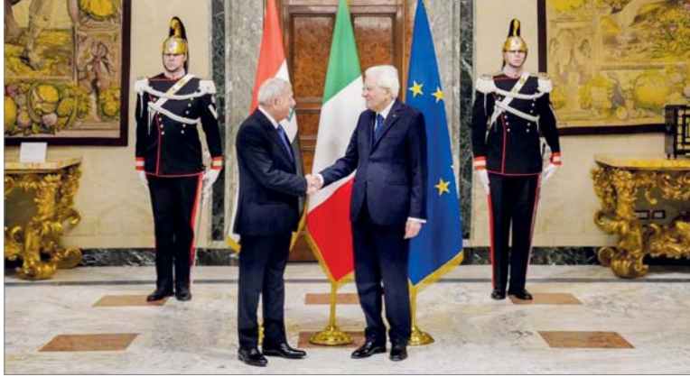
رئيس الجمهورية، العراق إحدى الدول التي تعاني من شح المياه