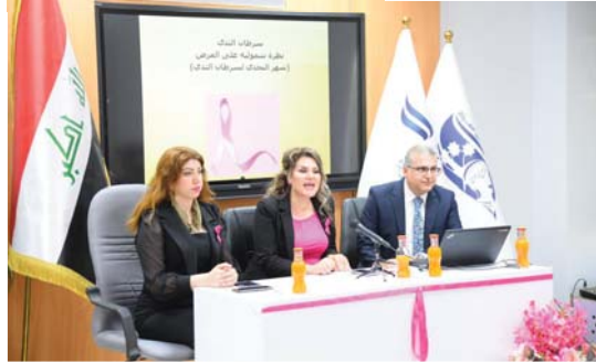
● ندوة نظمتها شبكة الاعلام العراقي

وتتمتع الذكورة مروية في حالة إصابة امرأة بالأسرة بذلك المرض أن يتم استئصال الثدي منها وبعيها