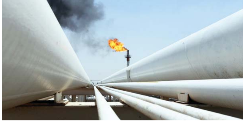
● انحسار كبير في عجز الموازنة نتيجة زيادة أسعار النفط