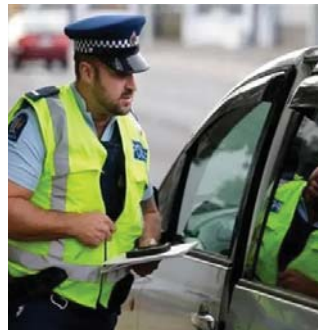
● مخالفة مروية

تصل الرجل بمسؤولي المحكمة طلباً منه أن تفتأ خطأ مطبعياً، لكن من رد عليه أبلغه بأنه إما أن يدفع قيمة الغرامة أو يمتل أمام