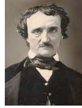
• إدغار آلان بو