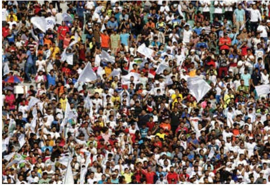
● جماهير الزوراء تنتظر الحول

أبرز المواقف لاسيما أن الفريق يخوض حالياً عمار تصفيات الاتحاد الآسيوي المرحلة الحالية تتطلب من الثامن على شيون التناهي الصبر والهدوء من أجل حل المشكلات المالية والفنية والجنسية مع الطاقم المصري من أجل مناقشة