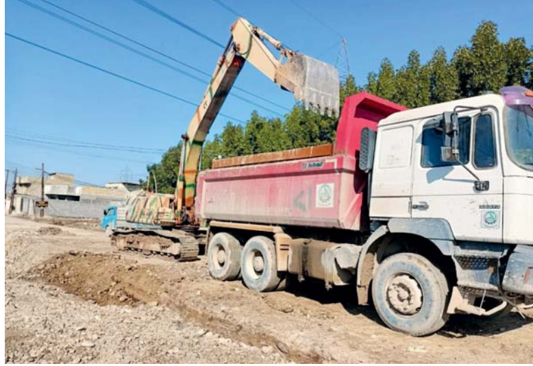
● الجهد الخدمي والهندسي يواصل العمل بوتائر متصاعدة في جميع المحافظات...