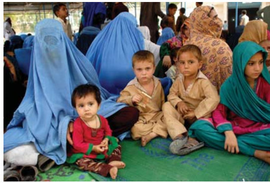
• الأفغان يشعرون بالقلق لقرار باكستان بترحيل المهاجرين غير الشرعيين

ومن المرجح أن يهدف هذا البيان إلى تهدئة المخاوف الدولية وتهنئة مشاعر القلق بين اللاجئين الأفغان في باكستان. بعد أن قالت إسلام آباد بشكل غير متوقع قبل عدة أيام إن جميع المهاجرين، ومن ضمنهم الأفغان، الذين ليس لديهم وثائق صالحة سيتعين عليهم العودة إلى بلدانهم طوعاً قبل 31 تشرين الأول لتجنب الاعتقالات الجماعية والترحيل القسري.