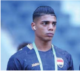
● الأولمبي وصل إلى مرحلة الاستقرار