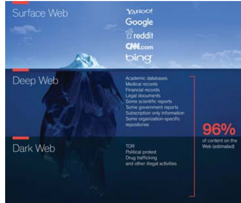
• 57 % من مواقع الانترنت تحتوي على محتوى غير قانوني

ببساطة، الشبكة السطحية هي الجزء من الإنترنت الذي يكون دائماً متاحاً للجمهور ويمكن العثور عليه من خلال محركات البحث العامة تشكل الشبكة السطحية ما نسبته 4% فقط من مجمل الإنترنت تطلق عليها السطح لأنه يتضمن البيانات التي تمّ تنظيمها وفهرستها، عمداً بواسطة محركات البحث، ما يجعلها سهلة الوصول للمستخدمين من خلال منصات مثل Google و Bing. هناك عملياً استخراج أعمق تتبع الوصول إلى محتوى عالي الجودة