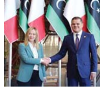
• ميلوني أثناء زيارتها إلى ليبيا بحثا عن بعثات للملحة

كان ذلك عندما بدأت ميلوني بوضع مهاراتها موضع التنفيذ. ولأجل تهديده الأسم، أعلنت عن ميلها إلى الحلف الأطلسي، وقدمت دعواتها الثابتة لإكرانيا، وخفقت من حدة مواقفها حيال القضايا الأوروبية، ووافقت مع الجوار من الإجماع الأوروبي، المؤسسة التي قالوا أنها تريد تبنيها (حتى أن رحلتها الأولى خارج إيطاليا كانت على وجه التعديد إلى بروكسل). وهكذا،