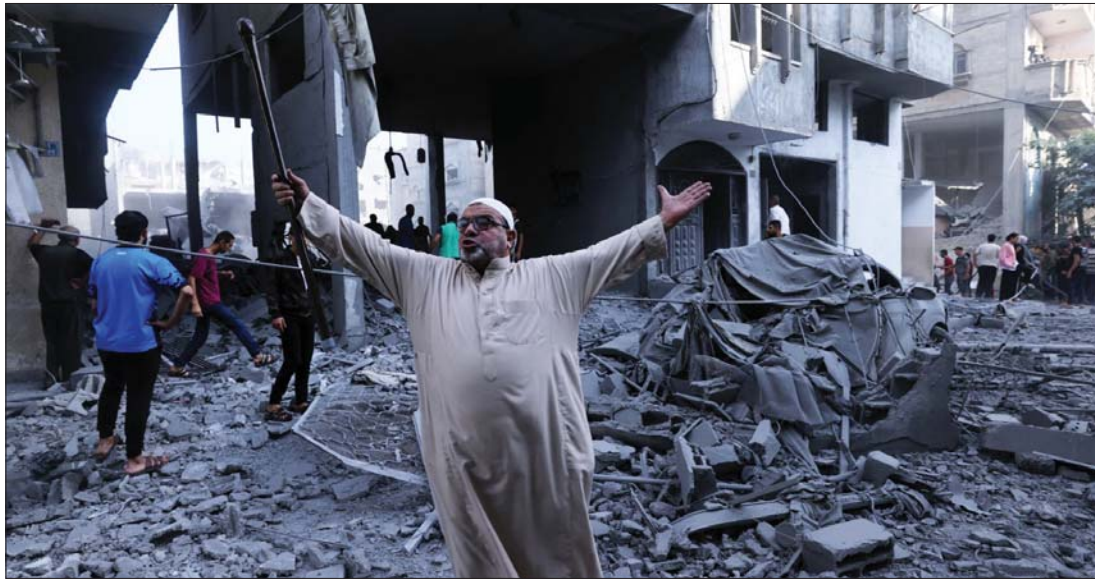
• نحن أحياء وبقون