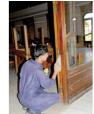
● عامل اجنبي في أحد المطاعم

وتشير آخر إحصائية أجرتها وزارة التخطيط إلى أن معدل البطالة في العراق لسنة 2021 وصل إلى 16.5 بالمئة، وهو مرتفع عما كان عليه قبل 2020، إذ إن الشباب من 15 إلى 24 سنة وصل إلى 36 بالمئة أما الأعمار فوق 25 سنة فنخفض، إذ تبلغ البطالة بينهم 11 بالمئة، إضافة إلى بطالة طويلة الأمد من الذين يبحثون