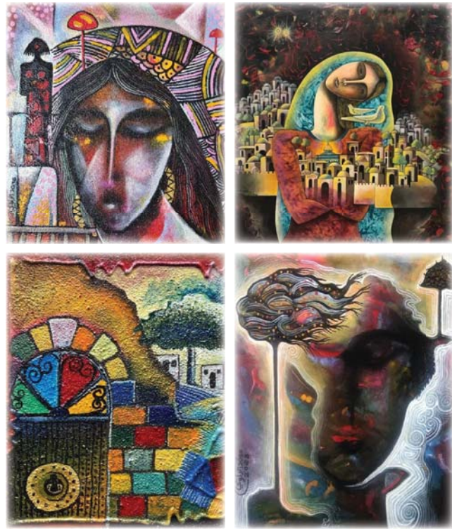
● من أعمال الفنان