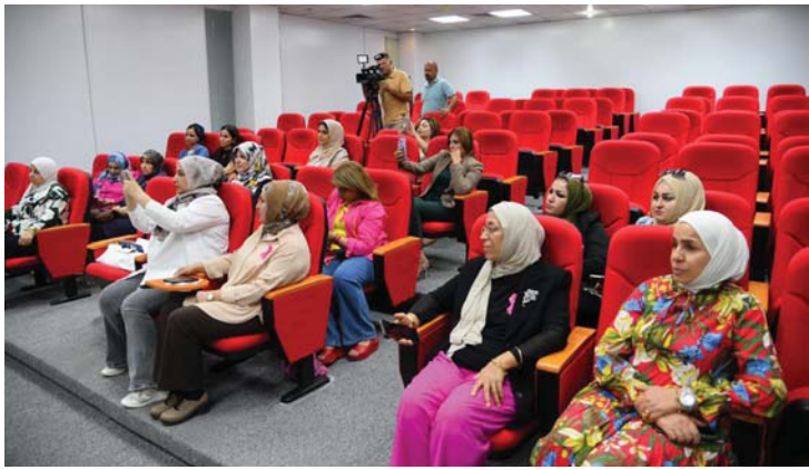
● تعريف الحضور بهذه التوعية العالمية

وبالتبعية للمعلومات والأعراض يفت الدكتور عبد الرزاق قد لاكتشف هناك أعراضاً أي صامت لا اكتشف إلا عن طريق الفحص، وهذا هو هدفنا لأنه إذا وجدناه تلك المرحلة تحصل على نسبة شفاء عالية، وربما يحصل تضخم بالفتد المفاوية من دون ألم أو ظهور كتل أو عقد بالصدر وأحياناً إفرازات منه غير طبيعية، خصوصاً إذا صاحبها خروج دم وحكة وتقرح أو احمرار وتقرش، وكذلك انبعاث العلمة نحو الداخل وتخن جلد الثدي فتأذنا ما يكون هناك شعور بالألم، وبالمنحصر المفيد أي شيء غير طبيعي يحصل بالثدي يجب الذهاب للفحص إذ إن كل المراكز الصحية والمنشآت القريبة من أماكن السكن استقبال النساء خاصة البكر عن سرطان الثدي بالعراق واختتم الدكتور جدير سامي عبد الرزاق حديثه بالتطرق إلى الوقاية من خلال تغيير نمط الحياة إلى نمط صحي أكثر، والإشارة إلى أهمية الفحص من عمر العشرين فصاعداً ذاتي كل شهر مرة بعد الدورة بأسبوع بينما تحتاج المرأة بسن الثلاثينات إلى الذهاب للطبيبة لإجراء الفحص سريري كل ثلاثة سنوات، وكذلك القيام بالفحص الذاتي في البيت كل شهر مرة وبعد الأربعة نواصل كل شهر فحص ذاتي كل سنة فحص عند طبيبة وفحص شمة الثدي.