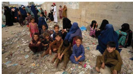
• اللاجئين الأفغان في باكستان يعانون من ظروف معيشية صعبة