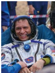
• فرائد رويبيو عنده يومه الى الارض

رقم قياسي جديد لأطول فترة فضاء أميركي في الفضاء، محطماً الرقم القياسي الذي سجله عام 2022 مارك فاندي هي وتمثل في فضاء 355 يوماً متتالياً في الفضاء، ويجعل رائد الفضاء الروسي فاليري بولياكوف الرقم القياسي العالمي مع 437 يوماً. وقال رويبيو في الأيام القليلة الأولى بعد العودة إلى الأرض، لا يكون توازن الجسم كاملاً خلال المسعى. وتابع إن الذين يكون عليهم، لكن الجسد لا يستعيد بالطريقة المتوقعة. وخلال إقامته في محطة الفضاء الدولية، أقدم رويبيو على بعض المواقف التي تبعه سلعاً وخدمات غير قانونية على الشبكة المظلمة وتواجهت مع قانونياً.