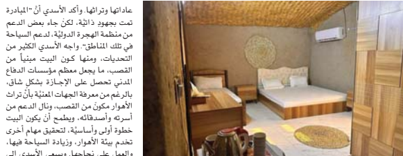
المبادرة تمت بدعم من منظمة الهجرة الدولية

إن إرادة المجتمع، هي التي تغير وجه التاريخ، حكم من (حابل نابل) خربوا أوطانًا ومراسوا كل ألوان القهر على مجتمعهم من تضيق لسبل العيش وتخريب للتعليم، وتأجج روح الفرقة، لكنهم انتهوا إلى مزاليل التاريخ، وبدأت مسيرة الحياة من جديد. يبقى الأمل راية عليا، بعيداً عن منصفات الحابل والنابل.