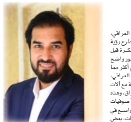
الفنان أنور أبو دراغ

لها جمهورها الخاص سواء في أوروبا والعالم. غنى أبو دراغ مقام البيهرزاي بالطريقة البغدادية والبصرية، لكنه كما يشير من الخشابة له تأثير مختلف.