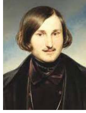
• إيتالو كالڤينو

والجواب: رشح: 1- رشح: رشاد- في القصة القصيرة دمشق- اتحاد الكتاب العرب. 2- الشراوي يوسف- القصة القصيرة نظراً وتطبيقاً- دار الهلال 3- أنكور فراتك- الصوت المنرد؛ مقالات في القصة القصيرة، ترجمة د محمد البريعة- الهيئة العامة المصرية للكتاب- 1993.