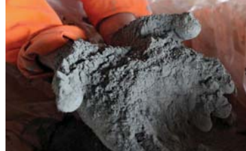
● المكونات الجديدة تحتوي على العت أو الببتوس

تمكن فريق من العلماء من جامعة البلطيق الفيدرالية الروسية من تطوير مكونات جديدة تزيد من متانة الخرسانة التي تستعمل في عمليات البناء عبر الطابعات ثلاثية الأبعاد. وجاء في بيان صادر عن الخدمة الضمنية للجامعة: تمكن فريق من العلماء في جامعتنا من تطوير مكونات جديدة تزيد من صلابة الخرسانة المخصصة للبناء عبر الطابعات الكبيرة ثلاثية الأبعاد.