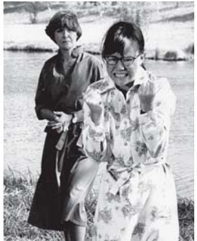
• مشهد للمثلة جوان وودوارد من الفيلم السينمائي «ثلاثة وجود لحواء»

الغريب أن الفرد في هذا النوع من الاضطراب، يملك في الأقل هويتين أو شخصيتين مميزتين (وقد يصل العدد إلى العشرات والمئات) لكل واحدة أسلوبها الخاص بها في السلوك والإدراك والتفكير والتاريخ الشخصي والصورة التي تحملها عن ذاتها، وتمايز الوجه والتجويد، وطريقة الكلام وعلاقتها بالآخرين، وقد تكون بعمر مختلف، وجنسي وحتى باستجابات فسيولوجية مختلفة.