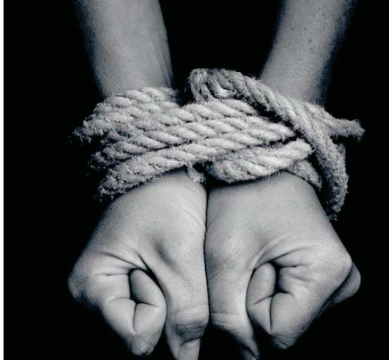
• انتهاك للإنسانية وتحطم للقيم