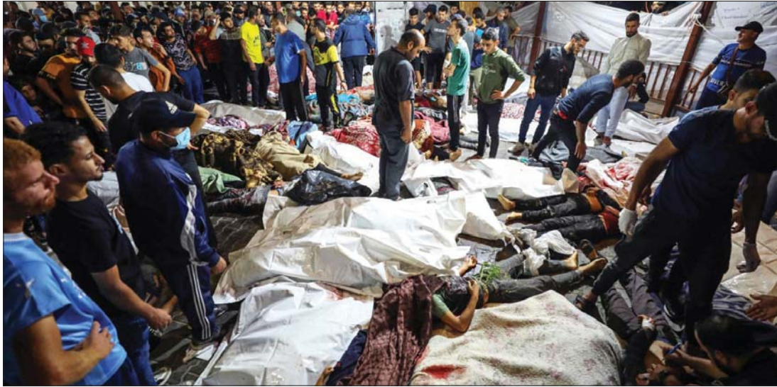
غزة: ضحية ترحل من أمام انتظار مجتمع دولي فقد ضميره

على وقع مجزرة مستشفى المعمداني بغزة التي ارتكبتها الكيان الصهيوني وراح ضحيتها مئات من الشهداء والجرحى، وصل الرئيس الأميركي جو بايدن والوفد المرافق، أمس الأربعاء، إلى فلسطين المحتلة دسماً لـ «تل أبيب» في وجه المقاومة الفلسطينية، ورغم الحقائق التي تؤكد مسؤولية الاحتلال عن الهجوم، إلا أن بايدن وفور وصوله إلى الأراضي الفلسطينية المحتلة، سارع إلى اتهام المقاومة الفلسطينية قاتلاً، إن «انفجار المستشفى سببه الجانب الآخر»، في إشارة إلى الفلسطينيين، وللإشارة أن بايدن استخدم كلمة «انفجار» حين وصف المجزرة الرهيبة.