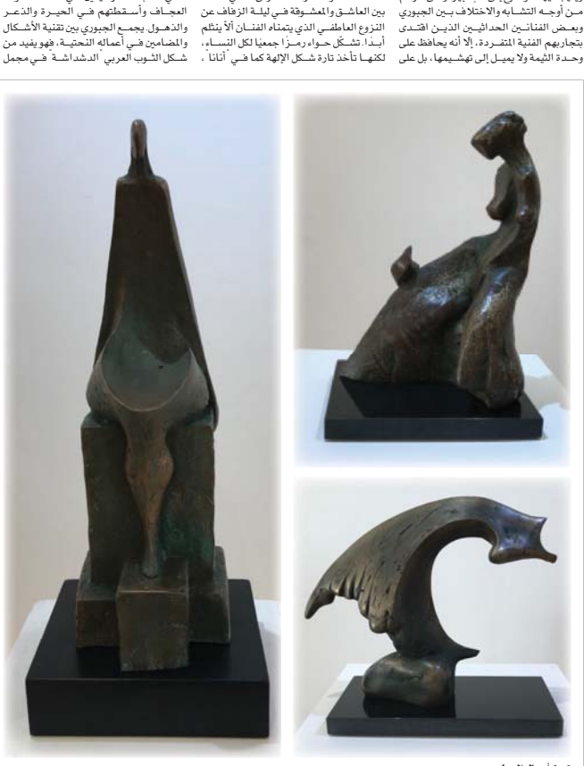
• من أعمال المعرض