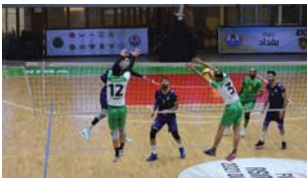
● 15 نادياً تشارك في البطولة

كل من غاز الجنوب والبشمركة وأربيل ومصافي الشمال والحبيانية والصناعة والسمود وحادثة الأهورا والقادسية وأبو يوشة والدغارة والتعمانية وبنينوي والنجري. وكان اتحاد اللعبة قد استضاف الدورة التدريبية الدولية (المستوى الأول) بمشاركة 39 مديراً عراقياً وأربعة مدربين إسبانيين، وحاضر في الدورة التي استمرت