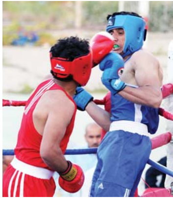
● البطولة لثقة 22 عاماً

على الأوسمة الملوثة، مبيئاً أن اتحاد برهان على خبرات فيضلتنا للثائق في حلبة كازاخستان والعودة بنتائج إيجابية تميز من سمعة رياضتنا على الصعيد الآسيوي.