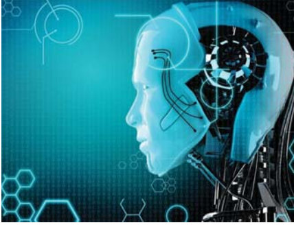
● الذكاء الاصطناعي

المهمة، مثل قبول الطلاب في الجامعات أو تحديد العقوبات الجنائية وهذا ما يجب أن نضمن وجود شفافية ومساءلة في عملية تطوير واستخدام هذه الخوارزميات، وأن نتجنب أي تحيز أو تمييز غير مبرر. مع ذلك، وبالرغم من التحديات الأخلاقية المرتبطة بالذكاء الاصطناعي، فإن هناك رؤية مستقبلية مشرقة تنتظرنا، إذ يمكن للذكاء الاصطناعي أن يحدث ثورة في العديد من المجالات، مثل الطب والتعليم والزراعة وأن يسهم في تحسين جودة الحياة وتسهيل حياتنا اليومية. على سبيل المثال في مجال الطب، يمكن للذكاء الاصطناعي أن يساعد في تشخيص الأمراض بدقة أكبر وتوجيه علاجات مخصصة لكل مريض، وكذلك في التعليم، يمكن للتقنيات الذكية أن تساعد في