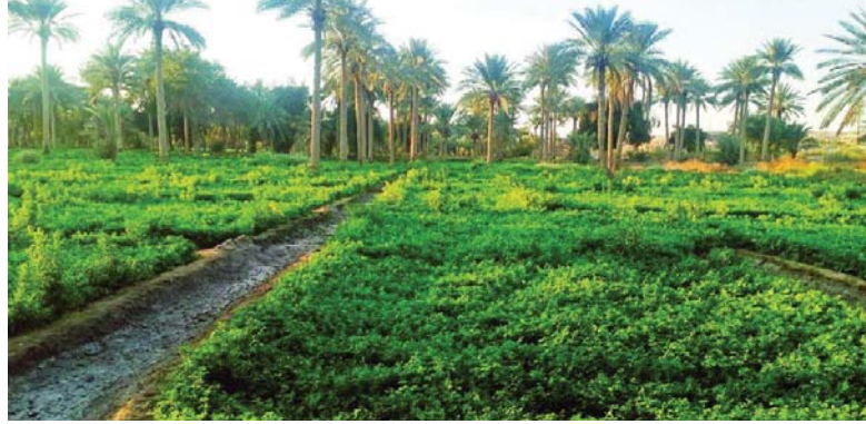
● تنشيط القطاع الزراعي يسهم في تخفيض نسبة البطالة