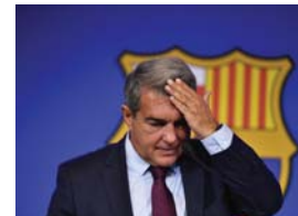
● لابورتا يتشمم قناعة المتهمين

وفي رأيه، من التصادم، نظر الخطوات التي اتخذتها النيابة بعد فزعوات من زعمه بلفظ أكثر من 7.3 ملايين يورو، دفعها برشلونة إلى تغيير، نائباً رئيس لجنة التحكيم الفنية السابق، بين 2001 و2018 لتزيد التحكيم الإسباني.