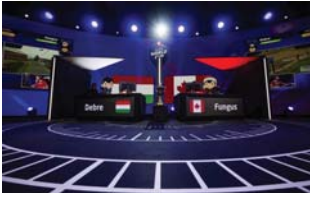
● لعبة «جيوغيسر» (Geoguessr)