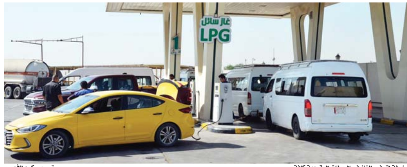
● خطة توفير الغاز في المحطات القومية كافة