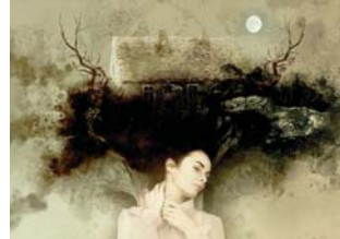
• مرض لم تشخص أسبابها

يتيم حتى الآن تشخيص السبب الرئيس وراء الإصابة بها. إننا نعتقد الباحثون بأن عدداً من المشكلات الصحية قد تلعب دوراً ملحوظ بعد العلاج، مع أن آخرين يرون في هذا الاضطراب التآدر مثل الصرع، أو الخرف، أو الشقيقة، أو مرض باركنسون، أو مرض آلزهايمر.