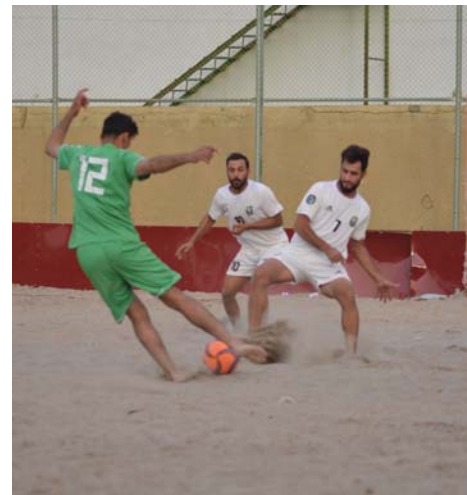
● مطاليات بالانفصال عن لجنة الصالات

وأكد المعموري قديماً طلباً لرئيس الاتحاد المركزي عدنان درجال وشرحه له كل شيء وتمنى أن يكون متطهماً لظائنا في أن يكون للعبة لجنة مستقلة تأخذ على عاتقها تسمية مدربي المنتخبات الوطنية وتنظيم المسابقات ومن أبرزها الدوري الممتاز ونحن ننتظر