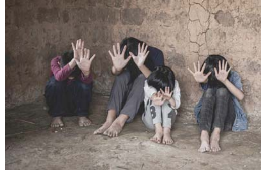
• الفقر السبب الرئيس لهذه الظاهرة اللاإنسانية

يشهد العالم الآن ظاهرة أقلت علماء النفس والاجتماع، اصطلاح على تسميتها عالمياً (ظاهرة الاتجار بالبشر). والمقلق أكثر أن هذه التجارة جاءت بالمرتبة الثالثة بعد تجارة المخدرات والسلاح. ودرى نحن السايكولوجيين أن ظاهرة الاتجار بالبشر هي أخطر مهدد للقيم الأخلاقية والدينية، وأنها (الأرضة) التي تنخر المجتمع من الداخل، وأنها أكبر مهدد لمستقبل القيم الإنسانية على مستوى العالم.