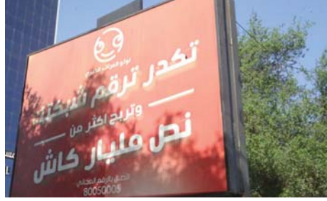
• تهالك لعوي

ذهنية المتلقي مع الإفادة من التكنولوجيا بصمات حداثة مؤثرة، إلا أن ما تراه في شوارع العاصمة هو فوضى إعلانية بعشوائية مضطربة، من حيث النص اللغوي والضعف التعبيري في استقطاب الجمهور المستهدف في الترويج التسويقي للمعرض السلمي المعلن عنه.