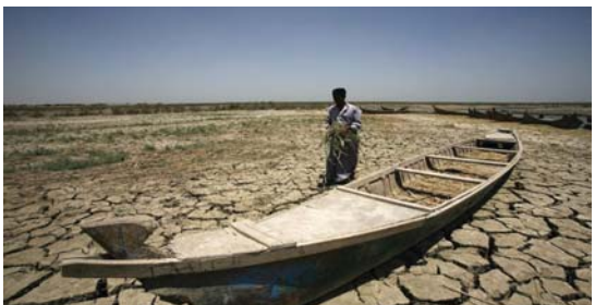
• العراق من أكثر التضررين من ظاهرة الجفاف العالمي