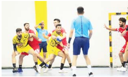
● استئناف دوري التخبية

أظهار جميع امكانياته الفنية والبدنية بغية تحقيق الفوز، بيدور بيرونيوجوم القبتارة إلى انها، آمال منافسه والعودة إلى بغداد حاصداً العلامة الكاملة. وفي اللقاء الثالث يتطلع فريق نطق البصرة الذي سيلتقي في ملعبه نظيره الحشد الشعبي، إلى الظهور بأداء مميز يستطيع من خلاله التظفر بنشاط المباراة، بينما سيعول الحشد على خبرة مدربه وحكته في فرة أسلوب لعب المنافس والضيق عليه بشار إلى أن نتائج افتتاح الجولة الأولى من بطولة دوري التخبية كانت قد أسفرت عن فوز الشرطة على مضيغه الطلبة بنتيجة (43 - 11)، في حين خسر ذي قار من الكرخ بـ (39 - 15)، وتغلب الحشد الشعبي على نطق ميسان (44 - 24)، وتوقف نطق البصرة على نطق الوسط (21 - 20)، وتخطى الجيش الكوت بنتيجة (43 - 21)، واجتاز ديالى نظيره كربلاء بـ (30 - 34).