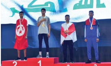
● موهبة قادمة بقوة