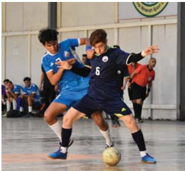
● ختام منافسات الدور الأول

تشرين بد (0-5)، في حين خسرت الأليات الشرقة من الحور بد (2-4) بركلات الترجيح بعد نهاية المباراة بالتعادل بثلاثة أهداف لكل فريق.