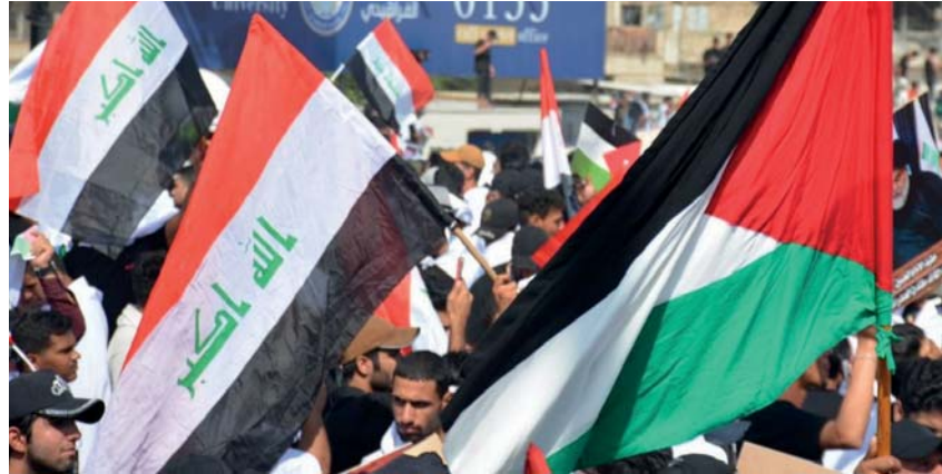
تصوير على الشاشي

● موقف من القضية الفلسطينية وخذ الشعب العراقي والقيادات السياسية..