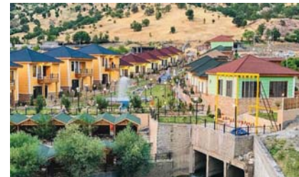
● قرية سياحية

الحسنوي لـ الصباح: تطلق الفعاليات في العاشرة من صباح اليوم الاثنين، يواقع جلستين على قاعة قروية في فندق المنصور ملبيا، مؤكداً تفاعل خلائها مشورن السياحة والبيئة والاقتصاد والطاقة، بهدف تشجيع الاستثمار في قطاع السياحة العراقي.