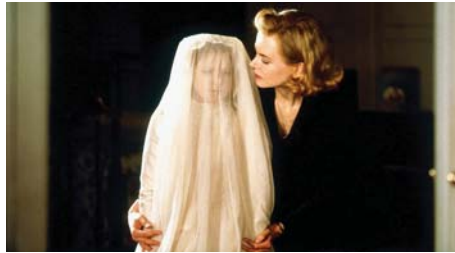
مشهد من فيلم «الأخرون»

صنّف العمل من أفضل أفلام القرن الواحد والعشرين للأداء المتميز للسيدة وخاصة نيكول كيدمان في دور السيدة غريس والطفلين الأوكينا مان وجيمس بنتلي بوري أن نيكولاس. وقد نجح الفيلم بتصوير عالم الموت والحياة قسبي الوجود في بناء تخيلي، متشابه إلى حد يحصل بعد الموت، فكلا العالمين يطال على الأبرمجورحة من الماني نقلت كيوحس أو ذكريات أو أحلام مشكلة ذاكرة جمعية تنتقل وتحرك في سبيل الوجود البرشري.