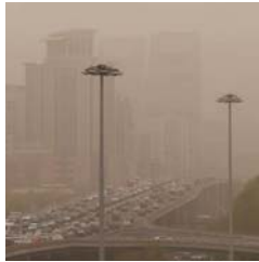
● في كل عام يدخل نحو ملياري طن من الغبار إلى الجو

كشفت الأمم المتحدة عن ارتفاع طفيف في كمية الغبار في الهواء عام 2022، ما يستدعي فهماً أفضل لدور الغبار المناخي في زيادة عدد المناطق الساخنة التي تكثف من هذه الظاهرة . وحددت المنظمة العالمية للأرصاد الجوية عدة مناطق تتفرد بارتفاع الزيادة في الأيونات التي سجلت السنة الماضية، غرب وسط أفريقيا وشبه الجزيرة العربية والهضبة الإيرانية وشمال غرب الصين، بحسب التقرير السنوي للمنظمة بيترتي تالاس إن الأنشطة البشرية لها تأثير على العواصف الرملية والغبار . وأضاف على سبيل المثال، يؤدي ارتفاع درجات الحرارة والجفاف وارتفاع معدل التبخر إلى انخفاض