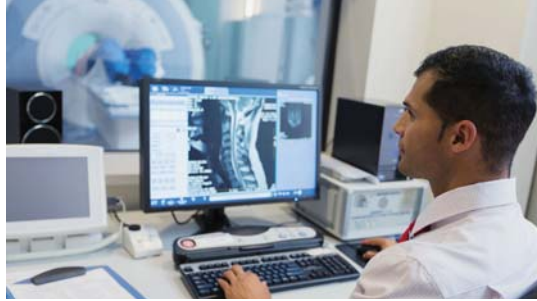
● يكتيف علم الأشعة أدواته لإتاحة استخدام في الجاذبية الصغرى

وأوضح البروفيسور فيدال من مستشفى جامعة لا تيمون الجامعي في مرسيليا أنها ليست بالضرورية ابتكارات تكنولوجية مذهلة ولكن لمة حاجة إلى إعادة النظر في المعدات، وأضاف في الجاذبية الصغرى، عندما تصنع إبرة في الفراغ ينتشر السائل في كل اتجاه التسوية، لذلك لمة حاجة إلى مصمام للتصريف . ويتبنى كذلك أن تكون كل الأدوات مزودة وسيلة للربط بالإضافة إلى مصدر طاقة مستقل، بحسب الخبراء الأمر يهون ويتوصل إلى حل وسط بشأن الحجم والوزن والطاقة الكهربائية.