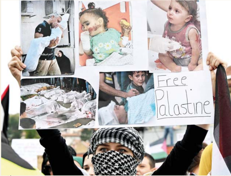
منذ عقود، تشييع الشهداء والصلاة عليهم مشهانا يومية في حياة الفلسطينيين

دخل العدوان الصهيوني على غزة أمس الأحد أسبوعه الثالث واليوم السادس عشر من ملحمة «طوفان الأقصى» التي تخوضها المقاومة، مخلفاً 4 آلاف و385 شهيداً بينهم أكثر من 1756 طفلاً و976 امرأة، بالإضافة إلى أكثر من 13 ألف مصاب، مقابل أكثر من 1400 قتيل صهيوني، حيث كشف طيران الاحتلال غاراته على قطاع غزة الحاصر موقعا عشرات الشهداء والجرحى، وفيما أعدت الإدارة الأميركية مشروع قرار في مجلس الأمن الدولي تعلن فيه دعم دولة الاحتلال ودون الإشارة إلى وقف إطلاق النار، أبدى 100 عضو بالكونغرس الأميركي عدم رضاهم على سياسة بايدن في الصراع وإهماله الجانب الفلسطيني من الصراع الدائر.