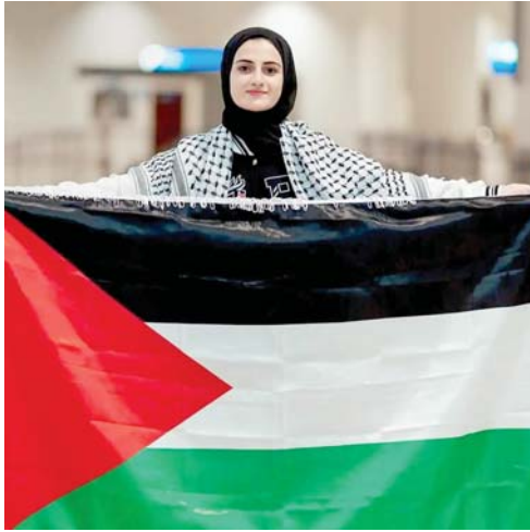
• تأييد ومناصرة