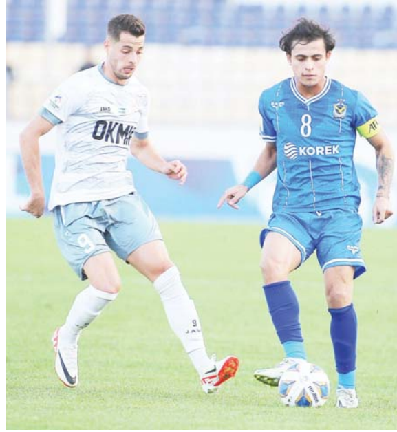
● بغداد، حيدر كاظم

يتطلع القوة الجوية إلى تحقيق نتيجة إيجابية ومواصلة عروضه المميزة في البطولة الآسيوية، عندما يحل ضيفاً على نظيره الاتحاد السعودي اليوم الاثنين عند الساعة السابعة مساءً بتوقيت العاصمة بغداد، إذ سيكون ملعب الجوهرة المشعة مسرحاً للقاء الذي يأتي لحساب الجولة الثالثة من المسابقة القارية. ويتصدر ممثل كرتنا ترتيب المجموعة الثالثة برصيد 4 نقاط، من فوز على أوماليك وأحد، وتعادل أمام سيهان الإبراهيمي بينما يضاف الاتحاد وصيفاً بثلاث نقاط، في حين لدى سيهان نقطة واحدة، ويتذلل الفريق الأوزبكي القائمة من دون رصيد. وقام مدرب الجوية أوبو أويشوف في المؤتمر الصحفي الذي أقيم أمس الأحد، إن المباراة التي تكون سهلة بحكم قوة الاتحاد، الذي يصف من أبرز الأندية قارياً، ووصيحه سابقين عامي (2004 - 2005)، كما حل وصيفاً عام 2009، ولذلك فإنه يعد صعب المراس باعتبار على نجوم العالم من أمثال الفرنسي كريم بنزيمة وموظفه توغولو كانتير، والبرتغالي جوا فيليب غونا والمغربي عبد الرزاق حمد الله والثاني البرازيلي رومانيو وفالينهور. وأضاف، أن على اللاعبين أن يدخلوا بثقة وتركيز عال في الدقائق الأولى لمواجهة اندفاع وحما من المنافس المدجج بأضماره، معرباً عن ثقته بشدرات الصبور على تقديم مباراة كبيرة تسهم بالعودة إلى الديار بتقطعة إيجابية تميز من حظوظه في المنافسة بأجود.