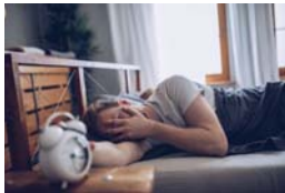
● الشباب عموماً هم من مستخدمي سونوز

وقالت الباحثة في مجال النوم في جامعة ستوكهولم تينا سادلين، لقد وجدنا أن الشباب عمومهم ما من مستخدمي سونوز وتبين لنا أنهم يميلون إلى إطالة الشهر ليلاً . وأجريت أن هذه الخلاصة ليست مفاجئة ويشكل النوم بالنوم السبب للقرع على هد الرز لدى معظم المستعملين، لأن بعضهم أفاد بأن قنابهم في السرير يضيع دقائق إضافية هو بالأحرى من باب النوم ب الترف . أما الدراسة الثانية، فركزت على تأثير العودة إلى النوم في الصباح، وأجريت على 31 شخصاً أخطرت عليهم حالات مختلفة في نصف النوم أو الاستيقاظ فوراً أو الاستيقاظ مرة أخرى قبل موصلة ساعة من السيقاظ التامالي. ولاحظت سادلين أن الأمر الجليل للاهتمام هو أن أولئك الذين استخدموا سونوز ناموا أقل بست دقائق فقط من الآخرين في المتوسط، الذي سبق الاستيقاظ. وأجريت المشورين بالدراسة اختبارات معرفية في مجالات كالرياضيات، أو اختيار للذاكرة . ولم يتصل على من يستطيعون أن يستيقظوا من النوم لوقت إضافي أي اختلاف حقيقي عن الآخرين من حيث المشور والتب أو في الاختبارات. والنات والاختبارات التي أجروا حتى على نتائج أفضل في بعض الاختبارات، مستنتجة أن التأثير الأوضح (لنوم إلى النوم صباحاً) هو أنه ليس سلبياً.