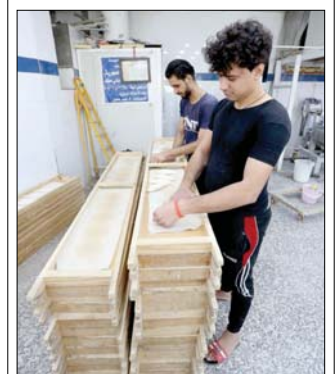
اللوحة الجميلة في ظل الحصار فرس العمل بعد التخرج