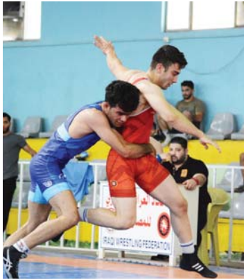
● 31 الحالي موعداً لانطلاق المسابقة

العربية متواصلة بغية الارتقاء بمستوى رياضة المصارعة بفعالياتها الصرة الرومانية، من خلال الدعم التواصل لتختارنا الوطنية، والتأكيد على إقامة البطولات المحلية تحتفظ الأعمار.