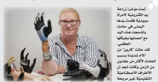
● يربط التكنولوجيا الموجود في الزرعة بالهيكل العظمي بشكل مريح وآمن

استخدامها بشكل مستقل وآمن في الحياة اليومية. كما أن قدرتها على استخدام طرفها الاصطناعي بتسمياً