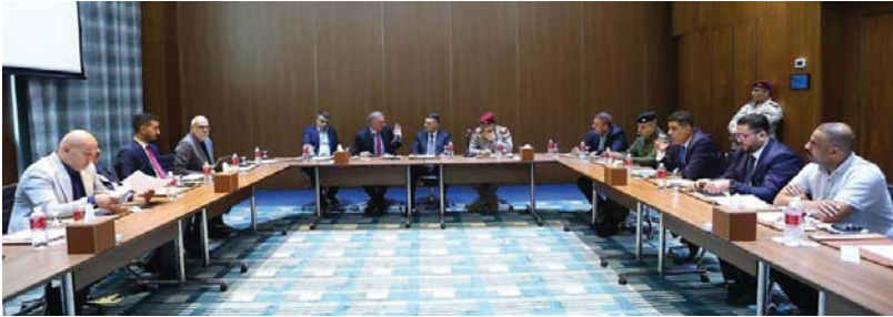
● مناقشات مستمرة لتأمين مباراة منتخبنا أمام إندونيسيا