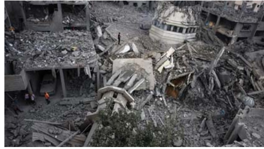
● استهداف المنشآت ودور العبادة يكشف عن سدمة «إسرائيلية»