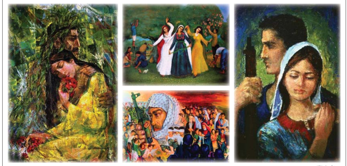
• من أعمال الفنان

يوسف الفنان الفلسطيني إسماعيل شموط، بأنه ذو أسلوب تعبيري. ولوحاته تدل على نهجه الفني في علاقته المباشرة مع الطبيعة. وهي علاقة جدلية مترابطة بينه وبين المكان، ولا يوجد على التعبيرية قدمها كونها مدرسة فنية ظهرت في أوائل القرن التاسع عشر في ألمانيا وامتدت إلى أنحاء أوروبا، فهي نهج فني متفكر حتى بعد ظهور مدارس كثيرة بعدها، وتلاحظ في ظهورها القديم كمدرسة ومنهج وأسلوب أن تأثيرها لا تزال قائمة، في الاهتمام بالطبيعة ومزوها، قبل أن تنتقل إلى فضاءات أخرى منها العربية والشرق أوسطية بعد أن مثلت مجرد هيكل وتاريخية التوارث، وما فيه من اختلافات نفسية واختيارية وروبية. تتجسد فيه ثقافة استثنائية في الإلهام والتعبير الفني. ولأن الفنان إسماعيل شموط، الذي هو من مواليد عام 1930، كان أقرب لتلك المدرسة التي نشأت عام 1910 وبشكل مبكر أفترن أسلوبها بلوحاته، وبالتالي فمناخ العمانة المكان الفلسطيني المرشح، فمن اليلين أن تترك تأثيراتها على إبداعه الفني، لاسيما في تشخيصها للمكان وشرورته الذاتية، المتخضعة عن سيكولوجية فاعلة في المكان وفواصله الكثرة. لذلك فإن شموط يعد هو الرائد الأول للحركة التشكيلية الفلسطينية المعاصرة، والحركة الباعث والأساسي في خروج الفن الفلسطيني