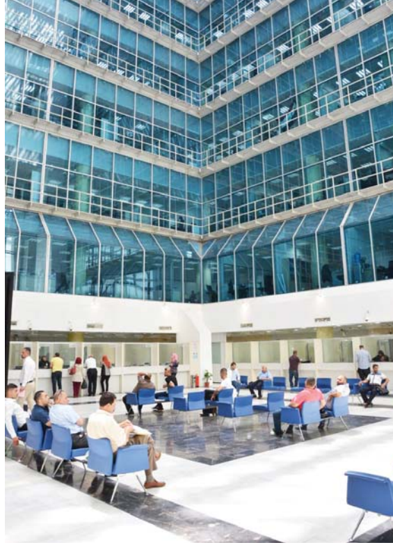
● البنك المركزي يتخذ حزمة إجراءات جديدة

وتابع أن الحكومة عملت الآن على مشروع (المسقة المتكافئة) لتباعد التجارة والاستيراد مع بعض الدول كالصين والهند والعمالات الخاصة بها من الشركات التجاريتين الأساسيتين للعراق كالكند والصين وبعض دول الجوار، لافتاً إلى أن الحكومة تدرس حالياً إنشاء منطقة حرة لاستيراد المواد ومن ثم تسويقها للقطاع الخاص وضمان إيصالها للمستهلك بأسعار تنافسية وبأبديانار، كما تدرس الحكومة حالياً