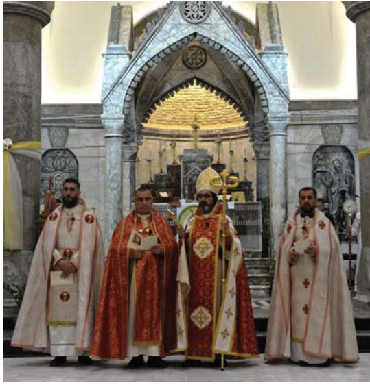
المسيحيون يمدون لممارسة طقوسهم الدينية

سبب تدمير وتجزيف مناطقهم، ووجود أسر وطوائف أخرى قفلت من غير مناطق إلى داخل القضاء، وهذا أحد أبرز الأسباب التي عززت التغيير الديمغرافي داخل مناطق المسيحيين وغيرهم من الطوائف والقوميات الأخرى داخل محافظة نينوى. بينما أكد أحد وجهاء قرية بازابوا العرقية الشريفة بمجلس الشبي (الصباح)، أنه ينبغي أن يكون هناك التزام بتعزيز التعايش السلمي والمساواة بين جميع المكونات الدينية والعرقية في الموصل، ويتطلب ذلك توفير الحماية الكافية للأقليات وتعزيز العدالة والشفافية في عمليات الاستعادة والإعمار. بحيث يتمكن المسيحيون والأقليات الأخرى من العودة إلى منازلهم واستعادة حياتهم بكرامة وأمان.