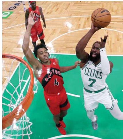
● نجوم بوسطن يتألقون