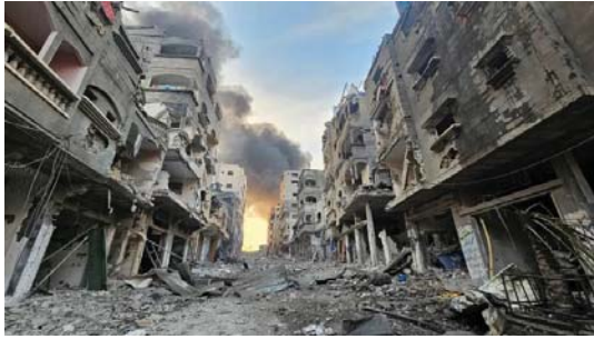
● قد تكون الضربات دمرت غزّة لكنها لم تستطع إنهاء المقاومة