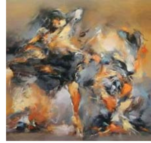
• أعمال الفنان

ينحدر الشعار من مدينة السلمية في سوريا، التي اشتهرت بالشعر والسياسة، مؤكداً: أي فنان لا بُد أن يطلع على التجارب الفنية، التي شكلت انتماءً في تاريخ الفن التشكيلي، كما أن ثقافة الفنان ودراسته هي ما تجعل العمل غنياً، وستبدو افاهيم أكثر نضجاً، وأن المهوية تلعب دوراً مهماً، وكلاهما يكمل الآخر، لكن تبقى الثقافة في العمود الفقري