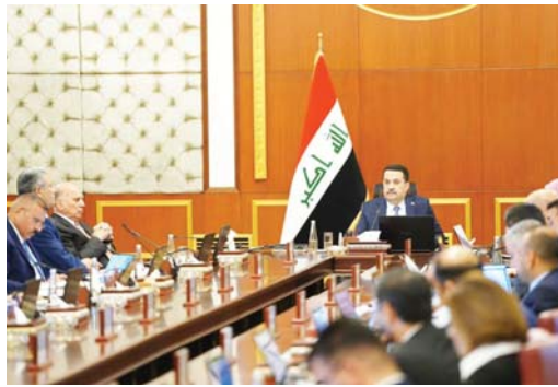
● مجلس الوزراء الشركة العامة لوائن العراق تتولى تهيئة ساحات خاصة للاستيرادات الحكومية