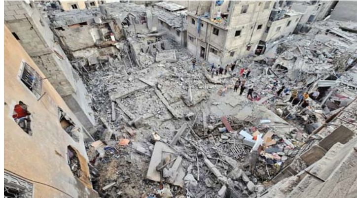
● آثار إبادة جماعية

الحزب نفسه حتى أصبح يمثل التهديد العسكري الرئيس لإسرائيل. ومنذ تلك الحرب، التي وصفها حزب الله بأنها «تصير إلهي»، تولت إيران إمدادها بكثير من القدرات المتقدمة التي صار يمتلكها الآن، على نحو جعله يضيق على الطيران الإسرائيلي في السنوات الأخيرة حرية العمل في أجواء لبنان، وابتات القدرات العسكرية الحالية لحزب الله، ومعه قدرات إيران أيضاً. أكثر تقدماً مما كانت بكثير، ففي العام 2021 أقر «كيب مكنزي»، وكان حينها قائداً للقادة الوسطى الأميركية، بأن قدرة إيران الاستراتيجية أصبحت هائلة، على حد تعبيره، ثم أضاف: «لقد امتلكنا التفوق في مسرح العمليات والتفرد على تحقيق الغلبة، أما خلفه «مايكل كوريل» فقد صرح قبل بضعة أشهر بأن الحرس الثوري الإيراني اليوم لم يعد بالامكان التعرف عليه لدى مقارنته بما كان عليه قبل خمس سنوات فقط.