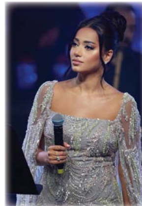
● رحمة رياض

وعلمت حلو هالشموع من تجهد وتعب حتى توصل لهذه اللحظة وبالآخر يقدر مجهودك بحصاد جائزة نجمة الفناء العربية لعام 2023. وعلى صعيد متصل ما زالت الفنانة رحمة تعيش نشوة حملت عنوان حلو هالشموع وحصدت أكثر من أحد عشر مليون مشاهدة حتى الآن