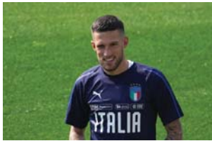
● الإصابات تصعب بالمنتخب الإيطالي