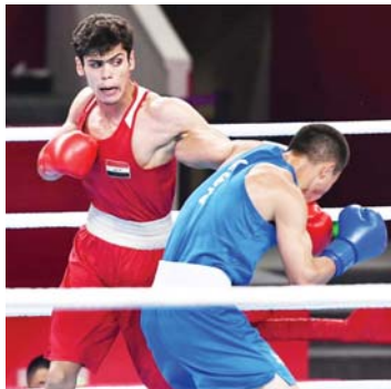
● تطوير رياضة الملاكمة من اولويات اتحاد الملاكمة