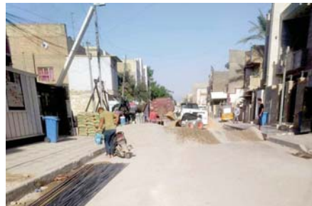
تجاوزت على الشوارع والأرصعة بشكل يثير الاستعراب