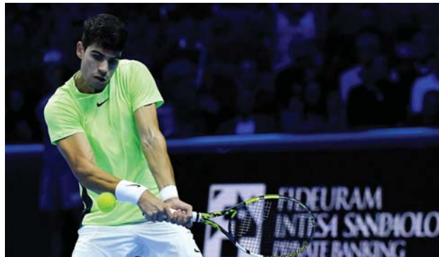
● بداية مخيبة لألكاراس

ورأى الإسباني أن التفاصيل الصغيرة حسمت المباراة، وقد خسرت لأنه من بين أصحاب أفضل الإرسالات في دورات رابطة المحترفين،