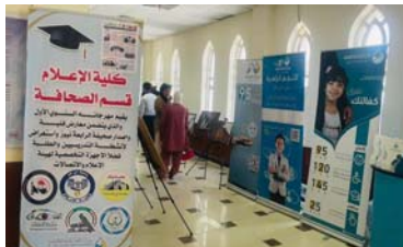
• كلية الاعلام في جامعة ذي قار