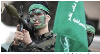
● حماس تزداد شعاعاً وتنظيماً

إن يكن من الواضح أن الحرب في قطاع غزة قد تمثل تهديداً وجودياً لحركة حماس، وربما للفضيحة التسلطية بمداهم الأوساط، فإن هذا الصراع وعزم إسرائيل المعلن على محو حركة حماس عن وجه الأرض، حتى لو كان معنى هذا خوض حرب تدمر شهوراً طويلة، ستكون له تداعياته العميقة، خلال المدى البعيد التي سيكون لها نصيب ضمن توازنات القوى والنظام الإقليمي في منطقة الشرق الأوسط ما بعد الحرب إن هدف إسرائيل وهيتها، كدولة قابلة للحياة وحامية للشعب اليهودي، مهددان اليوم أيضاً. كما أن المصالح الحيوية للمحور الإيراني برمتها في الشرق الأوسط، الذي يطلق على نفسه وصف «محور المقاومة»، والذي أمست حركة حماس عضواً رئيسياً فيه خلال السنوات الأخيرة، معلقة في الأخرى بكفة الميزان.