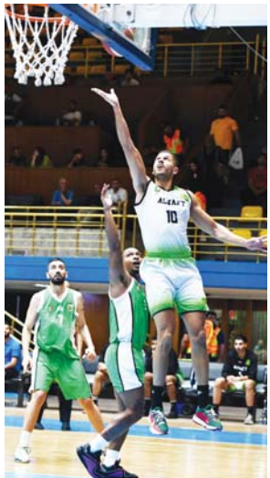
● بغداد، إحسان المرصومي

تخلط بطولة (وصل) لأندية غرب قارة آسيا غداً الخميس، بقاء بين ضمن المجموعة الأولى، إذ يلعب ممثل كرة السلة العراقية الأول ومحايل لقب دوري الموسم الماضي فريق النفط نظيره ومضيفه اتحاد أهلي حلب وذلك في تمام الساعة الثامنة من مساء الغد بتوقيت بغداد، ويلعب ضمن نفس المجموعة فريقاً سايس الليباني وشهدار كوركازان الإيراني، ويستهل منافسة الثانية في البطولة فريق الشرطة مباراته ضمن المجموعة الثانية في الثالث والعشرين من الشهر الحالي بقاء يجمعهم والوحدة السوري في دمشق، وإيضاً يلعب الرياضي الليباني مع إرتوذكس بيت ساحور الفلبين.