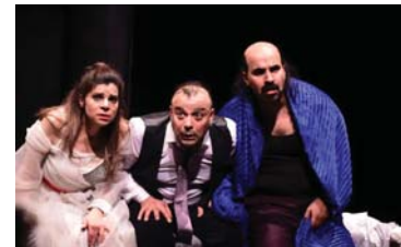
• مسرحية «حياة سعيدة»