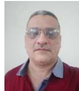
الأمن صباح الأمين كاتب وقاصي العراق