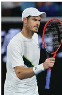
● موراي يتسحب من كأس ديفيس