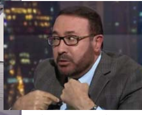
فقدان البوصلة التي يجب ان تتسم بالحيادية والخلق والحياد الإيجابي

في حوار تلفزيوني أجرته إحدى مقدمات البرامج مع سياسي كبير في حركة حماس، بعد حادثة طوفان الأقصى، كانت أسئلته مستمرة، وتمحورت حول المدنيين الصهاينة، وماذا حل بالرهائن، وهل تستعذر حماس عن هجوما لإسرائيل؟ وحينما كانت تسأله، كان الشرر يتطاير من عينيه، وتقاطعه بين الحين والآخر، وهي متحملة عليه سلفاً؟ في الوقت ذاته كانت العواجل الحمراء تهطل كالطر على شريط أخبار القنوات الفضائية، وهي تتجسعا بوقوع مئات الشهداء غاليينهم من الأضال والنساء جراء القصف الإسرائيلي على غزة.