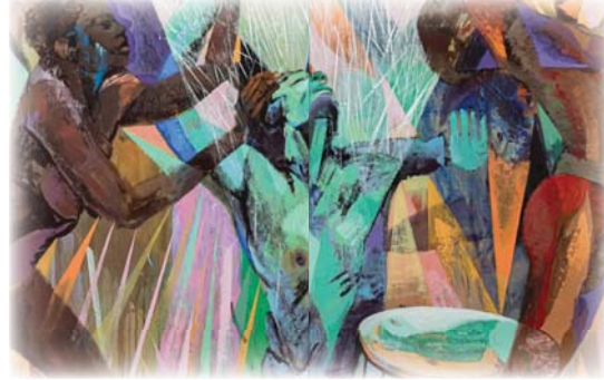
● من أعمال الفنان

كان تشي لافليس في طريقه إلى الساحل الكاريبي في جزيرة ترينيداد، كي يجمع كمية من مادة الطين لاستخدامها في أحد الكرنفالات الاحتفالية، حينما تلقى رسالة من إحدى الكنائس في المملكة المتحدة، تطلب منه إنجاز عمل فني لإحياء ذكرى إحدى الشخصيات الأفريقية، التي لم يسع عنها من قبل، ويدعى غوبينا كوغوانو.