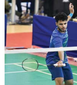
● مسكرات داخلية وخارجية استعداداً لبطولة العرب

بغداد، أوس عبدالستار ● يخوض ممثلنا الوطني فريقاً فاعلاً كركوك وأربيل في الاستحقاق العربي، اليوم الأحد، مباراتين صعبتين في ثاني مباراتهما في البطولة العربية للأندية أبطال الدوري، بنسختها السادسة لكرة اليد النسوية في العاصمة تونس، والتي تشهد مشاركة واسعة من الدول العربية ويلتقي في الساعة الرابعة عصراً أبطال كركوك مع الأفريقي التونسي، عقب ذلك مباراة بنات هولير أمام أمل الرجيش التونسي عند الساعة الثامنة مساءً. ويأمل فريق فناة كركوك خلال ظهوره الأول، تقديم لمحات فنية في الأداء ومناصفة بقية الفرق المشاركة، على الرغم من صعوبة المهمة أمام أصحاب الأرض والجمهور فريق بواقمية مع متغيرات المقابلة.