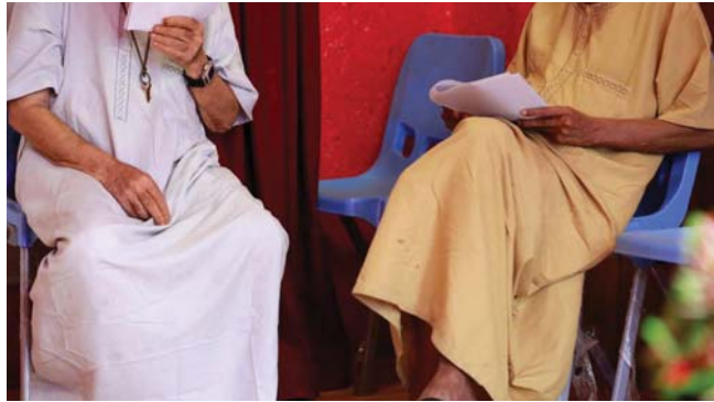
• الصحة العائلية، في العراق يوجد عاملان في مجال الصحة النفسية لكل 100 ألف شخص

مسرحي أعد لهم مدرهم الذي كان رئيساً للنفس التاهيلي وتقاعد، مع ذلك يأتيه يد المساعدة.