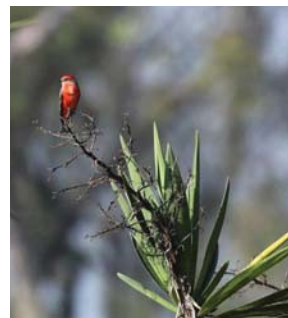
• الانشائية، تسمح للطيور بالبقاء مستقرا باقل قدر من الطاقة

وهذا الشيء الذي لا يستطيع الإنسان القيام به إلا لوقت قصير ومستلزم منه جهداً، لا يمنع عشرة آلاف نوع من الطيور في العالم من النوم ووقفاً، على ما لاحظت الدراسة التي نشرت في مجلة 'ايرينيس' التابعة لأكاديمية رويال سوسايتي البيوطانية. ورات العدة الرئيسة للدراسة أنيك أورشيد من مختبر مكانيدي ليايات الكيفيك، إذ عدم إثارة السؤال عن السبب سابقاً يعود ربما إلى أن العصفور حيوان قريب جداً ويعيد جداً في الوقت نفسه من البشر الذين أولوا اهتمامهم خصوصاً أظهرانه وسلوكه.