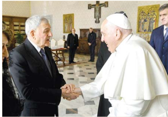
رئيس الجمهورية يشكر قداسة البابا على زيارته للعراق

أيدى رئيس الجمهورية عبد اللطيف جمال رشيد، أمس السبت، خلال لقائه البابا فرنسيس بابا الفاتيكان، حرص العراق على تعزيز الديمقراطية والتعددية واحترام الحقوق والحرريات. وذكر بيان رئاسي، أن "رئيس الجمهورية، والسيدة الأولى شاناز إبراهيم أحمد، التقيا بابا الفاتيكان،