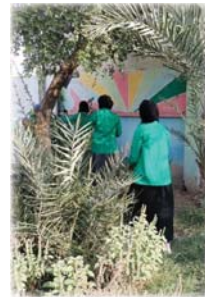
حملة «مدرستي خضراء»

أطلقت مديرية بيئة ذي قار، حملة واسعة لتشجير المدارس حملت شعار مدرستي خضراء في إطار سعي وزارة البيئة لحماية وتحسين المناخ في الجنوب الذي يعاني من تأثيرات التغيير المناخي.