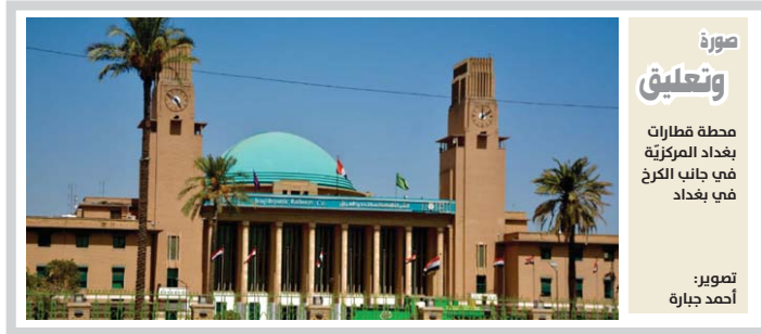
صورة وتعليق محطة قطارات بغداد المركزية في جانب الكرخ في بغداد