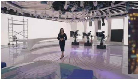
غياب التدريب الاعلامي