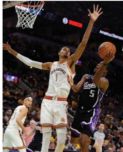
● الاشارة حاضرة في دوري الـ NBA،

وبخ رصيد المخضرم الآخر كيفن دورانت 38 نقطة، 9 متابعات و9 تمريرات حاسمة، خلال فوز فريقه فينيكس سنز على مضيفيه يوتا جاز 131-128.