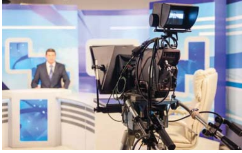
مصادرة رأي الشيف وثائرة سجلات انشعابية