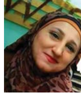
أميرة إبراهيم (كاتبة سورية)

العربية يدور عن قرار يخض الثورة النطبية؛ فاستقبلت القنسة ضيفين أحدهما خبير نطقي كبير، وسبق وأن شغل منصب وزير التمدد منذ سنوات بعيدة، وعلى الطرف الآخر كان الضيف صغيحاً شاباً لم يكمل الثلاثين من العمر، فأخذ الأول يتحدث عن تفاصيل قبية وبالأرقام، بينما لم يفتح الطرف الثاني إلا بالحدوث بشكل عام، وبالتالي مال المشاهد إلى رأي الأول؟