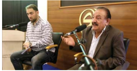
• جانب من جلسة إقامتها مؤسسة المدى

وجع من الشباب الحاضرين في مؤسسة المدى للإعلام والثقافة والفنون في شارع المنتهي صباح يوم الجمعة الماضي. سلطت الجلسة الضوء على الأدب والتمسك الفلسفني وجولاته التي تصدت بقوة للاحتلال وكيف كان للكلمة دور في شحن همم المثاقين وجعلهم يقاومون العدوان للبقاء في منازلهم دون التخلي عنها.