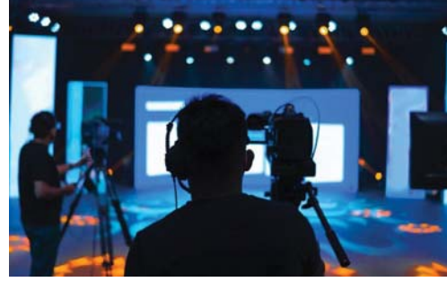
برامج الإعلام السياسي تملك قاعدة عريضة من الجماهير