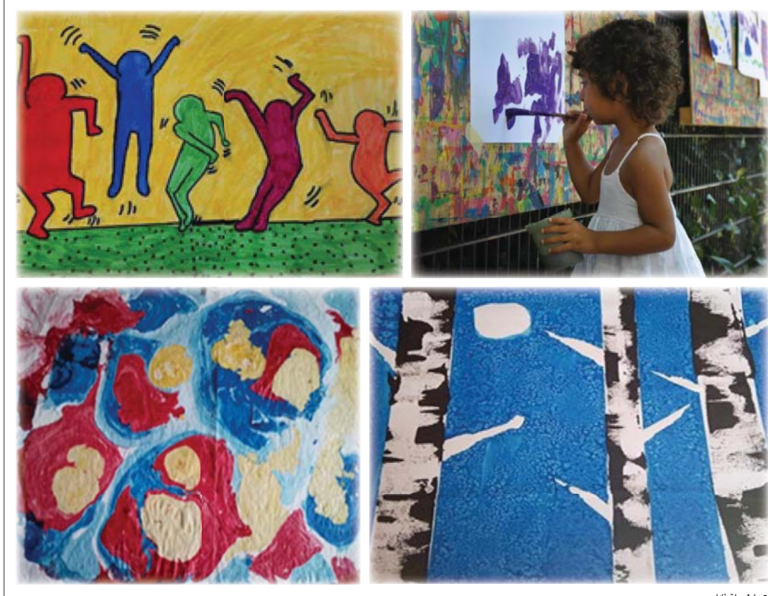
● من لوحات نايا

وأم فلسطينية رسومات تعبيرية حيوية تحاول من خلالها الحفاظ على ذلك الارتباط الوثيق الخفي بين الألوان واللغة، وما تبقى من أشكال وخطوط لا تفصل أبداً عن عولمتها الطفولية، مثل اللون الأحمر الذي يغطي اللوحة بتوجاهة الساحرة على الرغم من وجود بعض الأزرق هنا وهناك كالأسفر والأبيض، وإن برز الأزرق إلا أن المتلقي سيفكر بحجم ألم ودمار العالم الذي تجسده نايا هنا، ولكن بعفوية فنانة، كما في نص البنت التي تضريني في المدرسة صارت صديقتي أنا لم أضرها أبداً قلت لها أنا أحبك طمأناً تأذني؟ أنا العيب تاكونندو وأقدر أن أضر بك لكتني أحبك ولا أريدك أن تبكي صرنا