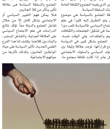
● تأثير السياسة على حياة المواطنين العاديين

● مسلم غائب تتمت بقضايا كالمساواة الاجتماعية تستعكس هذه الواجه في السياسة أيضاً وفي المقابل، كل ما كتبت الثورات والصراعات الطائفية والقبلية في المجتمع، كل ما انعكس ذلك سلباً على المؤسسة السياسية. لا يمكن الفصل بين الممارسات الاجتماعية والممارسات السياسية وهذا ما يدعوننا إليه علم الاجتماع السياسي يهتم هذا الفرع من العلوم الاجتماعية الحديثة بدراسة دور المجتمع المدني في التغيير السياسي ويسلط الضوء على الدور الذي تلعبه وسائل الإعلام، الأحزاب، الشرائح الاجتماعية بالمؤسسة السياسية، والسياس، والطبقات الاجتماعية، بما فيها الطبقة الوسطى في التحولات الديمقراطية والتنمية السياسية. يكشف لنا علم الاجتماع المعرفي لعم الاجتماع السياسي، للديمقراطية، أو تقييدها، الدكتوراه، الواقع السياسي مرآة لواقع المجتمع في المجتمع لا يمكن الحديث عن التنمية السياسية دون السعي إلى تحقيق التنمية الاجتماعية. خلق الأرضية المناسبة للمبادرات المجتمعية في شتى المجالات، من شأنه تعزيز المشاركة والمشاركة الاجتماعية لدى المواطنين ويمكن اعتبار خطوة أساسية في مسير التنمية الشاملة. وأخيراً، يمكن القول إن العلاقة بين المجتمع والسلطة السياسية هي علاقة متبادلة وتؤثر من كلا الجانبين. فلا يمكن فهم التغيير السياسي أو الاجتماعي بشكل كامل إلا من خلال تفاعل المجتمع والدولة معاً. تؤكد نتائج الدراسات في علم الاجتماع السياسي على العلاقة الجدلية، والتفاعل المستمر، والبيئتين بينهما. كما كشفت لنا هذا الفرع العلمي الحديث، تأثير السياسة على حياة المواطنين الماديون، وكذلك تأثرها من جهاتهم الاجتماعية.