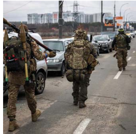
مباري الممن غير أمنة وسط الحشود العسكرية