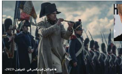
• خواركين فينبكس في نابليون، 2023.