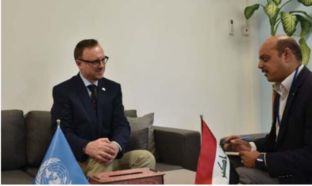
• ريتشتر، التحقيقات في جرائم معقدة ارتكبت من قبل منظمة إرهابية تحتاج إلى سنوات

كشف رئيس فريق «يونيتاد» التابع للأمم المتحدة تعزيز المساندة من الجرائم التي ارتكبتها عصابات (داعش) الإرهابية، عن أريضة أكثر من 10 ملايين وثيقة تخص جرائم داعش حتى الآن، فيما يقدم الفريق الدعم 20 دولة تلاحق العناصر الإجرامية في التنظيم الإرهابي لحاسبتهم على الجرائم الدولية التي ارتكبوها. وقال رئيس الفريق، كريستيان ريتشتر، في لقاء أجرته معه الصباح: إن جهداً كبيراً من عمل الفريق تنصب حالياً على دعم جهود عمليات الحفر واستخراج وفات ضحايا (داعش) من التقارير الجماعية، والرخصة المتمثلة بالملفات الموجودة لدى المحاكم والجهات القضائية والتي يتقدر عددها بنحو 10 ملايين وثيقة من المخلفات التي تركها التنظيم الإرهابي ونحوي الكائل من الألةة بخصوص جرائمهم، فضلاً عن كم هائل من المعلومات بشأن أفراد التنظيم وأعداءهم وروايتهم والأمر التي كانت موجة لهم، وكيفية التعامل مع (السبايا) وهذا العدد من الوثائق ليس الرقم النهائي.