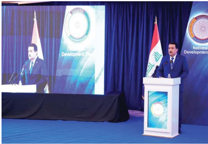
• السوداني، حجم التحديات يتطلب خطة متكاملة تستهدف تحقيق نهضة شاملة