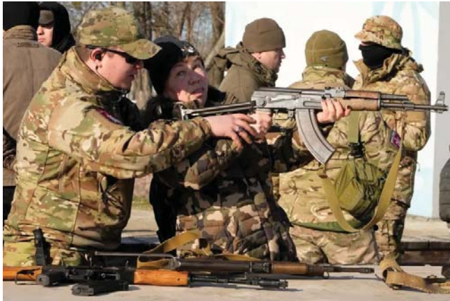
التألق دفع بمرتزة إلى الجبهة الأوكرانية