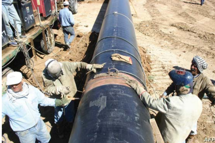
• عملية ضخ النفط من العراق إلى تركيا عبر خط أنابيب كركوك-جيهان