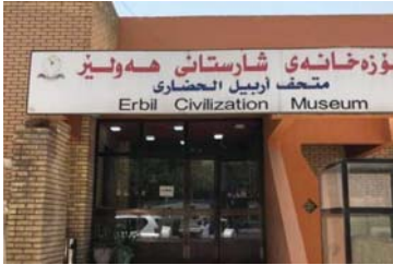
• مدخل متحف أربيل الحضاري

خسائر فادحة ويكتبد العراق خسائر مالية فادحة بشكل يومي منذ شهر آذار المنصرم، فضلاً عن المخاطر السياسية التي باتت تهدد الاستقرار في إقليم كردستان الذي تضرب كثيراً، بسبب توقف تصدير النفط إلى تركيا، وقضاقت الأزمة بعد كسب العراق دعوى فضائية لدى المحاكم الدولية تؤكد سيادته على إدارة ثروات البلاد وفرض تعويضات مالية