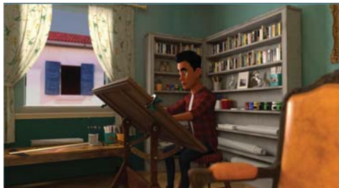
• مشهد من فيلم الانيميشن تخطيط

لا تتجاوز العشرة دقائق، ذات مستوى فني وتقني متقن متقاربت ويعتمد المخرج عبد الكاظم على مادي الصناعة تحتاج إلى دعم مادي وإنشاء مراكز على مستوى مقدم ترتقي المستوى الدولي ومعاييرها الفنية والتقنية. ويجسد صاحب فيلم "بندرة" فان هذه ليست المرة الأولى التي يشارك فيها فيلم تخطيط في المحافل السينمائية الدولية، إذ عرض في روسيا وبلغاريا وإيطاليا وكوسوفو والهند وتونس والجزائر وسلطنة عمان والكويت. حازت أفلام المخرج عبد الكاظم عشرات الجوائز المحلية والدولية، منها الجائزة الأولى لورنتز