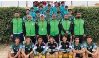
● نتائج متميزة لمنتخبنا المدرسي

بجاجة إلى عمل تدريبي متواصل والجماعي، لغرض الارتقاء بالجانبين وتصحيح دائم في الشقين الفني والبدني.