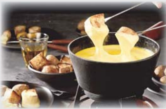
• طبق الفوندو

ونشرت الصين أخيراً خطة لمكافحة انبعاثات غاز الميثان، من أبرز ما تلحظه إقامة مشاريع مبتكرة لمعالجة مخلفات الطعام، وستستعين شنتهاي مئلا برفاق ذباب الجندي الأسود (Hermetia illucens) للإفادة من هذه النفايات، وفي مصنع لإوغاخ للمعالجة، توجد غرفة ضخمة تضم 500 مليون يرقة مخلفات الطعام يومياً، على ما شرح نائب مدير الموقع ويوفينغ. وعند التبرز، تفرز هذه اليرقات مادة تستخدم كسماد، وهذه اليرقات نفسها، عند نسيبها جيداً، تتحول غذاء للماشية في المزارع.