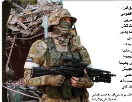
جندتي روسي قرب إحدى الميادين المدمرة في أوكرانيا

عن مجلة "ني ناشنال إنترست" THE NATIONAL INTEREST