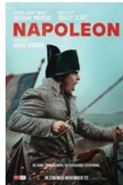
• بوستر الفيلم

نحو صميرها بوصفها "ألمة العظيمة"؛ أو ما إذا كان غروره الجامع لم يجلب سوى الخراب والدمار. حاول مخرجون عدة تتبع حياة نابليون في مسيرة أمجاد: لكن سكوت قدم في فيلمه مسيرة فرسان معتمة؛ لا يسمح فيها على مدى ساعتين ونصف لفراته بالتعثر في منتصف الطريق خلال ضارص موحلة ذات دمالات حقيقية أو ميثافيزيقية، وهي القضايا التكتيكية التي هزمت صالتي الأفلام الآخرين. تصور سكوت بصفاة نابليون وهو يصف الإهرام خلال الحملة على مصر، ويشهد إعدام الملكة ماري أنطوانيت بعد الثورة؛ ولكن ليس إهانة الملك لويس السادس عشر من قبل الخوارج؛ وهو أمر قد شهده نابليون فعليا على الأرجح. كما تتحاشى المخرج وكاتب السيناريو ديفيد سكاريا (من باب المراءاة على الأغلب) أن يذكر إعادة نابليون للعبودية في المستعمرات والأمم، صوره ثالثة مشروقة للإمبراطور التكتوب من الممثل "خواركين فينبكس" الذي يتناسب وجهه الساخر مع إطار التهمة ذات القرنين والذي العسكري ثلاثي الأضواء. قدم فينبكس دور نابليون كبري عسكري وطاووس المجالس، الذي لا يتحلى على ظهر حصانه. قد يرى آخرون أن نابليون شخصاً حالماً وصيداً؛ لكن بالنسبة لسكوت يشكل نابليون أحد أقطاب ثنائي قوي: إذ يقع بحماسة وبأس في حب جوزفين العاطفية العملية التي لمحب دورها فانيسا كيربي.