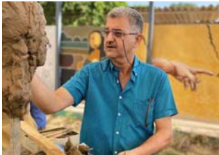
أوان تتنسم الهواء المثلق

أقام قسم التشكيل في كلية الفنون الجميلة، جامعة واسط، السمبوزيوم السنوي الثاني على حدائق الكلية. وقال عميد الفنون الجميلة الدكتور علي مولى: إن الهدف من المهرجان هو توضيح آية وأسلوب تنفيذ الأعمال من قبل الأساتذة ونقل تجاربهم وفتح المجال أمام الجمهور المحلية لتطوير قدراتهم، وأكد: تتوعت الأعمال بين الرسم زيت وكراتك، والتحت، والخزف.