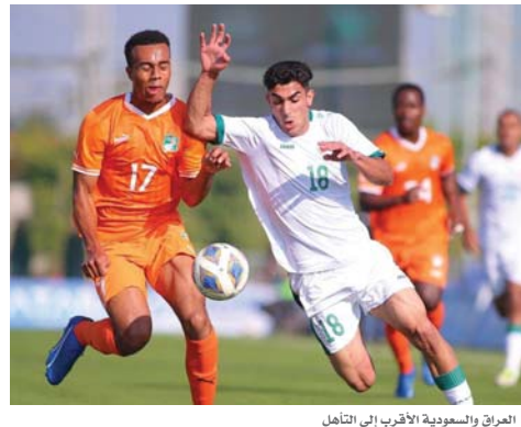
● العراق والسعودية الأقرب إلى التأهل