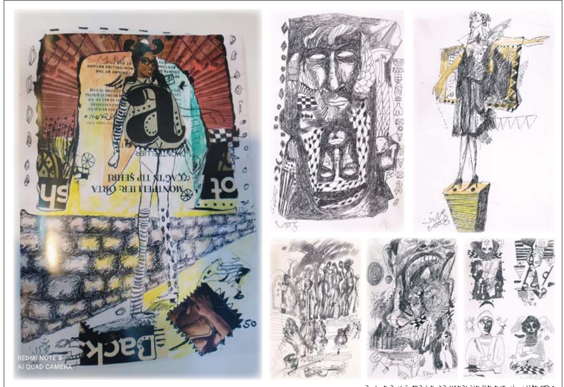
● هكذا الأغا عبر أعماله المعلقة المتفعلة الشائنة في البنية الاجتماعية والسياسية

إعادة صياغة وتشكل جديد اخصت به قدرته التخيلية على طرح رؤى تفتتح على إمكانية توفير فرصة وممارسة تأويلية للمتلقي