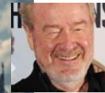
• المخرج ريدلي سكوت