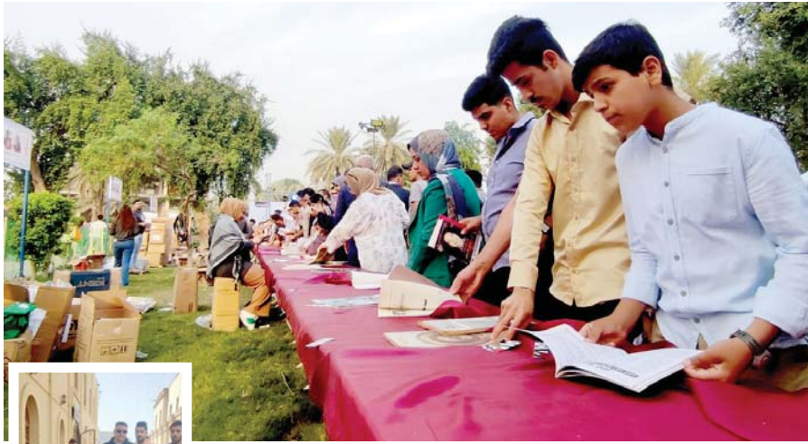
● يحتفلون في فضاءات واسعة