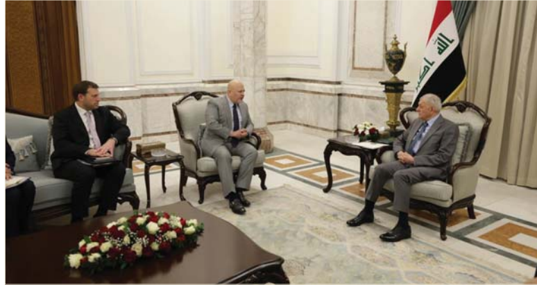
• رئيس الجمهورية يبحث على تكاتف الجهود لمنع تكرار جرائم «داعش»