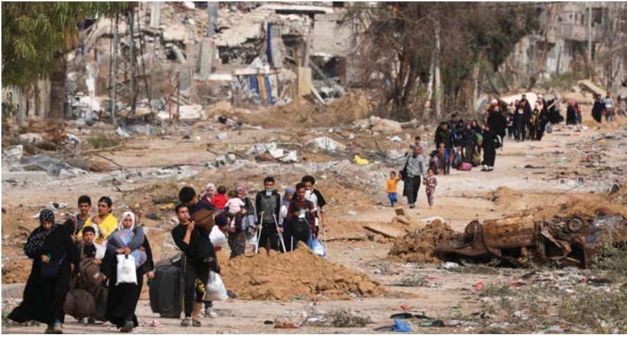
قال رئيس بلدية غزة، يحيى السراج: إن المعاناة لا تزال على أشدها في كامل القطاع، وأن الاحتلال يعرقل عملية إصلاص البنية التحتية، وهو ما يصبغ جهود فتح الشوارع وتشغيل آبار المياه. وأضاف أن الاحتلال يمنع الناس من العودة إلى بيوتهم وتدفقها، مبيّناً أن نحو 700 ألف شخص في المدينة يحتاجون للخدمات.