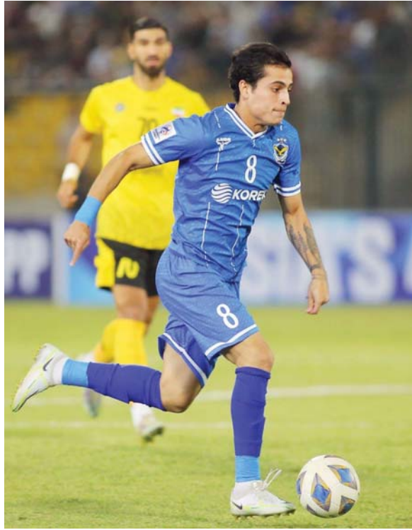
● اختيار جديد للصور