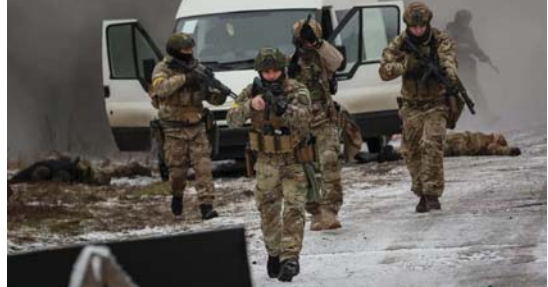
جنود اوكرانيون يقدرون منطقة ساطعة

توقع بعض الصحفيين أن عدم شعبية هذه الحرب، نظراً لارتضاع أعداد ضحاياها المقترن بقتل آباء العقوبات، يمكن أن تجعل الشعب الروسي ينجذب على بوتين، لكن هذه التوقعات كانت بعيدة عن الواقع في الأخرى فالتاريخ الروسي مغمم بأخبار الزعماء الذين