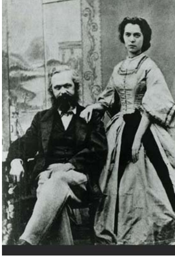
● ماركس مع ابنته الكبرى جيني في 1866

شريعة في مخدع أحدهم، والأخر كهل فاسد يدبر مآخروا لنساء الليل أفق مخدراهن في رهان خاسر، والثالث لصا محترفا، ليس بالضرورة القول، إلا أحد من رجالا حكومة باريس كان معتقلا في برج الموت.