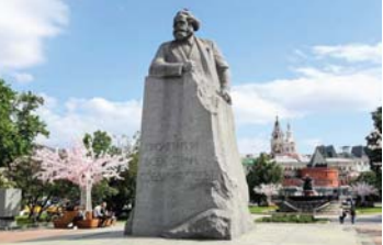
● اشتعل ماركس بتدمير اللاهوت الذي قدس الملكية الخاصة من غير حق

● مطالب كاظم باستثناء كارل ماركس، الذي عانى صراعاً عنيفاً لم يختبره أي مفكر سوسيولوجيا آخر من قبل، هو، بسيطرة شيوعية، كما تخلص بلاء إرادته من برائن التمدد البالي، إلا أنه لسبب ما سيطر ماضيا لزمان طويل، اعتنق الكاثوليكية، حدث هذا الأمر الميراثي قبل أن يتسلك هذا، وحاصل مبنى الاريخاشاغ بنصف قرن. ليس بالضرورة تذكركم أن رفاق الفوهرر الناشيون لم يكونوا السبب في استبدال شريعته التهودية بدین آخر، لم يكن مصطلح عداء السامية متداولاً بعد، والذي سيرف لاحقا