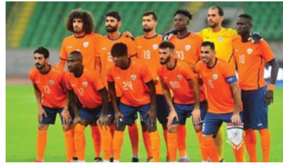
● اختيار مهم للكهرياء