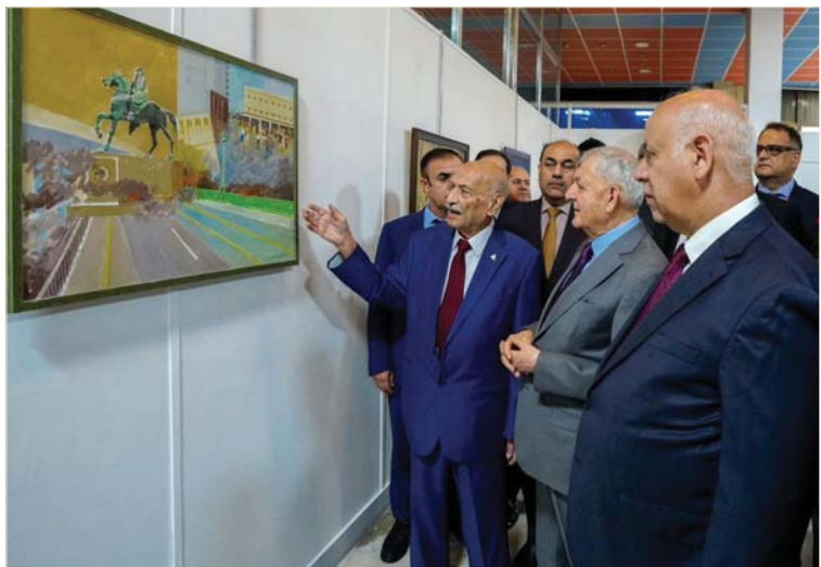
● رئيس الجمهورية، للثقافة العراقية مكانة متميزة على صعيد العالم