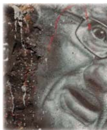
• سقطة هابرماس في حراسة للعقل العربي في أن يعيد حساباته

ورغباته، فالحقيقة العقلية المجردة عند الإنسان وهم لا يمكن الوصول لها، لأن أي فعل لدى الأفراد والجماعات خاضع لغاية وهدف ومصطلح سواء كانت خيرة أو شريرة. فندما يتفق لنا الفيلسوف الغربي الأثيني هابرماس وهو ينظر إلى حقيقة القضية الفلسطينية بين واحد، يبدأ عن عقل الأطفال، وتغيير الإنسان عن بلدهم، واعتقال وسجن وتعذيب الأحرى المنتهضين، وتضرب المنتهضين بالتقاليد الحمرية دوليا، ما هذا إلا دليل على الحقيقة لا يمكن فصلها عن عاطفة ومشاعر وتعبات الإنسان للعادي، المنتفض، فكك الحقيقة التي يؤمن بها الإنسان، تكون حقيقة العقلية التي لا كلاب بحسب موقع الفرد أو البعد عنها، وهذا المسألة تصد من قبل عدة عوامل مختلفة سلباً أو إيجاباً الاجتماعية والدينية. فضفظة هابرماس هي سقطة للفلسفة الغربية التي اتعت العرب على استخدام أزموتها في التفكير اللغوي والادبائي، وهذه فرصة للعقل العربي أن يعيد حساباته، وأن يتعلق في بكرة وفي ظل التعددية الثقافية للعالم اليوم، فتنق حقيقتنا من وفق مقاييسنا ونهب عقولنا الرغوة والإبداع