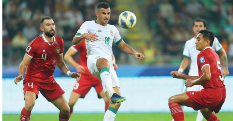
● لاعبوا الجولون تحت مظهر كاساس

الكثير من اتحاداتنا الرياضية أكدت أنها غير منمعة بالمعالجات التي كثيرا ما صدرت من المكتب التنفيذي للجنة الأولمبية، بخصوص تقنين المشاركات الخارجية غير المنتجة أو المفيدة