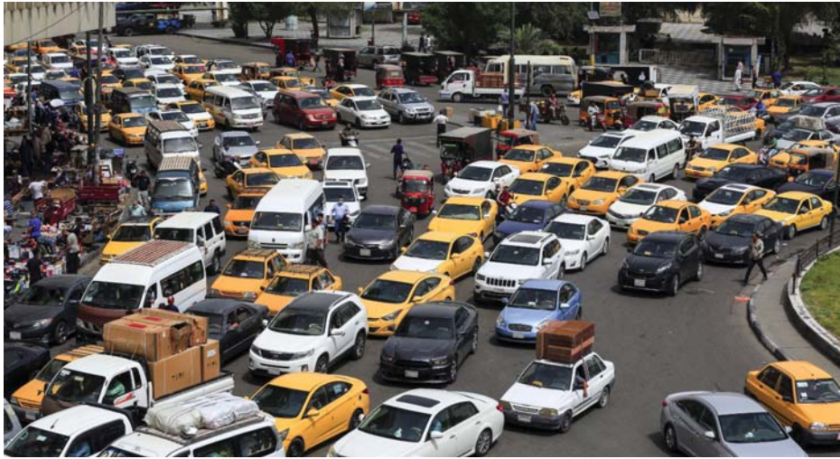
• عجز الشوارع عن استيعاب الاعداد الكبيرة للسيارات والمركبات