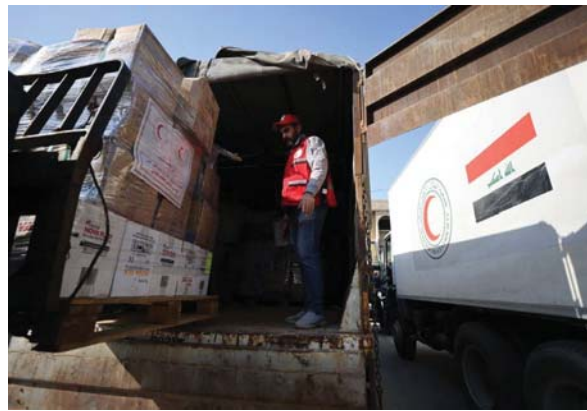
● شحنة جديدة من المساعدات العراقية الإنسانية إلى الشعب الفلسطيني في غزة

وأعضاء مجلس المفوضين والمديرين العامين في مفوضية الانتخابات والموظفين المختصين واللجنة العملياتية المختصة. في غضون ذلك، وصل نائب قائد العمليات المشتركة رئيس اللجنة الأمنية العليا لانتخابات مجالس المحافظات، الفريق أول الركن هيس المحمد، أسس الاثنين، إلى محافظة ديالى على رأس وفد أمني لتأمين الجهود التي تبذل لإجراء انتخابات مجالس المحافظات 2023. وذكر بيان لقيادة العمليات المشتركة أنه فور وصول الفريق أول الركن هيس المحمد إلى مقر عمليات ديالى عقد اجتماعاً أمنياً موسعاً مع القيادات الأمنية والعسكرية والاستخباراتية ومدراء مفوضية الانتخابات