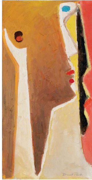
• لوحات الرسام ديفيد بارك

الأقصى التي سرقت عُشبة كلكامش وجدها ذات أسطورة كانت نائمة فوق الرمل. كانت، بالأحرى، تنظّاهز بالنوم. ولمّا كُتبت ممتوتياً بالدنيا وكلكامش هنا أفرغ منها. بل قُتلتها. أحسّأً سرقت عُشبة الخلود من كلكامش وتركتها لواجه خبيثة الكبرى؟ رفعت الأغمى رأسها، وقالت نعم. فكُتبت كما أنا محظوظة إذ أنفكنا أريد من سُرّ خلودك شيئاً، فالت يا هذا لا خلود لك أبداً، إلا أن تحمّلتني حول عنقك لئلا تبار، وتحمّل غضبي ونزواتي حتى أنّي قد أنفُت على عنقك حين أُنشأها قلت مرعوباً لا لا لا لا فالت لم يبقَ أمامك إلا أن تبتمني إن شئت شيئاً من سُرّي. لكنّي سأنتقم طوال العمر فجلدي يتعزّر أبداً ونزواتي وتقرّفي تتعزّر أبداً فيما أنت تستبتمني بدمع من حافيتين وقب مدهول. سبحرقت الشمس وبعدتُك العظمى، الجوع وبعدتُك الحرمان لا أظنك تحمّل هذا كله فاغرب عن وجهي يا هذا ... اغرب عن وجهي يا هذا الإنسان، والعيب لعمة خبيثك بعيداً عني يا حفيد البائس كلكامش!