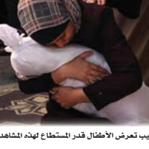
• علينا تجنب تعرض الأطفال قدر المستطاع لهذه المشاهد