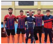
● الفريق الفائز بالبطولة