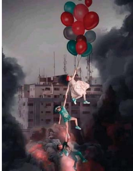
• ملائكة تحت القصف، صورة بالذكاء الاصطناعي

إن مهام أدب المقاومة وسماته الأساسية تكمن في التخفف من آباء، الرمز وتكثيفاته الدلالية واعتماد الواقع كأداة أساسية في المواجهة، فكما يقول احسان عباس في سياق قرآنه لأعمال كفتاني إن من أثر أدب كفتاني يحسن أن الرمز لم يعد ضروريا، وإنما أصبحت مواجهة الحقيقة هي الشبه المهم، وفي نص الشهداء الملائكة تكثر عدم ضرورة الرمز. تكمن هذه الميزة في شفرته التي لا يعني تجريده النص من شفرته الحقيقية، بل التأكيد على ضرورة أن يعي النص وهو يسعى لأن يتوسطه ضمن هذه المواجهة، بأن يتخفف من الرمز الضمني إلى الغموض والاستعانة بعناصر جارية يكتسب من خلالها ضمانات موضوعة ضمن مستواه الحقيقية والجمالية. ونص الشهداء الملائكة استعان بعناصر جمالية كالاختزال والتكثيف والاقتصاد، الإحالة، التي فرضت هذه النوعية من الغموض، لكنه الغموض الذي يعبر عنه، بيبير زيمبا - بلانه، المنتق من رؤيا أنه لا يمكن أن يكون لفرن صريحا يسلم نفسه من الآخرة الأولى بوضوح كامل، لأن يستعين بعناصر أخرى كثيرة مختلفة وهو يعطي تعبيرا غير عادي بأن يعبر عن الأشياء العادية بأسلوب غير عادي، وغير مأثور، تحتل التزيينات شذوته دورا مهما في إحداث تعريبات النص وإشارته الجمالية.