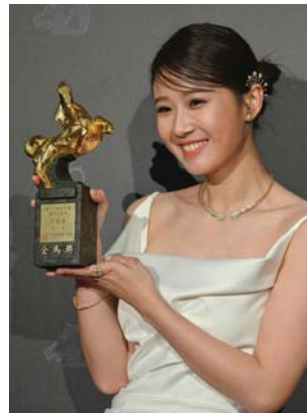
المثلة التايوانية بياتريس فانغ، تحصلت جائزة أفضل ممثلة مساعدة في فيلم "Day Off" في حفل توزيع جوائز Golden Horse Film الستين في تايبيه...