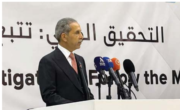
● زيدان، نجحاً بمصادرة الأموال المتحصلة من جرائم غسيل الأموال

وأضاف، أن "العراق نجح بمصادرة تلك الأموال، وهو دليل على التزامه بمتطلبات مكافحة غسيل الأموال وتمويل الإرهاب وفقاً للمعيار الدولية، إذ يسعى العراق بالاشتراك مع مختلف الجهات إلى رفع كفاءات المختصين في هذا المجال في الأجهزة المعنية بإنفاذ القانون، وزيادة وتطوير الموارد البشرية المختصة بمعالجة الجرائم التي تنسب بها هذه الأموال، ليتمكن من تعمية الحاجة العملية في مجال التحقيق المالي الموازي". وأكد، أن الجهود تتصافر بالتنسيق مع مختلف الأجهزة المعنية لتجاوز عقبة التتبع والصعوبة التي تتميز بها الجرائم المالية، من جانب، أعرب رئيس مجلس القضاء في