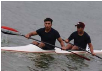
● تحضيرات متواصلة للاعبين الكانوي