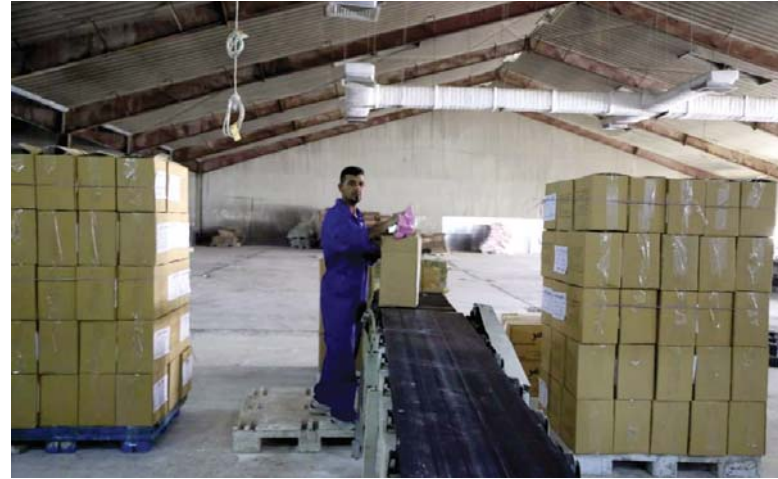
إحياء الصناعات الغذائية يشغل الاقتصاد

شدت وزارة الزراعة على ضرورة النهوض بالصناعات الغذائية، والعمل بشكل حقيقي على إحياء هذا القطاع الذي من شأنه دعم اقتصاد البلد والمحافظة على القيمة الغذائية والاقتصادية للمنتج. لافتة إلى أن القطاع الزراعي بمقدوره تحقيق الاكتفاء الذاتي وتأمين جميع المنتجات للأسواق المحلية، لاسيما في حال تفعيل صناعات الأسمدة والمكننة ومنظومات الري بالرش والتقطيع والمبيدات والمقاحات والعلاجات البيطرية والأمور المتعلقة بمكافحة الآفات.