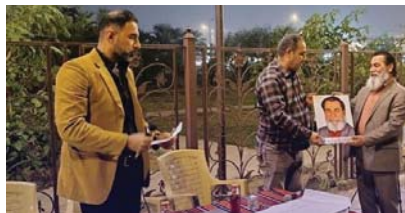
أسية عن الشاعر الراحل كريم العراقي

كريم شارع الثقافة في ذي قار، عدداً من مبدعي المدينة، ممن حصلوا جوائز فنية وأدبية هذا العام، وقال الفنان خزعل، الاحتفاء بمنجزاتنا الفنية والأدبية دافئ ليزل المزيد من الجهد والعمل الجاد في المشاريع المقبلة التي ستكون لها بصمة على الساحة الفنية. بينما أعرب الفنان عمار السيف عن شكره وتقديره لهذا الاحتفاء الذي ينظمه فريق شارع الثقافة الذي واكب الإنجازات التي حققها فنانو المحافظة على