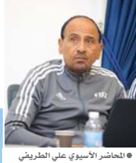
● الحاضر الآسيوي على الطريفي

وقال عضو اللجنة الاستراتيجية لتطوير التحكيم والحاضر في لجنة الحكام في الاتحاد الآسيوي لكرة القدم على الطريفي في حديث إلى «الصباح الرياضي»: إنّ «الوائح القارية والأنظمة الدولية زكراً كثيراً على أهمية أن يكون قرار الحكم دقيقاً لحظة الرجوع إلى تقنية الـ (VAR) حتى لو استغرق الأمر الانتظار طويلاً من أجل التأكد من صحة الحالة التحكيمية المشكوك في صحتها. ويوجد أنّ تأخر بعض الحكام في اتخاذ القرار عبر تقنية الحكم الفيديوي المساعد أمر طبيعي