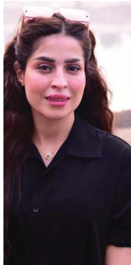
تصوير نور القيسر • روكيان الوادي

يعدّ الصحفيون تاج الديمقراطية، والمسيرون عن جوهريها، ولكنّ المفارقة الغربية أنهم الشريحة الأكثر عرضة للإهانة والضرب والاعتداء، والأغرب أنّ من يعتدي عليهم نقر من زعاطيط الحمايات، وقمة الغرائب تتمثل في أنّ هؤلاء الزعاطيط هم حمايات المسؤولين، وأحياناً كبار المسؤولين في البلد، أعني بالذات المسؤولين عن الديمقراطية وحمايتها وتطبيقها، ولكنّ نجيب الإعلاميين بصورة عامة، والصحفيين بصورة خاصة مخاطر الاعتداءات باليد أو اللسان، وتصون كرامتهم وهيبتهم، اقترح أمين، أحدهما إنزال أقسى العقوبات التأديبية بمن يتطاول أو يعتدي، دينار شهرياً لكل صحفي تحت تاب (مخصصات مخاطر المهنة) ويهذه المناسبة أصبح الحكومة أنّ تأخذ به، ولا تعفل من الرقم، فهي لكي تدرسه يجب أنّ تهيئة لجنة متخصصة، كما يجب الاستئناس برأي وزارة المالية والتي تتولى بدورها تشكيل لجنة لدراسة من كل الجوانب، ولكي يصل المقترح الى البرلمان وتجري قرأته قراءة أولى وثانية، ولكي يكتمل النصاب، ولكي يعرض للتصويت، تكون قد انصرفت 4 سنوات، وسوف ترق رئاسة المجلس (بعد 4 سنوات بالطبع - وهي رئاسة جديدة) أنّ العراق استعاد عافيته وديمقراطيته وقوته ولن يتساهل مع أي اعتداء أو معتد حتى لو كان من الحماية، وبالتالي لا يوجد مبرر لتبديد الثروات على حياة الصحفيين بحجة المخاطر، وعندها سيتم التصويت ضد المقترح بالإجماع، وهي أول حالة يتفق عليها أعضاء البرلمان المختفون في كل شيء، وعلى كل شيء!