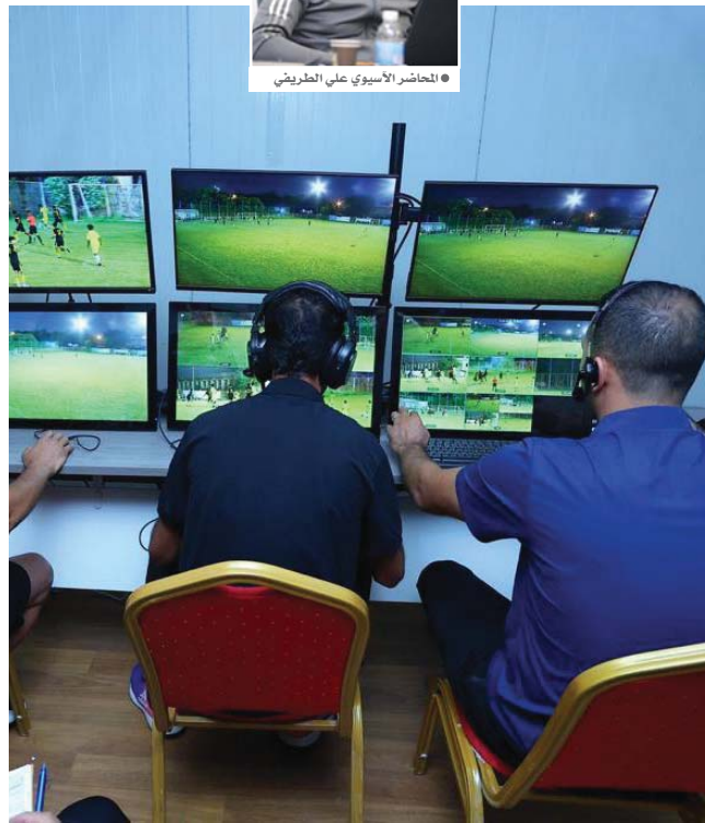
● قرارات VAR تثير الكثير من علامات الاستفهام

وكان الاتحاد المركزي لكرة القدم قد اقام قبل أيام ندوة بشأن تقنية الـ (VAR) في مقره، وقدم فيها المحاضر الآسيوي على الطريفي شرحاً وافياً لنكس الحالات والاستفسارات التي تتعلق بهذه التقنية وألية استخدامها، وتوقيت الرجوع إليها. بحضور الإعلاميين والحكام وشهدت عرض عدد من الفيديوهات التوضيحية.