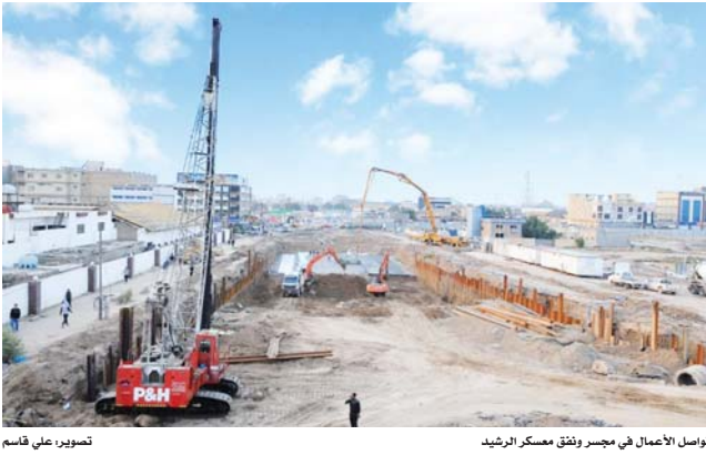
● تواصل الأعمال في جسر وفق معسكر الرشيد