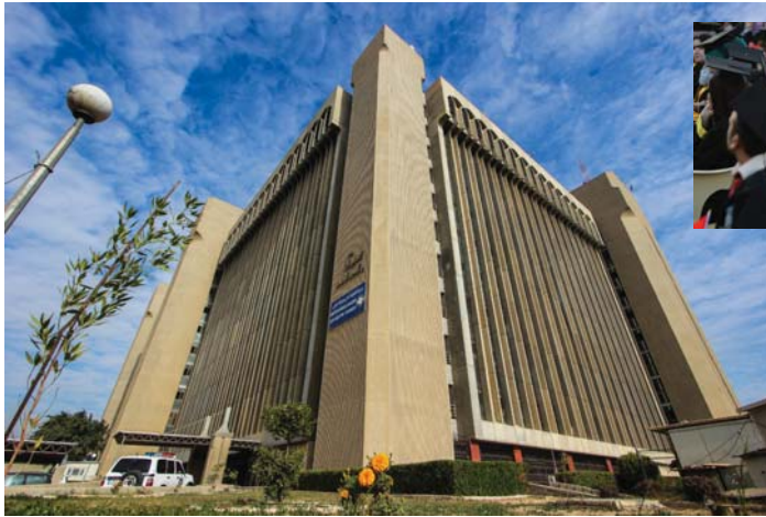
• تحثيرات من وزارة التعليم بإيحاء الطلبة بالقبول في الجامعات الأهلية