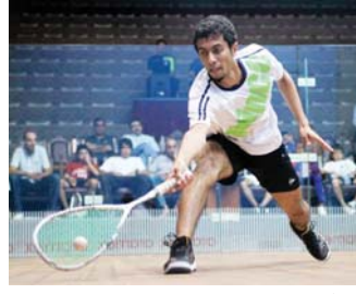
● الاسكواش ينتظر موافقت 5 دول

أبدت 3 دول موافقتها على المشاركة في بطولة غرب آسيا للموهل امامتها في محافظة السليمانية أواخر شهر كانون الثاني من العام المقبل، بينما ينتظر اتحاد اللعبة موافقت دول أخرى للتواجد في هذا المحفل القاري.