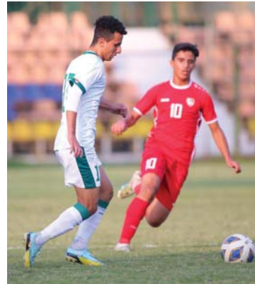
● ناشتو يجتازون سوريا وديا