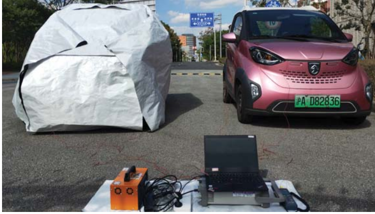
• العباءة الحرارية الجديدة تغطي سيارة وسط أجواء حارة في مدينة شنغهاي

بعض تلك الحرارة بالداخل، فعملها يشابه ما تؤديه بطانية النجاة المازنة.