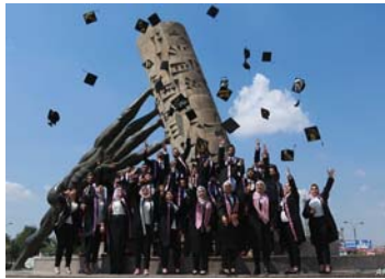
• تكثار عددي للتلكيات الأهلية في العراق

رؤية منوهاً، أن العراق بعد التغيير أصبح يعتمد على القطاع الخاص في جميع المفاصل إذ كان العراق في السابق ذا رؤية اشتراكية، وأن الدولة هي التي تحكم كل شيء، بما فيها قطاع التعليم العالي، أما اليوم فالحال تفتت كثيراً فيجب على الدولة أن تسمح للقطاع الخاص في أن يشارك في بناء الحياة العامة، ولكن بشروط قاسية وضوابط صارمة، وهي النهاية هذه الشروط والضوابط هي في النهاية تخدم هذه الجامعات وترفع من مستوى مخرجاتها في جميع الاختصاصات.