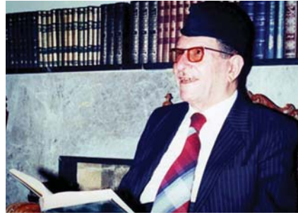
• على الوردية، طبيعة البشر من أصعب المواضيع التنقيصية والاجتماعية

المعال، يفرض فيها انتماء العراقي لأرضه حتى اليوم. قلنا رأيت من يهجو وطنه في مجتمعات أخرى، حتى إن كان أحياناً يهجو نفسه وموطنه، ولكن العراقي يبادر فيهجو نفسه وموطنه ومواطنه ومجتمعه أحياناً. انتموه مفهوم الوطن والمواطن والوطنية في شعوره ولشموه السياسي العميق. عند حديثهم عن طبيعة الإنسان العراقي لا يهتّم هؤلاء الكتاب كثيراً بما تشترك فيه الطبيعة الإنسانية للعراقي مع أي إنسان في كينونته الوجودية الأبدية. يمكننا التماس العذر لبعض هؤلاء الكتاب؛ لأن الرؤية التي تتخطى ثقافة الإنسان وأحواله الاجتماعية وطرّفه المعيشية، تتطلب كونها فلسفياً يتوغّل في أنطولوجيا كينونته الوجودية، بخصوص في أعماق البشر، ويتسلّل بالكشف عن شيء من كينونته المعيشية، التي هي أبعد من ظروف الإنسان المعيشية، والثقافة الموروثة التي يبتته. عندما نتحدث عن الإنسان نارة تأثره للإنسان من حيث هويته الاجتماعية المتغيرة، أي الإنسان الذي عاش في بيئة وواقع ومجتمع، يمكن أن نأخذ وعصر معين، وأخرى نتحدث عنه لا يوسفه الزماني والمكاني والتاريخي الخاص بعصر، بل ننظر للإنسان بوصفه إنساناً، الإنسان كينونته الوجودية التي يتبسّغ لكل مصداق للإنسان في أيّ زمان ومكان، بغض النظر عن أية هوية متغيرة يتكسبها من المجتمع والثقافة والدين والبيئة والواقع والعصر الذي يعيش فيه. الإنسان كينونته الوجودية بحدّ ذاتها، بل هو كإنسان، مهما كان الزمان والمكان والواقع المجتمعي الذي يعيش فيه.