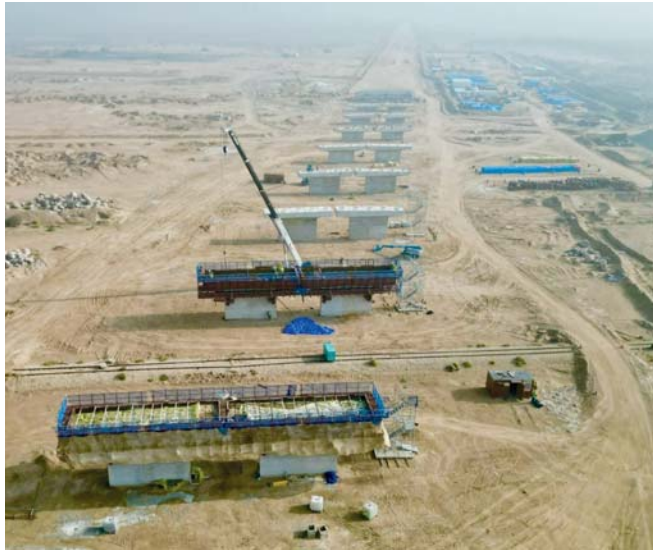
● جسر ميناء الفاو الكبير في مدينة أم قصر

مختلفة، فعلى سبيل المثال يجب تحديث خارطة الري والسدود وتحسين الواقع الزراعي والإنتاج الحيواني، فضلاً عن تحسين الصناعات التحويلية عبر الاستفادة من التجارب الصينية في النهوض الاقتصادي، وتفعيل قوانين أفضل للاستثمار جاذبة لرؤوس الأموال.