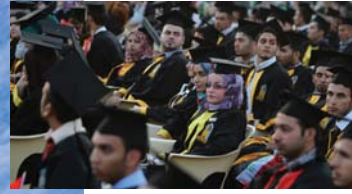
• يضم العراق 66 جامعة وكلية أهلية معترف بها رسمياً

يعد التعليم العالمي من أهم أركان تقدم الدول والمجتمعات، ذلك لأنه يخلق ملاكات بشرية تتعامل مع جميع مشكلات المجتمع، بروية أكاديمية تنويرية وفق منهجية البحث العلمي، وغالباً ما تُضع الحكومات شروط علمية قاسية في افتتاح مؤسسات التعليم العالي وهي الجامعات سواء كانت هذه الجامعات تنتمي إلى القطاع الخاص أو القطاع الحكومي، إذ تجعل في المرتبة الأولى الجانب العلمي. أما في العراق فقد شهد في المدة الأخيرة توسعاً كبيراً في التعليم العالي الخاص مما أثار تساؤلات علمية عند البعض، وهل هي تمتلك الجودة العلمية نفسها الموجودة في الجامعات الحكومية العراقية التي ملأت العالم ببرصانتها العلمية.