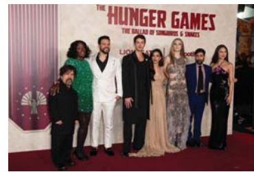
● أبطال فيلم «هانغر غايمز».