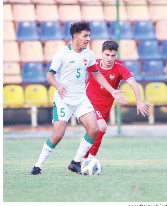
● ناشولنا يوجوهون الاردن ودنيا