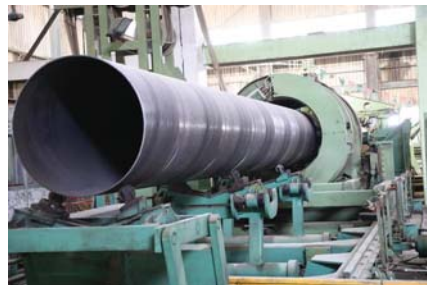
• الحديد العراقي الاول من توجه

الوطنيين يمدى جودة المنتج الوطني وكفاءته، وهو ما لا يمكن حصوله بوقت قصير وفق مختصين. بينما يبقى ملف تهريب الحديد، من الملفات الصعبة التي لم تقهر الحكومات العراقية المتعاقبة السيطرة عليه، رغم الرقابة المستمرة للمنافذ الحدودية وحتى تلك التي بين المحافظات، إلا أن بعض الجهات التي تتسيطر على تهريب الحديد لها القدرة على تهريبها إلى سبيل إصلاص سكر الحديد وغيره إلى خارج البلاد. معاملة عديدة مهددة منذ فترة بالتوقف من العمل لأسباب غامضة، حيث دعا بعض العاملين فيها الجهات المختصة والحكومة إلى إيجاد الحل قبل أن تتوقف، لا سيما أن لديهم عائلات بحاجة إلى العمل لاستمرار إلتحائهم.