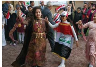
● من فعاليات الدورة الماضية

تواصل فعاليات الدورة العشرين من مهرجان لقاء الأشقاء، للوهيات والحرف، طوال المدة من اليوم الأربعاء، لغاية الأحد المقبل.