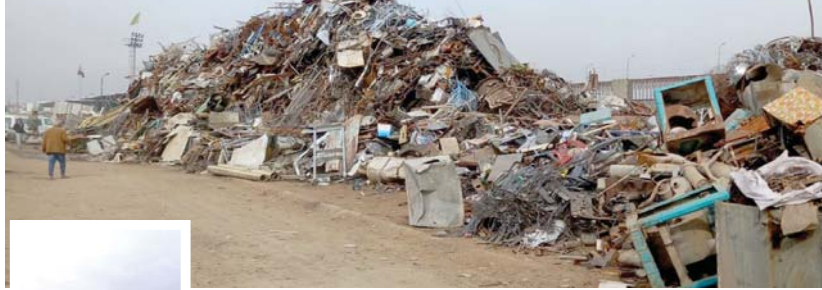
● بغداد حاضرة الدنيا ومعادها ياديه

صور أخرى تقيح وجه بغداد في تحد واضح للقانون الصامت، إزاء الممارسات المشوهة للأخلاق المتعرضة للعاصمة، من هذه التصرفات اللامسؤولة، من تجميع السكرا بياشكاله الفوضوية خلف مراب النهضة في منطقة الشيخ عمر، وفي محاذة خط سريع محمد القاسم، من دون حساب، وهو لا يخلو من التلوث، فضلاً عن تراكم النفايات التي تشكل بؤراً للأمراض، ويتم شراء السكرا ب من الباعة الجواله يسعر يخنس، ثم يعيها للمقالين إلى جهات معلومة بأسعار يتفق عليها في حينها لتدويرها في معامل خاصة، لسنا معنيين بعملية البيع والشراء، وإنما بالتشويه المقصود لجمالية المدينة في الوقت، الذي تبذل الدولة الجهود الحثيثة للتخفيف من مخاطر حياة صالحة للعيش، وجعل بغداد الأبهى على الرغم من الخراب الذي أصابها.