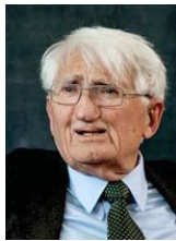
• يورغن هابرماس ساحة الانحياز للحقيقة

يعد الفيلسوف الألماني المعاصر يورغن هابرماس، 94 عاماً، وريث مدرسة فرانكفورت النقدية، بل هو من أبرز أعلامها وقاماتها شهرة، فهو فيلسوف المثالي الأول، ومن دعاة العقلانية في أفضها التواصل القائم على النقاش والحوار بين الأطراف المختلفة، وهو الأنداد الأهراماتيكى للتطور الغربي بنزخته المعتدلة، وخاصة فيما كان يطرحه، في فكرته عن «ما بعد العلمانية» كتب هابرماس الحضار من الكتب والدراسات المختلفة في الفلسفة، وعلم الاجتماع وصوب اهتمامه على التواصل والاعتراف والهوية الدستورية «القانونية»، ولم يتناصر يوماً للدول التي يصنّفها بالستيدية التي تحكّم أدوات السلطة والقرار، حتى أنه رفض جائزة مابيه معتبرة لأفضل شخصية ثقافية نظمتها الامارات العربية عازياً ذلك إلى أن الامارات ليست ديمقراطية.