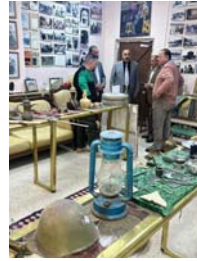
● من مقتنيات المركز