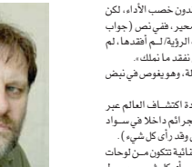
• سلافوي جيجيك

توضّح لنا صورة زاي فريديريك نيتشه في كتابه «تفويض المسيح» الذين ين فيه فكرة الإنسان الأوربي، وأن (التقدم مجرد فكرة حدائية، يعنى فكرة خاطئة، وأوربي اليوم يظل من حيث قيمته أدنى بكثير من أوربي عصر النهضة). ولم تتمكن كل تلك المفاهيم والقيم التي تحدثت عن السلام والتسامح وقبول الآخر، وترويه وتغيير معنواو الدرع بعيداً عن عصريته والتجديد للأفقر ول (صاحب المدع الأكبر) كما عبر نايون بونارت، فإن مواقف هابرماس ومن هم على شاكلته تأتي في جزءه لاصيل وخلف أمين للتوق الأوربي.