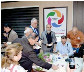
شارك العديد من الأدباء والنقاد بتهنئاتهم ومدحلات