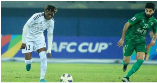
● من المسؤول عن تراجع النتائج؟

وعن نتيجة مباراة الزوراء أمام العربي الكويتي، أكد مزره أن التسوأس أهدر فوزاً كان بالتناول، بعد تقدمه بهدف حسان الدفائق الأخيرة، ليدخل نفسه في حسابات معقدة، ويؤجل حسمه لأهله للعبة الأخيرة. وأوديشوا تعتمد طريقة لعب غير مناسبة وترتكز على الكرات العرضية، وكان الأجرى به تغيير الأسلوب بحسب ظروف المباراة، بعد اكتشاف نقاط الضعف في صفوف سيهاان المتميز بإتقانها المطوية.