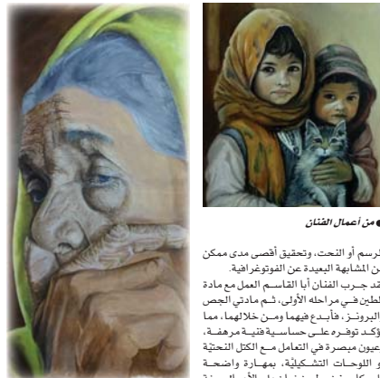
• من أعمال الفنان

وتنظرنا لتمكته البارح في الرسم، فقد فاز في المسابقة التي أجريت عام 2014 في كربلاء بالمرتبة الأولى في معرض المسكون وحاز على جوائز عدة. هذا الفن المسكون والخلق والإبداع في مضامين الرسم والخزف والنحت، وقد سبق له أن تأثر بالفنان البرازيلي (فاياو ميلاني) الرسام الواقعي فتمرر أسلوبه الواقعي، لأنه يسعى باتجاه التأثير في أذقة المشدوق والاستحواذ على مشاعر الجمهور عبر الدقة الواقعية في