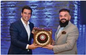
● ممثل اتحاد الكرة في الدورة