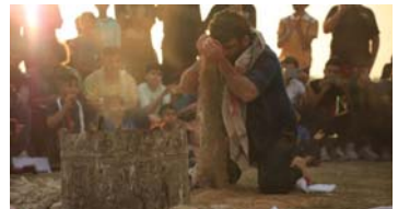
• ليست كل المسرحيات مفتوحة شارع

وتنظرنا لتمكته البارح في الرسم، فقد فاز في المسابقة التي أجريت عام 2014 في كربلاء بالمرتبة الأولى في معرض المسكون وحاز على جوائز عدة. هذا الفن المسكون والخلق والإبداع في مضامين الرسم والخزف والنحت، وقد سبق له أن تأثر بالفنان البرازيلي (فاياو ميلاني) الرسام الواقعي فتمرر أسلوبه الواقعي، لأنه يسعى باتجاه التأثير في أذقة المشدوق والاستحواذ على مشاعر الجمهور عبر الدقة الواقعية في