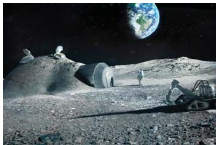
• الرياح الشمسية يوسعها أن تشكل الهيدروجين وتخزنه على القمر

الناتج من الرياح الشمسية أن تتفاعل مع الحطام الصخري القمري ويسهم في تكون المياه على القمر. وفي المقابل أفاد باحثون بأن هذا الماء يتشكل ويستقر بصورة مختلفة (أما يحدث في أرجاء أخرى من القمر) انطلاقاً من محتوى المعادن الأخرى في الحطام الصخري، إضافة إلى عوامل مختلفة. وفي التفاصيل فإن تقيبات مجهرية استخدمت لتقييم عينات تربة القمر التي جمعها بعثات برنامج مركبات أبولو الفضائية في إطار الدراسة التي نشرت في مجلة كومونيكيشن إيرث أند إنفايرنمننت Earth & Environment. ووجد العلماء أن الهيدروجين التاجع عن الرياح الشمسية يتركز في فراغات صغيرة ضمن معادن فوسفات الكالسوم في التربة القمرية. وأوضحت الدكتورة يورجيس أنها المرة الأولى التي يبرهن فيها العلماء على وجود تراكيب حاملة للهيدروجين ضمن الحويصلات الموجودة في العينات القمرية. وكشفت الدراسة أيضاً عن أن تفرقة التربة القمرية بفعل الرياح الشمسية يوسعها أن تشكل الهيدروجين وتخزنه على القمر، مما يشير إلى أن حبيبات الحطام الصخري التي تحوي بعض المعادن يوسعها أن تشكل مصادر وقود محتملة.