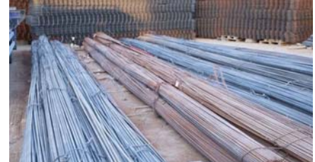
• الحديد يساهم في تعاضد الاقتصاد المحلي

وتشير أرقام الرابطة إلى أن العراق بإمكانه الاكتفاء ذاتياً من مختلف أنواع الحديد كفضايين حديد (الشيلمان) المستخدم في عقادة الأسقف في المنازل، وأسلاك الربط المعلقة الشيش عالي المقاومة، والحديد الشبك وغيرها، لوجود نحو