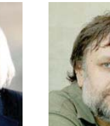
• سلافوي جيجيك