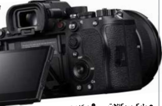
• طوكيو، وكالات • يمكن استخدام ذلك التوقيع للتحقق من أصالة الصورة

وحسب ما نشرته مواقع إخبارية يابانية، فإن سوني سوف تدمج تلك الميزة الجديدة في هواتف أسكسريا VI 1 و VI 5 للمستخدمين إمكانية توقيع الصور الملتقطة عبر كاميرا الهاتف الذكي رقمياً. للتحقق من أصالتها ومنع التلاعب بها أو تزويرها. وتعمل تلك التقنية عن طريق تضمين توقيع رقمي داخل ملف الصورة، ويتيح هذا التوقيع باستخدام شاشات تلميح فريد مرتبط بالكاميرا.