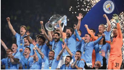
أخيراً حقق فريق مانشستر سيتي قمة القارة العجوز

لأسابيع عدة. لكن قبله رئيس الاتحاد لوريس روباليس على سفتي إحدى اللامعات عكّرت على المنتخب الإسباني فرحة الفوز بوندالي السيدات في كرة القدم. وباتت حديث الإعلام المحلي والدولي. احتاج المنتخب الإسباني إلى ثلاث مشاركات فقط في النهائيات العالمية كي يتوج بطلاً بالفوز في النهائي على إنكلترا بطلا أوروبا 0-1، أمام 75 ألف متفرج ضجّت بهم مدرجات ملعب "أستراليا ستادיום" في سيدني. وفي خضم الاحتفال بالإنجاز على أرض الملعب، قرر رئيس الاتحاد روباليس "تقدير" جهود المهاجمة جيني هيرموسو بتقبيلها على شفيتها قسراً في خطوة أوصلته إلى الهاوية ليس فقط بخسارته منصبه، بل بتوقيفه من قبل الاتحاد الدولي (فيفا) عن أي نشاط كروي لمدة ثلاثة أعوام. وقال روباليس لبرنامج "توك تي في" الذي يقدمه الإعلامي بيرس مورغان "ما حصل بيننا هو عمل عنوي، عمل متبادل، عمل وافق عليه الطرفان، وكان مدفوعاً بمشاعر اللحظة والسعادة، لذلك أؤكد أن هذه حقيقة ما حدث".