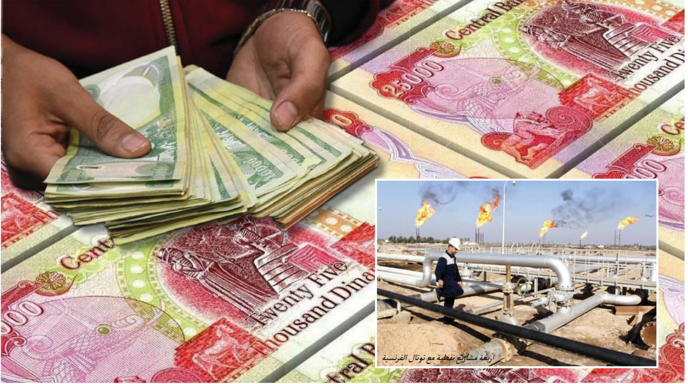
تعديل سعر صرف الدولار في الأسواق المحلية إلى 1300 دينار

كما وجه المجلس، بضرورة تقديم وزارة المالية مقترحات بشأن بدل إيجار الأراضي المخصصة للمشروعات الصناعية مع تبسيط تحديدها وبعاد النظر ببدلات الإيجار كل خمس سنوات، ودراسة لجنة تنفيذ السياسة الاستيرادية والإجراءات التنفيذية المؤلفة بموجب الأمر الديواني 85 لسنة 2021 مدى مواءمة السلع التي تحتاج إلى إصدار إجازة استيراد في ضوء السياسة الاستيرادية ومدى توافر المنتج المحلي للسلع وتقديم توصية محددة إلى المجلس الوزاري للاقتصاد.