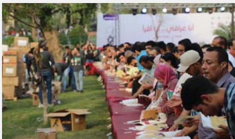
(أنا عراقي أنا أفرا) بنسخته العاشرة

كبيرة وحضرته شخصيات ثقافية عربية وأجنبية من فنانيين وكتاب وموسيقيين وباحثين وقد أسهم هذا المهرجان بإعادة بابل إلى لائحة التراث العالمي وسلط الضوء على حضارة العراق المجيدة وأعلى سمعة البلد، كما شكل حضوراً مهماً على خارطة المهرجانات الدولية، فقد شهدت أيامه الأولى اهتماماً عربياً واسعاً بين الأوساط الثقافية وإقبالاً جماهيرياً ترك بصمة في المشهد الثقافي العربي.