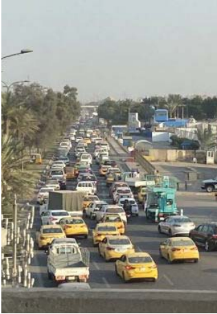
فك الاختناقات المرورية ببغداد

2,151,551 أسرة، ليكون المعدل الأكبر للمسؤولين في تاريخ الوزارة، لافتاً إلى أن الحكومة نجحت في شمول 900 ألف أسرة خلال عام واحد، وهو الشمول الأسرع تنفيذاً للوزارة.