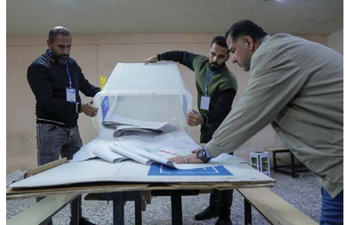
انتخابات مجالس المحافظات 2023

وتعدّ الموازنة الحالية الأضخم في تاريخ البلاد، إذ تبلغ