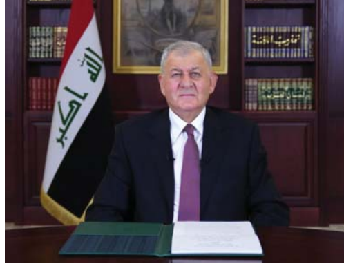
كلمة لرئيس الجمهورية في منتدى "صمود المستقبل"