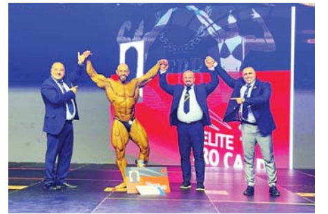
منتخبنا لبناء الأجسام يحقق لقب بطولة آسيا للمرة الثالثة على التوالي

اللقب الرابع ختامها مسلماً كما يقال، حينما أحرز منتخبنا الوطني بقيادة مدربه الإسباني كاساس لقب بطولة كأس الخليج العربي عقب تغلبه على نظيره العباني بثلاثة أهداف مقابل اثنين، وشهدت المباراة النهائية سيناريو دراماتيكيًا، إذ امتدت لأشواط إضافية