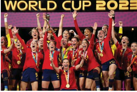
منتخب إسبانيا للسيدات الفائزة بكأس العالم لكرة القدم

ضجَّ العام 2023 بأحداث رياضية بارزة بدءاً من تتويج المنتخب النسوي الإسباني لكرة القدم بلقب بطولة كأس العالم، التي استضافتها أستراليا ونيوزيلندا، وصولاً إلى حدث انتقال الأرجنتيني ليونيل ميسي إلى الدوري الأميركي وحصوله على الكرة الذهبية للمرة الثامنة بتاريخه، وتركه القارة الأوروبية، بعد 20 عاماً من الإبداع، انتهاءً بحراز مانشستر سيتي لقب دوري أبطال القارة العجوز. "الصباح الرياضي" رصدت أبرز المحطات والتجمعات التي جرت في هذا العام.