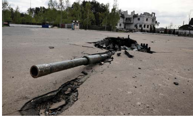
فشل أوكرانيا في الهجوم على روسيا

وفي منتصف تشرين الثاني، أمرت محكمة العدل الدولية التي لجأت إليها يريفان، باكو بالسماح بعودة سكان كاراباخ "بأمان تام"، ولم تقض المحادثات التي تجري بوساطة دولية والرامية إلى التوصل إلى اتفاقية سلام، إلى نتيجة حتى الآن.