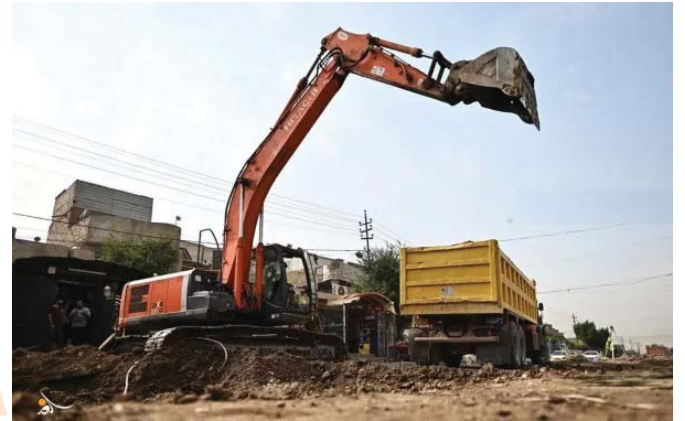
مشروع خدمة مختلفة في بغداد والمحافظات