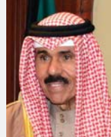
الشيخ نواف الأحمد

وأفادت وسائل إعلام، أنّ الملك السابق، البالغ من العمر 82 عاماً وهو نسيب للملك تشارلز الثالث لجهة أبيه وعزّاب الأمير وليام "توفي بسبب سكتة دماغية". وكان قسطنطين الثاني ولد في 2 يونيو 1940 في أثينا، وهو آخر ملوك اليونان (1940-1964) من سلالة غلوكسبيرغ، وهو ابن الملك بول الأول وفريدريكا من هانوفر، وآخر ملك أرثوذكسي حكماً، باعتباره سليل الملك الدنماركي كريستيان التاسع، كما يحمل لقب أمير الدنمارك. في كانون الأول، أعلن الديوان الأميري الكويتي وفاة أمير الدولة الشيخ نواف الأحمد الجابر الصباح عن عمر 86 عاماً. سَيَّ الشيخ نواف ولياً للعهد عام 2006 قبل أن يخلف في 2020 أخاه غير الشقيق الشيخ صباح الأحمد الجابر الصباح، الذي توفي في أيلول من ذلك العام عن 91 عاماً، ثم أعقبه على الحكم أخاه غير الشقيق الشيخ مشعل الأحمد الجابر الصباح أميراً للكويت. وفي كانون الثاني من 2023، أعلن في أثينا، عن وفاة آخر ملوك اليونان قسطنطين الثاني الذي حكم البلاد قبل إلغاء النظام الملكي عام 1974.