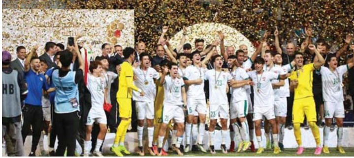
منتخبنا الفائز بكأس خليجي 25

حصلَ العام 2023 بالعديد من المحطات الرياضية، وفي المقدمة يأتي حدث إقامة بطولة كأس الخليج العربي لكرة القدم في محافظة البصرة الفجاء، التي استضافت واحدة من أنجح النسخ على الإطلاق فنياً وتنظيمياً، كما سجلت أرقاماً غير مسبوقة بالحضور الجماهيري الذي فاق التوقعات. (الصباح) سلطت الضوء في هذه الزاوية عن أبرز إنجازات الرياضة العراقية خلال العام 2023.