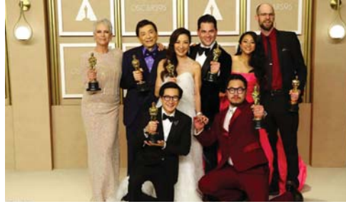
فريق فيلم "كل شي.. كل مكان.. في نفس الوقت" يتباهون بخمسة جوائز اوسكار