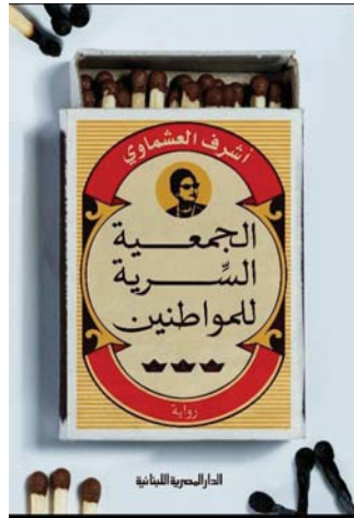
الرواية الفائزة بجائزة كتارا للرواية العربية

لغاثر بها أبواب العالم وتسلط الضوء على المؤلف وعمله. وقد ذهبت جائزة نوبل للآداب هذا العام للنرويجي "يون فوسه" الذي يعدّ من مؤلفي المسرحيات الأكثر عرضاً في العالم. صدرت روايته الأولى "أحمرأسود" عام 1983، وسباعيته "الاسم الآخر" في جزأين، و"أنا هو الآخر" و"اسم جديد" في كتابين، كما ترجمت أعماله إلى أكثر من 40 لغة حول العالم.