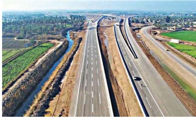
طريق دورة - يوسفية للمرور السريع جنوبي بغداد

في جميع جولاته وزياراته ومشاركاته التي أجراها رئيس الوزراء محمد شياع السوداني، أكد استقلالية القرار