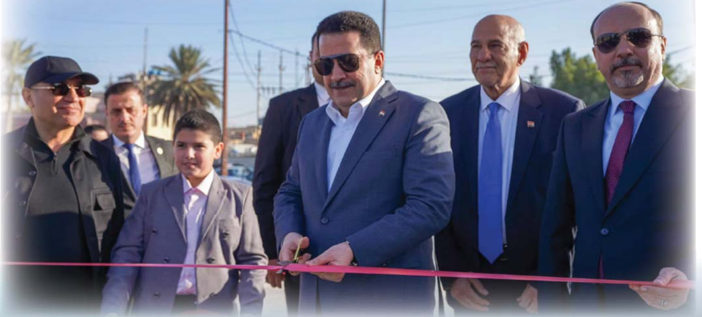
رئيس الوزراء محمد شياع السوداني لدى افتتاحه جسر «الحرية» بين منطقتي الكاظمية والكربعات الذي يعدّ الأول من نوعه في العاصمة وأطول جسر مشاة لعبور نهر دجلة في بغداد