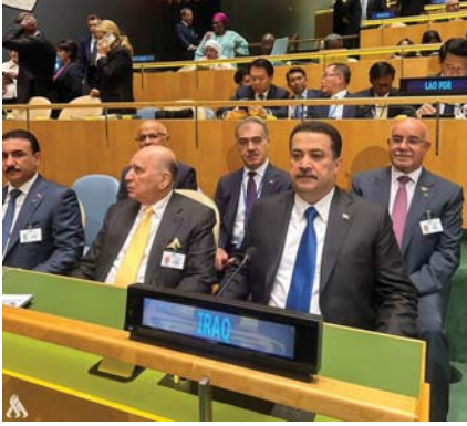
مشاركة رئيس الوزراء في اجتماعات الجمعية العمومية للأمم المتحدة