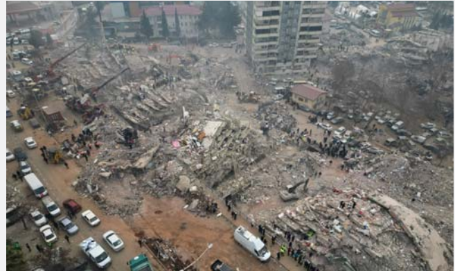
زلزال تركيا وسوريا

ليل الخامس/ السادس من شباط، ضرب زلزال هو من الأقوى في غضون قرن من الزمن، جنوب شرقي تركيا ومناطق من سوريا. وأسفر الزلزال الذي بلغت قوته 7,8 درجة وتلته هزة أخرى بعد تسع ساعات، ما لا يقل عن 56 ألف قتيل في تركيا ونحو ستة آلاف في سوريا. وانتشرت صور مؤثرة عبر العالم لوالد يمسك بيد ابنته البالغة 15 عاماً والعالقة تحت الركام في تركيا ولطفلة رضية ولدت في سوريا خلال الزلزال وانقذت من بين الأنقاض وهي لا تزال موصولة بالجبل السري بوالدتها التي قضت في الزلزال.