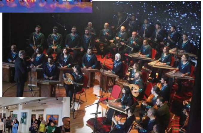
معرض تشكيليات عراقيات على قاعة جمعية الفنانين التشكيليين