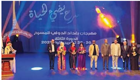
مهرجان بغداد الدولي للمسرح بدورته الرابعة

هذا وقبل أن يسدل الستار على العام 2023 كشف المخرج غانم حميد عن عباءة مخيلته المسرحية بعرض