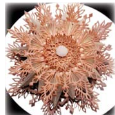
● حلوى عيد الميلاد

وأوضحت أن مكنتها «متكررة ومختلفة وتقليدية أيضاً».