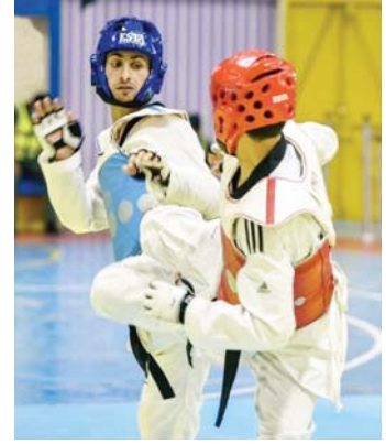
● مشاركة واسعة شهدها البطولة