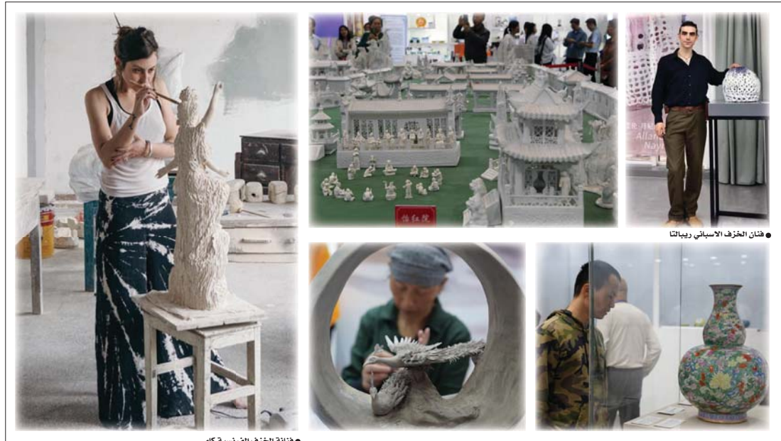
• فنان الخزف الإسباني ريباتنا