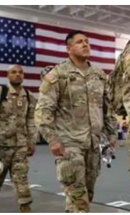
● تتكبد أميركا تكاليف باهظة من هببتها وسطوتها

السبب الآخر المحتمل للكتمان الذي يحيط بتدخل الولايات المتحدة هو الخوف من أن يؤدي الدعم الأميركي لإسرائيل إلى الأضرار بمكانة واشنطن في الشرق الأوسط، خصوصاً على ضوء الرفض الواسع في المنطقة للهجوم الإسرائيلي