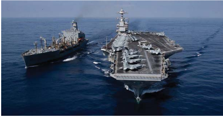
● قدرات أميركا البحرية الضاربة في البحر الأبيض المتوسط