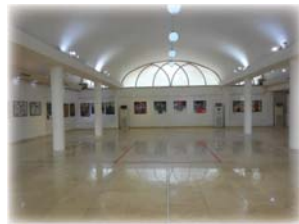
● جمعية التشكيليين