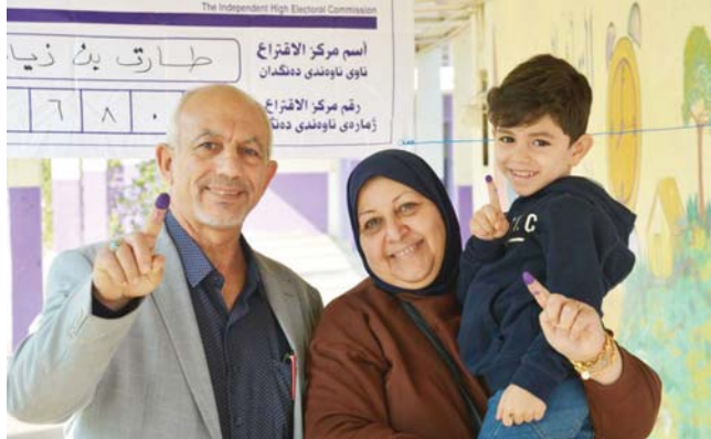
تصوير، كرم الأسم