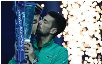
● ديوكوفيتش صانع الانجازات