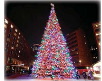
● شجرة الكريسماس

يحل على الإنسيانية، ليلة الأحد/ الإثنين المقبلين، الكريسماس، عيد ميلاد يسوع.. السيد المسيح عيسى بن مريم ع، بهجة مطلقاً لتتحف سماء وضياء بمجد الله في العلى، وتتوسد أرضاً غرست في ثراها ورود السلام عطرة الشذي البارد السنيدي والتبع والندى والتناول. وشال الشفان جواد الشكرجي ل.. عيد يبعث بهجة من سوياء قلوبنا وشغاف مشاعرنا التي تهجأ حروف الانتشاء للإنسيانية يوجدان صريح، مؤكداً: برد وفطرات ندى شقيقة تبعث الحيوية في الجسد الإنساني وتهبئة للفرح المشترك مع عائلته وأسفدقائه، ومع جمهورنا. وأضاف الفنان سعدون جابر: غنيت لعيد المطلق (بجمار القلب) التي تصلح لكل مناسبة