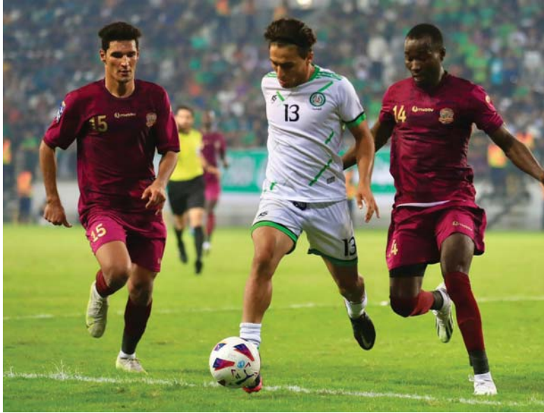
● الشرطة يسعى للعلامة الكاملة

تفتتح غدا الجمعة منافسات الجولة الـ 11 من دوري نجوم العراق لكرة القدم بإقامة مبارياتين، حيث يستقبل الشرطة نظيره نفط الوسط، ويلعب الميناء أمام جاره نفط البصرة في ديربي المحافظة.