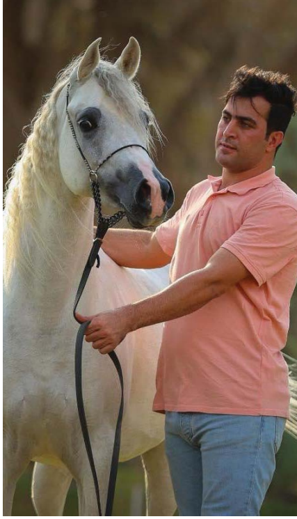
• الخيول العربية أفضل أنواع الخيول في العالم

من الخيل، ويشترك في البطولة التي ستقام في الشهر 12 من هذه السنة من كل أنحاء العراق، وهي بطولة محلية وليست دولية بسبب وجود حجر صحي على العراق، وإلى الآن غير مفتوح وليس باستطاعتهم تصدير الخيل ولا أخذ الخيل للمشاركة في البطولات الدولية، وبالوقت نفسه لا يستطيعون من خارج المشاركة في هذه البطولات المحلية لدينا، لأنه في حال دخلت خيولهم إلى العراق لا تستطيع الخروج منه والعودة بسبب الحجر الصحي، ووجود وهي أمراض موجودة منذ وقت بعيد، وكان المفروض إيجاباً لتفاجئهم البيطرة للسيطرة على الموضوع، ولكن إلى الآن لا توجد سيطرة على هذه الأمراض التي تصيب الخيول.