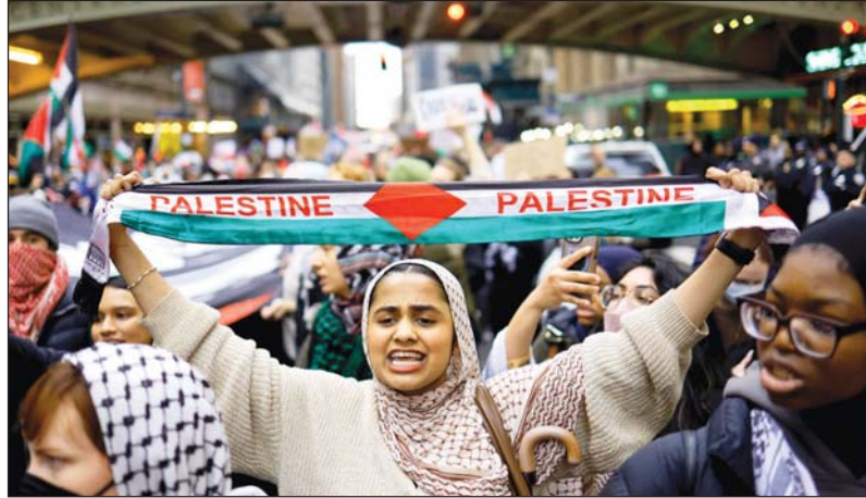
• تنامي الرضف العالمي لوحشية الاحتلال الصهيوني يشكل عامل ضغط على الإدارة الأميركية.