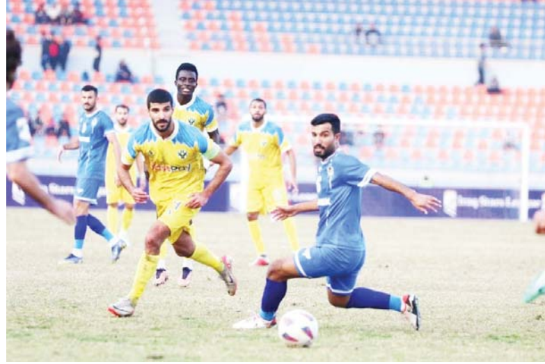
● الجوية يسير بثبات

كثيراً إلى الرمي، إلا أن عدم التوفيق وغياب التركيز خلال دون تحقيق الفوز في المباريات الخمس الأخيرة، مبيئاً أن الإدارة ستمتحن الحروب الموقتة حيدر صباح الفرصة في التفاهات الثلاثة المقبلة، لعين التوصل إلى اتفاق مع مدير فني جديد يكون على عقابته النهوض بواقع الفريق. وفي لقاء ثانٍ ألقى الشريعة بقلعة واحدة من مهاراته أمام كيرلاء، إثر تعادلهما السلب، وبذلك أصبح لدى الأيق (15 نقاط)، في حين ارتفع رصيد كيرلاء، إلى (10 نقاط).