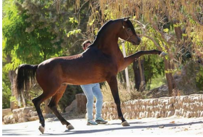
• مسابقات لاختيار أجمل فرس