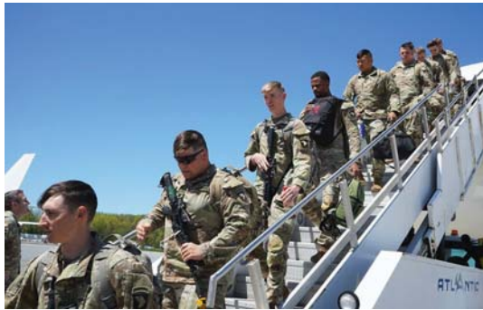
● ماذا تفعل القوات الخاصة الأميركية في إسرائيل؟

● لقد تأكد منذ الآن أن التكاليف التي ستكفيها أميركا من هببتها وسطوتها جسيمة وباهظة، ومن المحتمل أن يكون الأمر أسوأ من ذلك بكثير