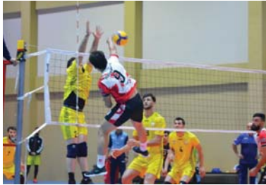
● استئناف مباريات دوري الطائرة