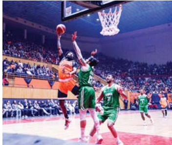
● اختيار مهم لسلوة الشرطة

السورية دمشق ويعتمد الرياضي بأسلوب لعبة على نغمة الأول المتوج بلقب أفضل لاعب في آسيا والي عرجشي الذي يمتاز بالتوريات الحاسمة فضلاً عن النهديت من الضارح ومن أجل فوس الثالثلت نظام، إضافة إلى اقتصار على المحترفين أسئل السلوة من أجل الاستعداد على الكرات في التنامات الدفاعية والهجومية.