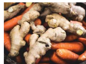
• الزنجبيل دور حاسم في السيطرة على الالتهابات

ويأمل فريق البحث في استخدام الدراسة لفتح التمويل للتحارب السريعة للزنجبيل في المرضى الذين يعانون من أمراض المناعة الذاتية والالتهابات، حيث يكون نشاط العدلات مفرطاً، بما في ذلك الذئبة والتهاب المفاصل الروماتويدي ومتلازمة مضادات الفوسفوليبيد وحتى فيروس مرض كوفيد 19 (كورونا).