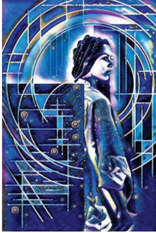
● بعض أعماله