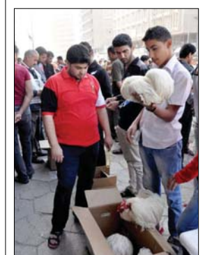
● شفت الشباب بارتياح سون الفلز يوم الجمعة لشراء الحيوانات الأليفة منه