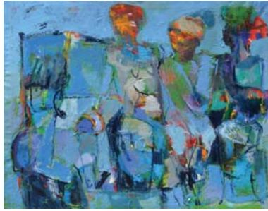
من أعمال الفنان

عزبه الفنان في منطوقه "عندما أنظر إلى لوجاني، أرى نفسي متفاعلاً مع حرارة الألوان ودفء إيقاعها المشاكسة، وأجد قدرتي التعبيرية بضربات الألوان الجريئة، كل هذا يشعرني بسعادة وخوف بالوقت ذاته، حين أنظر بعقل للمساحات المتجانسة على الشكل التصويري للوحاتي، ترى هل هي استعادة حياة مزلت ومضت تجد وجودها الحي في هذه الصياغات التشكيلية لدى الفنان؟ وهل هي انعكاس لتجارب وأسفار وخيبات ونجاحات لتكون اللوحة مهبط النفس ومركز الكون في تعبيريتها؟