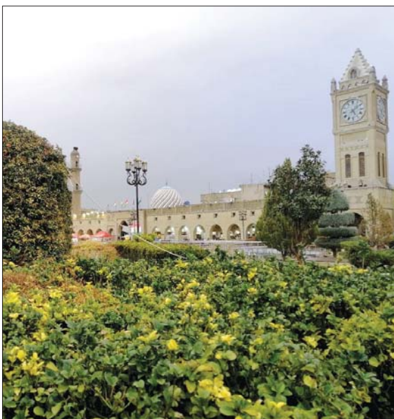
● خطة طموحة لاجتذاب 10 ملايين سائح

ولفت توفيق إلى أن ملاكات الهيئة أعلنت جاهزيتها لبدء السياحة الشتوية منصف الشهر الحالي بإقامة الفعاليات والأنشطة المختلفة، وأهمها مهرجان الأبيض بالمناطق الجبلية في أربيل والسليمانية ودهوك، لافتاً إلى تنوع الفعاليات فيها ومنها التزلج على الجليد، وتسلق الجبال والمغامرة، وسباق السيارات، ومغامرات القوارب والتخييم من خلال الجامعات السياحية وغيرها، وأن السياحة الشتوية تستمر لغاية أعياد نوروز ويده فصل الربيع. وأضاف أن من الفعاليات والأنشطة