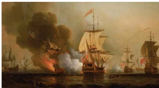
● لوحة تعبر عن حرب السفن خلال القرن الثامن عشر

ولأجل الحصول على أدلة، بحث المؤرخون في السفينة الحقيقية لسان خوسيه، سان خواكين، التي كانت تبحر بجانب سان خوسيه أثناء غرقها. فقد غادرت سفينة سان خواكين إسبانيا بحمولة 17 طنا من العملات المعدنية من بيرو، من بين أشياء أخرى يقول كوربا، لا تعرف ما هي فروق الحمولة بعد استقرارها لثلاثة قرون مغمورة بأبواب، مؤكدا أن الحكومة ستقوم بتقييم بعض القطع في البداية قبل الشروع في عملية التنقيب الكاملة.