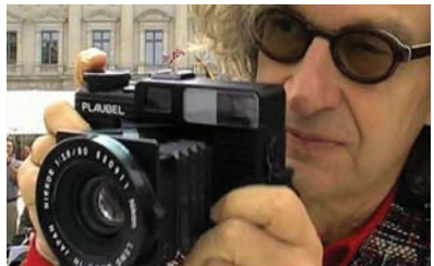
• المخرج الألماني فيم فينذرز

بالأمم الساخن في الحمام العام وبعد ذلك يتوجه إلى أحد المطاعم الشعبية وأخيرًا ينهي ليته بقراءة كتاب لوليم فوكتر هذه اليوميات المتشابهة، يعيشها هيراياما بسعادة تامة، فوجهه يفيض حيورًا، حتى صمته لا يكسرهم إلا بكلمات قليلة، كأنه شجرة من تلك الأشجار الموعود بتطوير فلالها. لا يستخدم هيراياما آيا من تقنيات العصر الحديث في عام 2023 فما زال يستخدم تلك الكاميرات بأفلامها السوداء، التي تحتاج إلى تمهين تحت الضوء الأحمر في غرفة مظلمة، ويستمتع للموسيقى من أسرلة الكاسيتات، إنه يعيش