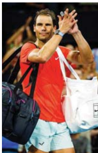
● إصابة جديدة للماتador

أعلن المصنمخ الإسباني رافايل نادال عدم مشاركته في بطولة أستراليا المفتوحة لكرة المضرب، أولى البطولات الأربع الكبرى، جراء تعرضه لتمزق عضلي بعد أسبوع من عودته إلى الملاعب إثر غيابه لمدة عام بسبب الإصابة أيضاً. وكتب نادال (37 عاماً) المتوج بـ 22 لقباً كبيراً عبر موقع "أكس" (تويتر سابقاً) بعد يومين من خسارته في ربع نهائي دورة برزبين في الأسترالية-في الوقت الحالي لتست مستعداً للمنافسة على أعلى مستوى في مباريات من خمس مجموعات أسبوعاً إلى إسبانيا لولاية طبيبي والحصول على بعض العلاج والراحة.