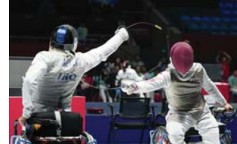
● استحقاق عالمي لبارالمبي المباراة