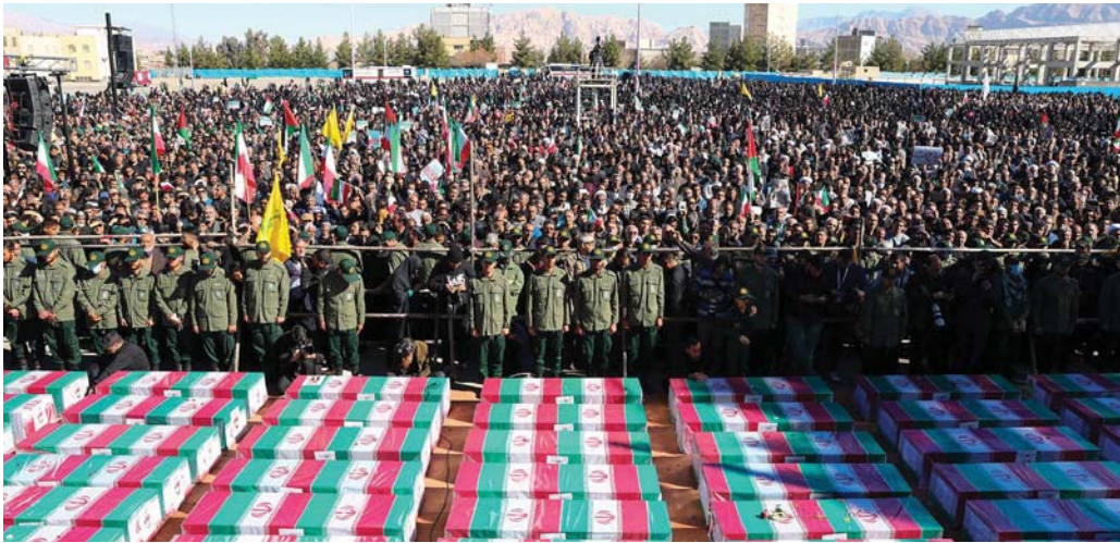
● ثمة نسبة مقارنة بين الدم المراق في تفجيريات كرمان والوقائع السابقة