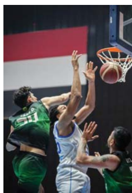
● سلة الحشد يطمح للتتويج

مدره عليل جاسم واضحة، تتصيح المسار العودة سريعاً إلى دائرة المنافسة على اللقب، وتحفيز لاعبيه في الساعة السادسة مساءً، وتجمع بين الحشد الشعبي ودجلة الجامعة، وتبدو تطلعات الفريق الأول بقيادة