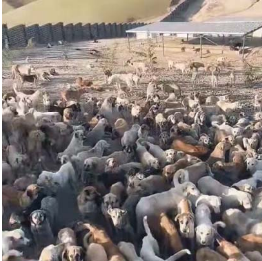
• 3000 كلب شال خلال شهرين

تسعى الحكومة المحلية في مدينة أربيل عاصمة إقليم كردستان في حملتها من خلال الجهات المعنية، بجمع الكلاب الضالة والسائبة في المناطق السكنية والمناطق غير المأهولة، لا سيما أطراف المدينة في ملاجئ خاصة بها، وأن عملية البحث عن الكلاب ونقلها إلى الملجأ أو المحمية ما زالت مستمرة لغاية وقتنا الحاضر، خصوصا بعد اتساع حجم الظاهرة وخطورتها على المواطن بالدرجة الأساس.