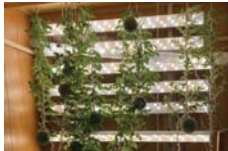
• كانت نتائج التجربة منسجمة من حيث التعلم والرياحنة