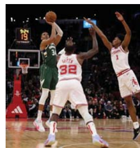
● باكس يحتفظ بمركزه الثاني رغم الخسارة

ورفع نادال في فخ الإصابات المتكررة، إذ باتت جزءاً من مسيرته الطويلة المقلقة بالآثاب والإنجازات، وتعرض لإصابات في ركبته ومعصمه وقدمه، ما جعل منافسه الدائم الصربي نوفاك ديوكوفيتش يتقدم عليه في عدد الألقاب في بطولات غراند سلام (24).