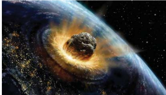
مشاكل دليل على تمزق للأجرام القريبة من الأرض بفعل قوى المد والجزر

وقب الباحثون في الدراسة، إن الشظايا الناجمة من «تمزق مدى» ستبقى أيضاً موجودة على مدارات تقرب من الكوكب لبعض الوقت بعد أن يطرأ حدث التمزق المدى. وقالوا: لذلك ربما تتعرض بعض الشظايا لمزيد من التمزقات بفعل المد والجزر في غمرة مواجهات قريبة مع الكوكب نظراً في أوقات لاحقة، ما يتأسس عنه ارتفاع في عدد الشظايا الناتجة، التي قد يولد بعضها في الكوكب. ولكن لحسن الحظ، أمثال العلماء أن هذه الأجزاء الصغيرة من الصخور الفضائية لا تشكل تهديداً يهدد أي مستوى أمدانار البشرية.