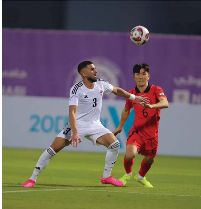
أداء متباينة بخصوص أداء الوطني أمام كوريا

وأردف أن منتخبنا ما زال ضمن لائحة الضرب القوية في القارة، إلا أنه بعيد جداً عن مستوى اليابان وكوريا الجنوبية وأستراليا وإيران والسعودية، وأمامه الوقت ليولوج القائمة المتصدرة لآسيا، وهو يحتاج إلى المزيد من الدعم وإبعاد الضغوطات لتحقيق الهدف المنشود.