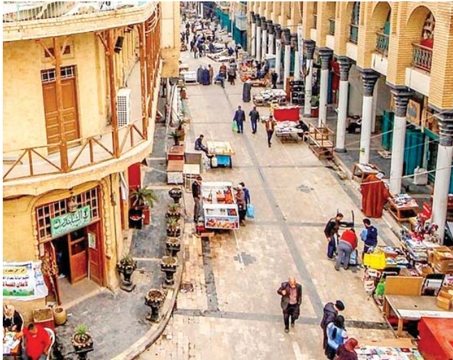
● المشهد الثقافي بحاجة إلى دعم حكومي يوازي الدعم المقدم لقطاع الحماية الاجتماعية، ومحاربة الفقر والبطالة

الوطن، وذلك من خلال تخصيص مهرجان خاص لأدب الطفل، الذي من شأنه رفع مستوى الثقافة، لدى الأطفال الذين هم البذرة، التي يجب أن تسقى بنشأ أنواع الفنون. 2 - يجب على اتحاد الأدباء والكتاب ووزارة الثقافة تسهيل نظام الحماية الفكرية، من خلال نظام عمل يحمي الأعمال الأدبية من الضياع. 3 - الحد من دكاكين النشر والطباعة، التي ساهمت مساهمة فاعلة في انتشار الثقافة والترهات على أنها شعر أو سرد. وقال القيسي مضميناً: المتجز الإبداعي الذي تم تقديمه خلال هذا العام الكثير منه ما كان مهماً ومنه ما كان إعلامياً أكثر مما هو إبداعي ولكن ما هم الساحة الأدبية في العراق خاصة هو النوع لا الكمية وكما أشرت سابقاً على الدولة والمؤسسات ذات الشأن بالحد من دكاكين الاستمساخ المسماة زور دور نشر. المشهد الثقافي العراقي يحتاج الكثير من الدعم أولاً تخصيص قديم خاص للمهرجانات والمؤتمرات التي تقام حتى لا تشتت العمل الإبداعي في شهر أوشهرين تانياً تخصيص مقرات حقيقية طبق بالمتف العراقي في كل محافظة. ثالثاً، أدعو الحكومة العراقية وعلى جميع المثقفين رابعاً معالجة قضية تلفزيونية خاصة لنقل المهرجانات الأدبية بيت مباشر، وكذلك نقل المهرجانات الأدبية للفنية التي يقبها المثقف العراقي على مدار الأسبوع، وبهذا سيكون المثقف العراقي، وقد يكون الأول من نوعه قناة مخصصة للأدب في العراق والعالم.