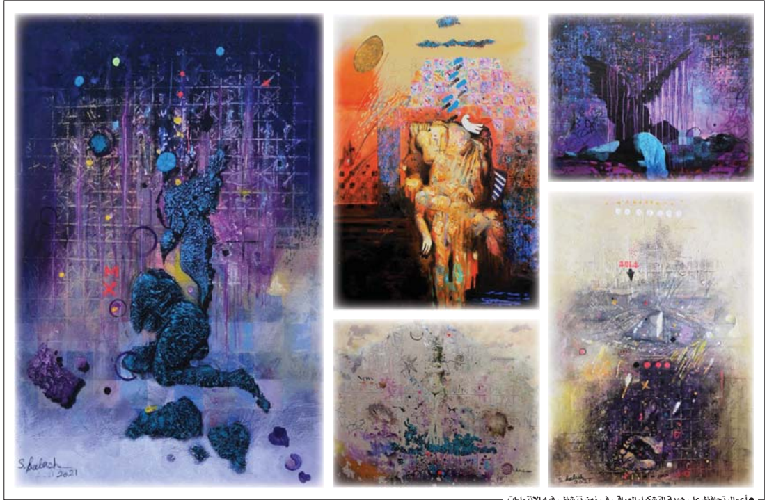
● أعمال تحافظ على هوية التشكيل العراقي في زمن تتشظى فيه الانتماءات

تتضح في لوحات (كلش) العلاقة الوجدية للخصب، وللعمل الأيروتيكي، وقد باتت من