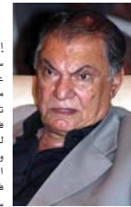
محمد شكري جميل

إخراج رعد باش، من سوريا، (وسطل) إخراج عادل الهيمسي - اليمن، مؤكداً المهرجان سيعلم تياً عن الأفلام المشاركة في مسابقات المهرجان للأفلام الروائية الطويلة والروائية القصيرة، إضافة إلى الأفلام المشاركة في مسابقة (فضادات السينمائية الجديدة) التي حصلت على منحة نقابة الفنانين العراقيين بعد أن تم اختيار سيناريوها من قبل لجنة متخصصة، وتعمل على إخراجها مجموعة من المخرجين العراقيين المتميزين. المهرجان يقيمه النقابة الفنانين بالتعاون مع وزارة الثقافة، برعاية رئيس الوزراء محمد شياع السوداني للبدء من العاشر ولغاية الرابع عشر من شباط المقبل.