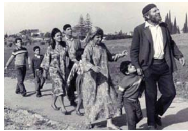
من مشهد من الفيلم الإسرائيلي صلاح شباتي (1964) يتحدث عن كتلة أرض الجليل