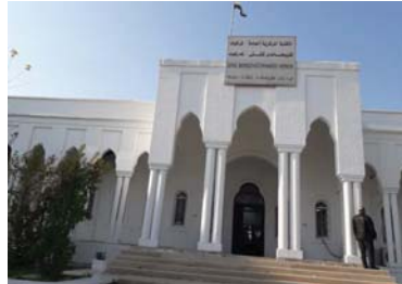
• المكتبة المركزية في كركوك

المناطق السكنية مهمة وضرورية جدا، بعد الهجمات المتعددة من قبل الكلاب على المواطنين خاصة الأطفال الصغار، وأصبح من الصعب جدا خروج الأولاد للعب وإرسالهم إلى الملجأ للتشرب، بسبب الخوف الشديد من تعرض الكلاب لهم، والكثير من الإصابات