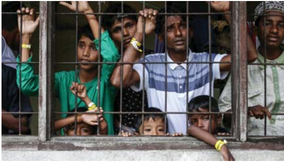
● فرار الروهينغيز من الوحشية المتصاعدة في المخيمات بنغلاديش