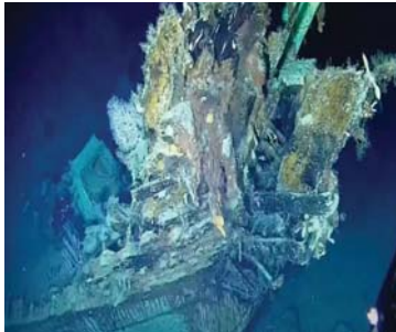
● سفينة سان خوسيه تتبع قبالة سواحل كولومبيا

وسرع خوان كوربا، وزير الثقافة، للمساعدة إن الحكومة تخطط لفتح عملية تقديم العطاءات خلال ثلاثة إلى أربعة أشهر. وأضاف أن الحكومة تدرس أيضا بناء متحف ومختبر لدراسة وعرض محتويات السفينة، وكرت شركة بولومبرغ، المتخصصة بالخدمات الاعلامية والمالية، في وقت سابق أن هناك حاجة ملحة لتجديد الخطف.