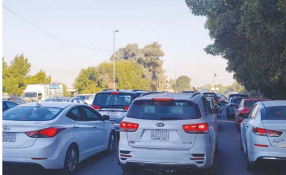
● سعي متواصل لحل أزمة الاختناقات المرورية

بين زحامات العاصمة بغداد وسعي الحكومة التواصل إلى حل هذه الأزمة من خلال مشاريع هذا الاختناقات المرورية تارة وتعيين المئات من عناصر المرور تارة أخرى، يبقى فرض سيادة القانون أولوية ملحة لضمان السلامة بالدرجة الأساس وهيبة الجهات الأمنية من جهة أخرى. ويوجد العديد من المتابعين، أن من أساسيات نجاح الخطط المرورية والأمنية يكون عبر حل ملف الإشارات المرورية وثابت التفاعلات، فضلاً عن إيجاد حلول لاستيعاب أعداد العجلات المتزايد بشكل كبير في الشوارع وقال المتحدث باسم وزارة الداخلية، العميد مقاد ميري، لـ الصباح: إن الخطط المرورية مستعدة بإجراءات كثيرة تعمل على تقليل زخم العجلات والحوادث المرورية، مبيّناً أن تأثبات الإشارات المرورية في التفاعلات لإزالة مسطحات المرورية في الوقت، إلى أن مسألة المرورية الإلكترونية ونشر الكاميرات أمر تجريبي لا أكثر، وأن العمل الآن ينصب على تأثبات الشوارع بالإشارات المرورية.