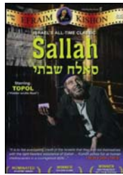
• بوشر فيلم صلاح شباتي

يمكن تأشير كونها كانت مستندة على أسس مغلوطة بسبب الصراع الذي يفصل بين السفاراد واليهود الشرقيين- وبين الأشكناز واليهود الغربيين وهذه الإشكالية حقيقية من جهة مجتمعية وأخرى، ومن جهة أخرى، سياسية- رفاية هو أن السينما تعاشي أن تتناول محطورات المجتمع الإسرائيلي، والتي تخص الروابط الدينية للدولة، الأساطير وتأثيرها على الحياة اليومية، القضية الإسرائيلية العربية، المشكلات الجنسية أو البربرية والهيمنة. وفي العمل العام فإن سر بقاء الكيان الصهيوني هو حرصهم على ضم المجتمع الهجين في بوتقة الانتماء الديني، ومن ثم الوطني العام ومن أي منبع ويتوضح ذلك في التحليل التقدي للأفلام التي أنتجها إسرائيل عبر أعوام طويلة فالسينما أصبحت عنصرًا مهمًا لتحليل كدرة مرآة تعكس جذور أصل الإنسان أكثر من كونها عرضيات الواقع المرآة من الخيالية- وبالتالي فإن موضوعات السينما وفيها مضمونها المباشرة وغير المباشرة، تعطي إضاءات كثيرة عن الموقف الاجتماعي منها الصراع الحضاري والعرفي والوجود التاريخي والتفاهة المحلية بين اليهود الشرقيين والغربيين - من عادات وتقاليد وأسس اجتماعية متعددة، تختلف بين الأثين فالسينما عندما تعرض مثل هذه المشكلات فإنها تحلل السلوكيات الجمعية