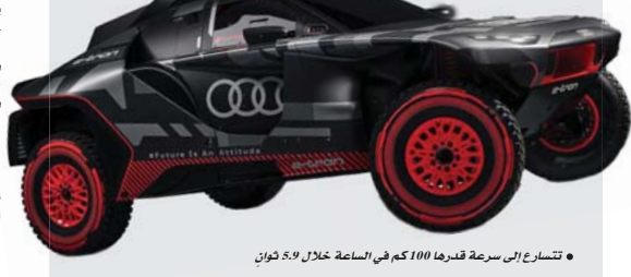
• تتسارع إلى سرعة قدرها 100 كم في الساعة خلال 5.9 ثوان

الأرض قدره 1.2 بوصة للتعامل مع أي تضاريس من خلال إطارات AT3 General Grabber المتخصصة لجميع التضاريس، إذ هذه الإطارات مناسبة للتعامل مع التضاريس المختلفة، مثل الحصى والتلج. ويتمتع النموذج الجديد بارتفاع عن الأرض 8.1 بوصات، وهو أقل من ارتفاع سيارة جيب وانجلر عن الأرض البالغ قدره 10.8 بوصات. وتتمتع هذه السيارة بزيادة العتوص الأرضي، والمناصر التصميمية، ونظام الدفع القوي لأولئك الذين يتوقون إلى العامرة عبر الطرق الوعرة. وتعتمد نسخة القيادة ومداهما، وتخفض نسبة دكار من Q8 e-tron بمقدار 0.6 بوصة بسرعة قدرها 85 كم في الساعة، وتخفض بمقدار 0.7 بوصة بسرعة قدرها 100 كم في الساعة، وتخفض بمقدار 0.5 بوصة بسرعة قدرها 120 كم في دكار من Q8 e-tron مستعدة للتعامل مع الطرق الوعرة الحقيقية مع زاوية اقتراب قدرها 20 درجة، و زاوية مغادرة قدرها 26 درجة، وبلغ عمق الخوض في الوحل.