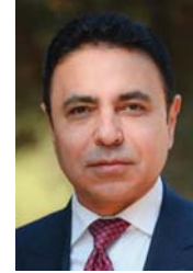
• رئيس بلدية أربيل نيز عبد الحميد

وقال رئيس بلدية أربيل نيز عبد الحميد في حديث لـ ( الصباح )، من أجل تقادي الهجمات الشرسة للكلاب السائبة في الشوارع بعد تسجيل عدد كبير من حالات الاعتداء والهجمات من قبل الكلاب على المواطنين والأطفال، لا سيما في المناطق السكنية، وكذلك لتصادي وتجنب إيذاء الكلاب، تم بناء ملجأ على مساحة 20 دونما من الأراضي في منطقة اجانا بعد 15 كيلومترا من مركز مدينة أربيل، وأن كلفة إنشاء الملجأ بلغت أكثر من 450 مليون دينار، ويحتاج إلى حوالي 10 ملايين دينار شهريا لصيد وجمع الكلاب الضالة، ومعالجتها من الأمراض المعدية والخطيرة وتطعيمها وتقديم الخدمات لها من قبل مديرية البيطرة في المدينة .