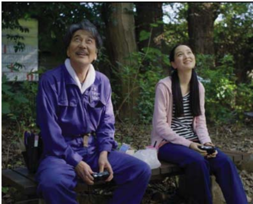
• الممثل الياباني كوجي ياكوشو (هيراياما) والممثلة ريسيا تاكيتو (نيكا) في "الأيام العظيمة" (2023)

تمود فكرة الفيلم لدى فينذرز إلى الاحتمالية التي يتخيلها السلطات اليابانية بيوم المرحض العامي، حيث يتنوع يوميات عامل المرحض هيراياما الهادئ والطييف، الذي قارب منتصف عمره، من لحظة استيقاظه على صوت مكنتسة عامل النظافة، ليشرع في روتينه اليومي بالنظر إلى الأشجار التي تظلل نافذته، ثم فراءة سطر من كتاب قبل أن يدهمه التماس للناس وهو يقرأ، يعلق ذقنه وينظف أسنانه، ويروي نباتاته الصغيرة، ويرتدي لباس العمل ويشترى باذوات سيارته الصغيرة المكنتسة بأدوات التنظيف، ليبدأ يوم عمله الطويل ترافقه الشمس من شروقها، ليضيءها في غروبها. هكذا يعلق هيراياما بسيارته وما أن يطل على برج شجرة السماء في طوكيو، حتى يدخل الكاسيت في آلة التسجيل لتصدح أغنية تتكلم عن تلك الأيام الجميلة التي عاشها الغني يهنم هيراياما بعملية تنظيف المرحض لدرجة