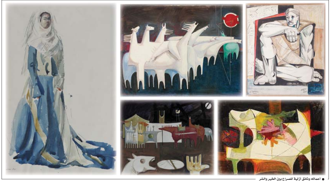
● أعماله وثنائق أزلية لتسارع بين الخير والشر