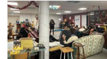
الأحفظاء كان في جمعية الادباء والمثقفين في مدينة، مينة، أيبناال

احضت جمعية الأدباء والمثقفين في مدينة أيبناال الفرنسية برواية الرجل من الوادي للكاتب سيبستين. وقد نال العمل الرجل من الوادي جائزة أركمان شارترين من بين عشرين رواية مقدمة إلى لجنة التحكيم التي سمته سيبستين بالاجماع والكاتب سيبستين من مواليد مدينة دارني عام 1950 لأبوين من الفلايين خريجة جامعة نانسي وحاصلة على درجة الماجستير في الأدب، عملت في الصحافة، وأدب الأطفال والشباب، ولديها أربع روايات كان آخرها الرجل من الوادي كما وحصلت على جائزتين الأولى كانت من معرض كتاب المرأة، والأخيرة أركمان شارترين. وفي جلسة الاحفاد تحدثت الكاتبة عن أحداث روايتها وبلدة الزمنية التي استقرتها والظروف التي ألفتها. وكان لها معها هذا الحوار القصير، بداية حديثنا عن الرواية وماهي القصة التي جعلت لجنة التحكيم تصوت بالاجماع وتنتخبها من بين عشرين رواية متنافسة.