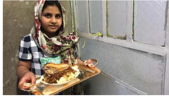
● الجار قبل الدار

ولمخانة الجار وأهميتها في المجتمع العراقي، فقد أوجد الخفاجي عدداً من النصوص والبيوتد الخاصة بحق الجار وعدم ازعاجه، إذ يقول الحامسي نور الدراجي، تتناول القانون العراقي عقوبة ازعاج الجار، بهدف توفير الراحة والاستقرار للمواطنين، وعدم التمدد على حقوق الآخرين، خاصة من يقيمون في السكن العمودي، مبيّناً أن هذه العقوبات توزعت من أصلية ومالية وأخرى تكملية مع مراعاة حق الجار في بعض التصرفات القانونية والإدارية في ما يخص البناء والعمل الإنشائي وغيرها من التفاصيل الأخرى.