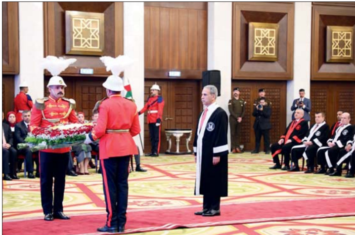
● فائق زيدان، استقلال القضاء هو المتجز الأهم الذي حملناه به

أما رئيس مجلس النواب المثاليين، فقال في بيان: «نتقدم بأسمى آيات التهاني والتبريكات إلى السلطة القضائية بمناسبة يومها الوطني، مجدداً التزام السلطة التشريعية بدعم استقلال القضاء وبما ينعيمه في الحفاظ على النظام الديمقراطي وصيانة مبادئ الدولة». وأشار إلى أن يوم قضاء قوي يمثل ضماناً حقيقياً لتعزيز الاستقرار في البلاد، وحماية الحقوق والحريات،