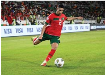
● المغرب يتطلع للوصول بعيداً