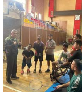
● استعدادات متواصلة للاستحقاقات المقبلة

وأضاف أن اللجنة البارالمبية وضرت جميع المستزمات لاتجاه مهمة فرقنا في غرب آسيا، إذ هيأت المسكرات التدريبية الكاملة والخارجية لرفع معدل الجاهزية البدنية للاعبين، كما عملت جاهدة على تذليل جميع الصعاب، أسلاً بواسطة تحقيق الإنجازات في مختلف الأصعدة الدولية.