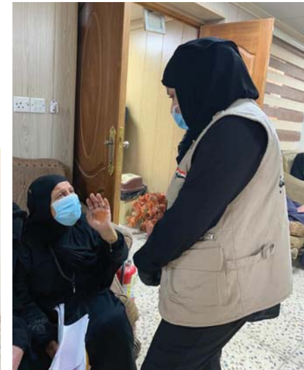
● استناد الأسرية