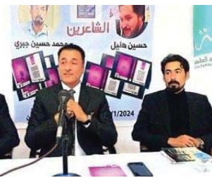
جانب من الأمسية