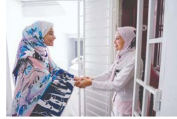
● الجيرة والاسلام.. أهمية كبيرة