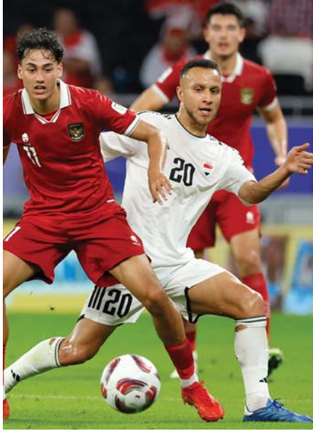
● دعوات لتحقيق الفوز