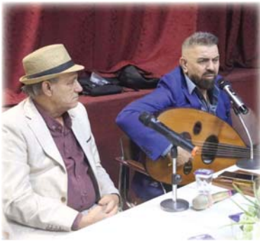
● جلسة الاحتفاء بالفنان قاسم ماجد

الحرية، كونه رحل خارج العراق، ولم يتواصل مع جيله ولم يتنازل عن ذائقته، ويعتبر بمقولة الصومور عازل كأ كان يريد أن يرتقي بالثقافة والوعي. أما قاسم الخطاط أحد أعضاء الفرقة التيمية فقد أثار تجربة الفنان المحتقن به، وأوضح أن كان يقاوم الضمور أجل أن يجعل لنفسه لوأ وسأنا بين الفرقة، وهو يستحق أن نحتفي به اليوم، ونستحق أن نمنحه الجميلة التي مزجت بين العزف والفرح. يتبع الحزن والفن والعزف بالذكر أن الفنان قاسم ماجد تمتد نحو الاغنية السياسية الساخرة والشعر والتمثيل، حتى هموم الناس الاشواق والرفيقية، إذ أعد الحظي به جميلة تقرب من مشاعرهم، وتوصل افكارهم بطريقة ساخرة تشدّد الوضع الاجتماعي السائد.