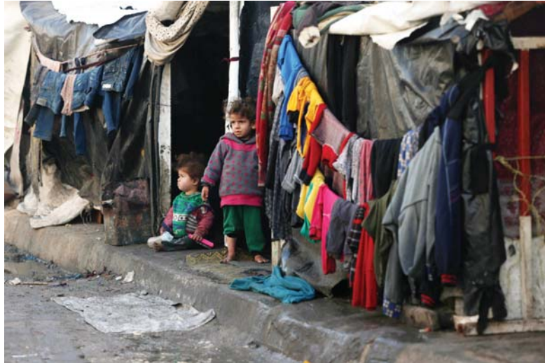
أعلنت وكالة غوث وتشغيل اللاجئين الفلسطينيين (أونروا) -أمس الثلاثاء- أن 750 ألف شخص في قطاع غزة يواجهون يوماً كارثياً، داعية إلى زيادة المساعدات بشكل كبير مع تزايد خطر المجاعة. وأضافت أونروا أن القتال المتّيف ورفض وصول الإعانات وانقطاع الاتصالات تعيق قدرتها على تقديم المساعدات بأمان وفعالية.

وجاء تبني العدوان على اليمن في بيان مشترك من الولايات المتحدة وبريطانيا في وقت سابق، وتضمن أن الضربة التي استهدفت تصديراً موقع تخزين تحت الأرض ومواقع مرصحة بقدرات صنعاء، والصاروخية والمراقبة الجوية في هذا السياق، أفاد مصدر عسكري يمني، بأن الأفعال الاصطناعية الأميركية والطارئات التجسسية للعدوان هُزلت في رصد أماكن إطلاق الصواريخ البحرية اليمنية، وأكد، أن كل الغارات في اليمن استهدفت جري استهدافها عشرات المرات وليست مواقع مهمة، مشيراً إلى أن هذه المواقع لا يوجد فيها سلاح ولا معدات وقوات. من جهة، أكد عضو المجلس السياسي الأعلى، محمد علي الحوثي، في تصريحه بعد الغارات أن الاستهداف الأميركي البريطاني هو محاولة جديدة لتلطي اليمن من ماثرة غزّة. وشدّد على أن الهدف الأميركي البريطاني من العدوان بأن يوقف اليمن عليه البحرية لن يتحقق، لافتاً إلى أن اليمن لا يدير الاستسلام. يشار إلى أن هذا العدوان هو الخامس خلال أيام الذي تشهّد الولايات المتحدة وبريطانيا ضدّ اليمن.