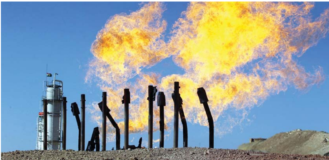
• رصدت الحكومة تمويلًا لاحتراق الغاز المصاحب

بعد انتهاء أعمال مؤتمر الأطراف المناخي "كوب 28" الذي عقد في "اكسبو" في مدينة دبي (30 تشرين الثاني ولغاية 13 كانون الأول 2023)، تأتي مهمة الاستفادة من مخرجاته عراقياً لدعم سياقات التخفيف والتكيف مع التغير المناخي وتأثيراته في العراق وبما ينسجم مع الخطة الوطنية المقرة التي شكلت الأساس لمباحثات الوفد التفاوضي العراقي. وقد جاء هذا المؤتمر حصيلة نصف قرن من اهتمام المجتمع الدولي بالتغيرات البيئية وخاصة المخاطر الناجمة عن ثلاثي التحديات في الازدياد المتسارع في درجة حرارة الكوكب وأنماط الطقس المتطرفة وفقدان التنوع الأحيائي وتلوث الماء والهواء والتربة. ويعتبر العراق أحد البلدان الأكثر ضرراً من التغير المناخي بينما لا تتعدى نسبة مسؤليته عن مجمل الانبعاثات عالمياً 0.2 %.