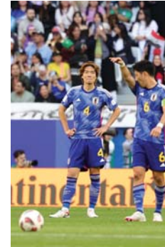
● السامواري يطمح لاحتياز الكؤبة التاريخية

ومن المنتخب الياباني بفترة قصيرة خلال مباراته الافتتاحية أمام فيتنام عندما منصف الشوط الأول قبل أن يقبل الطارئة على مناصه ويخرج هاتراً 4-2. ويحتاج المنتخب الياباني إلى التعادل على الأقل لضمان التأهل إلى الدور الثاني. ويستثمر غياب جناح براتون الكندي كارو ميتوما على الأرجح عن صفوف "السامواري الأزرق" لأنه لم يتدرب مع زملائه حتى الآن ولم يلعب ميتوما منذ إصابته في الكحل خلال تعادل فريقه مع كريستال بالاس 1-1 في 21 كانون الأول الماضي في الدوري الإنكليزي. وضمه مدرب اليابان هاجيمي مورياسو إلى التشكيلة الرسمية لكأس آسيا، لكن اسمه لم يتردد على لائحة المباريات الأولى للثلاثين خاضتها اليابان في قطر. في المقابل، خيب مهاجم ريال سوسيداد تاكافوسا كيوو الأمل على الأرجح، بعد أن نزل احتياطياً في المباراة الأولى مع فيتنام ثم شارك أساسياً أمام العراق. وكانت الأمل معقود على كيوو الذي يطلق عليه لقب "ميسي اليابان" ويتأق بشكل لافت في صفوف فريقه الإسباني هذا الموسم لا سيما في غياب ميتوما، لكنه لم يقدم المستوى المطلوب حتى أن مدربه استبدله في الشوط الثاني في لقاء العراق.