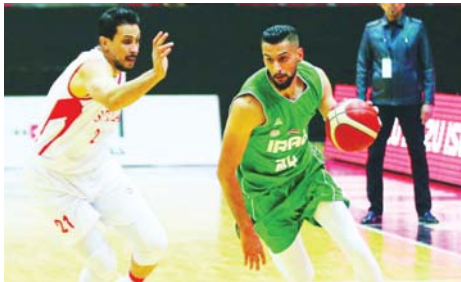
● سلة الوطني يستعد بخبرات تدريبية جديدة

التبائية بيروت للعب مباريات ودية تحضيرية، بغية الوقوف على الجاهزية الكاملة وأوقعت القرعة التي أجريت في 19 من شهر كانون الأول الماضي في العاصمة القطرية الدوحة، منتخبنا في المجموعة الرابعة رفقة السعودية والأردن وفلسطين، إذ سيستفتح أسود الرابدين مشوارهم الآسيوي بلقاء الأخضر السعودي تستضيفه قاعة الشعب في شهر بغداد في الثالث والعشرين من شهر شباط المقبل، على أن يواجه المنتخب الفلسطيني يوم السادس والعشرين من الشهر ذاته.