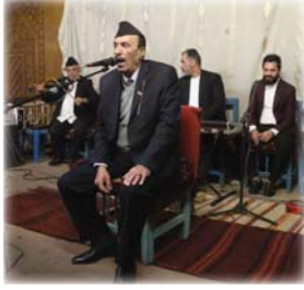
● خالد السامرائي في المتحف البغدادي

● بغداد: كاتلم لازم ● تصوير: نهاد العزاوي يصور هذه الأيام فنان المقام خالد السامرائي مشاهده ضمن احدث مسلسل يجسد حياته الفنان يوسف عمر. السامرائي قال لـ «الصباح» اواصل منذ ايام في تصوير احداث مسلسل لرائد المقام العراقي يوسف عمر. وهو من تأليف كمال لطيف وسالم واخراج نبيل مهدي هلال. ليمت فبوتلي مطرباً للمقام. ومن هناك بدأت رحلتي وقدمت المقام في 42 دولة عربية وعالمية منها: زياراتي إلى لندن وأميركا التي راقتني فيها الحيرة لعمدة توفيق، كذلك في فرنسا ومع الفنانة عفيفة اسكندر لأحصل على الكثير الجوائز الدولية. وعلى صعيد الدراما، فقد شارك السامرائي في عدد من المسلسلات والمسرحيات وكان آخرها مسرحية اقرأ باسم ربك.