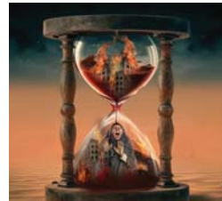
ملصق للفنانة كفاخ آل شبيب