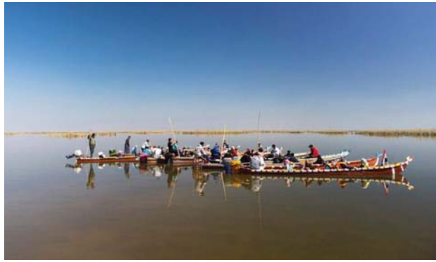
أدب ● بعد موجة الأمطار الأخيرة، الأوبار تنتفخ