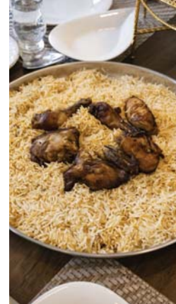
● السمنة واحدة من أكثر المشكلات الصحية شيوعا حول العالم

تقول منظمة الصحة العالمية أن أكثر من 30% من العراقيين يعانون من السمنة، وهذا يعني وجود نحو 13 مليون عراقي يعاني من هذه المشكلة، وهو رقم مرتفع جدا جعل العراق في المرتبة الخامسة والخمسين في قائمة البلدان الأكثر بدانة، إذ يشير تقرير الاتحاد العالمي للسمنة لعام الماضي إلى وجود 2.6 مليار شخص بدني في العالم ويتوقع التقرير إلى وصول العدد إلى 4 مليارات شخص بحلول عام 2035. وتقاس السمنة علميا بواسطة ما يعرف مؤشر كتلة الجسم (BMI) من خلال تقسيم وزن الشخص بالكيلوغرام على مربع طوله بالتر، ويستعمل كقياس لتحديد ارتفاع دهون الجسم، وأداة لتقسيم الأوزان إلى شئات ترتبط مع زيادتها بتطور مشكلات