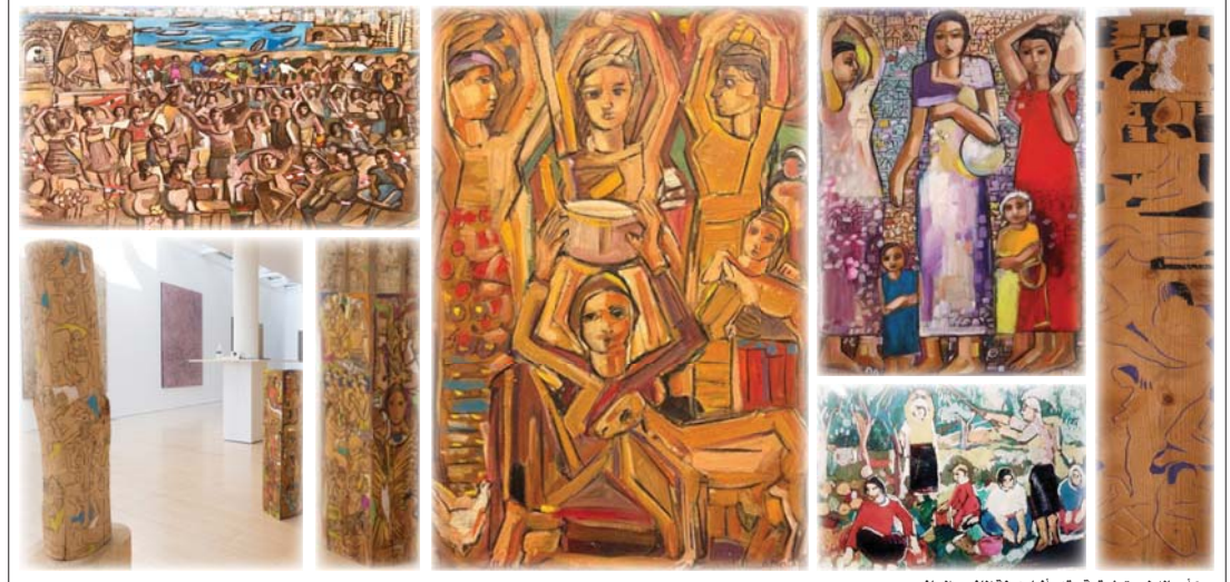
إعماله ليست شيقية، بقدر أنها مدينة الماضي والحاضر

ويحترق جميل ملاعب حضورا، عودة إلى رسم الموديل / المرأة، ويذكر الفنانين والطلاب بضرورة العودة إلى القاعدة، آفء آباء الرسم أي- رسم الشكل الإنساني، والمرأة هي الدور والحضارات في العودة إلى علم الفن الفرعوني، وعلم مقاييس الشكل الهندسي، ومزيج من رسم الجسد والروح التجريدية والوجودية، قاعدة لحياء أخرى من يدين وجهين وجسدين والأنا والآخر. يحسب المعرض تاريخ من العيون السومرية الجادة، كأنها عيون الآلهة، عيون واعي وأشكال تحكم فن أيام الفرانعة، والرومان والسومريين ومن أيام العصر الوسيط، وطائفة للرسم بمثابة هندسة للجمال والزيات ما باقي التاويلات الأخرى. تجربة فنية أساس في عمل الفنان في رسم الإنسان، الأنا والآخر، شكل الإنسان، وروح كقاعدة تجريبية لكل الفنون التشكيلية، وقنون الرقص، المدهشة والتأمل، وهي قاعة لفهم الكون، أما المرأة فهي كين صفيح متكرر في كهون جسدي، تفهمه، وتفهم الطبيعة الكثفة في جمال الجسد البشري.