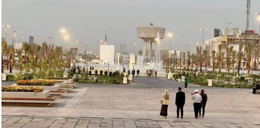
الخط المبهج من النخيل المفروس في ساحة التحرير وحديقة الأمة

وقد تحرف النتائج عن الاستقامة إلى ما هو خطأ أو ما يخر ويربك أو يولد التذمر والاشتباه، تماماً كما أساء مظهر هذه النخلة الجفناء إلى صف النخيل الجميل ورائحة التبو والعافية. في حياتنا العملية نمر بهذا نماذج وقد يتولون الأسيور، فتجد هذا العدد الكبير من المشاريع المتكئة التي تباعد الإزادة المخلصنة الجديدة وتؤكّد على استكمالها. كان بعضها ممكن الإنجاز لولا "الاعجف، هنا" والاعجف، هناك وفي هذه المؤسسة أو تلك الوزارة أو هذه المنشأة وذلك المشروع. انتهت للخبر المبهج يقول: أُنجزت إعادة عمل مصفى يبيج خلال سبعة أشهر وقد كان مهجوراً مهملًا أكثر من عشر سنين؛ رفضت بيدي وأتاني مكاني وقتك المايلين، سلاماً وأنا أشهد هذه الثورة الوطنية، هذه العمارة المباركة ودينامية العمل أو المتابعة إلى تلك، للجشرات، للظهور الجديدة، للدارس، للمشاريع، للخطط، والعرضات الفاعل في المناسبات المهمة والملتزم.