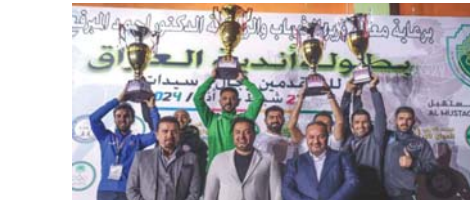
● تتويج مستحق

تستأنف، اليوم الاثنين، في بغداد وذاخو منافسات المرحلة الثانية للدوري الممتاز لكرة السلة بإقامة 5 لقاءات أبرزها مواجهة صاحب المركز الثالث النطف مع العاشر نطف الشمال في قاعة الشعب. وتشير جميع التوقعات إلى أن أفضل بطل النسخة السابقة للبطولة في حسم النتيجة لصالحه، لاسيما أنه مثقل بفوز في آخر مباراة بالمسابقة على زاخو بنافق 11 نقطة، فضلاً عن اتلاكه جميع المقومات الفنية والبدنية، في المقابل يلعب الضيف نطف الشمال إلى أن يكون نداً قوياً وتقدم مستويات أفضل وتحقيق مفاجأة تدفعه إلى احتلال مركز أفضل من موقعه الحالي.