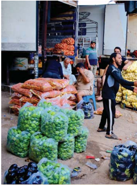
سوق جميلة الشعبية