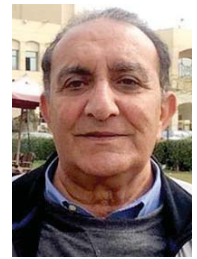
• حاتم الصكر، الانجلوسكسوني

أخذت البحوث، التي سبقت التجارب، الرؤى، النماذج، بحثاً مَرْخَباً بـ «نحو قصيدة نثر عراقية» (4)، لكشف (مدخل نظري) لا مبنٍ عملي، يذكرينا حاتم الصكر فيه «مقبل من المؤثر الانجلوسكسوني مثلاً بتجارب يوسف الخال الذي ذهب سريعاً إلى المؤثر الديني وما في الكتاب المقدس من أساليب وأفكار في المقام الأول» (5) حيث الاستجابة له من «شعراء جماعة كركوك خاصة (سركون بولص وفاضل الزراوي وصالح فائق وجان ديمو ومويد الرواي ويوسف سعيد)» (6)، بتدريجاً، مثماً في عندي استجابة، يوسف سعيد، الاعتيادية مطلقاً، أي كَلْفَةً، بدءاً من النص الأول قبض الربيع، في مجموعته الأولى (الموت واللغة، بيروت، لبنان، 1968) عن سليمان (7)، الضد العالق برطوية الأيام، نث من نايه خمره الزمن/ اصابع الحكمة تبثح عن سيف سليمان (8).