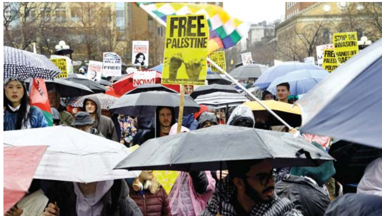
شهدت كل من الولايات المتحدة وألمانيا وبريطانيا وكوبا ولبنان وتونس والمغرب، خلال الساعات الـ24 الماضية، مظاهرات ووقفات تضامنية تدعياً بالعرب الصهيونية على غزة ودعماً للفلسطينيين، وشارك الآلاف في أميركا بمسيرات جابت شوارع عدد من الولايات تديداً باستمرار الحرب، وذلك بعد دعوات للمشاركة في «اليوم العالمي للعمل من أجل فلسطين».

وحسب هذا التقرير، فقد تم فرز 4000 صوت من أصل 5000 مركز اقتراع في محافظة طهران، وبناء على ذلك، سيذهب جزء كبير من المرشحين المختارين في طهران إلى المرحلة الثانية، وتمتلك 30 مقعدا والرك وشيعرات وإسلام شهر وپرهيز) 30 إجمالي 30 مقعدا من المجلس الإسلامي، ويتطلب فوز كل مرشح في المرحلة الأولى الحصول على 20 نائبا من الأصوات. وأعلن رئيس مقر الانتخابات في محافظة طهران، السبت، إمكانية تمديد الانتخابات هذه للنتيجة إلى الجولة الثانية، وفي الوقت نفسه، تزايدت التكهّنات بشأن العدد الكبير من الأصوات الضائعة، التي تم الإبلاغ بها في التصديق.