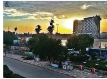
• ربيع ميسان