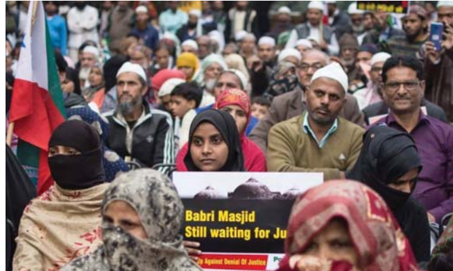
• تظاهرة احتجاجية لسلمي الهند ضد هدم المساجد