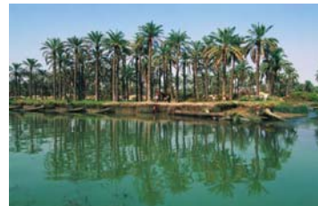
● التوجه نحو زراعة النخيل