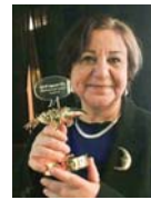
• لجينة الأصيل

قدمت الأصيل رسومات لأكثر من سبعين كتاباً للأطفال، وتأليف ثلاثة كتب أخرى، وأعمالاً تلفزيونية، وأفلام رسوم متحركة إعلانية إلى جانب أكثر من مئة لوحة افتتها لها المتاحف، فضلاً عن الإشراف فنيا على عدد من مجلات الأطفال العربية والورشات المتخصصة في مجال رسوم كتب الأطفال، أنها تعتبر تكريمها الأكبر يوم يقول لها الأهل تريينا وبيننا أولادنا عن رسوماتك.