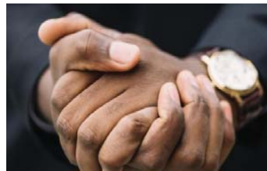
• تصديق الذات