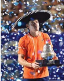
● لقب جديد لدي مينور

في المقابل، فشل رود، وصيف بطلة روزان غاروس