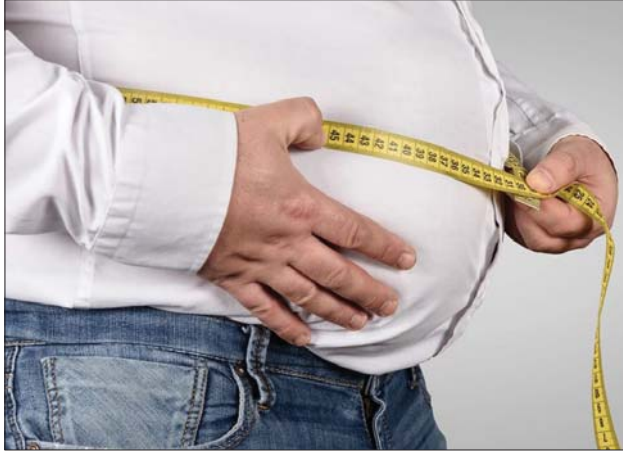
● البدينة فاه علاجه التمارين الرياضية

البدناء من خلال تنظيم برامج غذائية تناسب وضعهم الصحي وتمنع حياتهم، غير أنه لا يوجد عوائق اجتماعية تعيق عزيمة البدناء في رحلة التخلص من الوزن الزائد وخاصة النساء اللاتي يعانين من مشاكل السمنة والتقسيم الجمالية، مثل نظارة الوجه ولونه المائل للاحمرار .