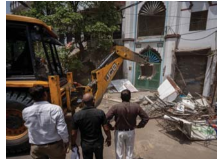
• أيلة تقيلة تعمل على هدم إحد المساجد في الهند

وأدت عمليات الهدم إلى خروج السكان المسلمين الغاضبين إلى الشوارع، وقتل ستة أشخاص على الأقل أثناء الاشتباكات مع الشرطة وفرضت السلطات حظراً للجوال في المدينة، لكن المئات المسلمة الخائفة قامت للصحافة إنها تريد فقط هداية وشيكل المسلمون نحو ذلك سكان مدينة هالوانسي البالغ عددهم 220 ألف نسمة، وفقاً لأحد تعدادات سكاني أجري سنة 2011. وقال بوشكار داسي، رئيس وزراء ولاية أوتاراخاند، إن حكومته ستستخدم إجراءات صارمة ضد "مشي الشعب والكارحين عن القانون". وكتب على موقع أوكس، المعروف سابقاً بوتيتر، يتم تحديد هوية كل مشي الشعب المتورطين بأعمال الحرق العمد ورشق الحجارة، ولن يتم التسامح