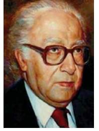
• جبرا إبراهيم جبرا

كثيراً، ولكني نفضت جمرأ خافتاً واشعلت حريقاً، ومرت نفسي فيه وفيه، ومرت الشهور التسعة فولدتا معاً، أنت من شفتي/ وأنا من شرتك (25) ص 39.