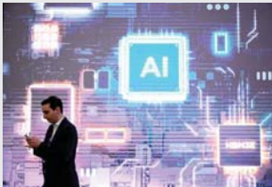
• مركز الشركات الصنعة على الذكاء الاصطناعي في استراتيجيتها التسويقية وسط تباطؤ في السوق

على الرغم من انخفاض مستويات مبيعات الهواتف الذكية إلى أدنى مستوياتها منذ عشر سنوات، تأمل الشركات المصنعة في أن يسهم الذكاء الاصطناعي في إنعاشها، وتسعى من خلال العرض العالمي للهواتف المحمولة في برشلونة إلى جذب انتباه المستهلكين إلى موديلاتهم الجديدة. ولا حظ مدير الأبحاث في شركة «سي إس إس إنشاي»، بن وود، أن الهواتف الذكية أصبحت ممتعة، ولم تعد مثيرة كما كانت من قبل، والتغيرات التي تحملها التماذج الجديدة لا تكون كبيرة جداً. ومع أنّ الكاميرات والشاشات وعصر البطارية أصبحت أفضل، فبلا، من ذي قبل، رأى المحلل أن على الشركات المصنعة إضافة المزيد من الميزات «المثيرة» إلى منتجاتها لتستجيب للأشخاص على شراء الهواتف الأحدث. وتوقع أن يكون الذكاء الاصطناعي «وسيلة لتحقيق ذلك». فهذه التكنولوجيا التي تتيح إنتاج المحتوى (من نصوص وصور وما إلى ذلك) بناء على طلب بسيط باللغة البومئة، غزت العالم سنة 2023، ما أدى إلى تسابق محموم في هذا المجال بين المجموعات التكنولوجية الكبرى. ولم تبخل شركة «ماسونج» الكورية الجنوبية العملاقة وفي عام 2023، انخفض عدد