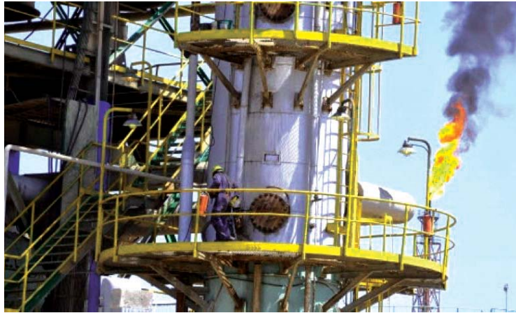
توسع في صناعة مشتقات البترول

كشفت الحكومة جهودها الهادفة إلى زيادة عدد المنشآت النفطية والتوسع في صناعة مشتقات البترول، لما تلك الخطوات من أهمية استراتيجية تمثل ركيزة اقتصادية وطنية بمقدورها تعزيز المواد المالية للبلاد وسد الحاجة التشغيلية من استيراد تلك المشتقات، فبينما افتتح مؤخرا رئيس الوزراء مصطفى المشال في بييجي، والذي سيسهم وفقاً للتوقعات بتغطية كامل احتياجات البلد من المشتقات، كشفت عضو لجنة النفط والغاز البرلمانية، النائب زينب جمعة الموسوي، عن وجود توجه حكومي لافتتاح مصافي جديدة في الأنبار والبصرة والسماوة.