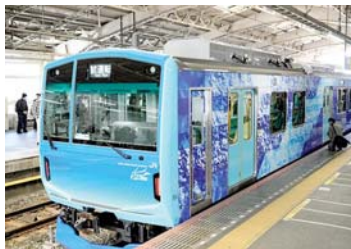
• قطار الذي يعمل بالكهرباء المولد من الهيدروجين

القطار الذي يعمل بالكهرباء المولد من الهيدروجين، بعد جزءاً من مبادرة شركة شرق الكوريين للسكك الحديدية (JR East) لإزالة الكربون من السكك الحديدية، بهدف تسويتها في السنة المالية 2030. وتم تجهيز Hybrid بخلاصة وقود، وهي تولد الكهرباء عن طريق تفاعل الهيدروجين والأكسجين، فضلاً عن بطاريات التخزين والهدف أن يعمل القطار دون انبعاث ثاني أكسيد الكربون. جرى تطوير القطار الهجين بالتعاون مع صانع السيارات الأشهر شركة تويوتا موتور، التي تسوق مركبة هبراي التي تعمل بخلاصة الوقود، وصممت التكنولوجية