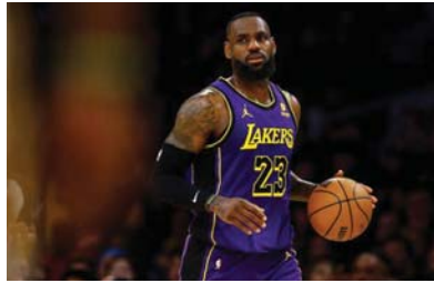
● رقم قياسي جديد ليريون

ووصف جيمس الذي ارتفع صدارة الهافين التاريخي لدوري من كريم عبد الجبار (38390 نقطة) في شباط 2023، هذا العهد التاريخي بأنه «حظومر» في الوقت ذاته لأن فريقه خسرو اللقاء أمام تاغثس لافت