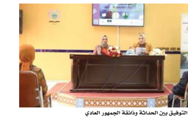
• تشارت الجلسة التوفيق بين الحداثة وواقعة الجمهور العادي

الذكورات... فهناك الكثير من اللوحات التي رسمتها تحمل مكراتسي، فلابد أن تأتي ذكري معبئة وتشكل داخل اللوحة كما هو الحال عند نيقية الفنانين ونوهت أيضاً بالتوفيق بين العدالة ولتفة الجمهور العادي وغالباً ما يكون له رأي آخر في الفن التشكيلي التجريدي، حيث يؤمن بأنه خريسات لا أكثر، لأنه يؤمن بالواقعية، كما أن المثقفي العادي يتأثر بالألوان لأنه يفسرها كما يحب، كما هو حال قصيدة النثر.