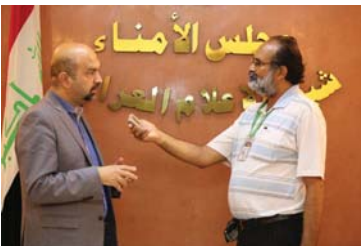
• علي الشلاه مع المحرر

يستعد الشاعر د. علي الشلاه، لإصدار إعماله الشعرية الكاملة، التي تضم ثمانية دواوين ليت المعري كان أعشى والتوقعات وكتاب الشين والعبارات والأضرحة والبابلي علي وهروب بابلي ولا باب للبيت. وسيصدر للشلاه كتاب يجمع السيرة الذاتية بالرواية لتست بطلا لكفهم جبناء.. عن منشورات بابلي وبغداد دار تيانة في القاهرة.