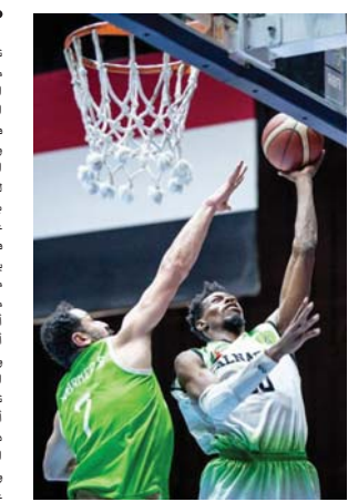
● عودة نعمة المباريات

تستأنف، اليوم الاثنين، في بغداد وذاخو منافسات المرحلة الثانية للدوري الممتاز لكرة السلة بإقامة 5 لقاءات أبرزها مواجهة صاحب المركز الثالث النطف مع العاشر نطف الشمال في قاعة الشعب. وتشير جميع التوقعات إلى أن أفضل بطل النسخة السابقة للبطولة في حسم النتيجة لصالحه، لاسيما أنه مثقل بفوز في آخر مباراة بالمسابقة على زاخو بنافق 11 نقطة، فضلاً عن اتلاكه جميع المقومات الفنية والبدنية، في المقابل يلعب الضيف نطف الشمال إلى أن يكون نداً قوياً وتقدم مستويات أفضل وتحقيق مفاجأة تدفعه إلى احتلال مركز أفضل من موقعه الحالي.