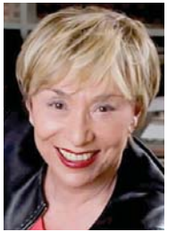
• جوليا كريستيفا، علم النص