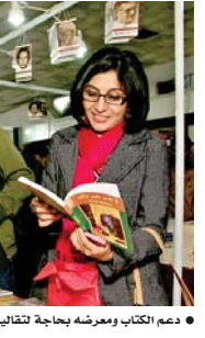
• دعم الكتاب وعرضه بحاجة لتقاليد مركزية متبينة من قبل الدولة