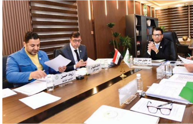
● جهود حثيثة للارتقاء بالعمل الأولمبي

التخمينية للسنة المالية ( 2024 ) وإحالتها إلى اجتماع الجمعية العمومية للاعتيادي المقرر