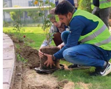
● التشجير أول الحلول

وزارة الزراعة بدورها أطلقت مؤخرا مبادرة التشجير الحضري وزراعة خمسة ملايين شجرة في البلاد، حيث أكد الوكيل الفني لوزارة الزراعة