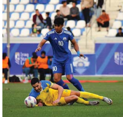
● جولة المنافسات