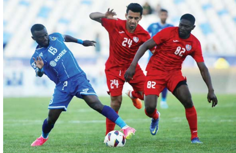
● الكبار يسعون للتعبير