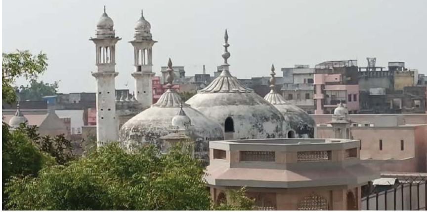
مساجد الهند القديمة عرضة للإزالة بقرارات حكومية