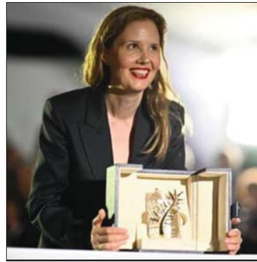
● المخرجة جوستين تشریح بسمة كان، الذهبية عن فيلمها «تشریح السقوط» (2023)

متخفص عنها تميزاً عن قوتها، وتظهر بشكل أقل ارتباطاً كما من متهمه في جريمة قتل انتبهت من الفيلم، وأنا متعجب بزم ساندرا، بينما مارلت أتساءل عما إذا كان هذا العزم قد قادها إلى فعل ما لا يمكن تصوره.