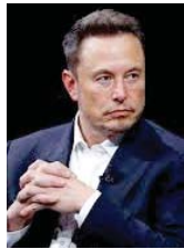
• إيلون ماسك

وطالب ماسك تحديداً بإزالة «جي بي تي إي» عن التصريح الممنوع من «اوبن ايه أي» لـ«مايكروسوفت»، بالإضافة إلى الحصول على تعويض لم يحدد قيمته.