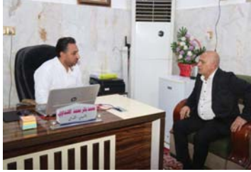
● الأمين الخاص مع الحرر

● عامر جليل إبراهيم ● تصوير: إعلام الأمانة العامة للمزارات الشيعية