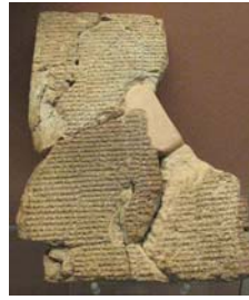
• لوح سماري. المتحف البريطاني

كان سكان بلاد الرافدين القدماء يؤمنون أنهم إذا اتبعوا مجموعة متناسبة من التعليمات فسيحصلون (أثناء النوم) أحلاماً تتضمن الاتصال بالآلهة. درست عائلة الأشوريات «أينو هاتينين» من جامعة تودفيغ ماكسيميليان ميونيخ عدداً من الرقيمات السامرية، التي حوت على إرشادات لاستحضار هذا النوع من الأحلام. تعود أولى تلك الرقيمات إلى نحو 1100 800 عام ق.م. كما جرت الإشارة إلى تلك التوجيهات في رقيمات أخرى يعود تاريخها إلى أواخر القرن الأول ق.م.