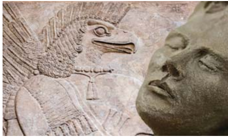
• كان لتفسير الأحلام تأثير كبير في حياة الشخص بوادي الرافدين قديماً