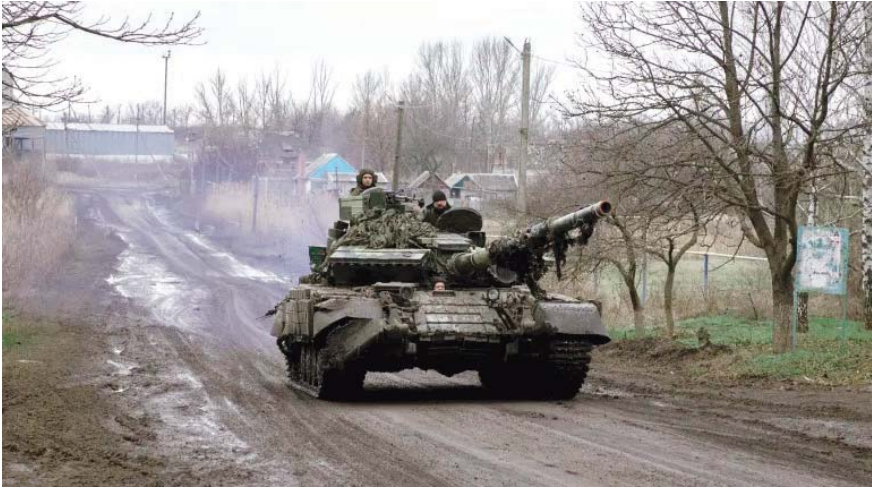
القوات الروسية تغير من تكتيكاتها بعد الهجوم على مدينة «أفدييفكا»