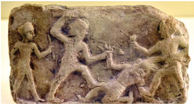
• كلكاش وانكيكو وبتلان الوحش خمبايا في غابات الارز، القرن 19 - 17 ق.م. متحف فوديرساين. برلين

القديمة التي كانت قامت بمنطقه بلاد ما بين النهرين؛ وما زال موجوداً حتى اليوم يمكن إيجاد تفسيرات الأحلام في بلاد ما بين النهرين القديمة في أديها؛ مثل ملحة كلكاش الشهيرة ( = عشوان ملحة Atrahasis- = ) من القرن الثامن عشر ق.م. بعدة روايات على أنواع الطين سُئمت باسم بطها. أتراحسس تروي أسطورة خلق وفضة طوفان. المترجمة. عن موسوعة ويكيبيديا كما يبدو أن تفسير الاحلام كان امر شائع الممارسة في الحياة الواقعية، كما يتضح من خلاصة النصوص المعروفة باسم إنكار زافيق. Bkar Zaqliq ترجمت على أنها النص الأساسي للإله زافيق)؛ أو ما يعرف عموماً