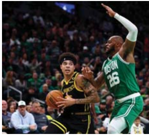
● خسارة كبيرة لوريز

نقطة (82 - 38)، وهو أكبر تقدم له في الشوط الأول في تاريخه وأكبر فارق يتخلف به ووريز على الإطلاق في الربيع الأوائل وقال تايتوم، "عيد ميلاد رائع يجب أن أفعل ما أحبه أمام أفضل المشجعين في العالم وأحقر الفوز. وعزز بوسطن صدارته للدوري والمنطقة الشرقية برصيد 48 فوزاً مقابل 12 خسارة، بينما مني غولدن ستايت ووريز بخسارة 28 مقابل 32 فوزاً.