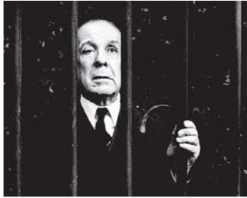
بورخيس، المتفاحة وصنعة الشعر