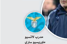
مدير لاتسيو ماوريسيو ساري