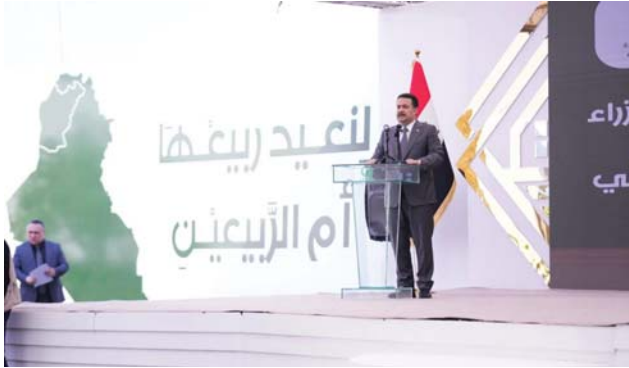
رئيس الوزراء، مجمع الغزلاني سيخضع للمتابعة بشكل دقيق في جميع مراحلها

138 سربياً ورأس رئيس الوزراء محمد شياع السوداني اجتماعاً لمجلس محافظة نينوى، عقد في قضاء سنجار، مشيراً إلى حاجة المحافظة لجهد مضاعف، إثر ما عاشته من دمار بسبب الإرهاب، ومعالجة مشكلات مواطنيها. وأوضح أن الحكومة الاتحادية ملتزمة بدعم الحكومات المحلية، وأن أولويات المحافظين ليست بعيدة عن أولويات الحكومة، في الخدمات وتوفير فرص العمل ومعالجة الفقر والإسلاج الاقتصادي، وبيّن أن عقد هذا الاجتماع في قضاء سنجار بمثابة رسالة لأهالي القضاء عن استعداد الحكومة للبدء بحملة إعمار واسعة، ووضع الحلول على مستوى التخصصات المالية، مؤكداً تخصيص الحكومة 50 مليار دينار لصندوق إعمار سنجار وسهل نينوى في الموازنة الاتحادية. وخلال ترؤسه في قضاء سنجار، اجتمع ضم قادة الأجهزة الأمنية والتشكيلات العسكرية في محافظة نينوى، بحضور نائب قائد العمليات المشتركة، استمع القائد العام للقوات المسلحة إلى عرض شامل من قبل القادة الأسيين، عن طبيعة المهام والتحديات والأهداف المتحققة، ومدى الجهودية العسكرية في هذا القطاع الاستراتيجي المهم.