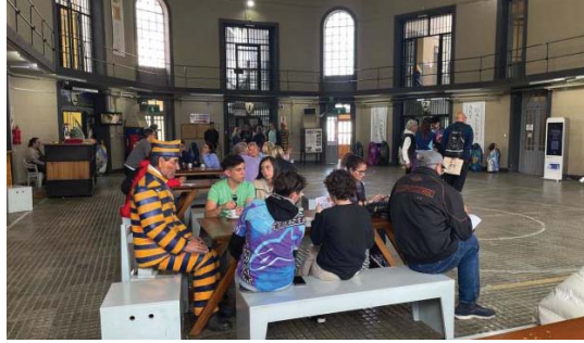
• سواح يجلسون مع تمثال شخص نزلأه سجن أوشوايا

وتزوج متاجر ألدا لعدد لا نهاية له من الهياكل التذكارية التي تعمل طاق السجن، من بينها ملاعب الأطفال وطائرات الفرس ذات التصميم المميز لزي السجن. تخطيط أقبية صفراء وزرقاء، ويمعاكي قطار نهاية العالم الذي يجتاز منظره تيرا ديل فويغو رحلة الغاية التي يقوم بها السجناء يومياً. ويبدو الركاب إلى تجربة صخر منضج. يقول ريان إدواردز، مؤلف كتاب أوكولوجيا السطران، الذي يتخصص في أوشوايا وترائه، إنه لا ينبغي للناس أن ينسوا ماضي أوشوايا، ويضيف: من الغريب للغاية أن تترك القطران، وتسمع القصص، وتشرع بالحزن حيال ذلك،