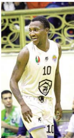
● حضور فاعل مع سلة الحلة

يذكر أن اللاعب الأميركي كان قد عاش فترة احتراف في دوري بيوو قبل أن يلتحق بالنادي العراقي