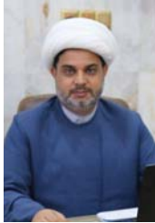
● الشيخ عجيل المدائني