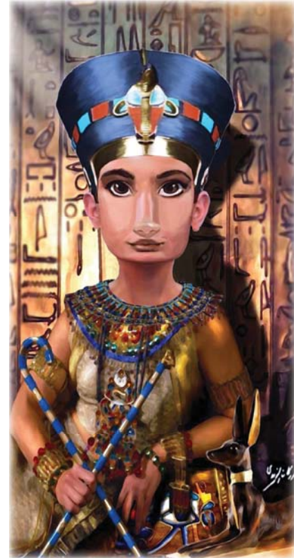
● الفنان أسس أسلوباً متميزاً في رسم الشخصيات