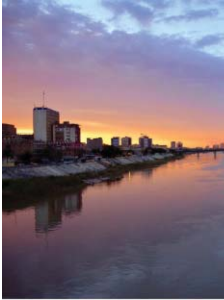
غروب الشمس من منفاف نهر دجلة