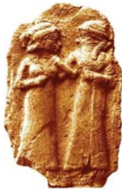
• نحت يمثل زواج إينانا وإيموزي