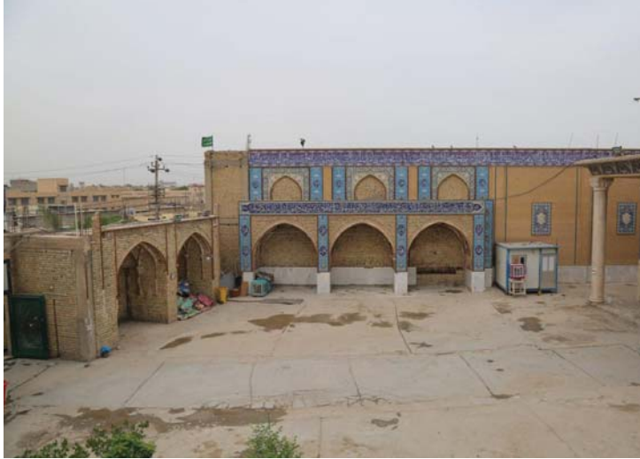
● باحة المرقد