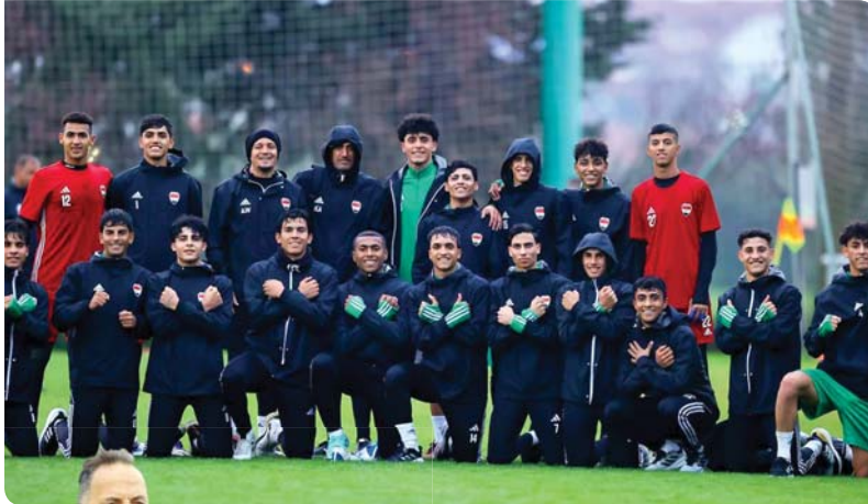
● مشاركة مهمة لمنتخب الشباب