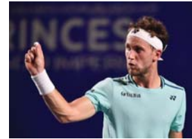
● رود يعود لتأدي العشرة الأوائل