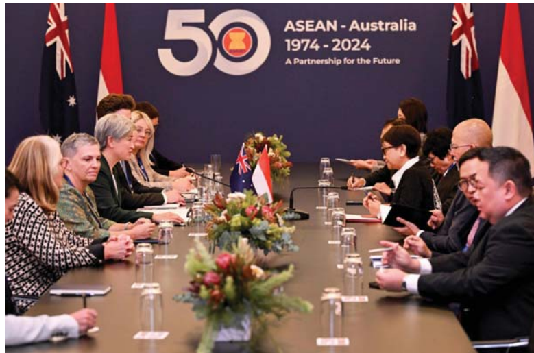
يعتزم زعماء رابطة دول جنوب شرق آسيا (آسيا) وأستراليا المجتمعون في مليوني التمديد "بالتهديد بالقوة أو استخدامهما" لتسوية نزاعات المنطقة، في إشارة ضمنية إلى بكين وذكر مشروع بيان مشترك "تحثن تلميح إلى منطقتي احترام فيها السيادة والسلامة الإقليمية، وتدار الخلافات عبر حوار محترم وليس من خلال التهديد بالقوة أو استخدامهما".