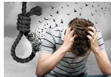
أرواح هائمة في ضفاهات الموت