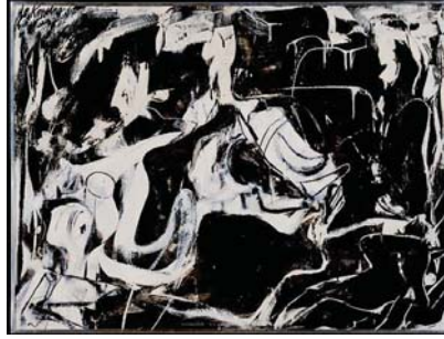
● لوحات الرسام وليم دي كونغ

حياة تلجمّ فم الضادق وضواءه وترتبّ التموّش على أنها دمّ للبقطة! سأكتفي وقد أعادوا إلى التلازم صوحوا وللأفلام الجافة محارلة في المضيّ