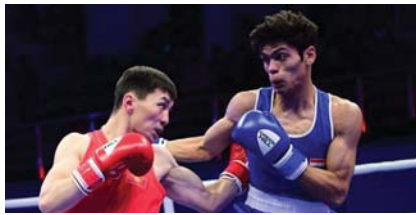
● صوححات لتتاهل إلى المؤتمرات

أعلن مدرب منتخبنا الوطني برفق الأتقال، عمار يسر، أن استعدادات الرباع على عمار للدورة الأولمبية المقبلة التي ستقام في باريس 2024، تسير على وفق ما مخطط لها من قبل اللجنة الأولمبية. وقال يسر: إن الاستعدادات جارية على قدم وساق من أجل الوصول إلى الجاهزية التامة قبل الدخول في غمار منافسات الدورة الأولمبية، مبيناً أن الرباع على عمار ينتظم الآن في معسكر تدريبي تايلند قبل المشاركة في البطولة التأهيلية التي ستقام هناك في الأول من شهر نيسان المقبل. وأضاف، أن البطل على عمار أصبح رسمياً ضمن عشرة رياعين تأهلوا إلى الدورة الأولمبية في