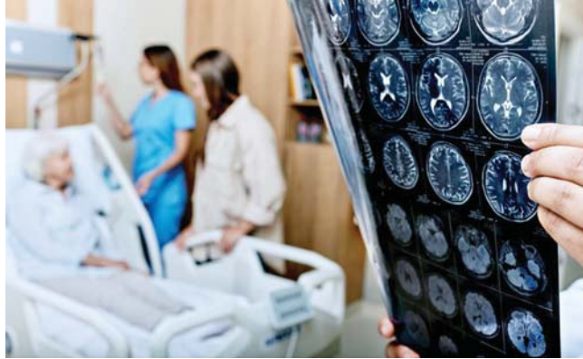
• فاعلية هذا الاختبار ثبتت في مرحلة ما قبل سريرية، حتى قبل ظهور الأعراض للعرض لهذا المرض

فضاداً يفيد اكتشاف ارتفاع خطر الإصابة بالمرض، إذا لم تتوافر وسائل لمعالجة منع ظهوره ومع ذلك، لا يستطيع فريوسوني أن يصيغ فحص مرض الزهايمر بدقة ذات يوم. وقال تحسن اختبارها أيضاً بعض الأدوية الهامة إلى تقليل خطر الإصابة بخرف الزهايمر. وأضاف: «ربما، في غضون خمس أو عشر سنوات، سيمسح ذلك في الممارسة السريرية، عندها، ستكون قادراً على أن أوصي بقياس المؤشرات الحيوية للدم (كأداة فحص)، ولكن ليس اليوم».