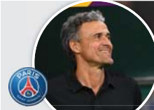
مدير جرمان لويس انريكي