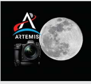
• تعمل نيكون مع وكالة ناسا لتصنيع كاميرا من مرة سيستخدمها رواد الفضاء خلال مهمة أرتميس القادمة للوكالة Artemis III من أجل توثيق عودتهم إلى القمر.

موجودة عند إرسال رواد فضاء آخر مرة إلى القمر في مهمة يوليو 17 عام 1972. واستخدم أعضاء طاقم مهمة يوليو بدلاً من ذلك كاميرات معدلة كبيرة الحجم تقدر إلى معدلات الرقوة، وتحوي الكاميرا القمرية العالمية المحمولة معد الرقوة، وتتيح إمكانات الفيديو الموجودة في 29 أفراد طاقم مهمة أرتميس الثالثة، والفيديو عبر جهاز واحد. واضطر أفراد طاقم مهمة أرتميس إلى استخدام كاميرات منفصلة لاتقاط الصور الثابتة والفيديو، مع بقاء معظم معدات الكاميرا على سطح القمر حتى يومنا هذا.