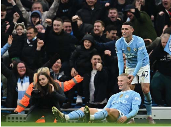
● سالمانا فودن

برمته كان يتعلق بتحقيق الفوز (فريق) وعن هالاند الذي أهدر فرصة سانحة على فم الرمي قبل أن يوض هدف الأملثان في الدقائق الأخيرة (3 - 1). قال غوارديولا الطامح لتحقيق ثلاثية رائعة للويس الثاني تروبا في دوري الأبطال، الدوري المحلي والكأس - اللابون العظماء، وكنت محظوظاً لتدريب الكثيرين منهم، ينسون (إهدار الفرض) في لحظة. وأضاف "لأصوب كرة القدم، كرة السلة بهيون. بيتسون ويستمرون وهو (هالاند) قام بذلك لديه قدرة رائعة على التسيان هذا ما يحدد اللاعبين الكبار. وكان هالاند، متصدراً ترتيب هدافي الدوري (18 هدفاً) رغم غيابه لفترة طويلة هذا الموسم بسبب الإصابة. قد أهدر العديد من الفرض خلال مواجهة تشلسي، قبل تسجيل خمسة أهداف خلال الفوز على لوتون تاون في مسابقة الكأس الأسبوع.