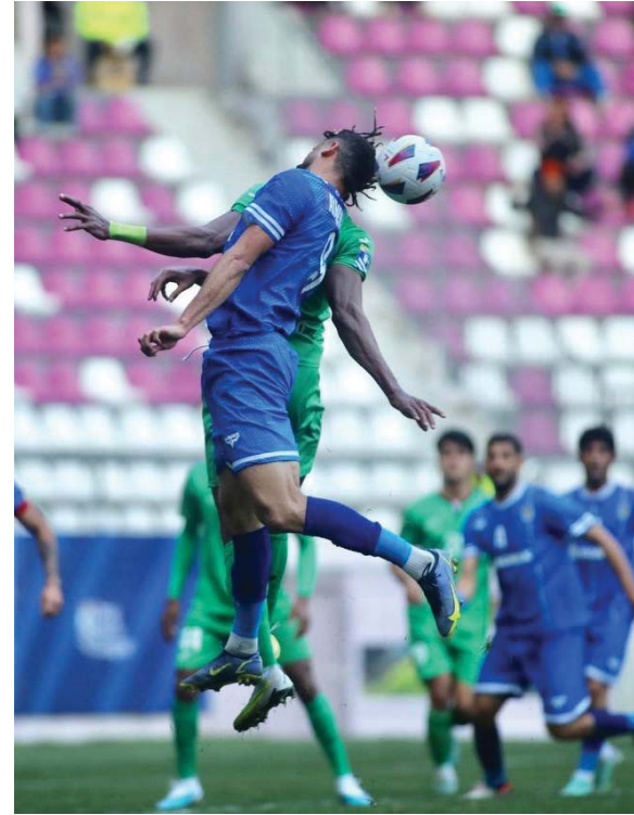
● الصقور يقسو على التنطط برباعية

إنها مضطربة كبيرة، بل صراع مع الذات ومع الآخرين، والتعدي كبير بل عظيم ويقوم ما هو متوفر من قدرات، لكن في الوقت نفسه لا يعني التجزؤ إلى الخنوع ورفع الراية البيضاء والاستسلام لحال صعب وعصيب، بقدر ما تتطلب الأمور تعديداً واضحاً وحاسماً لخارطة طريق تضمن تحقيق الأهداف القريبة المدى، وفق ما هو متوفر من إمكانيات، ومثل هذه الأهداف لا تتحقق باجتماع مستندة إلى لغة الحساس والعزم المتسرع في التغيير من دون امتلاك المقومات الكفيلة بالتغيير ووضع البدائل الأفضل .. بل الأمر يحتاج إلى وضع أولويات بعد تحديد العائل ونقاط الخلل، وهي أولويات تبدأ بالأهم فالهم وفق نظام الخطوة بخطوة. طريق الإصلاح لا يعيد بالتمنيات أو بجلسات السمر والتعاطي مع الأمور منطلق العاطفة، قدر ارتكازها على قواعد صحيحة ترضي نتائج العمل بها قد بدأت بالتحقق، وتمشى أن يكون الأتي أفضل، وسيكون كذلك إن شاء الله في ضوء ما نراه من خطوات وثيقة في العمل الأولمبي الجديد ..