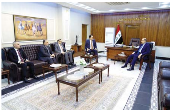
● المتداولي والمعمري يبحثان آليات تعزيز التعاون بين السلطتين التشريعية والقضائية