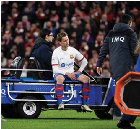
● برشلونة يتتبع أمدته الرئيسي

وحتى صيف 2021، لم يكن بيدي (21 عاماً) قد تعرض لإصابة خطيرة منذ موسم 2020 - 2021، أصيب تسع مرات وخاض خلال هذه الفترة 72 مباراة وعاب عن 71 بسبب الإصابة. ويشكل احتمال غياب تشافي الوسط من مباراة الأياب في 12 آذار الحالي (1 - 1 ذهاباً)، ضرب موجة برشلونة الذي يحاول إنقاذ موسمه. يتتبع فارق ثمانية نقاط عن غريمه ريال مدريد في صدارة الدوري الذي يحمل لقبه ويحتل راناً المركز الثالث في ترتيبه بفارق نقطة عن جاره جيرونا.