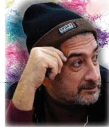
● أركان الزيدي

بعد الفنان أركان الزيدي، الذي موليد بغداد 1969، وابن الفنان المسرحي الراحل كاظم الزيدي، من أوائل المؤسسين لمسرح الفن الحديث في العراق مع الفنان يوسف العائني وآخرين، إذ كان تأثير والده كبيراً في توجيهه الفكري والفني فيما بعد، حيث بدأ يصطحبه معه في عرض المسرحيات، والمشاركة التشكيلية، ويطلمه على الآثار، وزيارة المتاحف الفنية، ومنها دار قضاة الأبطال ليتعرف على عمارة الدار وتأثيره المباشر برسوماتهم التي كانت تشر في