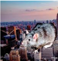
● استخدام وسائل منع الحمل وحظر مصائد الفئران كبدائل للسم أو الموت البيئي، والنوحي

علماً أن وسائل منع الحمل التي تسمى Contrap، عبارة عن حبيبات دوائية مملحة متشعبة في المناطق الموبوءة بالفئران كالمطاعم ووكزت صحيفة نيويورك تايمز أن العلماء يعملون على طريق استهداف وطيفة المبيض لدى الفئران الجسد وأن تعطيل إنتاج