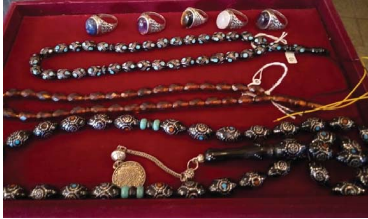
● تسبيح تعيش عند محبيها سلمها وجمالها في عالم صاحب

الست رفيقة خبيرة في صناعة وتقييم الست تقول: يبدو أن القدم هو الذي يحدد جودة وسعر السمكة، لكن الاتفاق العام أن اليسر وخشب الكوك التركي والعقيق المشجر الذي يسمى الثمانا والزمرد البورمي والكهرب الألباني تعد الأكثر مبيعاً، ويتنافس مع المعادن الثمينة كالفضة والذهب، كما أن لون السمكة يتغير كلما تقادمت بسبب تأكسد السطح الخارجي، وهناك من يغيرون أن أعلى السبوح تصنع من كبد الحيوت المحفوظ وهو نادر، ويقي السبوح العقيق الذي يستخرج من العجيان، عالم صاحب.