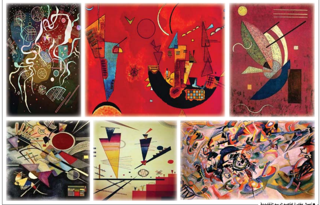
● أعمال مفامرة لمفاهيم الرسم التقليدية

في مقالها الموسوم "الإدراك والاستجابة للأشكال البصرية" تشير لورا أثن تشايمان وهي مختصة في تعليم الفنون التشكيلية بأن القدرة على الاستجابة للأعمال الفنية والبيئة البصرية ليست بسيطة، وتعد عملية الاستجابة للأشكال معقدة وتحتاج لعناية فائقة وقد ينطبق مثل هذا الوصف على منجز الفنان العالمي فاسيلي كاندينسكي، ذلك الفنان الذي أهدر بمنجزه الجمالي الغالب ممن وقف متأملاً أمام لوحاته التجريدية. فقد بقيت أعماله ذات طابع تجريدي تتساقط فيه قطع الأشكال إلى مصدر لإنتاج ما يسميه بالموسيقى وتتاسم قطعها وأوصالها، فعملية بناء لوحاته تعتمد على عملية تمثيل الأشكال ضمن ارتباطا بينه أوتان في مقاربة الخطوط والحركة وتوقعها في بنية