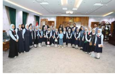
● أمال في حقوق الطفولة

وقال محافظ ميسان جيب طاهر الفروسي، لـ الصباح: تعد هذه المسابقة خطوة مهمة في تعزيز التعاون وترسيخ قيم حقوق الإنسان وجعلها سلوكاً في مدارس ومؤسسات ومراقف الحياة العامة وأزقتها.