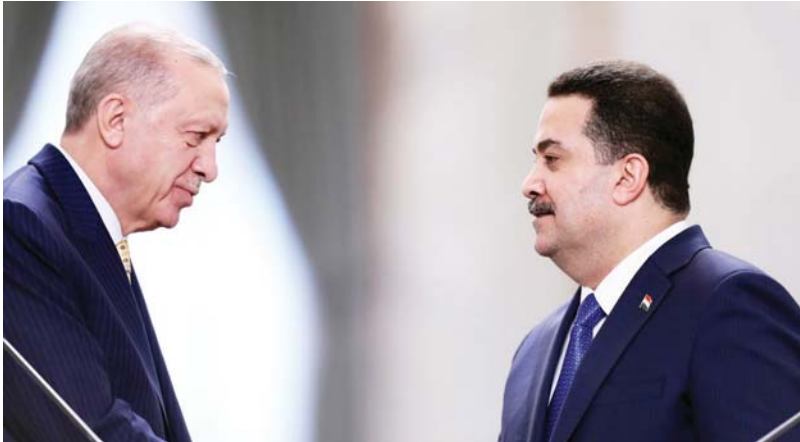
تعاون مشترك بشأن مشروع «طريق التنمية» الاستراتيجي

السوداني، سياستنا تعتمد على التوازن، ولدينا مبادئ تقوم على أساس المصالح المشتركة وحسن الجوار، وتنتقل من الدستور العراقي وتنتمسك بعدم السماح لأي قوة بأن تستخدم أرض العراق منطقاً للدخول في علاقاته مع الجوار