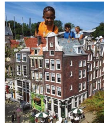
● عاصفة المصحفات

مصحفات عمرانية مصممة على هيئة أبنية وعالم وترانيات مهرة تشكل مجموعها هوية البلاد وأرضها القومي، يرتادها الزائرون والسائح الخمسينيات، تكشف الأسرار من كل مكان، مدققين في تفاصيلها الجسمة، التي تشعّر التأمل بأنه عملاق ضمن فيلم كارثون، وذلك في حديقة مادورودام الواقعة في وطواحين الهواء وقصر السلام. مدينة لاهي الهولندية التي يزورها الملايين سنوياً، حيث نحت نماذج مصغرة، طبق الأصل من معالم هولندية شهيرة ومدن تاريخية وإنشاءات كبيرة. وقال الشاعر التشكيلي العراقي