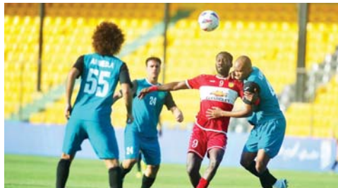
● التقط يواصل عروضه الجيدة ويفوز على الحدود

من فريقه المقود تحت قيادة مديرة الجديد عصام حمد، الذي تسلم المهمة خلفاً للمدير الفني المصري حسام البدر، وأمامه العديد من التحديات بالفترة المقبلة، وفي المقدمة تأتي موسم الفجر المقبلة، التقديرية القوة الجوية ضمن نصف نهائي مسابقة كأس.