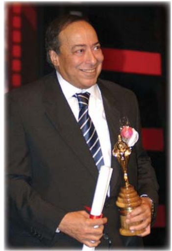
• كان مشوار السعدني طويلاً

وتيلار، وكان دوره في فيلم المراكبي، 1995 شخصية أحمد السيد عيش بعد الأجل في رحلته السينمائية، كما أن صوته الخشن وجد فيه مخزج فكرة العمل حول زواج القاصرات التي تحصل بكثرة في الصعيد فرشو لبطولة مسلسلات إذعية مثل عشاق لا يعرفون ميزوا ومؤثراً على الزمن القديم، المترجم، فارس عصره وأوانه، وقبض الريح. من الأعمال التي تركت بصمة في حياته مشوار السعدني كان مسلسل أرييسك الابداع تاماً في العمل رغم العروض المغرية التي تعرض عليه في كل عام، مكتباً بالمشي برقعة أسرته وأخاه، وقد نشر نلحه صورة تجعده بوالده في عام 2018 عبر حسابه الرسمي مغلقاً أياً من كتر ما تصور في حياته، وحاشي أناس كثير غايزين يطعنوا عليه. وسبب جاهزية العمل، قرر صنع مسلسل بالعائلة بسعدني وكازيملا وكومبيوتر، رحل وترك مكانه شاعراً في الوسط الفني الذي لن يستطيع أحد بما حجم الخسارة التي خلفها رحيله.