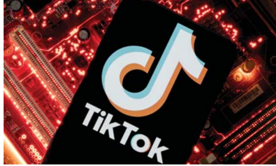
• تسعى تيك توك بشكل أساسي إلى جذب مستخدمين جدد ومحاربة الركود في نمو المستخدمين في أوروبا