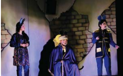
● أفرزت عروض المهرجان العديد من المواهب والمخاطبات المسرحية الطلابية