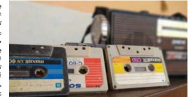
• موسيقى أهمية واسعة في كل جوانب ثقافتنا

وتيلار، وكان دوره في فيلم المراكبي، 1995 شخصية أحمد السيد عيش بعد الأجل في رحلته السينمائية، كما أن صوته الخشن وجد فيه مخزج فكرة العمل حول زواج القاصرات التي تحصل بكثرة في الصعيد فرشو لبطولة مسلسلات إذعية مثل عشاق لا يعرفون ميزوا ومؤثراً على الزمن القديم، المترجم، فارس عصره وأوانه، وقبض الريح. من الأعمال التي تركت بصمة في حياته مشوار السعدني كان مسلسل أرييسك الابداع تاماً في العمل رغم العروض المغرية التي تعرض عليه في كل عام، مكتباً بالمشي برقعة أسرته وأخاه، وقد نشر نلحه صورة تجعده بوالده في عام 2018 عبر حسابه الرسمي مغلقاً أياً من كتر ما تصور في حياته، وحاشي أناس كثير غايزين يطعنوا عليه. وسبب جاهزية العمل، قرر صنع مسلسل بالعائلة بسعدني وكازيملا وكومبيوتر، رحل وترك مكانه شاعراً في الوسط الفني الذي لن يستطيع أحد بما حجم الخسارة التي خلفها رحيله.