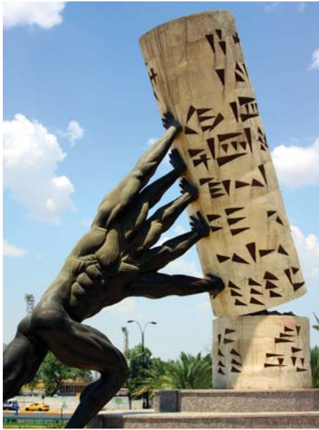
نصب إنقاذ الثقافة العراقية للفنان محمد غني