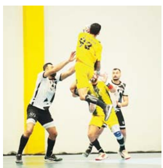
● منافسة مثيرة في نخبة اليد

الوفاء الجديد الطليعة، وتحتضنها قاعة النشاط الرياضي بالرمادة، ويطلق الكفاري إلى مواصلة سلسلة النتائج الإيجابية بغية تحقيق فوز يعزز مكانته في قمة الجدول الفرعي، بينما يدرك الأنيق صعوبة المهمة أمام فريق يمتلك جميع المقومات الفنية واليدوية التي تؤهله لحسم