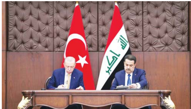
العراق وتركيا نحو شراكة اقتصادية شاملة

وغيرها. ورأس رئيس الوزراء محمد شياع السوداني والرئيس التركي رجب طيب أردوغان وهدى البلدين في المحادثات الموسعة التي عقدت في القصر الحكومي ببغداد، أمس الاثنين. ويعد جلسة المحادثات اتفاق الإطار الاستراتيجي الذي يسمي خارطة طريق لبناء تعاون ستراتيغي مستدام، والتأكيد على أهمية طريق التنمية في الجانب الاقتصادي وتعزيز التكامل الاقتصادي. وشهدت المحادثات التباحث في تطوير العلاقات التجارية والاقتصادية وزيادة التجارة وتشجيع الاستثمار، على المستوى الرسمي عبر اللجنة الاقتصادية المشتركة بين البلدين، والسعي لتفعيل مجلس الأعمال العراقي التركي، وجعله منصة يتبادل الطرفان من خلالها خبراتهما العملية، والمشاركة في تعزيز التعاون وتنمية المشاريع في البلدين. كما جرى، خلال المحادثات، التأكيد على تعزيز الأمن المشترك بين البلدين، وعدم السماح بأن تكون أراضي البلدين منطلقاً لاعتداء بينهما. كما تم التأكيد على وجود حاجة حقيقية لتأسيس مؤسسات صناعية عراقية- تركية مشتركة داخل العراق، برأس مال مشترك، والعمل على تسهيل إجراءات منح سمات الدول للمواطنين العراقيين لغرض السياحة والتجارة والاستثمار والعلاج والدراسة. تفاصيل 3