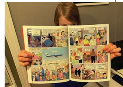
● اكتسب مصطلح "الرواية المصورة" رواجاً في السنوات الأخيرة

وقد اكتسب مصطلح "الرواية المصورة" رواجاً في السنوات الأخيرة، ويرجع ذلك جزئياً إلى تشجيع النظرة الأكثر جدية للشكل الرسومي، ولكن غالباً ما يكون متواضعا، مع إدراك أن العديد من القصص المصورة تتناول في الواقع موضوعات جادة، وربما تكون أكثر ولاءً للفنون الجميلة من الخيال عن طريق تهميش الحدود بين هذه الفئات. إن مسألة التسميات هذه - كونها موضوعاً شائخاً في المؤتمرات والمهرجانات - هي جزء من مناقشة دلالية أوسع تتناول في عبارات مثل "محو الأمية البصرية"، ومحو الأمية المتعددة، والفن المتسلسل، والسرد التصويري، وما إلى ذلك هذه الأفكار رائجة وتساعد بالتأكيد على تعزيز وعينا بما يحدث في زاوية الأدب