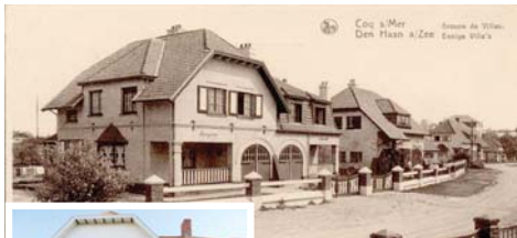
● أمير العقاب