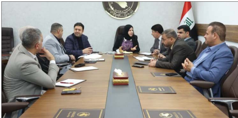
● النقل والاتصالات تناقش قانون الهيئة البحرية