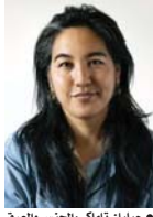
● جيليان تاماكي، الجنس والعرق