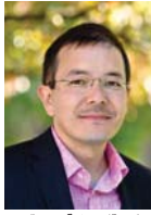
● شون تاو، رواية مصورة

التي تم تجاهلها سابقاً، حيث وصلت العديد من الكتب المصورة المبكرة إلى الرفوف وتمتع الآن بتبريز ونفاذ تقني جاد. (تسبب كتاب الوصول لشون تاو) (The Arrival) (أوه رواية مصورة أدبية رئيسية، مع احتجاجات حول كيف يمكن أن يسمى كتاب بدون كلمات أدبياً) وطبيعة الحال، هناك اهتمام كبير بكيفية تعريف هذه الكتب وتصنيفها، ربما من خلال الصفات الجمالية، ونطاق الجمهور، ومعايير النشر والتوزيع، وطول الصفحة، والشكل المادي، وما إلى ذلك، يوصفها الرواية المصورة كونها تمثل شكلاً فنياً أو حركة معاصرة. وإذا ما تحدثنا عملاً مثل "Art Spiegelman لموسى Maus" أو "Jimmy Corrigan est Kid on Earth" لكرويس كريز و"Ware" لديفيد بي David B أو أي عدد من الروايات المصورة الشهيرة التي تشكل جزءاً من موجة حديثة، فإن القاموس المشترك بينها جميعاً هو انتقاء، مطلق من حيث الشكل والمضمون أي أن هذه القصص لا يمكن التعبير عنها بشكل صحيح إلا كسلسلة من الصور والكلمات الرسومية باليد، والمصممة لدعوة القارئ إلى تفسير معقد وسرد، وغالباً ما يكون خارج اللغة التقليدية. هناك شيء مؤلم في الطريقة التي نجحنا بها وجه الحيوان المرسوم بالبحر تعبير الشخصية في موس، أو الطريقة التي بناها بتقسيم العزلة التي تصاليم منظمة بعناية على الصفحة في جيمي كوريجان؛ أو الطريقة التي يستل بها وحش مجهول صبياً يعانى من مرض