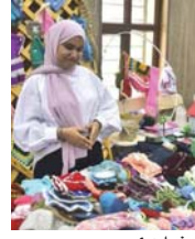
● جخل بريء

تظمت طالبات معهد الفنون الجميلة للبنات وثانوية التمرات في كركوك معرضين لولوات التشكيلية والأعمال اليدوية. وقال مسؤول الإعلام والعلاقات في تربية كركوك أحمد سادي لـ الصباح تجلت إبداعات طالبات كركوك، في هذين المعرضين اللذين أكدا قدرتهن على السير نحو المستقبل بخطى وثيقة، مضيئاً، خصص ريعهما لمساعدة المتفنين والمرضى، وعد سامي المعرضين، عامل تشجيع لتلمية مواهبهن وتقديم مستوى دراسي أفضل.