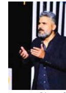
● واسط تسهر

يقدم فرع واسط نقابة الفنانين، الدورة الثالثة من مهرجان ليالي الفن الأوسط دورة الفنان المسرحي الراحل بايا عماد للمدة 25 - 27 نيسان الحالي. وقال الفنان على ناظم الموسوي، المهرجان يقدم أفضل نتاجات فناني واسط، في التشكيل والفوتوغراف والموسيقى والغناء والمسرح والسينما.