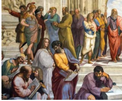
• الفلسفة منذ الأفرق نقد متواصل

لذا ما يميز الفلسفة تفكير هو أنها ليست تاريخياً، بل حركة تقدمية تؤمن بالتقدم وتقبل بالتعددية والاختلاف، وتخضع كل شيء للعقل لكن هل يمكن أن تتخلص الفلسفة أو الفكر التقدمي من حركة التاريخ؟ يرى عالم النفس كارل بوبنغ عبر نظريته النقدية