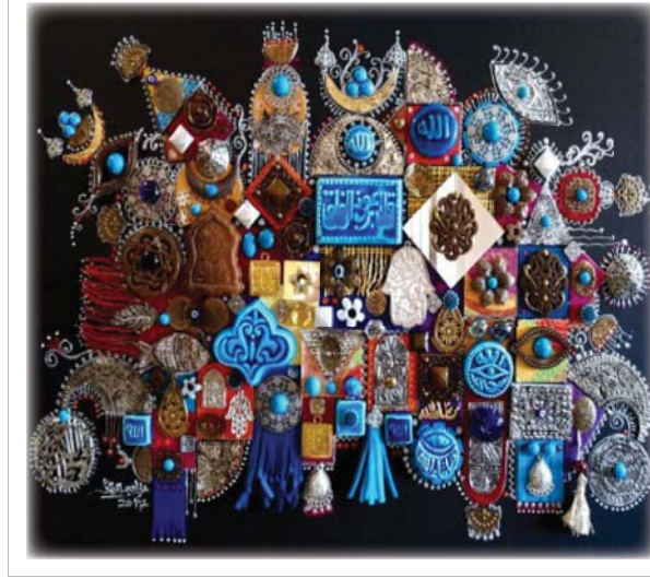
• دمج الألوان والخامات المختلفة لتخلق صورة قريبة من القلب والعين