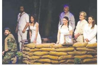
• أوضاع صعبة تواجه المسرح السوري