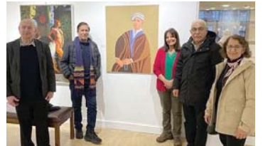
• مشاركون يتنمون لتيارات ومدارس مختلفة

تفتقد لوحة اشتراقات للفنان علاء جمعة بعض الجراءة وإن موه المواضع الجميمة الحساسة في أجساد النساء اللواتك والبحروفية والضربات السريامكية العاطفة، ولكن اللوحة في مجملها تميز عن اللتناس والتبويد الاجتماعية المرغوبة على المرأة، فالفنان بطبعه يسعى إلى التحزب والامتثال من ربة التقويد الاجتماعية والدينية والحرفية ليتيح لمطلعه أن يتفحصا بصور رحية، وذات مفتوحة عن آخرها، كما عرضت لجمعة لوحة ثانية بعنوان أوغليا وهي لجمعة هاملت دانية بولونويس، وهي من اللواتك الثقافية التي تنطوي على أبعاد سريامكية صادمة أظهر فيها ملامح من الشرع الأوسط هذه المرة، وهو يعتر الماضى ويولكه ناسياً أو متناسياً والرفقة الزمان الذي ينطوي على قدر كبير من المأساة نتجач الأعمال الفنية للفنان ناظم الجبوري الذي قرأه رمزية في بعض الأحيان، كما في منحوتة انتظار الغائب حيث نرى المرأة واقفة أمام