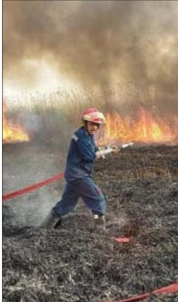
● الحرائق تطل حاصيل القمح

توصيات وتقوم مديرية الدفاع المدني بإجراءات عديدة في بداية كل صيف من السنة تبدأ من توعية وملاحقة المخالفين لقانون الدفاع المدني رقم 44 لسنة 2013، وضرورة الالتزام بوضع إرشادات الدفاع المدني لضمان انخفاض مستوى الحرائق، وتوفير متطلبات الدفاع المدني، وأسبغها منفضة الحريق، خصوصاً أن ارتفاع درجات الحرارة تعد عاملاً مساعداً للحرائق لاسيما عندما تكون درجات الحرارة عالية تصل إلى عتبة الخمسين درجة مئوية كما هو الحال في العراق، إذ كلما ارتفعت درجات الحرارة زادت الحرائق، ويشار إلى أن العراق سجل حرائق متكررة في المباني الحكومية والمنشآت الخاصة خلال فصل الصيف السابق، حيث ارتفع عددها إلى أكثر من 19 ألف حادثة حريق في عام 2023، مما أثار التساؤل حول إجراءات الوقاية التي تهتمت وزارة الداخلية اتخذها قبل نحو ثلاثة أعوام بعد سلسلة حرائق طالت أسواقاً ومستشفيات ودوائر مختلفة، وتسببت في سقوط عشرات القتلى والجرحى.