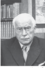
• كارل بوبنغ

يعرف أن الفكر هو المعرفة التي يكونها الإنسان عن موضوع معين أو من دونه، إذ إن وجود الموضوع بوجود الفكرة. هذا هو التفكير الاعتيادي للإنسانية، أما وجود الفكرة من دون الموضوع فهو التفكير الإبداعي، والإبداع نوعان، الهى من عدم، وإنساني من شيء.