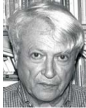
● نوسيان غولدمان البيئوية التكوينية