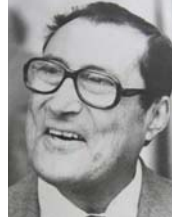
● غائب طعمة فرمان، خمسة أصوات