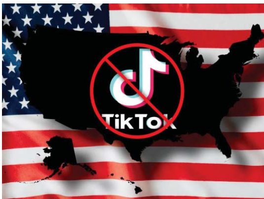
• مواجهة تيك توك يدعى "حماية الأميركيين من التطبيقات الأجنبية الضعيفة للأخلاقية"

تطرق إلى هذا السبب، وهي نعل أسباب حظر التطبيق، دولة الصومال، إذ أشارت إلى وجود مشورتات ومقاطع