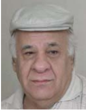
● عباد الخالقي الركايب، اطراس الكلام