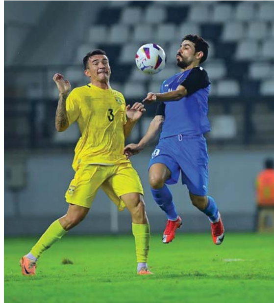
● امتحان جديد للطلبة