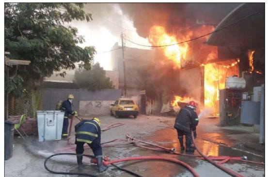
● العراق يسجل 4 آلاف حريق في الشتاء

خطن لكن بي الغرض الخبير في الشأن الاقتصادي مصطفى