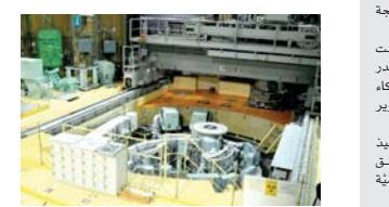
• إعادة تشغيل المفاعل Joyo في منتصف السنة المالية 2026

وقعت وكالة الطاقة الذرية اليابانية JAEA والمركز الوطني للسرطان في اليابان اتفاقية تعاون في 29 شباط الماضي، للبحث والتطوير في علاج السرطان باستخدام (الأكتيونيوم 225). تجري الوكالة حالياً تجارب علاجية لعلاج الإصعاع في العديد من البلدان، لكن الإمداد العالمي المحدود من (الأكتيونيوم 225) يعني أنه لا يمكن علاج سوى 3000 مريض أو نحو ذلك في كل عام. ويعدّ (جويو) وهو مفاعل تجريبي مدمج لتطوير مفاعل سريع يعمل باليوتونيوم، ودخلت العملية حيز التنفيذ في العام 1977 من خلال حزن وراه يحتوي على (الأكتيونيوم 225) في جسم المريض لتعديده الخلايا السرطانية. وذكرها في تصريحات صحفية نشرتها جريدة (أسامي شيمبون) الذرية اليابانية في إطار تطبيق المفاعل Joyo في منتصف السنة المالية 2026. وتضمن قداماً في الإجازات الرسمية للسرطان على مواقع مسيئة من اللسفات، في محافظة إيباراكي وبلدة إوارا في اليابان.