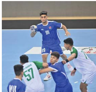
● العراق جامز لاستضافة البطولات المختلفة

موافقة اقامة الدورات لتأهيل المربين والحكام والمرافقين الفنيين في إطار هذا المشروع الذي ضم ورتامة مكثفة للبطولات وجميع المستويات وأجراء لقاءات واجتماعات مع الاتحادات العربية. يذكر ان الاتحاد العربي لكرة اليد والفرق في وقت سابق على طلب العراق لاستضافة احدى بطولاته بعد غياب دام فترة العربية.