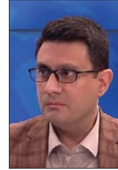
● استبرق صباح

وتبلغ إحصائيات الحرائق لعام 2023 حدود (21000) حادثة ضلعة عدا أجمع الخسائر والتلفيات، إلا أننا نلاحظ انخفاضاً كبيراً للحرائق مقارنة مع الأعوام الماضية. اللواء الحقوقي محسن كاظم علك مدير عام مديرية الدفاع المدني بدأ حديثه لـ(الصباح) بأن المديرية تمتلك حزمة من الخطط لمنع وقوع الحرائق عبر قيام ضباط المراكز بإجراء الممارسات الوقوعية على جميع المنشآت، حيث بلغ عدد الكشوفات الميدانية للقطاع الحكومي (70.000) والخاص (116.500) مشروع لتثبيت متطلبات السلامة وحسب سنته وأهميته، وأقامت دورات موقعية لفرد الحماية الذاتية في المشاريع على أعمال الدفاع المدني، إضافة إلى توعية شرائح المجتمع بمعدنات وقائية من طلبة المدارس.