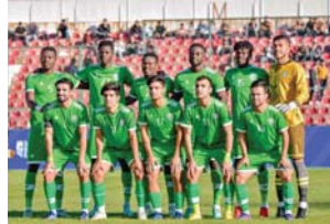
● فريق كربلاء

"مشرفاً إلى أن "كربلاء حاضرم معظم مبارياته خارج أرضه بعيداً عن جمهوره ما ولد ضغوطات إضافية على اللاعبين إذا ما علمنا أن هذه ميزة صبت في فصلته خلال الموسم الماضي". وأردف قائلاً: إن "ظاهرة تغيير المديرين أشرت بكرة كربلاء سلبياً وهي نتيجة ضعف الأداء الإداري في الأندية التي تقع تحت تأثير جماهيرها "مبيئاً أن "الدرب يقول الحلقة الأضعف في الدوري كونه ملتصقاً بالفوز على حساب الاستقرار الفني والبدني وبالتالي فإن الأندية بحاجة إلى عقلية إدارية محترفة والتي يفقد إليها الدوري المحلي".