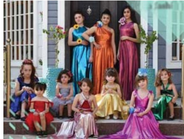
● من تصاميمها