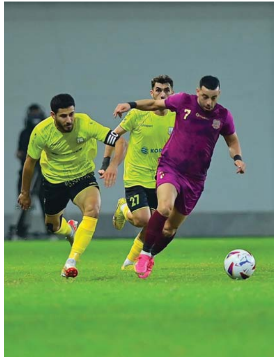
● اختبار صعب للقبلة

منتخبنا الأولوي حصر للفكر ولم يحسب للكرة التبادلية حسابات أخرى وتوقع الفوز بسهولة ليخسر اللقاء ولم يقدم فريقنا ما يتناسب تاريخه وسعيه لتأهل سادس للأولمبياد وحينما استعاد وحيته في ثاني اللقاءات أمام نظيره الطايجيكي وجد احتمالات عديدة قد لا تسرّه وهو يستعد لأخر مباريات مجموعته الثالثة مع منتخب السعودية صاحب النقاط الكاملة من مباراتين سجل خلالها 9 أهداف وتصدر المجموعة وعلى فريقنا التظلم عليه وعين أخرى على لقاء تايلاند وطاجكستان وحسابات غير معلنة عن طريقة التأهل للدور الثاني هل يفارق الأهداف أو الوجهات أو كل ذلك جاء بسبب خسارة غير متوقعة كسفت مباراته مع الفريق السعودي تواضع مستواه فماذا استكون النتيجة في لقاء غد الاثنين في البطولة الآسيوية للمنتخبات الأولوية دون 23 عاماً