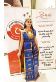
● رؤى البناء