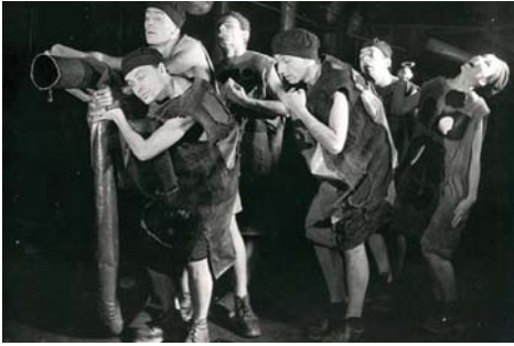
● من عروض غروتوفسكي