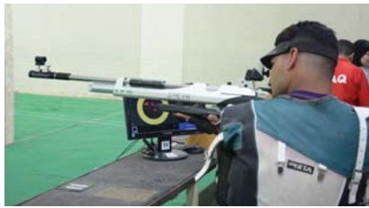
● مشاركة مرتقبة لرماة البارالمبية

في حصد النتائج الإيجابية. وأضاف أن "هذه المحطة تعد الأخيرة ضمن منهج الاتحاد الدولي بغية الإعلان عن القائمة النهائية للمشاركة في باريس 2024"، مشيراً إلى أن "المشكلة الأساسية حالياً، هي الحصول على الموافقات الرسمية حيث أقيمت المشاركة الأخيرة في بطولة العالم الأخيرة التي استضافها الهند شهر آذار الماضي بسبب تأخر الحصول على الموافقات الأمنية الخاصة بالأمناء. ونفت إلى أن "هنالك لقاء مرتقبا مع التخصصيين في وزارة الداخلية خلال الأيام المقبلة من أجل الحصول على كتاب تشغيل مهمة في الدوائر التابعة لها لحل هذه المعضلة الإدارية التي واجهت معظم المشاركين العراقية السابقة". وأشار إلى أنه "تقرر إقامة بطولة العراق لجمع الفئات الناشئين والشباب والمتقدمين ولذكور والإناث في السادس من أيار المقبل وتستمر لأربعة أيام وستشهد مشاركة واسعة من الأندية والمسابقات والأحداث الفرعية، مبنياً على اختيارنا للنتائج الوطنية لعام 2023".