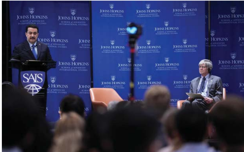
● رئيس الوزراء استمرار القتال الممنهج للمدنيين سيؤدي للتعنت والتطرف