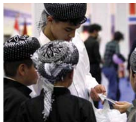
• جانب من الحضور في فعاليات معرض الكتاب في أربيل