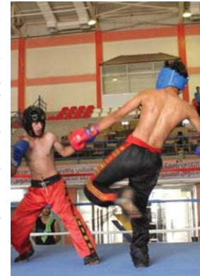
● مناهج حافل لاتحاد الكيك بوكسينغ

محافظة دهوك، بمشاركة 6 عناصر بأوزان مختلفة، وتعد مؤهلة لتمثيل المنتخب الوطني الذي تنتظره استحقاقات خارجية مهمة، مضيفاً أنه تم تحديد موعد بطولتي الشباب والمتقدمين وذلك في التاسع والعشرين من أيار المقبل، ومن المقرر أن تستضيفهما محافظة النجف الأشرف. وأشار إلى أن الهدف الأساس من إقامة المسابقات المحلية هو لاكتشاف مسابقات وأعداء واختيار أفضل الأسماء للدفاع عن سمعة اللعبة في المحافل الدولية، لا سيما أن مناهج العام الحالي يتضمن المشاركة في بطولات العالم المفتوحة التي من المزمع إقامتها في تركيا منتصف حزيران المقبل، كما تنتظر أبطاننا محطة عالمية أخرى يقمى الناشئين والشباب في هتغاريا مطلع آب. وعن استعداد خبراء التدريب ذكر الوسطي أنه التقى مع الاتحاد الدولي للعبة على تواجد المحاضرين الرومجي واثني وكين ورئيس اللجنة الفنية روميوي في العراق بغية الإشراف على دورة تطويرية لدرسي المنتخبات الوطنية، وستقام للمدة من 24 لثلاثة الجوانب الفنية والإدارية، 30 حزيران، وتهدف إلى الإرتقاء بمستوى الملاكات التدريبية.