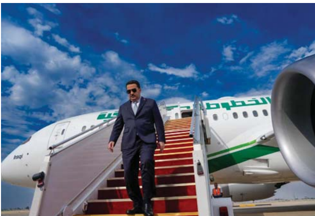
● رئيس الوزراء يعود إلى بغداد بعد زيارة ناجحة إلى واشنطن

ندوة حوارية في جامعة "جون هوكينز" الأميركية بواشنطن، والتي مجموعة من الجالية العراقية في العاصمة الأميركية واشنطن وكذلك الجالية العراقية في مدينة هيوستن، كما التقى حشداً كبيراً من الجالية العراقية في المنتدى الإسلامي بولاية ميشيغان، وكذلك التقى السوادي مجموعة من الجالية العراقية في المركز الكلداني العراقي بولاية ميشيغان.