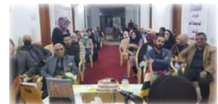
● من أضيف جلسات الاتحاد

يستعد اتحاد الأدباء لتوزيع جوائز مسابقة الأدباء الشباب في الشعر والنثافة والتأليف المسرحي، ضمن فعاليات عيد الأديب العراقي يوم الثلاثاء 7 أيار المقبل، في حفل لائق بمناسبة، تتخلله قراءات شعرية وقصصية ومزروعات وأغان.