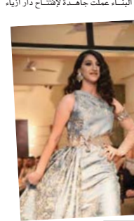
البناء عملت جاهدة لإنتاج دار أزياء