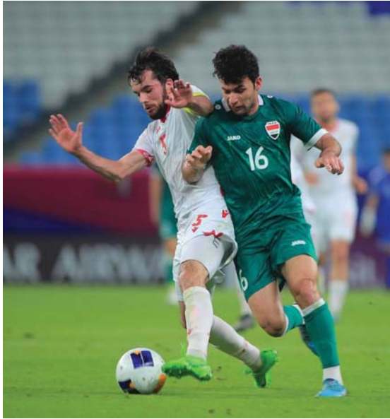
● الأولمبي يبقى على آمال التأهل