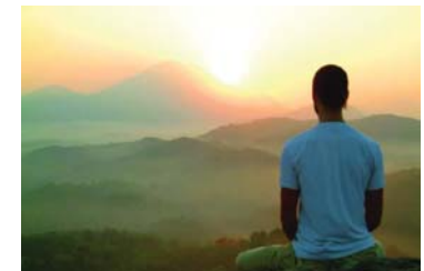
● الوحدة وسوء الذهن

لدى غسان مشكلة أخرى ارتبطت بهذه المشاعر، فضع كل تلك الحياتيات كان يجعل كل ما يترجمها إلى كلمة، بصمت طويل يحاول أن يجد ذلك التعلق، وهذا ما جعله يطلق وعد التغيير، حينها اختار الجهل، ثم اللامبالاة، بعد ذلك التجأ إلى الغضب وتقطيب الجبين، وما أن يتحدث إليه شخص ما يعود إلى جوف تلك المشاعر ليقبدها بأي شيء كي لا يفتضح امره، فما بهم غسان أن لا يراه أحد كما يرى نفسه، ومع كل تلك التصرفات البذيئة المشوهة، تحول إلى شخص آخر، لا يتقبله صديق، ولا تقربه زوجة، لا يظن يريد أن يرتقي ظهره كما في السابق ليلاصبه، يعتمد عن كل ما يقربه من مشاعره، وفارق مرافقة اليوم، وأقسم بأن لا يتحدث مع القمر، تجنب رؤية عينيه في المرأة، وهرب من الموسيقى كما يهرب من الغشاش بين ضنوه الشمس، جلس وحيداً في عالم لا صوت فيه ولا لون يلا حركة، وفي تلك اللحظة وعند عودته إلى بلدي ما دخله سمع غسان روجه وهي تهمس له: قل لنفسك فقط، أنا أحبك.