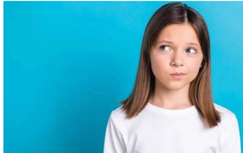
● التمر وتأثيره على الصحة النفسية

كشفت أحدث دراسة نشرت عن التمر في منتصف شهر فبراير (شباط) 2024 بمجلة Nature's Mental Health، للصحة النفسية، عن احتمال أن يكون فقدان التمر بالآخرين من أهم عواقب التمر على الإطلاق، وأن مجرد ذلك في وقت مبكر من عمر الطفل يصيب العامل الأهم في إصابته بالأمراض النفسية المختلفة لاحقاً في البلوغ، وأشارت الدراسة إلى الدور الكبير الذي تلعبه الثقة بالآخرين في تجاوز المشاكل، وأوضحت أنه كلما كان هناك أشخاص داعمون بجانب الطفل، فإنه يتغلب على المشاكل النفسية السلبية التي تؤثر نفسياً وجسدياً عليه، على نحو تعزز للتمر. الدرجات المنخفضة إلى توفر ثقة أعلى؛ والعكس، وبعد ذلك جرى جمعها في 3 فئات رئيسية: «عدم ثقة منخفض (أقل من 3 درجات)»، و«متوسط (4-8)»، و«كبير (أكثر من 9)». أظهرت النتائج وجود ارتباط مباشر بين التمر وعدم الثقة بين الأشخاص وكذلك الإصابة بمشكلات الصحة النفسية، وكان الأطفال الذين تعرضوا للتمر في سن 11 عاماً ثم فقدوا ثقتهم بالآخرين في سن 14 عاماً عرضة للإصابة بالقلق والاكتئاب بنسبة نحو 7 أضعاف عندما بلغوا عمر 17 عاماً، مقارنة بالآخرين الذين لم يعانون من مشكلة فقدان الثقة، وذلك بالإضافة إلى تغيرات في نمط النوم والذئد. يذكر أن الارتباط بين عدم الثقة والإصابة لاحقاً بالمشكلات النفسية كان أكبر من ارتباط