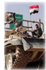
● سلاح عراقي

افتتح صباح أمس السبت معرض الإنتاج والصناعات الحربية، على أرض معرض بغداد الدولي، الذي يستمر لغاية بعد غد الثلاثاء برعاية القائد العام للقوات المسلحة، تحت شعار: بناء قدرات فاعلة متطورة. بناء أمن داخلي مستقر، يتحقق السلم والأمان.