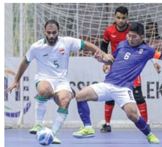
● مباراة متضلية لوطني الصالات

يلاقي منتخبنا الوطني لكرة الصالات اليوم الأحد، نظيره الأسترالي في تمام الساعة الخامسة عصرًا في المباراة التي تحتضن أحداثها قاعة هومارك في العاصمة أديلايد، لحساب الجولة الثالثة من منافسات المجموعة الثانية لنهايات كأس آسيا 2024، المقامة حالياً في تايلاند.