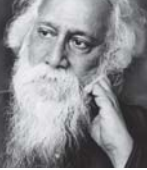
● سبيكتي العاشقون ومن سمرها هم

سبيكتي العاشقون ومن سمرها هم أكي ويكون وهذا هو الطبيعي وأخر دورة الإبداع وخلق الفكره الثيرة المسترة التي يبقى شعاعها على مدى الأزمان والدهور مثلما قالت يوما الشاعر الهندي رايندرنات طاغور (الذي يهمني ليس الذي يقرض الأذن، ولكن ما بعد مائة القديمة ويظلل الشعر محمد صالح حال البدين في عالم الشعر كله أن يكون مفرواً لا يموت عند أديم ما قاله لنا في ربايته أدهام ورقة، اليوناني فيولانس كز انتزاكيس.