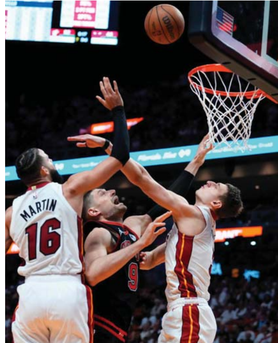
اكتمال عقد المتأهلين لبلاي أوف

اكتمل عقد الفرق المتأهلة إلى الأدوار الإقصائية (بلاي أوف) من الدوري الأمريكي للمحترفين في كرة السلة إثر تأهل ميامي هيت ونيو أورليانز بيليكانز. وتغلب ميامي هيت وصيف الموسم الماضي على شيكاغو بولز في ملحق المنطقة الشرقية بسهولة 112 - 91 ليضرب موعداً مع بوسطن سلتيكس متصدر هذه المنطقة في مواجهة هي الرابعة بين الفريقين في آخر خمسة مواسم. ولم يتأثر ميامي هيت بغياب نجمه جيمي باتلر الذي يعاني من التواء في ركبته تعرض له خلال مواجهة فيلادلفيا سفنتي سيكسرز ويواجه الغياب عن الملعب لاسابيع عدة وكان باتلر (34 عاماً) قاد ميامي إلى نهائي دوري «إن بي ايه» مرتين. وأسيّم ثلاثة لاعبين في فوزه ميامي بسجل لاعب الارتفاع تايلر