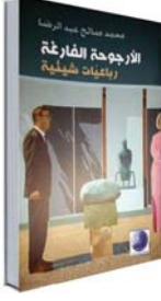
● وتبكرت طغور بعد مائة عام