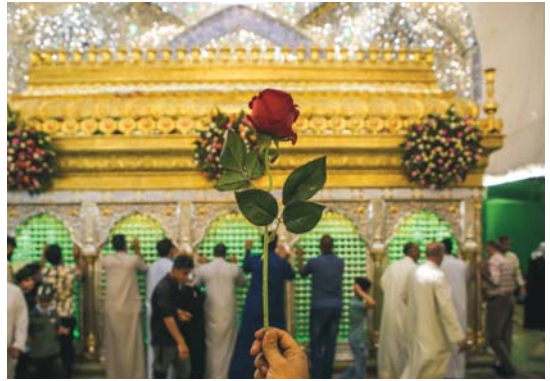
ولاية الامام علي (ع) لا يمكن أن تتعارض مع أي شيء اخر لان هذه الولاية هي امتداد للاسلام