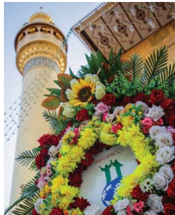
يوم الغدير تزامن مع حجة الوداع

زاهد متعبد أفنى حياته في خدمة الاسلام ونبويه ورسالته العظيمة، وما كان للشجاعة والفروسية أن تذكر إلا وكان أبو الحسن في مقدمتهما، ولم يشهد التاريخ الاسلامي زهدا ولا تواضعا الا ويرز اسم امير المؤمنين فيهما، لم يتوقف رسول الله (ص) طيلة حياته عن الفخر بدين عمه علي بن أبي طالب (ع)، ولهذا وأثناء عودة المسلمين من حجة الوداع إلى المدينة المنورة، وفي مكان يطلق عليه "اسم غدِير خم" وقف الرسول الكريم محمد (ص)، ليوصي المسلمين بدينهم وعقيدتهم، ومن ثم يثني على فضائل وصفات الامام علي (ع) الذي تربى في بيت النبوة، واستهل من العلم والمعرفة، فهو الذي رافق الرسول طوال فترة حياته، ولم يغادر ذلك البيت الكريم يوما وهو من قال بحقه النبي محمد "كنت مولاه فعلي مولاه".