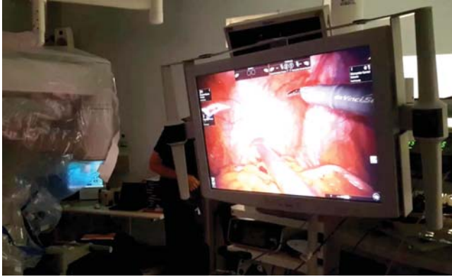
• الصبغة المضيئة تكشف السرطانية حتى تلك المتأخرة في السفر التي لا يمكن للمجرة التقاطها

أعلنت «إنفيديا» عن أرباحها في الربع الثاني من العام الماضي، وقالت شركة «بيكيتسكوير بيتر» في مذكرة في وقت سابق من هذا الأسبوع، نعمت أن المبيعات القيمة السوقية البالغة 4 تريليون دولار في مجال التكنولوجيا خلال العام القبل سيكون أساساً بين إنفيديا و«أبل» و«مايكروسوفت». وأضافت أن «إن رقائق جي بي يو إنفيديا هي وأس جورها الذهب والنفط الجديد في قطاع التكنولوجيا حيث توجه المزيد من الشركات والمستثمرين بسرعة إلى هذا الطريق مع الثورة الصناعية الرابعة الجارية. القيمة السوقية للشركة الآن تتعدى 3.3 تريليون دولار، مما يجعلها واحدة من الشركات الأكثر قيمة في العالم. وقالت إنفيديا في بيانها أنه على الرغم من أن الشركة لا تزال تعاني من تحديات في السوق، إلا أنها تتوقع نموًا قويًا في المستقبل. في وقت سابق من هذا الأسبوع، أعلنت إنفيديا عن نتائجها المالية للربع الثاني من العام الماضي، وقالت إن مبيعاتها بلغت 1.49 مليار دولار، بزيادة من 14.9٪ عن الربع السابق. كما أعلنت الشركة عن أرباحها بعد الضرائب بقيمة 1.49 مليار دولار، بزيادة من 14.9٪ عن الربع السابق. في وقت سابق من هذا الأسبوع، أعلنت إنفيديا عن نتائجها المالية للربع الثاني من العام الماضي، وقالت إن مبيعاتها بلغت 1.49 مليار دولار، بزيادة من 14.9٪ عن الربع السابق. كما أعلنت الشركة عن أرباحها بعد الضرائب بقيمة 1.49 مليار دولار، بزيادة من 14.9٪ عن الربع السابق.