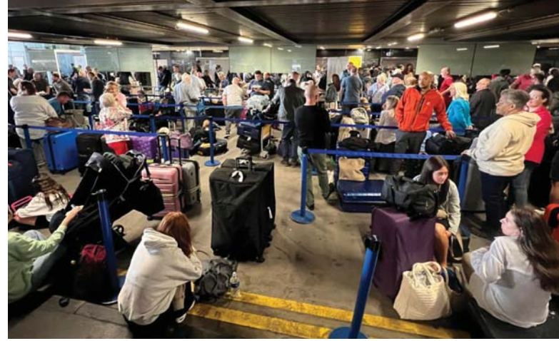
قال المتحدث باسم مطار مانشستر في بريطانيا إن الرحلات المغادرة شهدت إلغاءات وتأخيرات كبيرة، أمس الأحد، بعدما تسبب انقطاع الكهرباء في منطقة المطار بالضلعاب واسع النطاق. وأضاف أنه من المتوقع تأخير أو إلغاء عدد كبير من الرحلات المغادرة.

هذه المواجهة وفقاً لتلك التقارير، نفت وكالة «رويتزر»، نشر تقرير يفيد بأن إسرائيل ستهاجم لبنان خلال 48 ساعة، وذلك بعد تداول تقارير تنقل عن الوكالة ذلك، وأكد المتحدث باسم الوكالة أن أي مزاعم بأن (رويتزر) ذكرت أنّ إسرائيل ستهاجم لبنان خلال الساعات الثماني الأخيرة لساعات في إسرائيل، يستبعد التيار الكهربائي لأشهر في لبنان. إلى ذلك، أعلن الإعلام العربي في حزب الله، في بيان له أمس الأحد، استهداف مقر قيادة كتبة السهل في كنة في بلد مسور، انتحاضية، مستهدفة أماكن تواجد واستقرار ضباطها وجنودها وأصابت إصابة مباشرة وأوقعهم في قتال وجريح. بينما، قصفت القوات الإسرائيلية في وقت سابق بقدائف المدفعية والعتاد الفوسفوري حارة الزاوي في كركلا.