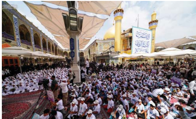
مسيرة احياء علي (عليه السلام) لآيتمام بذكرى عيد الغدير العراقي

افتتح رئيس الوزراء محمد شياع السوداني، أمس، المرحلة الثانية من مشروع تأهيل مدينة بغداد التاريخية المحور السراي - الششلة - باتجاه ساحة الميدان بد إمامه. واشتمل المشروع المنجز، بحسب بيان المكتب الإعلامي لرئيس الوزراء، على ترميم وصيانة واجهات المباني التراثية والتاريخية، وصيانة وتأهيل منظومات وشبكات البنى التحتية، واستحداث محور ثقافي واجتماعي وترفيهي للشي، وكذلك استحداث ساحة السراي، وتأثيث الشوارع والآثار، ومعالجة المباني التاريخية، وبإيفاء الأعمال المدنية.