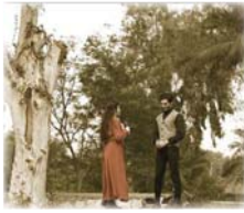
مشهد من الفيلم