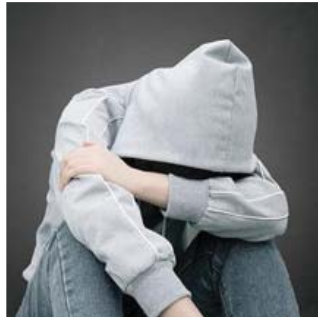
المخدرات.. أخطر من الإرهاب