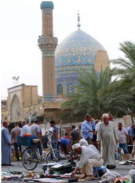
سوق هرج في ساحة الميدان وسط بغداد