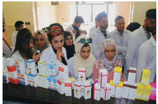
• تشغيل الأيدي العاملة