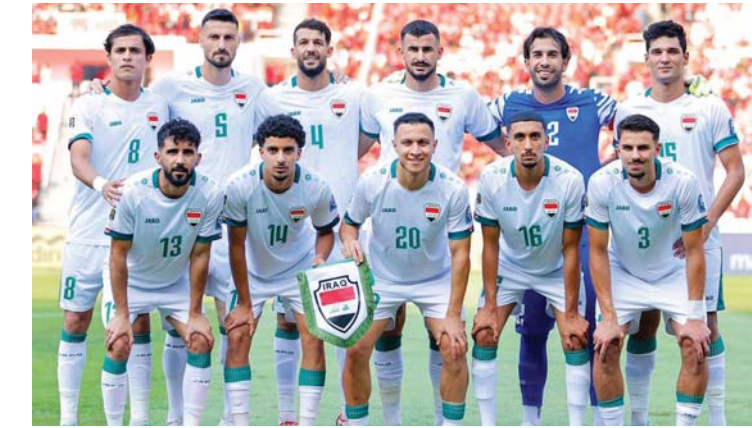
● الأسود بانتظار المنافسين

تأسس من خلال الكونغرس والتصريحات أي سياسة زرع بذور التغيير في منظومة كرة القدم ويتيح كل فرصة لتغيير هذه السياسة بما يُعزز دورها، وكما تفتش أن تكون إزاء سياسة تحمل التلجج من قبل الجميع تُبرهن على أنه مدرب وأني لاجب التواجد مع المنتخب الوطنية طالما أنه يمتلك كفاءة وقادر على تحقيق تعلقات الجميع بغض النظر عن مكان تواجد