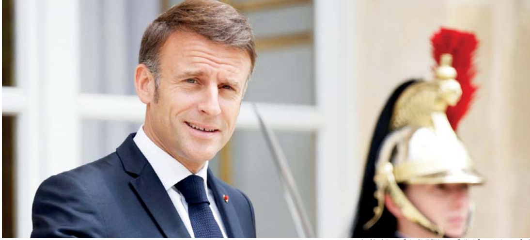
● ماكرون يحل الجمعية الوطنية ويدينو لانتخابات عامة جديدة في 30 حزيران