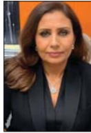
الانقراض والأذى والمضاعفات الصحية، وتناشد رؤساء الوزراء المهندس الزراعي محمد السوداني بتبني مشروع عراق للتشجير وزراعة الغابات من أشجار نخيل وتوتون وأثل وغيرها لحماية أرض العراق والتصحر ونهب درجات الحرارة وتؤثر في مستويات جودة الحياة للإنسان وبقية الكائنات، والله من وراء القصد.

تشهد لجان الزراعة وبأعلى المستويات إهمالاً كبيراً، وتوقف عن أي مبادرة في تقديم مشروعات وطنية لتسوير المدن بالغايات عبر حزام أخضر وأجبار الناس على زراعة الأرصعة أمام بيوتهم وتشجير شرفات الممارات السكنية من أجل بيئة صحية صالحة للحياة، ويتطلب هذا حملة كومية وشعبية مدعومة مادياً وأمنياً وقانونياً من خلال تشريعات قانونية تسمى الزراعة وتطورها وعناية متواصلة تحت بند قانونية تمنع منعا مطلقاً من الاعتداء على الأشجار وحرقها لأغراض المطاعم وإجبار المستثمرين الذين قاموا ببناء الكتل الإسمنتية في تشجير العمارات والشرفات وزراعة حولها بأشجار عملاقة وجلب آخر ما توصل إليه علم المياه في استغلالها وتفتين مدهرا الذي نراه أمام أعيننا بضائع كميات هائلة من المياه الواردة إليها. تتفك الأشجار في صد الأتربة وامتصاص السموم والمواد الإكسجين الضروري جداً في خفض درجة الحرارة، وكذلك تقوم المساحات الخضراء بجذب الأمطار وتثبيت التربة واستهلاك المياه الزائدة لمنع انجراف التربة ومشاكلها وبالتنتيجة حماية الإنسان والأرض والحيوان من