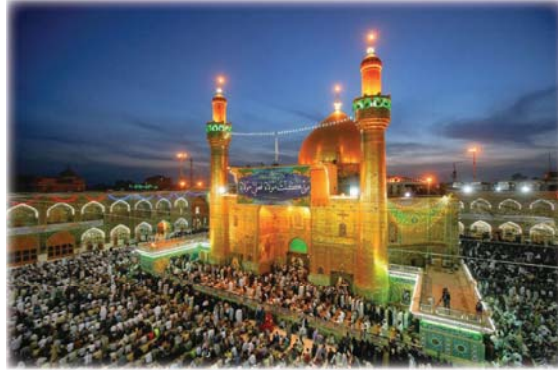
● مرقد الامام علي عليه السلام.

يا ابو الكفن فقير وكل يقيم / خاف لا يحتاج ويؤذنه اللئيم / ترك بكل باب تالي الليل صبر / هاكتر مولاي تحب / وشعبك بيك أنته ذاك شوكة ما دب / واحه كل واحد صبح هك المشك / يتقاس خصره / نزلت بعد عيد الغدير يتبارك اتاس الكواكب / والنشم ويا الحكمر والروح والنجمات يمشون بمواكب / واليهيك شوكة يحكمر من تصمر / هاك عاين للجحافل بالدروب / من شمال ومن غرب ومن الجنوب / من مساتين الوسط من كفاك بصره / كله / تهفت والي من والام يا رب / عادي من عاداه يا رب / وانصر اتاس التصمر.