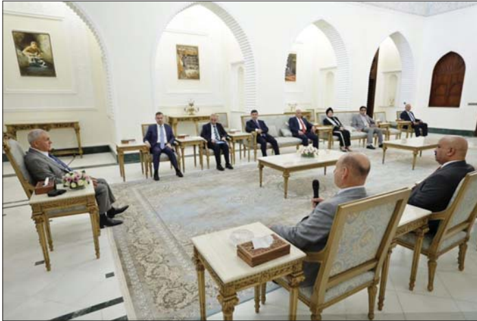
رئيس الجمهورية يبحث مع وفد من مجلس النواب العراقي بشأن الانتخابات التشريعية في كردستان