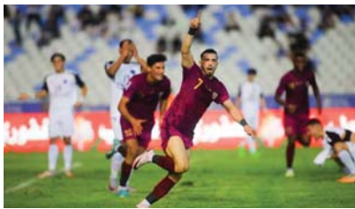
● امتحان جديد للثبارة

للتايرة كونه مطالباً بحصد النقاط الثلاث أو على الأقل الخروج بتعادل مهم على الصعيد العنوي في رحلة البقاء ضمن مصاف دوري المحترفين. ويتربع الأخضر على القمة برصيد 77 نقطة، بينما نطق البصرة في المركز الثامن عشر وله 28 نقطة. من جانبه يرفع راخوشعار التعويض حينما يواجه كربلاء، وتعرض أبناء الخابور لخسارة غير متوقعة أمام نطق ميسان، تسببت بتوقف برصيدهم عند 59 نقطة في المركز الخامس. بدوره يستند العميد إلى ارتفاع الروح المعنوية عقب تفوقه على الكرخ في الاختبار الأخير، من أجل العودة إلى الديار بنتيجة إيجابية عزز من موقفه أمام فريقه، ويعل نوروز ضيقاً على الكرخ، في حين سيحصد نطق ميسان الرحال في محافظة البصرة بغية ملافاة الهناء.