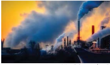
● تلوث الأجواء يسهم في تلوث الأوزون