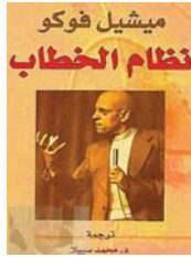
• مراقبة الخطابي

وتعبر الانتماؤ المذهبي، نفس الوقت، بالمنطوق وبالذات المتكلمة ويسائل أحدهما الآخر، فهو يسائل الذات المتكلمة من خلال المنطوق