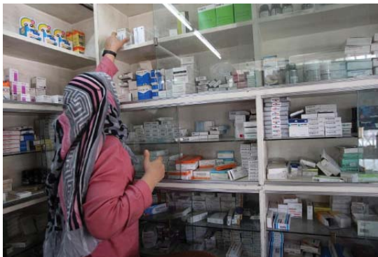
• إحياء صناعة أدوية ذات مواصفات عالمية

من الأطباء الناتج التي تحققها هذه الأدوية، وأزيدكم معلومة، أنه يتم فحص الدواء في مختبرات الصناعات والمسؤولية عن جودته وسلامته ومراقبته في الأسواق من خلال نظام الرقابة الدوائية، وفي مختبرات الرقابة الدوائية التابعة لوزارة الصحة تقوم بفحص الأدوية التي تنتجها المصانع بشكل مستمر، وفي شكل عشوائي أيضاً عن طريق سحب عينات من الأسواق، وفحصها حتى يتم التأكد من سلامة الدواء، كما أن لدينا (28) مصنعاً، تشرف عليها وزارة الصحة، وهي المسؤولة عن المصانع، وما الدعم الذي تطلبه المصانع من الدولة لكي يتم النهوض بالصناعة الدوائية وأبرز المعالجات سناجيبك بصراحة، نطلب من الدولة أن تعامل