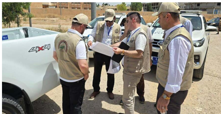
● اختيار إمكانية الموظفين بالعمل لأول مرة لتنفيذ التعداد الإلكتروني

وأشار الصافي إلى أن التعاون سيؤدّد العراق بمقتضى ذوي خبرات عالية وإدخالهم في دورات تدريبية متخصصة، مؤكداً أن الخطوط الجوية العراقية مستمرة في تلبية متطلبات المنظمة العالمية للطيران. وأضاف أن سلطة الطيران تجاوزت المرحلة الأولى من تشخيص النطاق ومن المقرر عقد اجتماع معهم للحصول على شهادة الشغل الثالث، موضحاً أن وزارة النقل والخطوط الجوية العراقية جازمة ومستعدة كون العراق يمتلك أسطولا حديثاً من الطائرات.