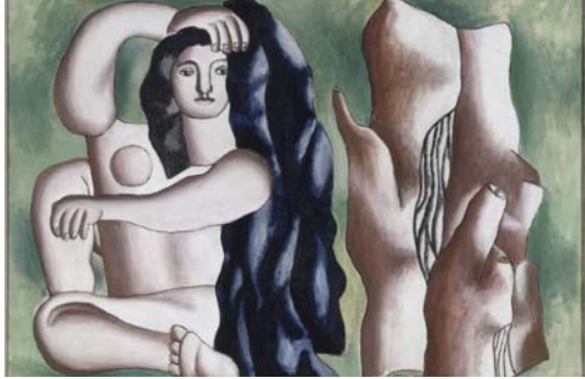
لوحة للمرسام الفرنسي فرنان ليجي

لو أن جاريتا العجوز ما زالت تبحث عن دجاجتها لظل الثعلب كائنأ مسلماً، لا أحد يصدق ما ينسب إليه لو أن المقهى لم تزل قائمة قرب جسر السراجي الخشب لأرجحت قدسي، متوهماً سمكة ستقصها.. كانت الطريق إلى بيتشا نخلًا ومنازل سعف وصعب واهم، من يعتقد بأن المدن حيز ودكاين كثيرة. أنا فطرة الماء التي تبخرت في ورقة التوت أمس