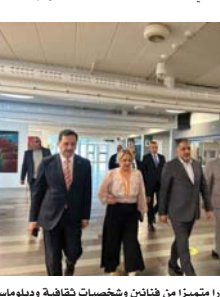
• أريعة أيام شهدت حضورًا متميزًا من فنائين وشخصيات ثقافية وديبلوماسية

أريعة أيام شهدت حضورًا متميزًا من فنائين وشخصيات ثقافية وديبلوماسية بهدف تعزيز التبادل الثقافي بين دول الشمال والعالم العربي.