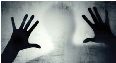
رهاب الموت يكون شديداً إلى الحد الذي يتسبب في نوبات هلع

وعليه، فننصحك عليك التواصل معنا عبر المسنجر لتلك على طبيب نفسي في بغداد، ولا تخف، فحالتك لا تستدعي الخوف.