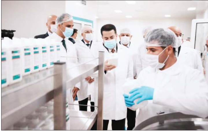
• أهمية الدعم الحكومي

لستوات طويلة نستورد الدواء من دول العالم، ومنها دول الجوار بعدما كان العراق متقدماً على العديد من الدول في مجال صناعة الدواء، البعض رد هذا التراجع للحصار والحروب وسوء التخطيط، ووجود منتقمين من استيراد الدواء، والبعض الآخر رده لتقاعس المسؤولين آنذاك، لكن الآن يوجد توجه جديد باحياء الصناعة الدوائية، لما تشهده من حراك تقوده أعلى سلطة في البلاد ووزارة الصحة وتقاية الصيدالة والشركات الدوائية في القطاع الخاص، فما الجديد في الصناعة الدوائية، وهل ستشهد حضور الأدوية العراقية في صيدليات دول الجوار على الأقل؟