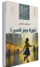
• أرسطو الصورة