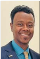
المحلي يساعد في إرسال صورة متغيرة عن الدولة، فضلاً عن التصريحات الإعلامية المتسجعة مع رؤية الدولة لتنمية مؤسساتها، لتصبح أكثر تفاعلاً مع المجتمع الدولي وبواسطة العلاقات الدولية المتوقعة والمتوازنة بهدف كسب ثقته بها.

الاعلام والاتصالات وتكنولوجيا المعلومات من النواحي التنظيمية وتحسين مخرجاتها وسفالة إنشائها وإدامة بيئة تنظيمية متطورة واستقطاب الاستثمار، وكذلك أهمية دعم وسائل الإعلام والصحف وتنظيمها والحد من الفوضى التي تميز بيئة صالحة للتنمية المستدامة. إن ذلك يتطلب توافر الوسائل والأساليب التي تسهم في صياغة الخطط وبرامج عملية وتجارب دولية بما يتناسب وطبيعة الحدث الثقافي الإقليمي، فضلاً عن أهميتها في نقل ثقافات الدول والمجتمعات عبر نماء أفكارها بكيفية التعامل معها بصورة مثبالة لزيادة النشاط التنويري وربطه بعملية التنمية الثقافية، بوصفها المصدر الأساس للثقافة عن طريق الأثار والتراث وطموح المراحل التاريخية لتطور البلد إعلامياً وثقافياً بأي شكل من أشكال التعبير الفني.