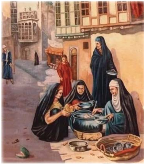
● المكلة البيغدادية منجم الأمثال

توجهت منه) فقال الخادم الباذنجان لعنة الله على ساخه منفر، وبارده منفر. فقال الأمير: ويحك ادعك الشيء وتده في وقت واحد 15 فقال الخادم: أنا أخدم للأمير يا مولاي لا خادم الباذنجان. إذا قال الأمير نعم قلت نعم، وإذا قال قلت لا. وهوسيد المأكولات، شعع بلا لحم، سمك بلا خبز، دجاج بلا أعوجاج، يؤك ملياً ومشوي، نبتاً وماذجا بارداً وساخاً، وجبة كاملة أو مدخناً للتمام. فقال الأمير: ولكن أكلت منه قبل أيام فثالثي كرتي (أ) تميل