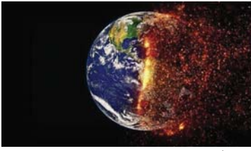
● كوكب الأرض يسير نحو عواقب وخيمة مناخية