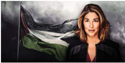
مؤلفة الكتاب الحائزة على جائزة المرأة للكتابة الواقعية

المرتبطة بالوقود الأخوري وإسرائيل. وقد تم النظر إلى الحملة في بعض الأسواط على أنها هدف خاص، مما وليس ذلك فقط بل أدى إلى انسحابها، من رعاية المهرجان لكن كلاين غير نادمة حسب قولها. بالنسبة لي، فكرة أن كل الأقسام ينسحب على هؤلاء النشطاء وليس على شركة Baillie Gifford، وهي الشركة التي تدعي أنها دعمت القنصل وقد تمعت بها السبيل الآن بكل هذه المهرجانات بدلا من مواجهة بعض المساءة عن نفسها، هذه فكرة مشينة، كما تقول، إنه يتبني إلغاء العمل على الصحفي في التحقيق في شركة ما إذا كانت تلك الشركة تسحب إعلاناتها.