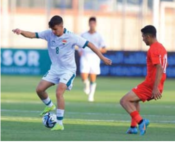
● نقطة في بداية المشوار

الفترة من 25 حزيران الحالي وحتى الخامس من تموز المقبل. ولم يظهر فريقنا بالمستوى المطلوب لا سيما في الشوط الثاني واكتفى بنقطة واحدة، وكانت الحسنة الوحيدة حصول لاعينا هلكور فيس على جائزة أفضل لاعب في المباراة حسب اختيار اللجنة