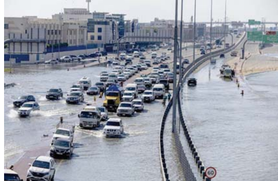
• فائرة طبيعية كثرت فيها نظريات المؤامرة

يقول مسؤولو الارصاد الجوية لدى دولة الإمارات العربية إن عمليات بذر السحب التي ينفذونها يمكن أن ترفع معدلات تساقط الأمطار بنسبة عشرة إلى 30 بالمئة، في حين تقدر سلطات ولاية كاليفورنيا أن برنامجها قد يرفعها إلى ما بين خمسة وعشرة بالمئة.