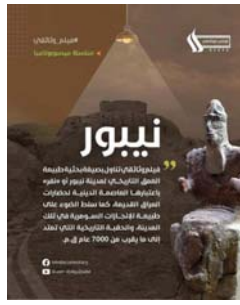
● بوستر الفيلم

خلال ضالبايات الدورة الرابعة والعشرين للهرجان العربي للإذاعة والتلفزيون التي أقيمت موزونومايا الوثائقية المهمة بتقديم قراءة جديدة للحضارات العراقية القديمة، حصل فيلم «نيبور» من إنتاج مديرية الإنتاج الوثائقي في شبكة الإعلام العراقي، على الجائزة الثانية. منافسة مع فيلم عبادنة من إنتاج وزارة الإعلام في سلطنة عمان.