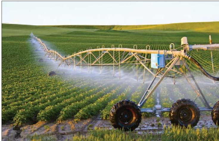
● سياسة زراعية ناجحة