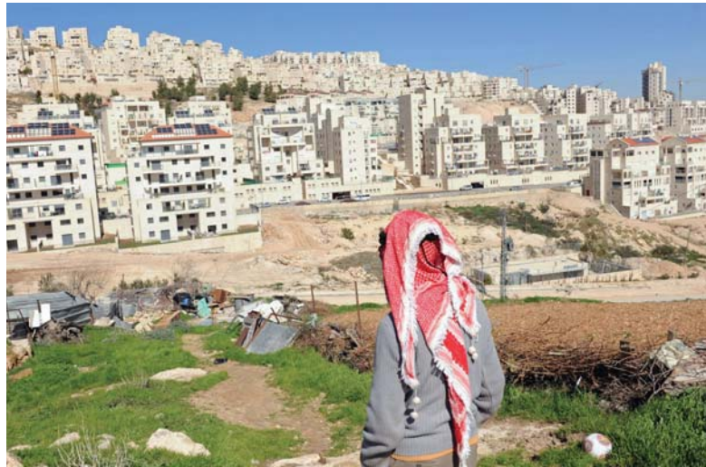
تنتهي اليوم الخمس، الإدارة المدنية الصهيونية، من المصادقة على بناء 5300 وحدة استيطانية في مستوطنات الضفة الغربية، كما ستتم الموافقة على تسويق 500 وحدة استيطانية ومن بين المستوطنات التي سيصادق على البناء فيها، مستوطنة أون موريه 186 وحدة استيطانية، كريات أربع 240 وحدة استيطانية، و435 وحدة استيطانية لمستوطنة نيرا.