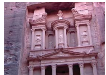
● البتريانيون يحضرون مساكمهم في الصخر

محفور في الصخر الأصم على وجه العبل، ومدرجات عامة بنيت للاحتفالات والحكمة وأماكن العبادة. فضلا عن سحر بيوت أهل المدينة التي نحت على الصخر الوردية اللون، مع صفوف الدرج المزخرف، واليوابات الحجرية وأن الأنياب جطوها عاصمتهم. تصل جزيرة العرب ببلاد الشام، وصولاً إلى قلب أوروبا اشتهرت بتجارة الأقمشة والجلود والحريير والشوايل والدخول مسسكة بزمام التجارة بين العراق ولسفطين وبيوريا ومصر. ضم موقع الخزنة أي بيت الحكم، يرج أنه قبر أحد ملوك الأنباط،