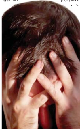
● يحدث الاضطراب حين تشعر ان العالم ضدك

1- التفكير المبهم، وفيه يتعمد التفكير عن المواقف الحقيقية أو الواقعية، يشبهه في الخيال والأحلام، غير أن الفرد هنا يقوم بأفعال مطابقة لما في خياله، ويحدث في حالات النقص. 2- التفكير الجامد، وفيه ينتقل التفكير الى المرونة والتبصر والتجريد والاستنتاج. وتنضت لك اضطراباً رابعاً، وبه نتجت، اسمه اضطراب احتوى التفكير، وفيه تكون الصفة العامة لهذا النوع من الاضطرابات هي الهم العقلي، ويقصد به الأفكار والمعتقدات والآراء التي لا تنطبق على الواقع، ولا يمكن ربطها بأساس سببي بفسره، كما لا يمكن إلتماسها بالمنطق والإقناع، فضلاً عن تناقضها مع ما هو معلوم عن المستوى الثقافي والاجتماعي.