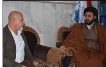
● الأمين الخاص مع المحرر

ولد، فقال لها اسجدي لي وأرد عليك، فقالت إن لي زوجاً استأمره فلما رجعت وأخبرت زوجها بذلك عرف أنه الشيطان وغضب عليها وحلف أن يجعلها مئة جلد، ولعل هذا هو الأقرب للتصديق، مع ملاحظة أن الشيطان هو من أوصله إلى ما هو عليه فكيف يبهيها لما أراد.