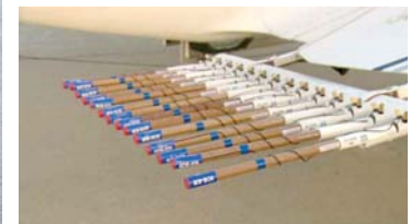
• الوسائل المستخدمة في بذر السحاب

يقول مسؤولو الارصاد الجوية في دولة الإمارات العربية إن عمليات بذر السحب التي ترفع معدلات تساقط الأمطار بنسبة 10-30% في ولاية كاليفورنيا أن برنامجها قد يرفعها إلى ما بين 5 و 10%.