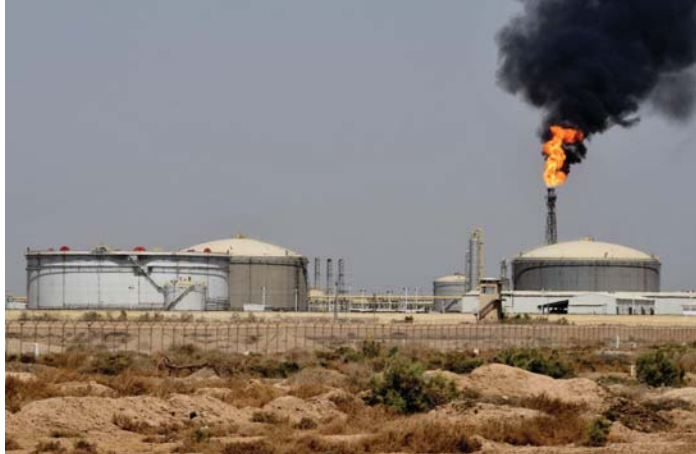
● حرق الغاز المصاحب، أضرار بيئية وخسائر اقتصادية كبيرة

تعمل وزارة النفط وفق خطة متوسطة الأمد لاستثمار الغاز الذي يعد شروة غير مستثمرة بصورة كاملة، حيث يتم حرق مليارات الدولارات سنويًا عن طريق حرق الغاز الصاحب، بينما تنتظر كميات هائلة في باطن الأرض الاستخراج والاستفادة منها. وبحسب المتحدث باسم وزارة النفط عاصم جهاد، فإن نسبة استثمار الغاز وصلت إلى 62 بالمئة، نافيًا وجود موعد محدد للاكتفاء الذاتي.