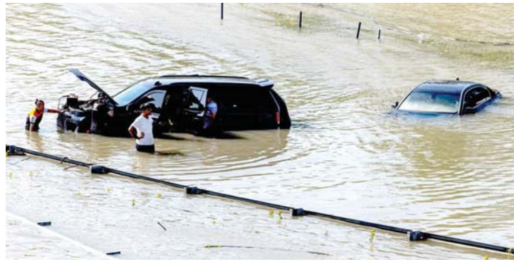
• فيضان دبي أعاد النقاش إلى الواجهة

أما بذر السحب فإنه يتم نمودجياً باستخدام طائرات مجهزة بوسائل خاصة، كما يمكن استخدام مولدات منصوبة على الأرض، لزراعة حبات السحب (عادة ما تكون من مركب يويد الفضة) داخل السحب المنتخبة وجعلها لتقوم مقام الثوي. وبذلك تتحفر عملية تساقط المطر. هل "بذر السحاب" عملية ناجحة؟ منذ أن طرحت تقنية تعديل الطقس عن طريق الرصد المستقبلي خلال أربعينيات القرن العشرين صارت تستخدم بانتظام على مستوى جميع أنحاء العالم، من دولة الإمارات العربية إلى الصين مروراً بالولايات المتحدة، لتحقيق نطاق واسع من الأغراض المقصودة. بل إن عملية "بذر السحاب" التي تستخدمها الحكومات في أغلب الأحيان تتعامل مع مشكلة الجفاف، لم تلبث أن ارتبطت ببعض أسوأ أحداث التاريخ بدءاً من إزالة الثلوج في المدن الصينية من أجل الحصول على سموات زرقاء صافية خلال فترة أوليها بكين التي جرت سنة 2008، إلى دره السحب الأشعة التي زحفت صوب موسكو في أعقاب كارثة تشيرنوبل النووية. وعرفته تحركات القوات الحادية للولايات المتحدة خلال حرب فيتنام. (مؤد