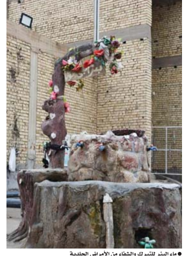
● ماء البئر للتبرك والشفاء من الأمراض الجلدية

تحميل التشاكد وقاسى الأحوال وفقده الأهل والمال في الامتحان الإلهي ولم ينس ذكر الله