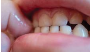
● الاسترخاء علاج لهذه الظاهرة