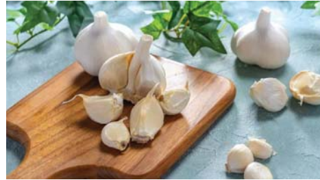
● دواء فعال لأمراض الشيخوخة