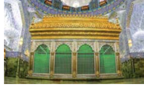
● شيوخ الامام - عليه السلام