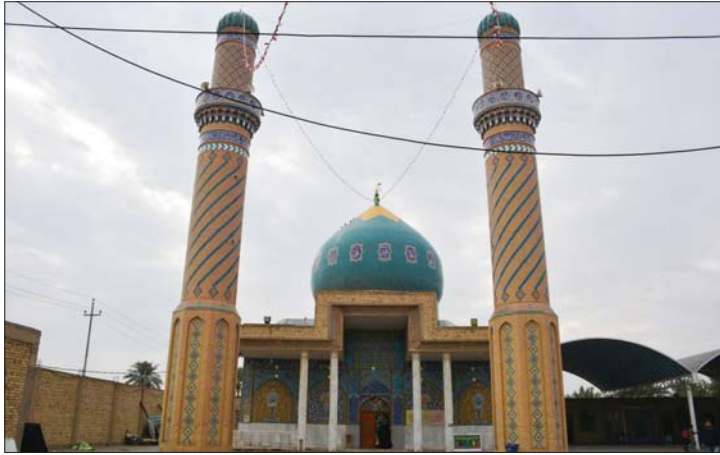
● مرقد النبي أيوب (ع)

● عامر جليل ابراهيم ● تصوير: الأمانة العامة للمزارات الشيعية