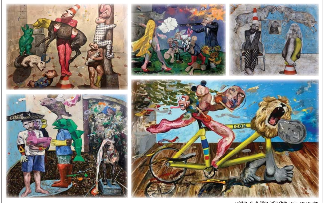
● أسلوب يحمل السهل والمعقد الثابت والقلق، الساخر والغائب

إنه، إن السيد الصغير لهذا العالم لا يزال بنفس الطابع، ولا يزال عجبياً كما كان في اليوم الأول وكان سيحيا على نحو أحسن قليلاً، لو أنك لم تهيه وهم نور السماء. ذاك الذي يسميه العقل، لكنه لا يستعمله إلا ابتغاء أن يصير أكثر حيوانية من أي حيوان ويبدو لي أن ذلك ليظنكم، أنه يشبه جندياً طويل الساقين، يعبر دائماً ويتوالت طائراً مشداً في العشب تشيده العقيق، يودي لو رقد إلى الأبد في العشب؛ لكنه يدس أنه دائماً في كل السفايف... يوهان غوته. إن ظهور فنّانين راضين للتقاليد السائدة هو تغيير من حالات حراك فكري جديد يرفض الرواية والتكرار والعيش في تجارب الآخرين ويخضع هذا التدرج للأسس الثقافية وحالة الوعي التي يعيشها كل فنّان والتي تستلهم من خلال موهبه إياها لأعمال وأساليب فنية. تعيدنا أعمال سنان حسين اللادة إلى عهد