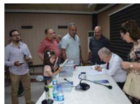
● حفل توقيع من طراز رفيع