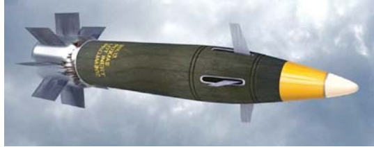
● قذائف المدفعية إكسكاليبور الموجهة بنظام المواقع العالمي

للتقييم خلال تلك الفترة أصبحت القنابل تحط على أهدافها حتى من مسافات قريبة لا تتجاوز 20-500 مترًا وفقًا للبيانات فقد أرسلت أوكرانيا ملاحظاتها حول مشكلة