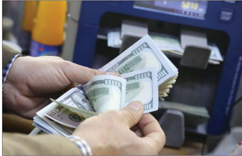
● الدولار يواصل الارتفاع في الأسواق الموازية

من المزمع أن تبدأ الأسبوع المقبل، آلية بيع الدولار في المطارات وفقاً لتعليمات البنك المركزي الجديدة، التي تزامنت مع الارتفاع الذي يشهده الدولار في السوق الموازية على حساب الدينار. وسط ذلك، يدعو مختصون البنك المركزي إلى اتخاذ إجراءات كثيفة باستقرار أسعار الصرف في الأسواق المحلية.