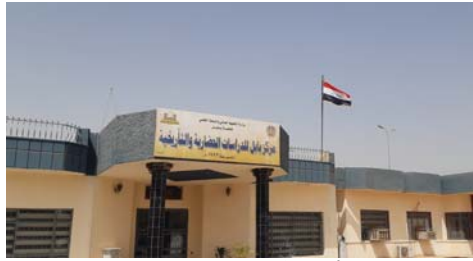
● مركز بايل للدراسات الحضارية والتاريخية

يقارن العنبر بين أفكار العلوي عن الإسلام، وموقفه تجاه العديد من المفكرين العرب المعاصرين، أمثال فهمي جديان وحسن حنفي ومحمد أركون وحسن مروة ومحمد عابد الجابري وعبد الله العروي، مستنتجاً أن طروحات العلوي كانت تسعى إلى أسلمة الماركسية وليس مركة الإسلام. وفي ذلك حكم يستدعي الرجوع إلى كتبه المتنوعة، ومنها كتابه القديم - الجديد هذا الذي يمثل إضافة نوعية لمكتبة هادي العلوي التراثية الإسلامية.