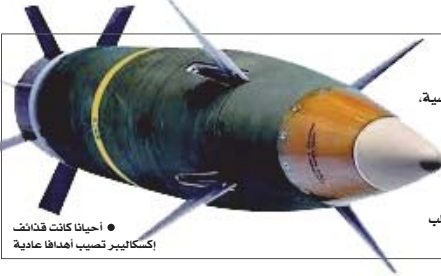
● أحيانا كانت قذائف إكسكاليبور تصيب أهدافا عادية

يفيد مسؤولون عسكريون أوكرانيون رفيعو المستوى، وكذلك التقييمات الأوكرانية الداخلية السرية التي حصلت عليها صحيفة "واشنطن بوست" بأن العديد من الذخائر أميركية الصنع التي توجه بالاقمار الاصطناعية في أوكرانيا قد أخفقت بمواجهة تكنولوجيا التشويش الروسية، الأمر الذي دفع بكيبيف إلى التوقف عن استخدام أنواع معينة من الذخائر التي يرسلها إليها الغرب بعد أن انخفضت مستويات فعاليتها. فقد أدت عمليات التشويش التي تمارسها روسيا ضد أنظمة توجيه الأسلحة الغربية الحديثة، ومن بينها قذائف المدفعية "إكسكاليبور" الموجهة بنظام تحديد المواقع العالمي "جي بي إس"، ونظام المدفعية الصاروخية عالية الحركة (هايمرز) الذي يمكنه إطلاق صواريخ أميركية الصنع يصل مداها إلى نحو 80 كيلومترا، إلى الحد من قدرة أوكرانيا على الدفاع عن أراضيها كما جعلت المسؤولين يبادرون بطلب مساعدة عاجلة من الناتو للحصول على تحديثات من مصنعي تلك الأسلحة.