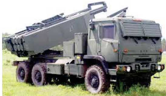
● نظام المدفعية الصاروخية عالية الحركة (هايمرز)

أوجدت الغزوة الروسية لأوكرانيا ميداناً حديداً للاختبار الأسلحة الغربية التي لم يسبق أن استخدمت أيضاً ضد خصم يمتلك ما يمتلكه موسكو من قدرات التشويش على "جي بي إس". الملاحة عبر نظام تحديد المواقع العالمي "جي بي إس". الابتكار سمة فعالية لأي صراع، وهذا يشمل الحرب الأوكرانية، حيث ينشر كل جانب في الميدان التكنولوجي والتغيرات المتكررة للإنتاج والتطوير الأخر واستغلال نقاط