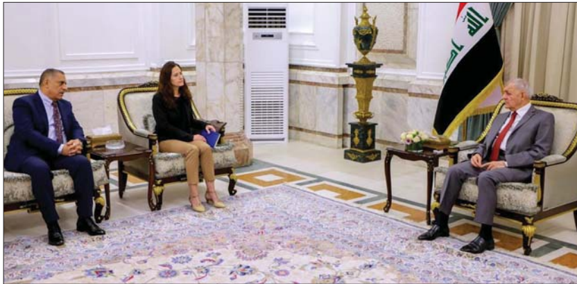
رئيس الجمهورية، يضمن دور فريق التحقيق بجرائم داعش (بوينتاد)