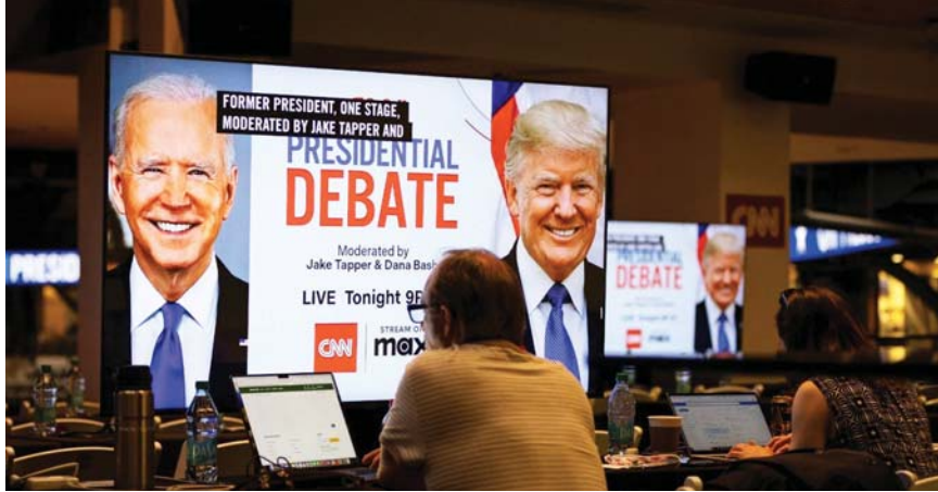
• بايدن رفض التنحي من السباق الرئاسي رغم ادائه الكارثي بالمناظرة

فقد توسل استطلاع للرأي الوطني كلنتون باجراره شركة بينديكسن أند أمأندي. في أعقاب مناظرة بايدن الفجوة سياسياً واملت عليه حصراً مجلة بوليتيكو إلى أن بايدن جاء متخفياً عن ترامب بنسبة 42 بالمئة مقابل 43 بالمئة من بين الناخبين المحتملين الذين بلغت نسبتهم 86 بالمئة ممن تابعوا المناظرة بأكملها أو أجزاء منها لا تعتقد سوى نسبة 29 بالمئة أن بايدن يتمتع بالقدرة الذهنية والتحمل البدني اللذين تتطلبهما ولاية رئاسية ثانية أمداً أربع سنوات، مقارنة بنسبة 61 بالمئة أعربوا عن اعتقادهم بأنه لا يمتلك تلك القدرات.