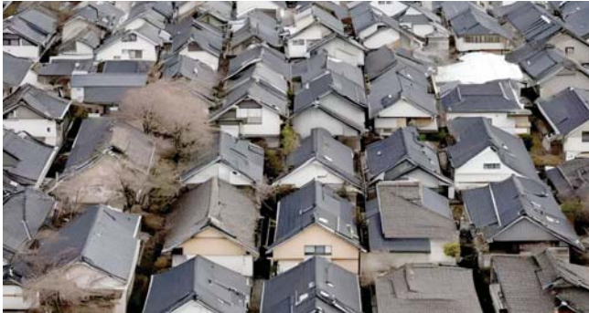
الكثير من منازل اليابان الريفية تخلو من الساكنين

يوجد بعدد ياهو كبير من المنازل الشاغرة، فقد عولت أيا عملية تهتمها. ويوضح الأستاذ القدير أنه مع بقاء هذه العقارات دون مساس، «ستتخلف قيمة المنطقة لأنها لا يمكن إجراء عملية بيعها وضرتها بشكل صحيح، ولا يمكن القيام بتطوير واسع النطاق لها. كما سيمتد التماس أن هذا المسكن ليس له قيمة، وستتخلف القيمة العقارية للمنطقة بأكملها تدريجياً».