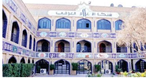
شبكة الإعلام العراقي

أقرت لجنة الدراما المشكلة في شبكة الإعلام العراقي، بتوجيه من لدن دولة رئيس الوزراء المهندس محمد شياع السوداني، واحداً وثلاثين مسلسلاً من بين مئة واثنين وأربعين سيناريو قدمت إلى مديرية الدراما في الشبكة، توزع إنتاجها بواقع شهرين لكل محافظة، من الموصل إلى البصرة، بهدف المساواة في توزيع الفرص، وستبت الأعمال من تلقزيون العراقية في شبكة الإعلام العراقي، وعلمت الصباح أن الأجور جيدة، قياساً بالماضي، حيث يتقاضى الممثلون الرئيسيون مليون دينار عن كل حلقة، والكوميبارس مئة ألف عن كل ظهور، وتتوزع السيناريوهات في خمس عشرة حلقة في الموسم، وسحرص مديرية الإنتاج الدرامي على تأمين فرص للممثلين من الممثلين، واستيعاد الطائرات على الفن بسؤالية وطنية ثقافية جيدة.