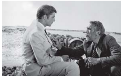
فيلم «زوربا» (1964) روضة الرواية وعظمة الاقتباس

الفيلم الذي أسهم المخرج جوزيبي تورنتوري في كتابته طويل نسبياً، إذ بلغ زمن عرضه 156 دقيقة، وقد استضاف فيه العشرات من صناعات السينما والموسيقى الذين أدوا بشهادتهم في الفيلم، منهم المخرج كورتال تارانتينو وسيد الطالع كينت إسبوسود، وأخرج أوليفر ستون، وترانس ماليك، ويزارادو بير توتوشبي، وكوينسي جونز، والموسيقار الأثاني العظيم فانز زايمر الذي قال: إن موسيقى إنيو موركوني مهمة وأثرت في موسيقانا.