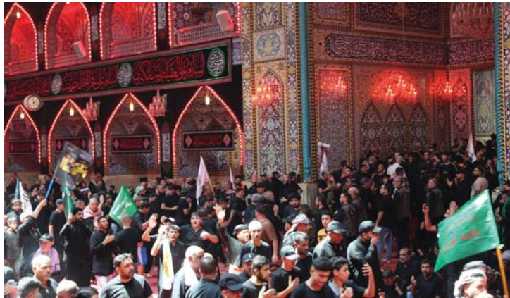
عيد أهل البيت لتاج تربية اسرية ومتمبرية

وتكتمل: من ثأت هذه المحبة والموالاة عن فراغ، بل هي نابعة من سنة النبي الأكرم (ص) ومن كمال الدين وتعام التعمّة، كما نصت على ذلك العديد من الروايات والأحاديث ومنها خطبة الغدير، وحديث القتلين، وحديث أنت مني بمنزلة هارون من موسى، ورواية أم سلمة (رض)، ورواية القارورة، وسكك النبي (ص) في مواضع عديدة لا تسجدت لإمام الحسين (ع) في كربلاء، فالعراقيون من (أبياع أهل البيت) وفي أيام شهر محرم وصفر: تحدهم يستذكرون مصاب إمامهم الحسين (ع) وسي السيدة زينب (ع)، وهذا الاستدكار عندهم سنة نبوية