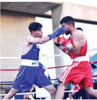
● منهاج حافل بالبطولات

وأشار الفراوي إلى أن دعم المنتخب الوطني والأندية والاتحادات الغربية، وإقامة الدورات التطويرية للمدربين والحكام تعد من أهم أولويات اتحاد الملاكمة، من أجل الارتقاء بمستوى المسابقات وضمان الحصول على أكبر عدد من الأوسمة الملتفة على مختلف الأصعدة الدولية بالفترة المقبلة.