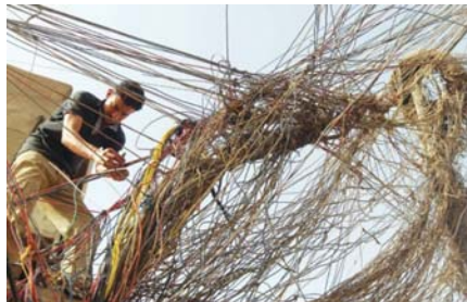
● أغلب مولدات الكهرباء الأهلية تقتصر إلى معايير التجهيز الصحيح