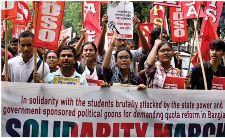
هددت مجموعة من الطلاب في بنغلادش، أمس الأحد، باستئناف التظاهرات، بعد عدة أيام من الاضطرابات الدامية، ما لم يتم إطلاق سراح قناصهم الميجورين، فيما أعادت السلطات الإنترنت الطلوي، وأدت الاضطرابات بين المتظاهرين والشرطة والقتل الدامي إلى مقتل 205 أشخاص الأسبوع الماضي، بحسب صحيفة استندت إلى بيانات الشرطة ومستشفيات.

وبعد اللقاء دعت هاريس القيادة الإسرائيلية علناً إلى إیرام صنفه تبادل مع حركة حماس في أقرب وقت ممكن، مشددة على ضرورة إنهاء معاناة الفلسطينيين.