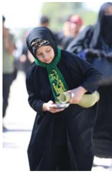
• إرادة الحسين (ع) للشهادة «الموت» مضلّ أياها على الحياة

إن من جملة ما يفهم من موقف الإمام الحسين «ع»، في واقعة كربلاء هو أنه استخدم حق الموت للتأكيد على حق الحياة أو الفراق الأخير له «خير لي مصرع أنا لايه»، فمع فرض القتل أو مقدم عليها وغير مبال بالناتج، لأن الحياة مع الظالمين في متعلق الأحرار والثائرين لا تعدو إلا ملام ورثة لا طائل لها، والحياة مع الظالمين برماً وهذه المعادلة ليست مهياة لأن يعوضها كل أحد، فهي حق حصريّ للثوار لأصحاب المشاريع التحررية من قيود المستبدين والطواغيت ومطلّي لا يبايع مثله، فكل من يشبه الإمام الحسين في الصفات وهي التيم هو أن يخضع لأمثال يزيد، التناقص الفاجر المستبد والظالم، ولذا حينما امتحن الإمام الحسين في كربلاء بين القتل وبين الحياة ولكن بذلة «عار» البعية للحاكم الجائر والسياسي الفاسد والمسؤول المستبد، ما كان من إلا أن يطلقها رجوة أمام جحافل الذين وقفوا يناشولون الإمام الحسين في هذه الحياة وأمثولة لأجيال، «ميهات منا الذلة»، فمنها لا يفتقد إلا من ترضى على قيم الحرية ونشأ في حاضنة طاهرة ملؤها النقاء والصدق مع الذات.