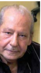
الروائي السوري حنا مينا

زواية المنة والعائدة والجدة التي قدمها في بناء الشخصيات والجدية التي والسرد وغيرها من العوامل التي تشارك في تاريخ السينما، وتخلد في ذاكرة الجمهور، ذهب مع الريح، عن رواية خيالي متصور إحدى الشخصيات حيث تعزف جمهور السينما على ذلك أن كاتب السيناريو والمخرج معطيات وتصورات أخرى غير تلك التي في ذهني وذهن كاتب الرواية أيضاً، ذلك يذكرني على سبيل المثال بما فعله د. عبد السلام العجيلي، إذ إنه رفض مشاهدة فيلم «باسم» بين «دموع» المأخوذ عن روايته المشهورة، لأنه سمع عن هذا الفيلم ما يكفي للشعور بالخيبة، بسبب الفرق بين أناقة الحب في الكتابة، وسداجته