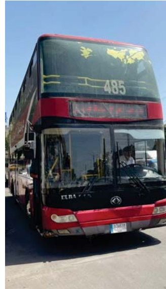
العروس الحمراء عادت مشرقة في شوارع بغداد..

على هامش مهرجان ثورة الإمام الحسين عبرة وغيرة، التي نظمتها اللجنة الفرعية كركوك للفرق الفنية في مديرية مكافحة الإرهاب الكركي، على قاعة مؤهسية حقوق الإنسان، أقيم معرضاً للمطالمة إيلاف جهاد، وقالت جهاد، يضم المعرض عشر لوحات، مينة أحب الرسم منذ سنوري الطبيعية.