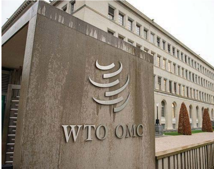
مفاوضات تسير بخطوات حثيئة

ضاعت وزارة التجارة تحركاتها الهادفة إلى انضمام العراق لمنظمة التجارة العالمية (WTO) بعد مشاركتها في جولة واسعة من المفاوضات التي تمهد لاكتساب كامل العضوية، وهي التحركات التي قوبلت بترحيب اقتصادي واسع، يرى أنّ ذلك التوجه من شأنه تحقيق حزمة من الإنجازات المهمة، والتي تقف في مقدمتها تعزيز التنمية وبناء القدرات وفتح الباب على مصراعيه أمام استخدام أعلى معايير الحوكمة، فضلاً عن العامل الأهم المتمثل في الانفتاح الواسع للأسواق العالمية على العراق والنهوض بالقطاع الصناعي الخاص والارتقاء بالمنتج المحلي.