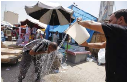
● التراجع الكبير في تجميع الطاقة الكهربائية يتزامن مع ارتفاع درجات الحرارة

ما لا يقل عن عشرة مليار دولار سنوياً، وإنهاء ملف المولدات الأهلية في العراق. وفي وقت سابق كشف رئيس الوزراء محمد شياع السوداني في بيان رسمي عن وضع حلول لأزمة الكهرباء منها ما هو آني ومتوسط وطويل المدى، مؤكداً بأن هذه الأزمة متوقفة، ويعد موسمية تحصل مع بداية كل صيف، مثمرا بقوله "توجهنا بقوة نحو صيانة المحطات وأكملنا عملها قبل بداية الصيف، وسارعنا إلى أن إنتاج الكهرباء وصل إلى 26 ألف ميغاواط، مبيماً أن الحلول المتوسطة المدى ستتهيأ آتياً الكهرباء واستيراد الغاز". لكن التساؤل الذي كان ولا يزال مطروحا، متى تغيب أزمة انقطاع الكهرباء عن عراق؟