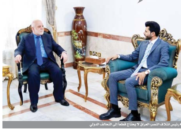
رئيس ائتلاف النصر، العراق لا يحتاج قطعاً إلى التحالف الدولي

رأى رئيس ائتلاف النصر حيدر العبادي أن العراق يتمتع باستقرار أممي كبير في عهد الحكومة الحالية العكس على الحركة الاقتصادية. وقال العبادي في مقابلة مع «أوع» إن البلاد تشهد استقراراً أمنياً كبيراً بفضل الاهتمام بالأمن وجاهزية القوات العراقية بعد الانتصار على داعش عسكرياً بتحرير الموصل عام 2017 وما تلاه من انتصارات.