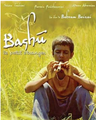
بوستر فيلم «باشو الطفل الصغير القريب» (1986)

باسمو الصغير القريب كتب السيناريو له ومنتجه بيضائي ووضع الموسيقى التصويرية له فيروز ملك زادة، بينما جسده دور الطفل ملك بقلانغيتي عدنان عقرويان، وقدمت بسوسن سلسيمي ذات باهرأ مدور نعمة المرأة القوية التي أوتت باشو ودافعت عنه.