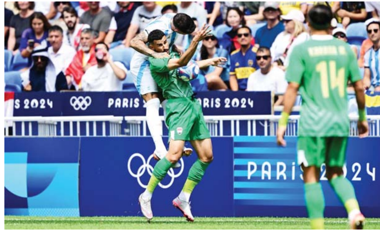
● ضوابط بتعديل المسار