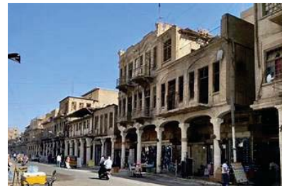
والفرقة القلب كالمسححة

مرت الثلاثة الماضية الذكرى 108 لافتتاح شارع الرشيد في 23 تموز 1916 من قبل والي بغداد العثماني خليل باشا، باسم جادة سني أول الأمر، تيمناً بقناصية إعلان الدستور العثماني، وقال المؤرخ صباح السعدي، لـ 'الصباح' الأسماء على الشارع.. جادة خليل باشا وستي وهنديويك ورسبي، ليس أن استقر على شارع الرشيد عام 1936 الذي أطلقه العالم اللغوي والمؤرخ العراقي مصطفى جواد؛ تيمناً بالعصر الذهبي للخليفة هارون الرشيد، وأخذت به أمانة العاصمة المسؤولة عن تسمية الشوارع. وأضاف السعدي، شكل الشاعر عنوناً رئيساً في بغداد؛