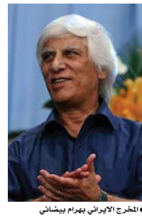
المخرج الإيراني بهرام بيضائي

يعد المخرج الإيراني الشهير بهرام بيضائي (ولد عام 1938) من بين 487 عضواً في مجتمع السينما العالمي الذين تمت دعوتهم من قبل أكاديمية فنون وعلوم الصور المتحركة (الأوسكار) للانضمام إلى صفوف عضوية الجهة المنظمة لجوائز الأوسكار، وكذرت وكالة أنباء الطلبة الإيرانية (إيسنا) أن بيضائي، تلقى دعوة من فرعي المخرجين والكتاب في الأكاديمية.