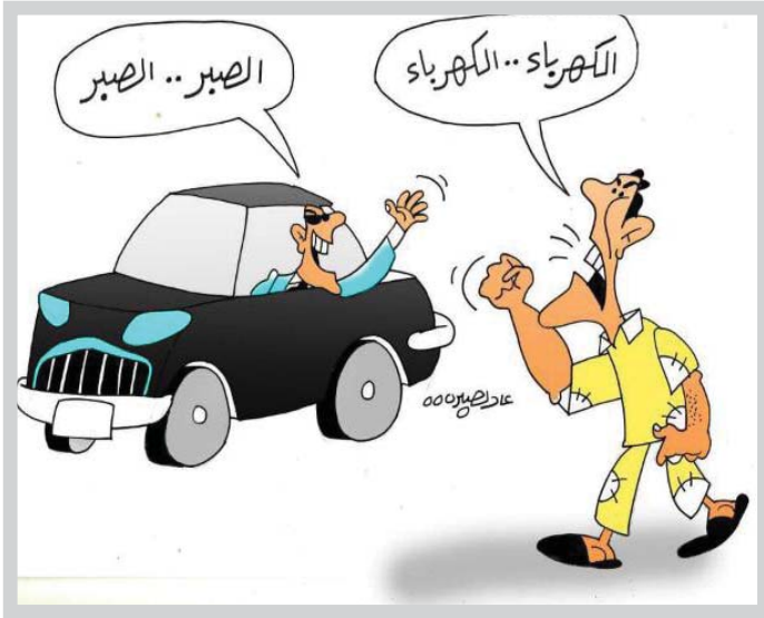
● كاريكاتير: عادل صبري