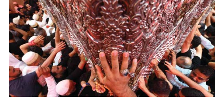
الحسين وجدان حي