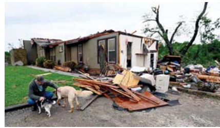
● منطقة يابانية قليلة السكان بعد تعرضها لكارثة طبيعية

لذا، كل هذا يعني أن مشكلة وجود عدد كبير جدا من المنازل وعدد قليل جدا من الأشخاص