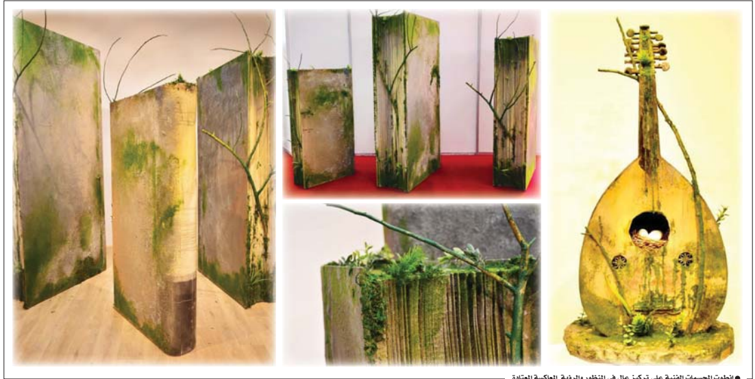
• منظورات الجسومات الفنية على تركيز عالٍ في المنظور والرؤية المعاكسة المعتادة

منظور يتماهى وجمالية المكان، كان ذلك في العام 2021، حيث كانت إتقانة الجمهور للأعمال التي قدمها تمثل التماذج المتداخلة مع الموضوع ذاته فيها متعة جمالية كبيرة، حينها تحدثنا عن هذه التجربة في المكان ذاته، ولخص جسام قوله بأن مشروعه مستمر في هذه التجربة التي سبقتها تجربة في العام 2016 بمعرض عنوانه (إعادة تدوير) في برج بابل على وجه التحديد. قد يكون أسلوب التجريب الذي اشتغل عليه جسام عبر الإصرار على العمل الفني التجسدي الذي يعطي رؤية لها منظورها