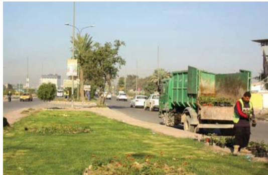
● حملات مستمرة لكساء الشوارع وتشجيرها