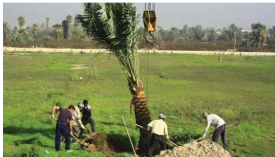
● التقليل من التغيرات المناخية بمكافحة التصحر