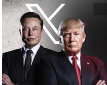
● مقابلة ماسك مع ترامب حصدت أعلى المشاهدات

وقد أجرى ماسك مقابلة مع ترامب على منصة (X)، وقيل بدء البيت، قال إن الشبكة الاجتماعية أجهت هجوماً ضخماً لحجب الخدمة، وتم نشر تسجيل المقابلة على صفحة ماسك الرسمية على منصة (X). وأضاف ترامب بعدد من التصريحات المثيرة للجدل، من بينها زوّهة أنّ أحداً لم يعد يحترم الولايات المتحدة، وأنّ البلاد أصبحت في حالة سيئة للغاية، وشدّد على أنّ سبب ذلك هو عدم كفاءة الإدارة الحالية، وحثها على مسؤولية النزاعات ومن بينها النزاع الأوكراني والوضع في غزة، مشيراً إلى أنّ كل هذا ما كان ينبغي أن يحدث على الإطلاق، وقد بثت المقابلة فجر أمس الثلاثاء، بتوقيت الشرق الأوسط.