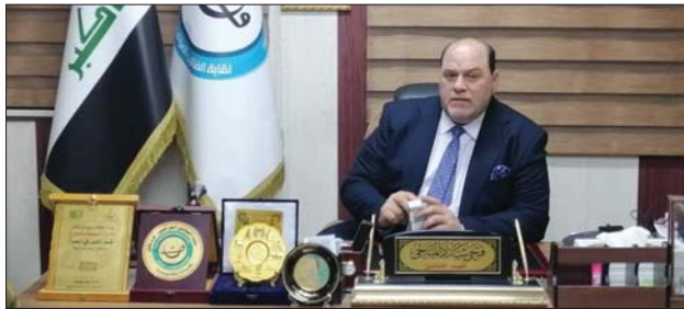
• جودي يريعى سلسلة مهرجانات الطّف