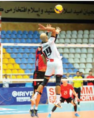
• مشاركة عربية مرتقبة