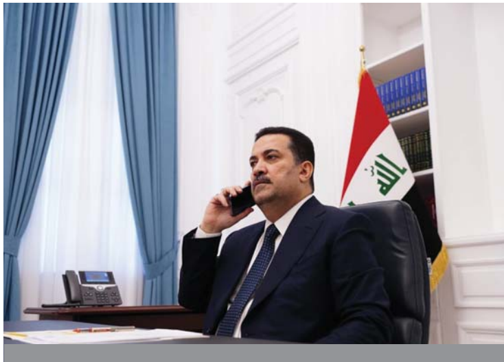
السوداني في العدوان على عذبة سبب الأزمات في المنطقة

من جانبه، استعرض وزير الخارجية الأميركي، الجهود الدبلوماسية الجارية لوقف التصعيد، والتزام الولايات المتحدة الأميركية استمرار المشاور مع الجانب العراقي بشأن قضايا المنطقة، ودعم مسار تعزيز العلاقات والتعاون بين البلدين.