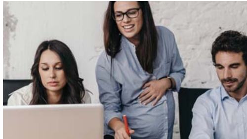
• التمييز الذي يمارس ضد النساء

في وقت سابق أثارت حوادث التمييز ضد النساء الجوامل ضجة في منصات التواصل الاجتماعي، الأمر الذي دعا كثيرين للوقوف بوجه هذه الممارسات الخاطئة، لكنه لم يعد كونه حوادث وقتية، وأخباراً ميديوية، فالأمر لا يفت عند التمييز في العمل، لا بل تعدى ذلك، إلى أن أصبحت المرأة العامل عرضة للتمييز، أو التحرش، وأن تشع عبارات خادشة للحياة، في الأماكن العامة من قبل كثيرين.