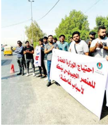
شباب يطالبون بتوفير فرص عمل

ويقترح الأكاديمي مطر للحد من البطالة وتشغيل فئة الشباب، ما يأتي: إعادة تشغيل المصانع المغلقة على وفق رؤية وتكنولوجيا جديدة ملائمة لمتطلبات الإنتاج في العصر الحديث، وتشجيع القطاع الخاص بحسب آليات مشددة تضمن تشغيل الأيدي العاملة من فئة الشباب العراقي، لدعم توفر الإنتاج المحلي، فضلاً عن استثمار