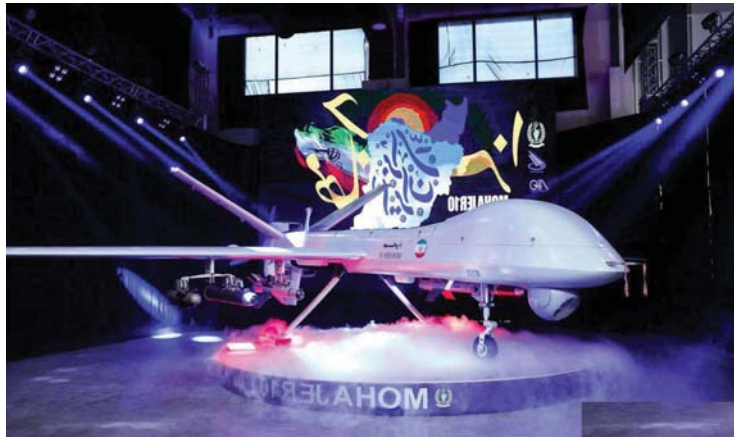
● إيران تعرض طائراتها المسيّرة مهاجر 10 بعيدة المدى