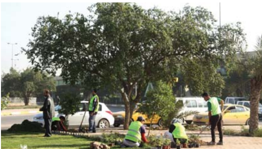
● السعي لزيادة المساحات الخضراء