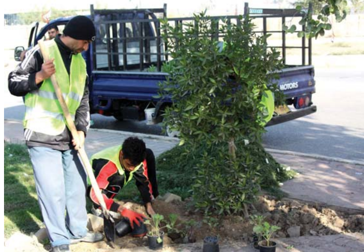
● الأشجار والنباتات واجهت مهمة للمدن

اليوم التي تشجع على التشجير ما تبقى منها. نشرت مؤخراً جريدة نيويورك تايمز الأميركية تقريراً يثبت فيه أن هناك انحساراً واضحاً، لثلاثة العينة لمنطقة بغداد الأحياء تلك المناطق التي كانت تنتشر فيها الأشجار وبكتفا، هذا الانحسار جاء لصالح بناء عمارات عديدة ومجمعات مختلفة، وإن هذا التقليل كان نسبة تصل في العامين الماضيين لتحوّل 12 بائنة، بعد أن كانت نسبة هذه المساحات أكثر من 28 بائنة. فهل ستفقد حملة التشجير ما بقي من تلك المساحات الخضراء، طرح هذا التساؤل سكان البصرة وكثهم هذا وتناول بهذا الأمر.