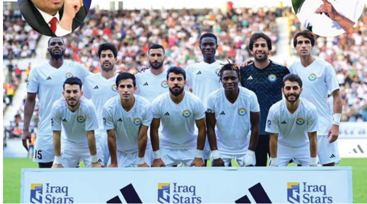
• نهاية أزمة الزوراء

الموتلة راعية وداعمة لكل عمل حقيقي لكن اللجنة الأولمبية عليها العمل بشكل فعال وتخطيط واقعي بلوغ الإنجازات وصناعة أوسمة الأوليمبياد