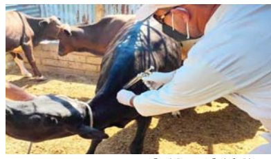
● حملات مكافحة الحمى القلاعية