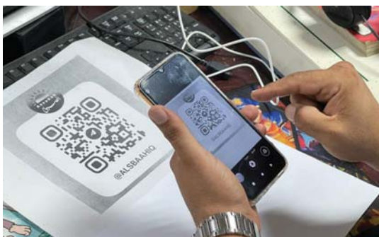
● سرعة الوصول للمعلومات

كما تم تطبيق هذه التقنية في وزارة المالية، وذلك باعتماد صحة الصدور الإلكترونية للمعاملات المختلفة، حيث أعلنت الوزارة عن إنجاز تطبيق نظام (QR) الخاص بصحة الصدور الإلكترونية للمعاملات المختلفة، جاء ذلك التزاماً بتوجيهات رئيس مجلس الوزراء وزير المالية طيف سامي، في تيسير الإجراءات الحكومية وتخفيف الروتين في المعاملات الإدارية عن كاهل المواطن وبمباشرة من قبل رئيس الديوان إسماعيل صالح داوود، حيث أعلن الديوان (أحد تشكيلات الوزارة) عن إتمام تطبيق نظام صحة الصدور الإلكترونية مؤكداً: أن نظام الوثائق الإلكترونية المؤمنة يعمل على إرسال كتب صحة الصدور التي تصدر من الديوان، وترد إليه من قبل باقي الدوائر، من خلال عمل باركود خاص للكتب الصادرة والتحقق من الكتب الواردة.