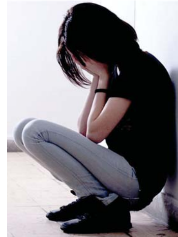
● آثار غياب الحوار معهم

مسموماً، إن لم يكن خاضعاً للرقابة والتفتيش وهنا يمد وقت طويل من الانسحاب الاجتماعي للأبناء، والافتكاه بما يتقونه من الخارج، قد يلاحظ الأيون ويد فوات الأيون تقترأ في سلوك الأبناء نحو الأيون، وربما يتأدهم عن عادات وتقاليد مجتمعنا وأعرافنا وديننا، وهناك حالات وأمثلة كثيرة لا بد أن كل واحد منّا صادف واحدة أو أكثر من هذه الحالات المختلفة الشدة، ولا سيما أن هناك من يترصب بأبنائنا عبر هذه اليوايات وتعتمد "أدوية" أفكارهم والتأثير فيهم، وربما قد يصل الحال باليخص من الأبناء إلى الانخراط في جماعات ذات فكر متطرف أو متعرف تتحكم بأفكارهم وسلوكهم، أو قد يقعون ضحية للمبتزين والتحريرين أخلاقياً وفكرياً وجنسياً، ما يجعلهم يقعون بين فكي الشر من دون أن يتلقوا أي مساعدة من المحيط الذي يجهل ما هم فيه، وذلك نتيجة انسحابهم منه.