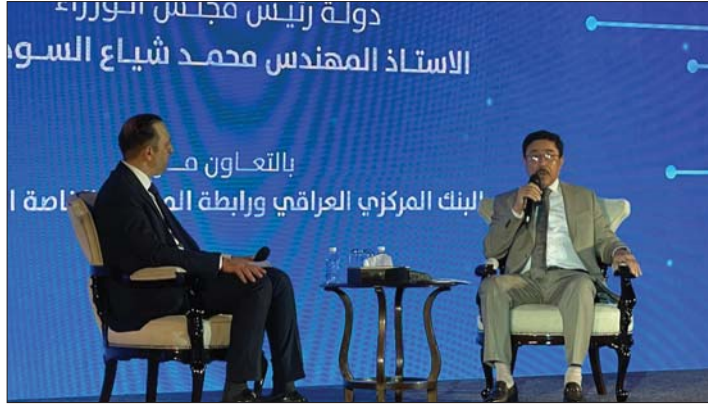
جانب من المؤتمر الذي اختتمت أعماله أمس الأحد

خلص مؤتمر المدفوعات والتقنيات المصرفية الدولي الذي اختتمت أعماله أمس الأحد إلى توجيهات جديّة لتطوير واقع الدفع الإلكتروني في البلاد والذي يتضح من حجم الطلبات على تأسيس مصارف رقمية والذي قارب 70 طلباً.