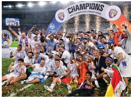
العين بطل النسخة الماضية

في السعودية، المرشحة الوحيدة لاستضافة مونديال 2034. وتتركز الأقطار اليوم الاثنين على نادي العين الإماراتي، الذي فاز في الموسم الماضي، بإحراز لقبه الثاني بعد الأول في 2003 في دوري أبطال آسيا لكرة القدم، على حساب يوكوهاما ماريوس الياباني. وهو في كل من الجولات الثماني، وهو 6-3 بمجموع المباراتين، عندما يبدأ رحلة الدفاع عن لقبه بمواجهة السد الفريق القطري الوحيد المتوج في 2011، في استاد هزاع مختففين داخل منطقتهم، بواقع أربع مباريات على أرضه وأربع خارجها، حتى 19 شباط 2025 يتأهل أول ثمانية فرق من كل مجموعة إلى دور ال16 المقرر في آذار، قبل تحول المنافسة بدءاً من ربع النهائي إلى السعودية من 25 نيسان لغاية 4 أيار 2025.