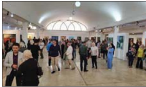
تشكيبيون في حضرة جمال

في مشهد احتفالي وسوق كبيرة، وعليه أترك باب السؤال مفتوحاً إن كان العراق يقرأ أم لا يقرأ، وإن كنت أميل إلى أن العراق يقرأ ويطلع ويبيع في هذا المعرض ما يكفي لاستمرار سوق الكتاب بهذا النشاط المثير