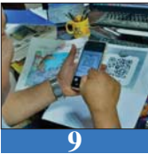
9 «الباركود» تشفير الكروتين يخلق فجوة الروتين