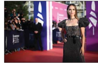
• بورتمان في الختام

وتلاقيه ستاروورز، إلى الاعتراف الفرنسي بالسينما الأميركية والاعتراف الأميركي بالسينما الفرنسية، مضمينة أنا محظوظة جداً لأنني أعيش في كلا العالمين. ومنحت لجنة التحكيم جائزتها لفيلم ذي نايتب للمخرج ناسمدي أسوموغا. أما الجائزة الكبرى فذهبت إلى فيلم إن دي سامرز للمخرجة أليساندرا لاكورازا ساموديو. وقال المخرج كلود المخرج، تماماً كالمبتدئين، لكنني سعيد باختتام هذا المهرجان بفيلم بعنوان هينالان. وأضاف هذا لا يجعلني أصغر سناً، فخلال الخمسين عاماً التي أتيت فيها بانتظام إلى هذا المهرجان، تكوّنت لدي ذكريات كثيرة سيكون من المحلل تمييز واحدة منها على حساب الأخرى. واختتم المخرج الفرنسي حديثه قائلاً: لقد نجحت في اجتياز العواطف وأنا سعيد لأنني تمكنت من إخراج 51 فيلماً، بما في ذلك أن أوم إيه أون هام الحائز على جائزة الأوسكار والذي سؤره مشهده الأخير على شاطئ دوفيل.