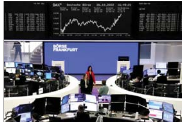
● أوروبا تواجه ضغوطاً اقتصادية

في الإنتاجية مثل الطلب العالمي القوي، والمطابقة الروسية الرخيصة، والاستقرار الجيوسياسي، وأضاف دراغي أن التحديات الديموغرافية، مثل تقلص عدد السكان في العديد من البلدان الأوروبية، والبطء في التحول إلى الاقتصاد الرقمي، تشكل عقبات كبيرة أمام مستقبل القارة. وقد قال "الأزمة ليست وليدة اليوم، بل نتيجة لإهمال طويل الأمد، وإد أن يتم اتخاذ إجراءات عاجلة، فإن أوروبا ستواجه معاناة متواصلة". شهدت أوروبا مؤخراً سلسلة من الأحداث التي تعزّز التحذيرات التي أطلقها دراغي وفق بلومبيرغ، فعلى سبيل المثال، أعلنت شركة "فولكس فاجن" عن انتهاء اتفاق أمّتي وظيفي طويل الأمد وتدرس حالياً إغلاق بعض مصانعها في ألمانيا لأول مرة منذ تأسيسها عام 1937.