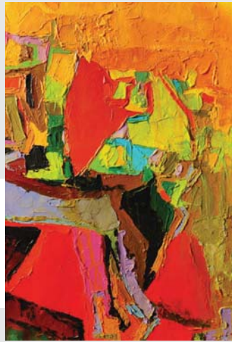
الفن التشكيلي عمل إبداعي تخييلي