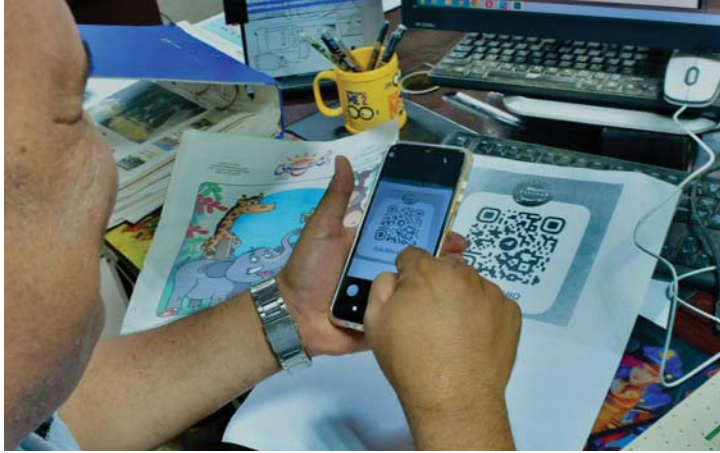
● يسهم باختزال الوقت وتجاوز الروتين والبيروقراطية

بإبوابه أورو الإلكترونية للخدمات وتجاوز الروتين والبيروقراطية، كما كان معمولاً به سابقاً، أثناء مراجعات المواطنين لمؤسسات الدولة، حيث كانوا ينتظرون في طوابير طويلة معاملة، فضلاً عن تعرضهم إلى عمليات ابتزاز من قبل عدد من الموظفين.