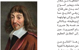
• ديكرات، المنهج العقلي