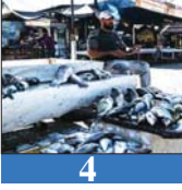
4 الزراعة: فتح استيراد الأسماك جاء لدعم المواطن