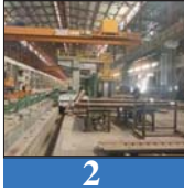
2 العراق يقرب من افتتاح أكبر مصنع للصلب في البصرة