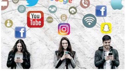
● إدمان هرقته التكنولوجيا الحديثة