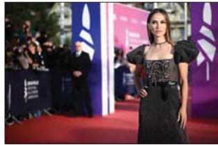
• بورتمان في الختام