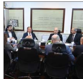
• لقاء سابق بين لجنة الأوقاف ورئيس ديوان الوقف المسيحي