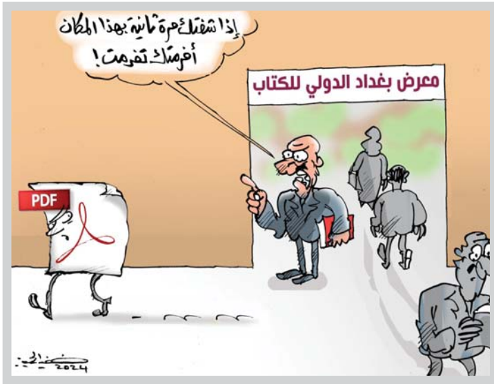
● كاريكاتير: خضير الحميري