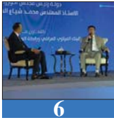
6 توجهات صوب تأسيس المصارف الرقمية