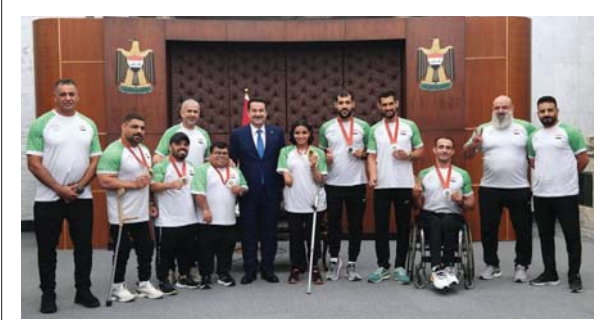
● رئيس الوزراء يشدد على توفير كل الرعاية والدعم للرياضات الفاعلة والمتميزة