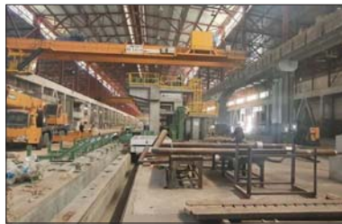
• تحركات حكومية واسعة لإنعاش الصناعة الوطنية

عملية التنمية الاقتصادية والاجتماعية. وأضاف أن السوزارة استهدجت روى استراتيجية وخطة تطوير القطاع الصناعي العراقي تقييداً للبرنامج الحكومي من خلال عقد شركات عالة مع القطاع الخاص لتسهيل التصنيع وإنشاء مشاريع جديدة باستخدام الأسلوب الأمثل لتمويل وإدارة مختلف المشاريع والاستفادة من الطاقات والموارد والخطة المتاحة لكلا الطرفين لتعزيز التنمية ونقل التكنولوجيا والابتكارات الحديثة. من جانبه توه الجبير الاقتصادي الدكتور علي عدوش لـ الصباح بأن من المهم جداً أن تكون مثل هذه المشاريع في العراق، إذ تهدف إلى زيادة الإنتاج المحلي وتقليل الاستيراد، مضيفاً أننا نشد على أيدي الحكومات، لإقامة مثل هذه المشاريع التي تكمن في خدمة المنتج المحلي وذات تافسية وجوده عالية لتكون نافذة في الأسواق الدولية فضلاً عن الأسواق المحلية.