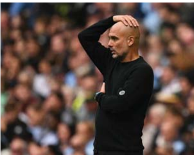
غودارد يلق من قسوة العقوبات

لدينا الطموح والأمل وقيلها لبينا الثقة في أن الفيئارة سيعزف على أوتار (النصر) وسيدشن ظهوره الآسيوي في ملعب المدينة بأداء متفوق ونتيجة مرضية تعدي خطاه في أهم البطولات الآسيوية على مستوى الأندية. وقضاتي أن الشرطة لن يخيب الأمل والأمال وسيكون استهلاله المشوار إيجابياً ومفرحاً.