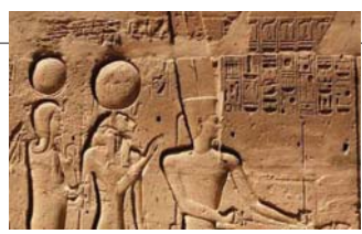
• أمون وهو الظاهر باسمه رع

تعرف الأسطورة بأنها حكاية رمزية محاكاة بهالة من القداسة، تلعب الكائنات الماورائية أدوارها الرئيسية، وتؤسس لصللة دائمة بين العالم الدنيوي والعالم القدسي. وقد ظهرت في حياة الإنسان كنتيجة لتحويل مخزونه اللغوي إلى أفكار يثبثها في محيطه، من خلال الكلمات والظن البصري، بحيث تعكس تجربته الانفعالية مع نفسه أولاً ومع الكون ثانياً. والإنسان في ترميزه الأسطوري لهذه التجربة، لا يبالج إلى التحليل الخطي المنظم، بل يكتبك بنسبة أدبية فريدة من نوعها.