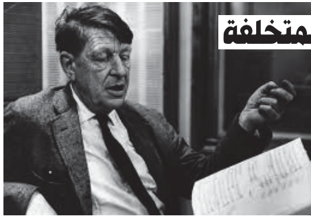
• وردت في قصيدة الشاعر الإنجليزي أودن جملة مركبة

هل أبدو مشاكسا أو مزور حقائق، أو أتي أجد عنذرا للستينين من حكام تلك البلدان، التي لا تجد فيها ما يسر ولا ما يريح، فتحاول تكذيب أهلنا وتقترب للمبرزين والوجهاء في كلام واضح الخلاف مع واقع الناس وحقيقة الأشياء؟ تست كذلك، أنا صادق معكم لا ممتزج، وأنا على سخريتي الباطنة صريح العبارة في الكشف واحترام الحقيقة كامل الاحترام.