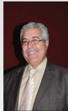
• وعد قاسم المكتوب