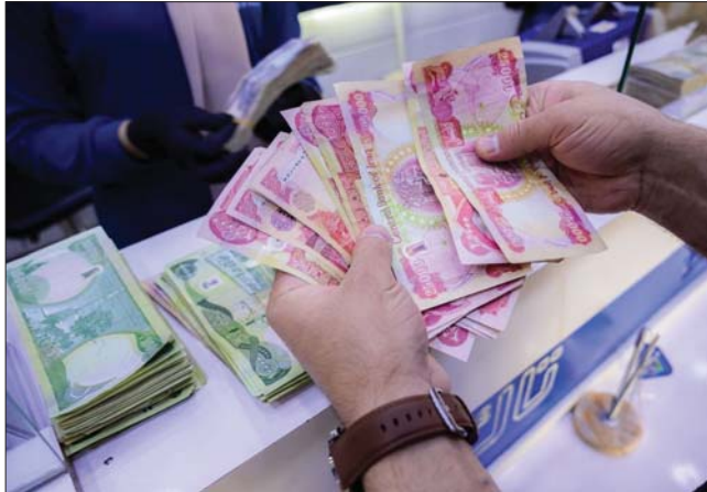
• تضمينات نيابية بتأمين مرتبات الموظفين