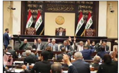
● البرلمان يستمر مناقشة وإقرار القوانين

وضع مجلس النواب إكمال القراءة الثانية لتعديل قانوني الأحوال الشخصية والقانون المدني على جدول أعمال جلسته اليوم، وسط توقعات بتعمير القانونيين خلال الجلسات المقبلة. يأتي هذا في وقت تشهد فيه جلسة اليوم أيضاً،