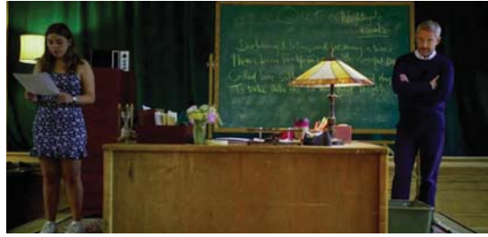
مارتن فريمان وجينا أورتيجا في «فتاة ميلر»، (2024)

العريقة، ومن هنا نفهم سبب فشله، بأن صود إلى الحصان الخاطئ- جينا أورتيجا، لا يمكن للمخرج إلا أن يكون منتمياً للبروتنة التي سحقت بين الممثلين في الواقع وشخصياتهم في الفيلم، ككارلو أورتيجا، قد تجاوزت الثامنة عشرة، فلماذا تكدر الجمهور؟ لقد كان جوناثان معجبا بجرأة هنري ميلر اللامتناهية، لكنه رفض جرأة كارلو الأنيق، من أنها بدأت بالكتابة الثانية من القرن المسكوت عنه بالعمد ذاته الذي بدأ به هنري ميلر، بدأ ميلر في نهاية العقد الثاني من القرن العشرين بنشر كتاباته، وكذلك كارلو، لكن في القرن الواحد عشرين. هنري ميلر، أما جوناثان الكاتب الفاضل والأنيق الذي فكره الحصان- الخاطئ- وتقول بأنه الحصان الذي سيعبر الأخط، الثانية، إذا قبل جرأة طرح كتابته، لكن... كما أراد بارتليت قوله، بأن المجتمع الذي