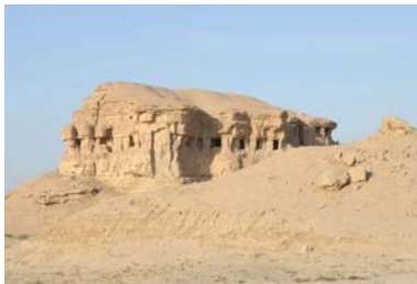
● كرويف الطار في محافظة كربلاء