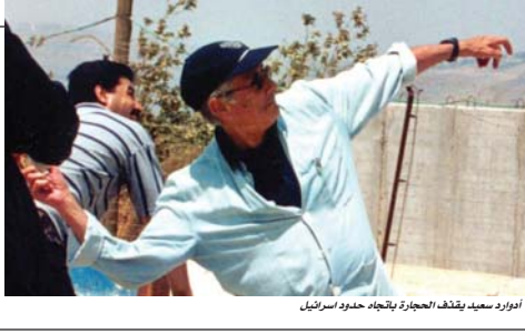
• ادوارد سعيد يقف بالقرب من الجدران بتهنئة حدود إسرائيل

"المفكر المنطاري" العبارة البيئية التي يستخدمها عيدول ر. جان محمد" لوصف الطبيعة الخاصة لفكر ادوارد سعيد، وهي في الواقع تنصّف الأنموذج "السعيد" المروغ وغير النمطي.