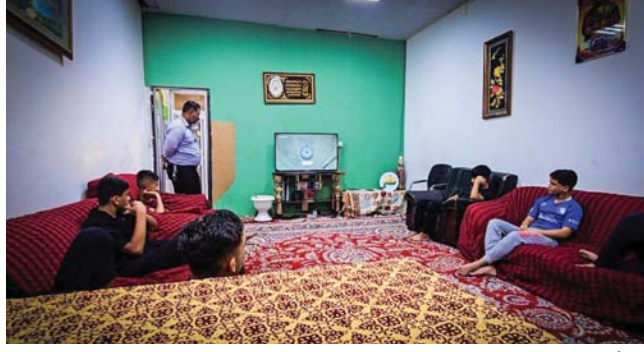
● دفة اسري

العكبات وقيرة، معظمها فيها الكثير من الأسس والعناية، لذا ومن باب الاحتفاظ بقصاها، وما لسناسه من رعاية والاهتمام من لدن دار الوراثة لراوية بالتواجدين كافة، فلا مجال لراوية قصص أخرى عنهم.