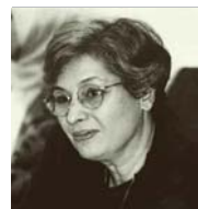
• رشوى عاكور، المحظورة