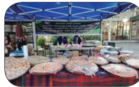
● حلويات للبيع