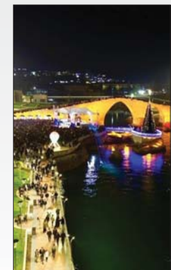
● زاخو سياحياً

وأشار إلى أن القطاع السياحي يعد من أهم المصادر الاقتصادية في الإقليم، إذا توفرت ظروف ملائمة لاستثمار الموارد المتاحة في المنطقة، لافتاً إلى أن عدد السائحين من داخل البلد وخارجه في النصف الأول من العام الحالي، وصل إلى نصف مليون سائح.