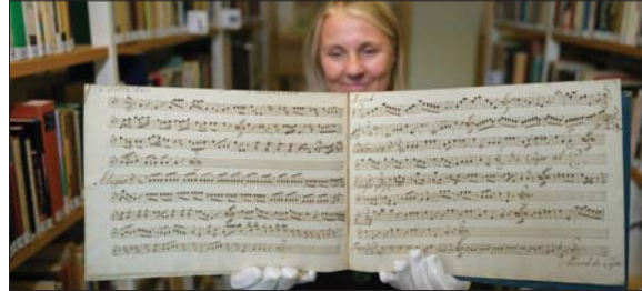
● المقطوعة المكتشفة عبارة عن مجموعة من سبع حركات ثلاثية وترى تبلغ مدتها الإجمالية نحو 12 دقيقة

لكن قائلة كتبها ليوپولد موتزارت والد الموسيقى الشهير وأبرز معلمه، أشارت إلى وجود عدد من مؤلفات موسيقى الحجر الأخرى التي كتبها في شبابه وفقدت كلها.