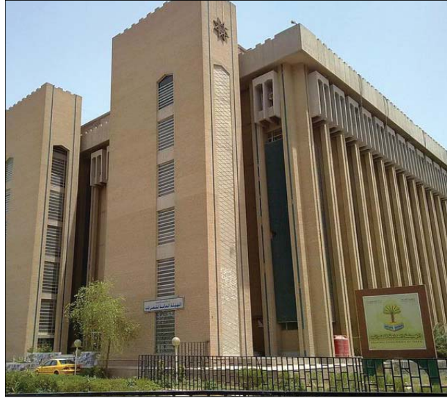
● مبنى هيئة الضرائب

شهد يوم الخميس الماضي، حدثاً وطنياً بعنوان «بازو هو تحقيق العدالة في فرض ضرائب الدخل بمعايير دولية، حيث تسلم مكتب رئيس الوزراء مسودة مشروع قانون ضريبة الدخل الجديد الذي أعدته اللجنة العليا للإصلاح الضريبي والهيئة العامة للضرائب بمشورة وإشراف خبراء الوكالة الألمانية للتعاون الدولي (GIZ)، وتتمثل هذه المسودة أول تغيير استراتيجي في عالم الضرائب في العراق في أعقاب 6 عقود من قانون 1959.