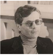
● ميشال دوسارتو، الالتزام الأكاديمي سلطة

(4) في الأعمال الشعرية الكاملة للشاعر - والتي ضمت مجاميعه الثلاث، الغاية العمراء، أسعد إنسان في العالم، حديقة الأفانين - قصيدة خصوصية شعرية، وهي خصوصية قائمة على مفككات كاملة في بساطة اللغة لا لغة البساطة واللغة في شعره وأخره ببعض مفردات اللهجة الشعبية وأشعارها في المقترة مبدئية النهايةات، حسيّة تمنع القصيدة قطعاً اجتماعياً شعبياً سريعاً، مرات في عزّ الظهور، تأخذ أمي لثورة في (الفاونين) - تأخذ بخدما أبي وحضائن أختي، تهمس في أدني، يدراك من فطط الجارة (أم حسين)، مرات في عزّ الظهور، تأخذ والدي منجلها وتروح/ فتحببتهما كالأبي، السواد، باليمين الأممين وتفقرين (كزار).