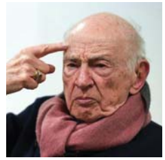
● ادغار موران، فلسفتي ليست أكاديمية