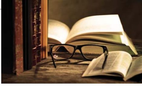
● لم يعد النقد في ظل الثورة المعاصرة فعالية

تختلج التجربة النقدية حدود الفهم الذوقي للخصوص الأدبية إلى فلسفية ونقدية كبيرة في إنتاجها على مر الزمن ولدى مختلف الشعوب، واهتزت شبكة رؤيات نقدية تحزرت على يد نقاد كبار أسسوا مناهجهم النقدية عليها، وأدركوا الطريقة التي مكنتهم من تطوير الضعالية النقدية في حساسية انتقالها من منطقتة النظرية إلى منطقتة الرؤية والمنهج.