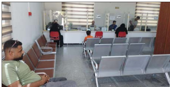
● تسديد الأقساط السنوية في فرع صندوق الإسكان بذي قار

العمليات نفذت بعد رصد تحركاتها ومكان تواجدهما واستدراجهما لكانت محكمة نصبت لهما واعتقلهما ضمن منطقتي الزيمرانية، صخرية