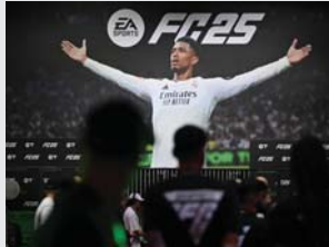
• تامل شركة «الكرينيك أرتس» الأميركية لألعاب الفيديو في إنعاش لعبة مسابقة كرة القدم

مليون لاعب في العالم بالنسخة الجديدة التي تتجعد إعادة تشكيل الوجه من صورة بسيطة، يصبح لاعبو كرة القدم الذين يلعبون لعبة «الكرينيك أرتس» أكثر واقعية. على فوله وتفتح جذب مصصمة لخصائص التواصل الاجتماعي، مشاركة أيزر أحداث المباراة، ويفترض أن يكون الخيارات التكنولوجية تأثير أكبر على أرض اللعب، ويشكل ذلك التحدي محاولة لإضفاء جانب شبابي على السلسلة المحسنة من «الكرينيك أرتس». الرائدة بلا منازع في هذا النوع من الألعاب والتي احتلت المركز الثلاثين لتأسيسها عام 2023 ويعود ذلك النجاح خصوصاً إلى التراخيص التي حصلت عليها (الأسماء الحقيقية للاعبين كرة القدم والفرق والملاعب والبطولات...) والتي قاعدة مجيبين أوفياء للسلسلة، إذ استثمرت 11