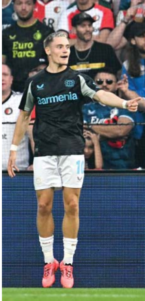
● ليفركوزن يسعى لتقليص الفارق مع بايرن

يأمل باير ليفركوزن أن يبقى قريباً من بايرن عندما يستقبل فولفسبورغ اليوم الأحد، ضمن الجولة الرابعة للدوري الألماني لكرة القدم.