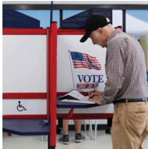
● انطلاق التصويت المبكر في 3 ولايات أميركية