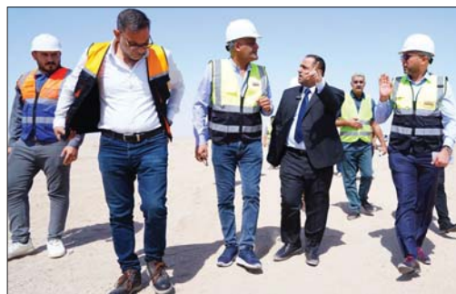
وزير الكهرباء يتفقد عدداً من المشاريع في ذي قار

وأشاد فاضل ب الجهود المبذولة من قبل الفرق الفنية والهندسية العاملة في الموقع، وتحملها الظروف المناخية الصعبة، مؤكداً أن تلك الأعمال تنفذ بجهود ذاتية من قبل رجال الشركة العاملة لتقل الطاقة الكهربائية في المنطقة الجنوبية.