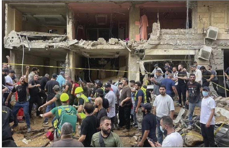
● آثار العدوان الصهيوني على الضاحية الجنوبية ببيروت

ورفض ترامب عقد مناظرة ثانية مع هاريس، قائلًا إن جميع المشاكل التي تسببت فيها هاريس والرئيس جو بايدن نوقشت بتفصيل كبير خلال المناظرة الأولى مع بايدن، والمناظرة الثانية مع هاريس.