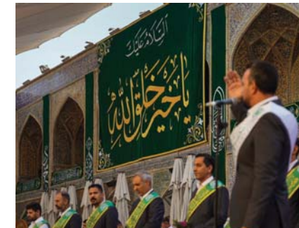
● نستلهم الذكرى لواجهة التحديات

بحسبها وقيادتها الدينية والزمنية، بل كان أيضاً إماماً ومعلماً لأمة المذاهب الإسلامية الأخرى، وهو ما كان يشهد به الإمام مالك والإمام أبو حنيفة والإمام الشافعي وغيرهم. وفي مسيرة أتباع مدرسة أهل البيت، تظهر علامة دالة تتمثل في تأسيس حزب الدعوة الإسلامية، وهي مناسبة مهمة، سنذكر من خلالها الرجال الاستثنائيين الأفاضل، الذين لخصوا بوعيمهم قروناً من التراكمات الاجتماعية والسياسية والدينية، وعبروا عن الحاجات النظرية والعملية للأمة وساحتها، حين يادروا إلى تأسيس حركي إسلامي تنظيمي متقن، حمل اسم «حزب الدعوة الإسلامية»، وكان في مقدمتهم القائد المؤسس السيد الشهيد محمد باقر الصدر. وبعد من أوصاه وتلاميذه، والذين نستلهم اليوم وغداً من عطاءهم وجودهم وتضحياتهم، خير الزاد. لقد طلت مسيرة حزب الدعوة الإسلامية متميزةً بالعطاءات على كل الصعد؛ فمن عطاء الدم الزاكي الذي سأل من أجل العقيدة والوطن، منذ العام 1971، وحتى شهاده مقاومة الإرهاب خلال الأضواء الأخيرة، وهو عطاء ينذر مثله بين كل العطاءات المنظمة في العالم، إلى عطاء الجهاد والمقاومة والكفاح في مواجهة أعتى نظام قمعي عنصري طائفي، وهو ما كان يشهد به العدو نفسه، إلى عطاء الفكر والماد الذي تشهد له الحوزات العلمية والجامعات ومراكز الدراسات والمكتبات، إلى عطاء التبليغ والدعوة والإرشاد الذي ملاء صداه مدن العراق وخصباته، وأمدت إلى كثير من دول العالم، إلى عطاء التنظيم والعمل