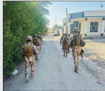
● الجهد الاستخباري يسهم في اعتقال الإرهابيين

الشرقية وجنوبي العاصمة، وتم تسليم المتهمين إلى الجهات المختصة لإكمال الإجراءات القانونية بحقهم.