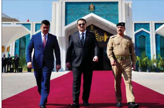
السوداني سيلقي كلمة العراق أمام الجمعية العامة

وفي لقاء آخر، التقى رئيس الوزراء، مساء الجمعة، رئيس ائتلاف النصر حيدر العبادي. وبحسب بيان المكتب الإعلامي لرئيس الوزراء، فإن اللقاء شهد التباحث في جملة من القضايا والملفات المتعلقة بعمل السلطات التنفيذية والتشريعية واستعراض سبل تعزيز التعاون وتوسيع الخطى الاستراتيجية الأساسية لتنفيذ البرنامج الحكومي في مختلف المجالات. وأكد السوداني - خلال اللقاء - أن مهام الحكومة سياسة اقتصادية بنائية والارتقاء بمستوى الخدمات التي يتبناها المواطن من أجهزة الدولة، والتخفيف من معاناته واستكمال البنى التحتية التي يتسبب انقطاعها مضاعفة مشاريع التنمية، بمختلف مستوياتها.