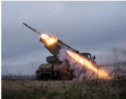
● إسقاط مسيرات أوكرانية

أعلنت وزارة الدفاع الروسية، أمس السبت، إسقاط 101 طائرة مسيرة أوكرانية، فوق أراضيها خلال الليل من دون الإبلاغ عن وقوع إصابات، بينما كانت الأضرار محدودة. وقالت وزارة الدفاع الروسية: "مُرت أنظمة الدفاع الجوي واعترضت 101 مسيرة أوكرانية، وأسقطت 53 منها فوق منطقة بريانسك، بينما سقطت 18 مسيرة فوق مدينة كراستودار، المجاورة لشيبة جزيرة القرم المحتلة على البحر الأسود، والتي ضمها روسيا في العام 2014".