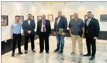
● مصورو ميسان الفوتوغرافيون