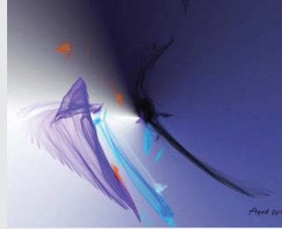
المعيار الحقيقي هو كيف سيكون الحرف في اللوحة؟