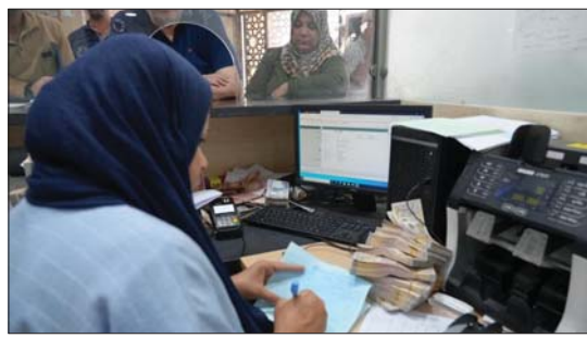
• مسودة قانون ضريبة الدخل الجديد تمثل مظرة في مجال التشريعات الضريبية