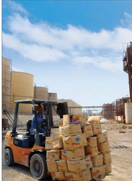
دعوات إلى تطوير مؤسسات القطاع العام وإعادة النظر في كفاءتها

دعا خبيران في الشأن الاقتصادي إلى الإسراع في إجراء تقييم شامل لمؤسسات وشركات القطاع العام التي تكلف موازنة الدولة مبالغ طائلة، مشيرين إلى أن ذلك يعد جزءاً من ضغط التفتتات في ظل تراجع أسعار النفط.