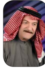
● ياس خضر