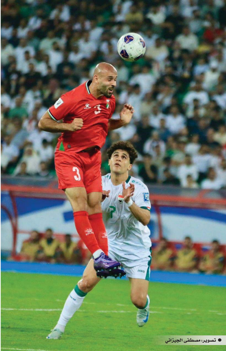
● تصوير: مصطفى الجيزاني