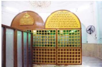
• مرقد الطاهر بن محمد الباقر وعبد الله الاتصاري