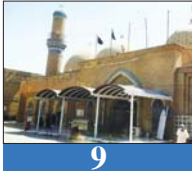
9 مرقد الصحابي سلمان يضيه الماشن بالزاريين