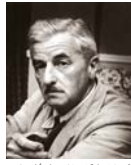
• ويليام فوكنر، الضوء في الغمض

ما زلت أتذكر جيداً شخصية الأم في ثلاثية نجيب محفوظ "بين القصرين، قصر الشوق، السكرية" ولم أكن أعني أن تلك الشخصية بحضورها الطاغى لها أساس اجتماعي قار حتى تجاوزت سنوات طويلة من عمري. واكتشفت أن صورة الأم في سرديات الأدب ما هي إلا وجهة نظر أو تعبير عن أفكار معينة، تتضمن صورتها (مظهر جسد المرأة الخارجي في الحياة الواقعية والتنشئة) وتتعلق بشكل عام بالعقل والعاطفة والرغبة. وصورتها الاجتماعية التي تعنى بدورها ومكانتها في الأسرة والبيئة وما تشكله التقاليد والثقافة.