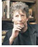
• ناهي ناييف، كورالين