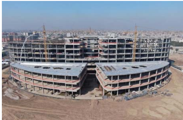
● العراق يتجه لتنفيذ حزمة من المشاريع الاستراتيجية

وأشار الهادي إلى أن هناك أولويات تمثل تقديم المشاريع المهمة التي تلامس متطلبات المواطن بهدف الارتقاء بمستوى الخدمات في بغداد والمحافظات، وكذلك مشاريع التنمية المستدامة من خلال تنفيذ مشاريع المستشفيات والمدارس لما لها من أهمية مباشرة في مختلف المحافظات. وقدمت إلى أن الوزارة أسهمت خلال الأشهر الماضية بالتنسيق مع الجهات ذات العلاقة بتقييم وإعادة العمل بـ (1452) مشروعاً خدمياً منتقداً تنفيذها مختلف الجهات