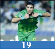
19 الشرطة يحسم ديربي بغداد ويبتزغ الصدارة مؤقتا