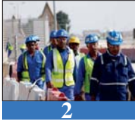
2 تنسيق حكومي - برلاني تنظيم اليد العاملة الأجنبية