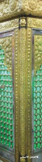
• العشق الأنصاري

تأخذه (سلمان باك) هي إحدى التواحي الأربع (الوعدة، جسر باني، النهروان) التابعة للعبادة المدائن الذي يبعد (30)