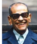
• نجيب محفوظ، الأم الشرقية