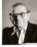
• روبرت بلوخ، سايكو