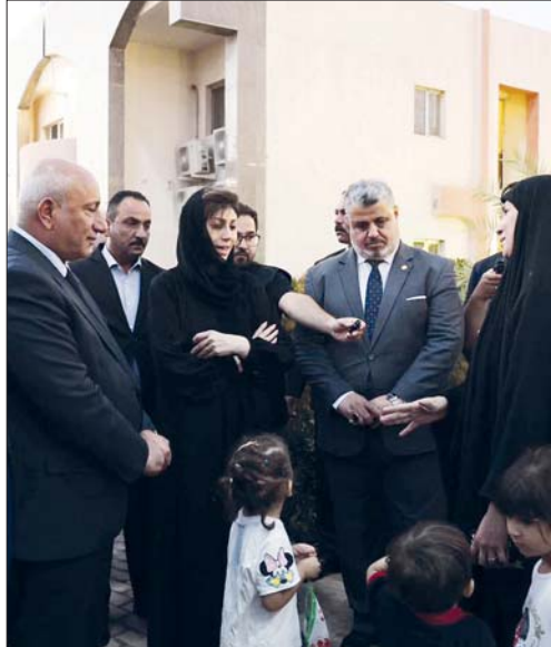
جهود حكومية كبيرة لاستقبال النازحين اللبنانيين وتوفير احتياجاتهم