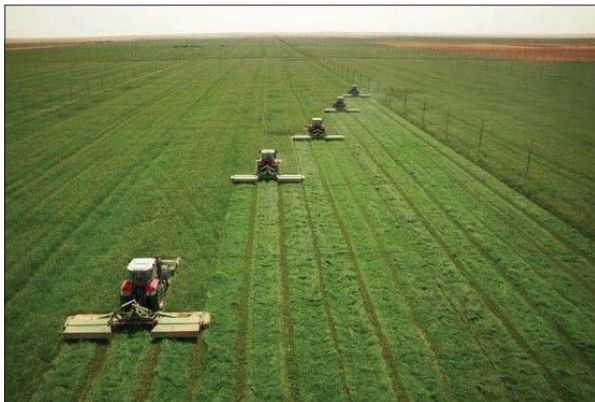
أساليب زراعية متطورة

إلى أنّ للتغير المناخي عواقب اقتصادية واجتماعية، إذ يشكل التزوج والهجرة الجماعان على الاضطرابات الزراعية تصدياً للجماعات الريفية والضرورية العالم. وأوضحت العزاوي أنّ التغيرات المناخية أثّرت بظلالها على المحاصيل الزراعية والثروة الحيوانية والنظم الإيكولوجية، ما دعا إلى وضع استراتيجيات تقنية لضمان الأمن الغذائي في مناخ متغير، مشيرة