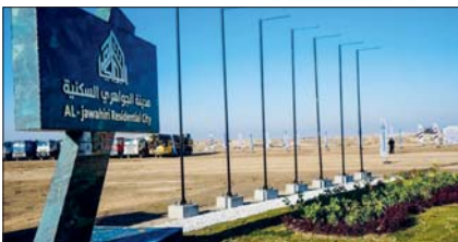
مساح لشمول جميع شرائح المجتمع بالمدن السكنية الجديدة

العراق الذي خرج سالماً من كل المواقف، قادر على أن يجتاز هذه العاصفة.