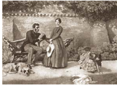
• من رواية "بين آيز" للكاتبة شارلوت برونتي