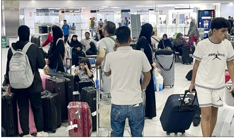
● العراق يتنحى ذراعيه للأشقاء اللبنانيين

● بغداد، حازم محمد حبيب وشيما رشيد ومهند عبد الوهاب / البصرة، سعد السماك