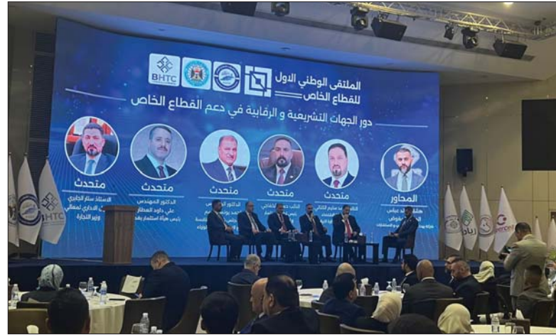
إجماع وطني على أهمية دور القطاع الخاص

التطور الكبير في تكنولوجيا المعلومات سيدفع باستمرار عجلة التحول الرقمي في التبادلات والعمليات المالية ما سيرخّج إمكانية قبول العملات المشفرة في سياقات التبادلات الرقمية.