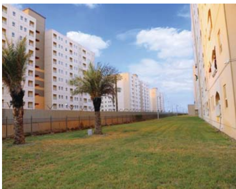
● اهتمام حكومي بالعاملين في القطاع الخاص

قدّمت وزارة الإعمار والإسكان والبلديات العامة مقترحاً إلى مجلس الوزراء لشمول الشباب العاملين في القطاع الخاص، بالمجمعات السكنية العائدة للوزارات، إضافة إلى مشاريع المدن الجديدة. وقال المتحدث الرسمي باسم الوزارة استيرق صباح لـ الصباح: إن وزير الإعمار يتكهن بركاني عقد اجتماعاً للمجلس الوطني للإسكان مع أمانة بغداد والهيئة الوطنية للاستثمار، لدراسة مقترح تقدمت به الوزارة يتضمن شمول لدراسة الشباب العاملين في القطاع الخاص بالمجمعات السكنية التي تنفذها الوزارات، وكذلك مشروع المدن السكنية الجديدة الذي يُنفذ حالياً ببغداد والمحافظات. وأضاف أن الهدف من المقترح هو تشجيع الشباب الذين ليس لديهم وظائف حكومية على العمل بالقطاع الخاص لتخفيف الضغط الحاصل على الحكومة جراء المطالبات بالتعيين، وانسجاماً مع البرنامج الحكومي في دعم وتشجيع القطاع