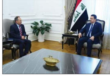
● رئيس الوزراء يستقبل السفير السويسري

وعد السوداني، إعادة افتتاح السفارة السويسرية خطوة مهمة ومرحلة جديدة من العلاقات بين البلدين، مؤكداً أهمية تعميق لجان العمل المشتركة، والتأكيد على الرغبة المتبادلة في تعزيز