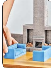
ديالي تبعد بالمصغرات