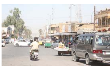
• ناحية سلمان باك التي تحضن المرقد

كم جنوب بغداد، والناحية تتميز بموقع تاريخي مهم، لكونها تحتوي على مرقد الصحابي الجليل (سلمان المحمدي) وكذلك تضم المنطقة آخر ما تبقي من وجود الساسانيين في العراق وهو ابوان كسرى أو ما يسمى بالطاق الذي تم تشييده عام (540) ميلادية (وستفتح ملته في حلقة مقبلة: نتيجة الأهمال الذي يعانيه هذا المرقد السياحي المهم).