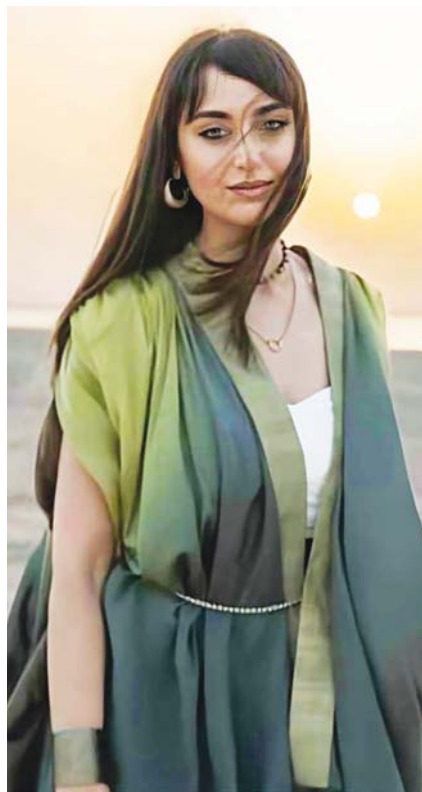
سجلت المحطرية السورية فايا يونان، أغنية "في الطريق اليك" من دون موسيقى، محققة نجاحاً برهافة صوتها المباشر، لا تخف إذا تأخر قلبي عليك، أنا في الطريق اليك

راقب أبناء الدروبنة رقيقاً حزيناً يتصحب بيئاً، ما أتذكره جيداً هو مقاطعة أهالي الدروبنة لذلك الرقيق.