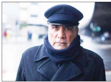
هيثم عبد الرزاق

وواصل الفنان هيثم، أجد نفسي في المجتمع، كما يرديني، مخرجاً أو أساتذاً أو ممثلاً، متابعياً آخر أعماله فيلم أجنبي بالإنكليزية ومرسجة الخلف التي نلت منها جائزة أفضل ممثل في مهرجان المسرح العالمي.