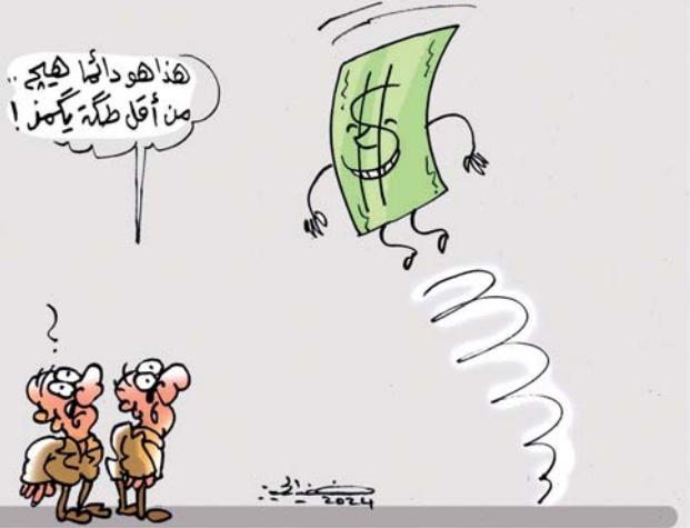
• كاريكاتير: خضير الحميري

والصمود رغم التحديات الكبرى، إلا أنني أؤمن بأن النصر للفلسطينيين قائم لا محالة، فالتحدي الذي يواجهه ويؤيده بجدته سيأتي يوم تحرره فيه الأرض المقدسة، وتعود القدس متأقفة بفخرها وبشموغ شعبها، في الوقت نفسه يبقى الخزي والعار على أولئك الذين يظنون أنهم تحت مظلة العروبة، بينما يتجاهلون مبادئ الفلسطينيين الصلبة عليها مواجهة الاحتلال بشكل مباشر، ما يعجز اليوم في غزة لا يمكن فصله عن جذور الصراع الممتدة منذ النكبة، إذ إن الضغوط التي شاركت في صنع الأحداث آنذاك، لا تزال تداعيات سياساتها تشعر الفلسطينيين بالألم حتى يومنا هذا، وما يزيد من تعقيد المشهد هو التحول الإقليمي الحالي، حيث باتت القضية الفلسطينية، تواجه تحديات مضاعفة في ظل اشتغال الدول العربية بصراعات داخلية وإعادة ترتيب التحالفات