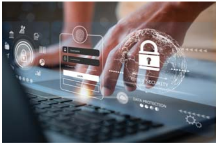
● مفهوم الأمن السيبراني هو الأهم من كل شكل من أشكال الأمن

القارئ أصناف، صنف سبب التهم، لأنه يقرأ هذا النوع من الكتابة للمرة الأولى ولا يفهم لغة الكاتب، وصنف يكره النص الذي يقرأه بوصفه أنتجته كاتب ينتمي لدين ومعتقد وايدولوجيا وهوية مختلفة عنه يهتمها، وقارئ يحب الكاتب ويعشقه فيحب كتاباته ويتفاعل معها، ونادراً ما نرى قارئاً محايداً، سوء الفهم لا يتنجو منه القارئ المبتدئ غالباً، وربما يتعرض له القارئ المتمرس عندما يقرأ بعض الكتب، لا يتساءل سوء فهم الكتب دائماً من وعورة التعبير، أو التباس وإبهام الفكرة في ذهن الكاتب، بل ينشأ من غرابة الفكرة على خفيات ذهن المتلقي ومسبقاته وافق انتظاره.