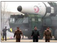
● تزويد التوربين الكوريين