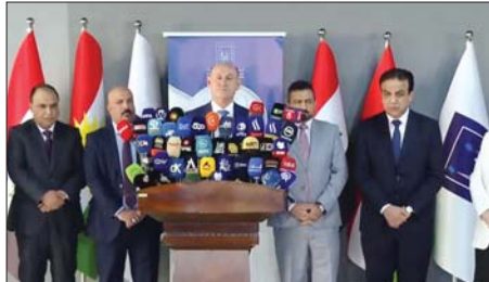
● إتمام الاستعدادات لإجراء انتخابات برلمان الإقليم

العاملة في البلدية بالتعاون مع مكتب مفوضية آريل، متواصلة في لجاتها الميدانية لقرابة سير الحملة الدعائية الانتخابية للمرشحين، ومنها أن العديد من مرشحي الأحزاب والكتاتبات السياسية استخدموا الأسلاك المحظورة لإعلاناتهم، منها (الجزر البوسنية، والإشارات المروية، والتائق الخضراء)، محظاها بضرورة محاسبة المتجاوزين لتعليمات الخاصة بالحملات الدعائية.