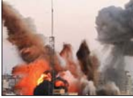
● استمرار الاستهداف الوحشي لقطاع غزة