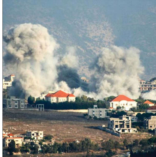
● استهداف صهيوني على منطقة الخيام جنوب لبنان

الحيطة بها، وأعلن جيش الاحتلال عن إطلاق (105) صواريخ من جنوب لبنان على دفتين صوب مناطق الشمال، وخاصة مدينة حيفا وعدة مستوطنات في الجليل.