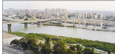
● تشكيل لجان خاصة لتابعة ملف المياه مع دول الجوار