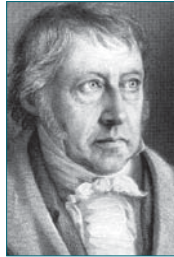
● جورج هيغل، متهج جدي

فرسدت علي طبيعة شخصيتي ومعالجاتي الزمنية، وكوونيتي الزبوري وتعليمي الديني والفلسفي، أن أكون