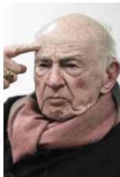
● ادغار موران والوعلة والأراه

التساؤل المنطقي والمقول لدى الإنسان في عصرنا الحالي، هو: لم يشعر بأنه غير قادر أن يكون حركة أكرهات إكس Compulsion تحول من دون تعقيد ذلك، فنرضها النزعة الذاتية للعصر الحداثوي، باعتبارها نزعة شخصية خاصة بعصرنا Personality هي نزعة طاملا وظفها الإنسان نحو السبيرياني وهي الحرية، مع علمه أنه لم يحقق أي شيء، مما أراه فله من تساؤل على مستوى بقاء الشعوب بالاسل جدي، إزاء رؤية السلوكيات الصارمة القيدة له، كي يدرك أنه لن يكون حراً، ذ الروي السلوكية مايكل هازوروت وايزتير كيركمان تضع مفهوم الحرية في القرن العشرين، إن لم تفهم لم تفهم بعاجتاً للتعبير إجمالاً المتجه لهذا التساؤل في كتابه لو هنسبير على الهاوية، يتزوج أدغار موران للشعور بأزمة الحياة التي جعلت من المجتمع العالمي يتصرف على وفق تلك الروي السلوكية، وأن يضع الفرد الحادي والعشرين بأزمات أخرى ما كانت تضطر على بال أحد، تعيد باثفكرة الحرية ضرباً من المجازفة، تعادل فقدان قيمة الإنسان لعاني الحداثة التي شكلت متعلماً رجاً للإنسانية الفرد العربي، لأن تلك الحداثة شهدت منظورين مختلفين ومتناقضين في عالمه التقدم العلمي المذهل والسريع الذي جعل من هذا العالم مختبراً له في إنتاج كل الصناعات التدميرية التي تهدد وجود الإنسان بالمقابل هو يعيش متقيماً من دون حرية، بانتظار الكارثة، ويعزو أدغار موران السبيري نحو الهاوية إلى التطور العلمي والتقني المحبط بنا لهذا ينبغي أن نغير الطريق، ونبدأ من جديد، وأن نصغي إلى العادة التي قالها بها هايدغر: إن الأصل لا يوجد ورائنا، الأزمة التي يراها موران هي أزمة معرفة نيتشه الحداثة، من أوقات أن تجعل فرنسا هذا قرن الأنوار، حيث من الممكن أن يتحقق حلم كانط في أن تتدمج