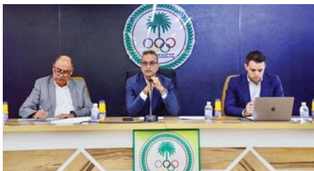
• جهود متواصلة لتطبيق صناعة البطل الأولمبي

لضمان استمرارية العمل وتطويره بالشكل المطلوب. هذا وقد حضر الاجتماع ممثلون عن الاتحادات الجودو، الملاكمة، الكرة الطائرة، التايكواندو، القوس والسهم، كرة اليد، المصارعة، الكاراتيه، الجوجيتسو، الفنون القتالية، البيسبول، الريشة الطائرة، الرغبي، السدراج، تنس الطاولة، التلاشي، السباحة، الكانوي، الاتحاد الجوي، الملاكمة السومرية، الرماية الجامعية، الموي تاي، بناء الأجسام، الكانيدو، الشراكات، الكرة الماهرة، والريشة الإلكترونية. وتمت مناقشة التصديت التي تواجه الرياضة العراقية وكيفية التغلب عليها. والتأكد على أهمية التعاون بين الاتحادات المختلفة لتحقيق الأهداف المشتركة، وتوفير بيئة مناسبة للرياضيين لتحقيق إنجازات مميزة في المسابقات المحلية والدولية. ويندرج الاجتماع في إطار جهود الفريق الأولمبي لإعداد أبطال أولمبيين قادرين على المنافسة في البطولات المقبلة، وتطوير الرياضة ودعم الشباب لتحقيق طموحاتهم.