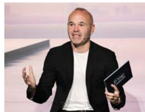
● إنيستا يودع الملاعب