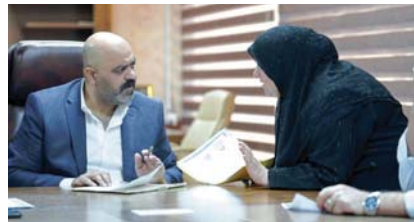
• وزارة التربية تعمل على تلبية مطالب المواطنين