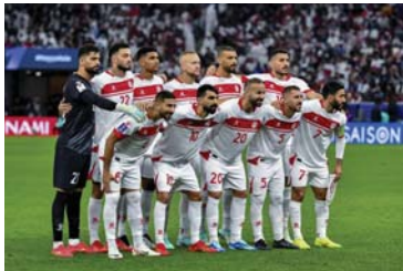
● الحرب تلقي بظلالها على المنتخب اللبناني