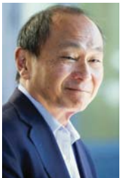
● فرانسيس فوكوياما، التقنية الجيرة