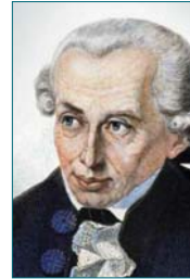
● إيمانويل كانط، فيلسوف

سواء فهم الفلسفة الحديثة لدى الإسماعيليين، في قرأة مؤلفات كانط، وهيجل، ونيتشه، وهايدغر، وأمثالهم، نشأ من كون مؤلفاتها ومصطلحاتها غريبة على دراسي علم الكلام وفلسفة فلاسفة الإسلام، ممن تشبهُوا بمنطلق أرسطو ومفولاته، وآراء الفلاسفة اليونانيين وفلاسفة مدرسة الإسكندرية، سوء الفهم أحياناً نافذة تقود للتأويل إن كان القارئ ذكياً، ربما ينتج سوء الفهم أسئلة متنوعة تثير المعرفة وتولد منها أسئلة عميقة، سوء فهم بعض آراء الفلاسفة اليونانيين ومصطلحاتهم وآراء فلاسفة مدرسة الإسكندرية لاحقاً، كان له أثر ملموس في إثراء الأسئلة والمناقشات لدى بعض الفلاسفة المسلمين.