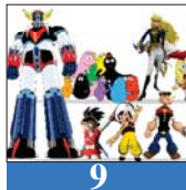
9 أفلام الكارتون تتقدم لعناصر قصة الهدافة