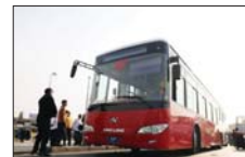
● بغداد، نقل طلبية الجامعات