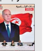
● سعيّد رئيساً لتونس