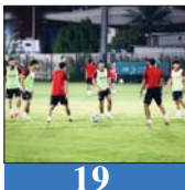
19 «الوطني» يرفع وتيرة تحضيراته