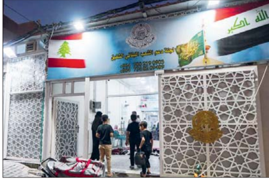
● معتبة العلوية المقدسة تخصص مركزاً لاستقبال العوائل اللبنانية النازحة

وأكد العموري، أن فرق الجمعية تزور مجتمعات اللاجئين اللبنانيين وتقيم احتياجاتهم وتقدم لهم المساعدة، من خلال الجهود المتكاملة والمتواصلة، «وبين جاهزية الجمعية واستعدادها الدائم للاضطرارية بشكل كامل لإغاثة الأشفاء اللبنانيين أينما كانوا، وأشار إلى وجود 8 آلاف لبناني لغاية الآن، إلا أن أعدادهم متغيرة بشكل دائم في حال استمرار القصف على مناطقتهم».