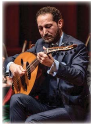
● نصير شمة

والكمان، وغيرها كما نستعد في بيت العود في ابو ظبي لإقامة حفل فخرى لطلبة العود والكمان. وعلى الصعيد الشخصي أشار شمة بأنه سيشارك في حفل موسيقي سيقام نهاية الشهر المقبل بالملكة العربية السعودية، كذلك ستشهد دار الأوبرا في القاهرة مطلع شهر كانون الأول المقبل احتفالية مرور ربع قرن على تأسيس