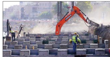
● الحكومة مستمرة بإنجاز المشاريع الحيوية والاستراتيجية