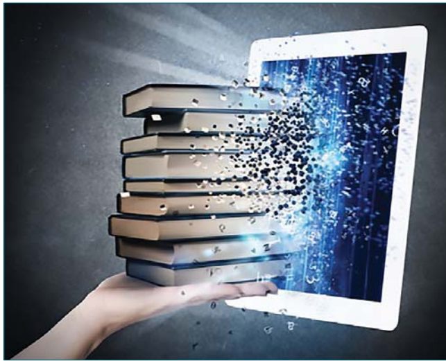
● كأننا أمام بوابات واسعة لدواع الكتاب الورقي