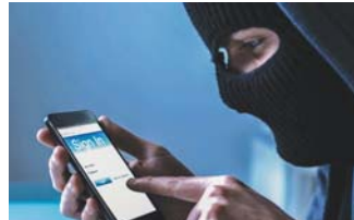
لا يد من نسخ البيانات على السحابة

يحتاج مستخدمو الهواتف الذكية بين الجنين والأخرى إلى تبديل أجهزتهم سواء التي تعمل بنظام أندرويد أو أي أو أس، ولجلبا كثيرون إلى بيع هواتفهم بعد ضبط المصنع ويبيعها.