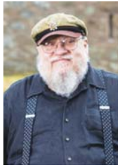
جورج مارتن، رقصه التلحين