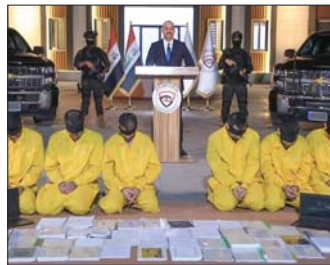
جهود بطولية يقوم بها جهاز الأمن الوطني في ملاحقة الإرهابيين

لإرباك الوضع السلمي في المحافظة، لافتاً إلى أن مفارز الأمن الوطني في كركوك وبالتنسيق مع المديرية العامة لجهاز الأسيدي في السليمانية، تمكنت من تفكيك شبكة تنتمي إلى عصابات داعش تضم 7 عناصر إرهابية، بينهم ما يسمى أمير قاطع كردستان بداعش الكتي أزد شاذي. وأضاف أن عملية الداهمة أسفرت عن انتعاش أحد الإرهابيين بعد محاصرتهم، وتم ضبط استمارة اتماء إلى العصابات الإرهابية ويريد تواصل وكتب تحمل الفكر التكفيري وأجهزة ومعدات ومطائرة مسيرة، منوهاً بأن