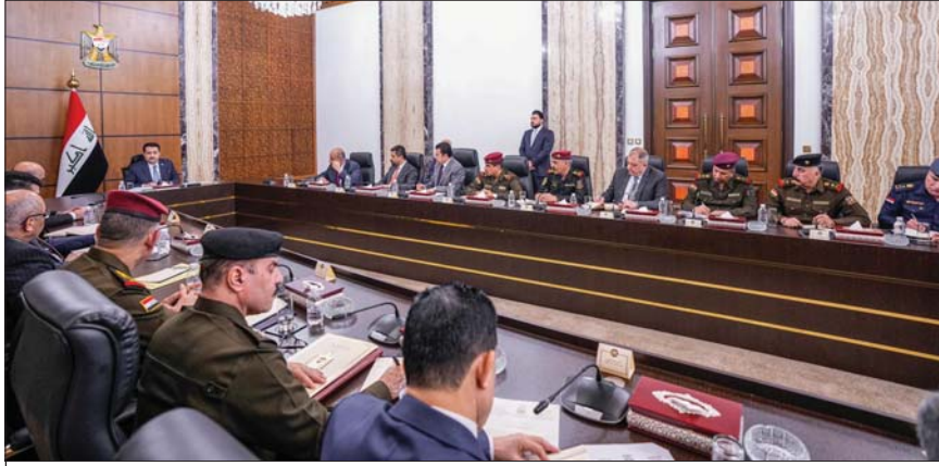
السوداني يبحث في اجتماع طارئ للمجلس الوزاري للأمن الوطني عقد مؤخراً الأوضاع الأمنية على المستوى الإقليمي والدولي

يعقد مجلس جامعة الدول العربية، اليوم الأحد، اجتماعاً طارئاً على مستوى المندوبين الدائمين وذلك بناء على طلب العراق مناقشة التهديدات الصهيونية، وبينما وجهت وزارة الخارجية رسائل إلى الجهات الدولية وعلى رأسها مجلس الأمن لتطويق وإجهاض النوايا الصهيونية واكاديبها الساعية لتوسيع الصراع، أكد رئيس مجلس النواب الدكتور محمود المشهداني دعم توجهات الحكومة العراقية في ما يتعلق بالحرب والسلام والتهديدات التي تتعرض لها البلاد، مشدداً على أن العراق ورغم سعيه للسلام إلا أنه لا يهاب التهديدات.