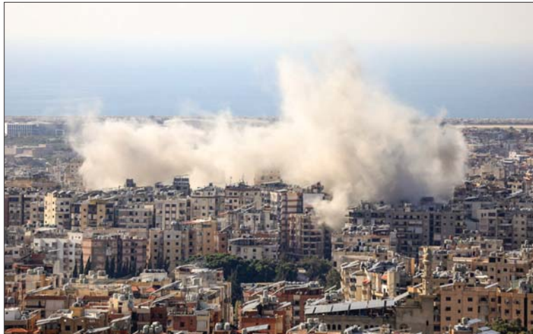
● العدوان الصهيوني يتواصل على مدن لبنان