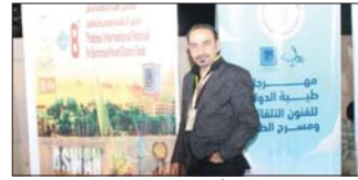
● دزي.. يتعلم من براعة الأطفال

شارك الفنان العراقي مصطفي دزي في الدورة الثامنة من مهرجان طيبة الدولي للفنون الذي أقيم مؤخراً في مدينة أسوان جنوب مصر. وقرر دزي تنظيم ورش عمل لتعليم فن الرسم للأطفال، بعدما لاقى صعوبة في نقل أعماله الفنية في فن الخبز.