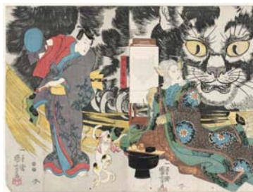
● من مخرج الثقافة الشعبية والأساطير اليابانية ● فانتازيا الخطاب

ومع تقدم الراوي في العمر، لا يتعاضد أبداً من فقدانها بحبيبه الشابة خيالية بطريقة ما. وبعد أكثر من عقد من الزمن، يستيقظ ذات يوم في حفرة في بلدة معاطة بسور مرتفع ويجد حبه المفقود يعمل في مكتبة المدينة، حيث أنها بقيت في السادسة عشرة من عمرها ولا تتذكره. لا أحد في البلدة يتذكر أي شيء من الوقت الذي قضاه خارج الأضواء، وهذا هو السبب الذي جعله يقرر البقاء. ويسمع طلة بالهروب من دونه. بمجرد رحيل الطل، يستيقظ الراوي