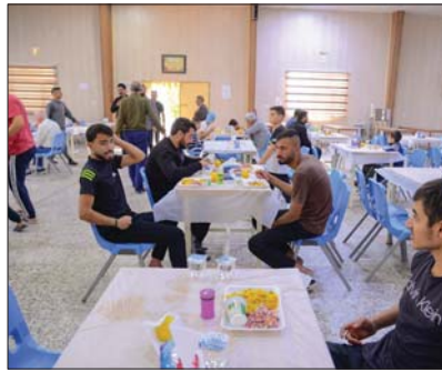
تقديم وجبات الطعام للعوائل اللبنانية في مدينة الزايرين بكرملا

وبين البديري، أن المورد الأخير من لجان الإغاثة، تمثل بتقديم المساعدات في سوريا، إذ تم افتتاح مطبخ خاص هناك يقدم ثلاث وجبات طعام، فضلاً عن مستشفى ميداني قدم الخدمات الطبية والعلاجية لأكثر من 23 ألف مواطن لبناني، فضلاً عن توزيع المواد الغذائية البهاة وحبب الأطفال وجميع المستلزمات التي يحتاجون إليها مع انخفاض درجات الحرارة. في ذلك، قال فريق الإعلام الحكومي في بيان صحفي أطلعت عليه الصباح، إنه انطلاقاً من واجب الأخوة والتضامن، والالتزام بالشفقة، وتقديراً لتوجهات رئيس مجلس الوزراء باستفاد العهد الحكومي العالجه بهدف التخفيف من معاناة الأشقاء ودعمهم في تجاوز هذه المحنة، وصلت آلاف الأطنان من المواد الإنسانية والإغاثية والعدائية والطبية المتوخمة إلى لبنان. وتابع، أن هذا الدعم يأتي تأكيداً على عمق الروابط الأخوية التي تجمع حكومتين وشعبي البلدين، وتجسيدا لتقييم الإنسانية التي تربط بينهما.