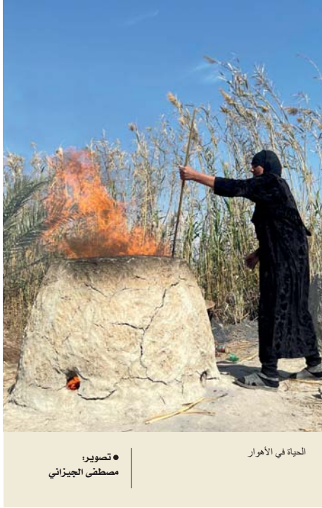
الحياة في الأهورا