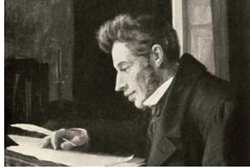
سون كيركجورد، المنظومة الهيكلية