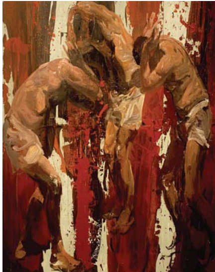
تدرجات لونية تترك انطباعات بالعدالة