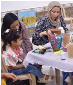
● ابتداء جيل واع