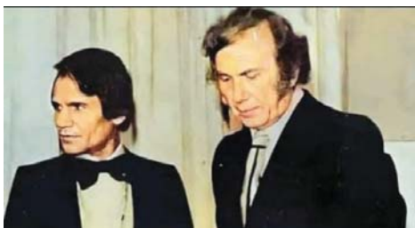
● نزار قباني وعبد الحليم حافظ، قارة الفنجان

كتب نزار قباني قارة الفنجان بوصفها قصيدة أولاً، فيها شروط الشعر الغنية الحديثة على مستوى التقنيات والموضوع، وفي أن ينشرها أرسلها إلى حليم وأبلغه أنه لا تنبئها، حسب قول حليم الذي أصبح سمة عراقية واضحة، فالصراعات الأيدولوجية التي جات بعد مرحلة التأسيس أثرت المشهد السردى، وما أن حلّ الحصار والحرب في مرتحي الثمانينيات والتسعينيات حتى انبثقت مرحلة جديدة من الكتابة تتماشى مع الوضع الراهن وانتجت العديد من السرديات المتميزة حتى شعر القارئ بأن الرواية والقصة في العراق تضجرت واكتملت. الكتاب ويحسب معده يقدم زاوية نظر جديدة سلط الضوء من خلالها على أعمال إبداعية لم تلتفت إليها أفلام النقاد في موضوعه العجايبية ومن ثم فهو يمتلك خاصية جديدة من شأنها أن تجذب المثقلى إلى متن الكتاب وإجباره على الخوض في المراءة المستطرفة التي كلما توقع الشاعر الوصول إليها واخترت وتلاشى حضورها، فهتذذ الشاعر رومانسياً باستمرارية البحث عنها والسعي خلف ظلها أكثر من لذة الوصول إليها، في سياق صوفي أو سحري تتجلى فيه أمام الشاعر أحياناً في كل شيء، بطريقة الحول، أو لا شيء، في واحد، فعل ذلك مثلا الشاعر حسب الشيوخ جعفر في أغلب قصائده لا سيما المدروسة ومنها. حيث الفجر وزيارة السيدة السومرية حيث شككت ظاهرة في موضوعات شعره ومثله أيضاً البياتي في قصيدته أولد واحترق بجيبي ويحده الجموع من لارا، وسيل على هذا النوع من الرقائبي في قارة الفنجان مستعترفاً بعلوم العرافات والخرافة الذي يبيح التنبؤ الحر الجلي والاسطوري للذات البطلية قارة الفنجان المعادلة زمريا لمجلة الشاعر الرائي، وسمه التنبؤ واحدة من سمات عمله الحدائث الذي أريد له أن يكون إنساناً حارقاً قادراً