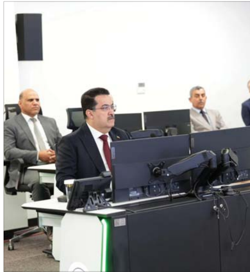
● رئيس الوزراء خلال متابعته عملية التعداد السكاني