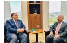
السفير العراقي مع مساعد وزير الخارجية المصري