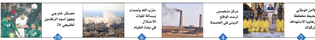
1 معسكر خارجي يجهب أسود الرافدين تخليجي 26