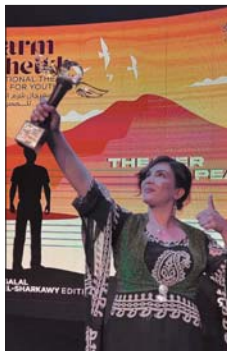
● سلمى تتفوق