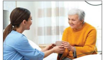
● تحفيز الصحة النفسية

جيدة والحفاظ على الذاكرة فيمكن ممارسة هواية سابقة أو تجربة هواية جديدة، كما أن اللعب مع الأحفاد أو تعليمهم أموراً مفيدة تخفف الكثير من الوقت الضائع مع الاستمتاع معهم، ويمكن أن يكون الانخراط في المجتمع وحضور الاجتماعات في التمتع والتعرف على المجتمع وبناء علاقات صداقة جديدة، وبعد التفرغ أو السفر من أهم ما يمكن أن يفكر به المسن للاستمتاع بأجواء جميلة وساحرة، وتغيير الأجواء التي تمنحه مسحة وحالة نفسية جيدة. كما أن تجديد نشاط العقل قد يساعد على منع تراجع الذاكرة ومشاكل الإدراك، فعمل شيء جديد ومفيد كحل الكلمات المتقاطعة، أو الأنغاز المعقدة يحافظ على الذاكرة وتنشيطها وأفضل الأمور التي تحافظ على الصحة الجيدة جسدياً وعقلياً وتحسن الثقة بالنفس هي ممارسة التمارين الرياضية بانتظام.