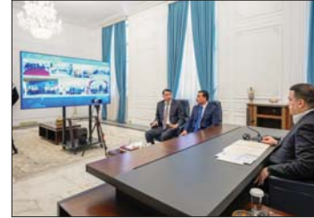
السوداني خلال افتتاحه عبر دائرة تلفزيونية المدارس الجديدة

مدرسة ضمن مشروع الاتفاق العراقي الصيبي، من المشاريع المهمة التي عمدت عليها الحكومات، والتي نفذت بتصاميم نموذجية حديثة، ستسهم في معالجة مشكلة الاكتظاظ والدوام الثلاثي، وأن من المزمع إنجاز (210) مدارس، المتبقية ضمن هذا المشروع خلال شهرين. وأكد، أن الحكومة تسلمت مشروع الألف مدرسة، وكانت نسب الإنجاز محدوداً (18) بالمئة، وتم وضع ضمن إنجازها 1000 مدرسة، وذلك بحضور وزير التربية والتعليم، وحرس على تنفيذ وفق المواصفات المميزة، وضمن توزيع جغرافي صحيح، شاملاً على مضي الحكومة لإكمال كل مشاريع البنية التحتية للمدارس، بضمنها مشروع (1) الخاص بوزارة التربية.