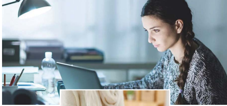
● العمل تنظيم وحاجة مادية

في ظل التحديات الاقتصادية التي تواجه الكثير من الطلبة، يجد العديد منهم أنفسهم مضطرين للجمع بين العمل والدراسة من أجل تلبية احتياجاتهم المالية وضمان إكمال دراستهم والحصول على شهادات دراسية، وعلى الرغم من صعوبة هذا التوفيق، يرى كثيرون أن الجمع بين الجانبين أصبح ضرورة لا مفر منها.