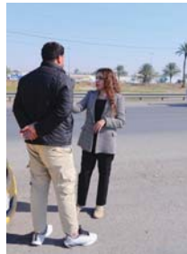
● الحررة مع أحد المواطنين

ويؤكد الخبراء أن المشاريع الصغيرة التي تُنفذ بين الحين والآخر يجب أن تستكمل بمشاريع استراتيجية طويلة الأمد تضمن تحسين الطرق بشكل شامل، مع توفير ميزانية خاصة للصيانة الدورية تضمن رقابة مستمرة على أعمال الصيانة.