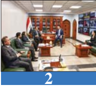
2 كتلة الاتحاد الوطني الكردستاني تشيد بالتحويل الإيجابي الذي تشهده شبكة الإعلام