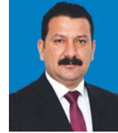
● النائب علاء سكر العبداني