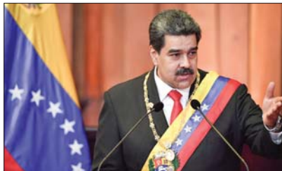
الرئيس التنفيذي نيكولاس مادورو

ويعد أميركي يرتكب الكيان الصهيوني منذ 7 تشرين الأول 2023، إداة جماعية في غزة خلفت أكثر من 148 ألف شهيد وجريح من الفلسطينيين، معظمهم أطفال ونساء، وما يزيد على 10 آلاف مفقود، وسط دمار هائل ومجاعة قتلت عشرات الأطفال والمسنين، في إحدى أسوأ الكوارث الإنسانية بالعالم.