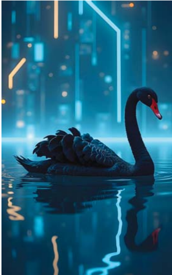
● نظرية البجعة السوداء

تسمح القصص الأدبية للشارحين بالدخول إلى عوالم بديلة وبناءها معاً، وهي عوالم صمیمة المألوفين بعناية، وتدعوهم هذا الانغماس في وقت ومكان قد لا يشهون عنهم، وتجسد قصة دون كيوشوت عملية بناء العالم، أي بناء عوالم خيالية لها سمات جغرافية واجتماعية وثقافية متماثلة، من خلال تبنى التماثل، وضمان نوح تشاركي للعمل المستقبلي، وينتقل عنصر بناء العالم في ورشة عمل المستقبل الأدبي من إنشاء شخصية فردية إلى بناء عالم تعاوني، ويخلق