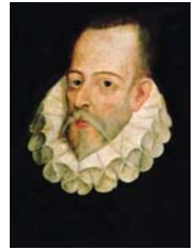
● ميغيل دي سيرفانتس دون كيخوت

يسمح منح هذه الأداة التأمليّة التقديريّة لمن يمتدح الخيال الأدبي بالاستقراء متعدد الطبقات للمستقبل، أي إنشاء الخيال الأدبي من أساليب المستقبل، وهو أمر مهم لأن الغرض الأوسع من أساليب المستقبل هو مساعدة الناس على التعبير عن كيفية اتخاذ القرارات، وفي النهاية التصرف بناءً عليها، وفي الوقت نفسه يخلق التماثل إلى إطار أكثر انتقاداً وتقييماً للأصول الأدبية للنشاط، إذ يحتاج المؤلفون أيضاً إلى العمل على جعل عالمهم قابلاً للتصديق، وفقاً لمعايير خيالهم.