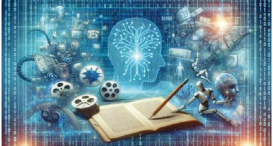
● صلب أدب المستقبل الضوء على التعاطف

نظرية البجعة السوداء Black swan theory نظرية تشير إلى صعوبة التنبؤ بالأحداث المفاجئة وتقدم على فكرة أن الجيد كله أبسط، أما وجود البجع الأسود فصار كان ذلك قبل اكتشاف البجع الأسود في أستراليا، وتتمثل هذه النظرية في الأحداث التي يكون احتمال وقوعها غير وارد، ومعظم الناس لم يروها يوماً، لذا فهم يعتقدون بعدم وجوده، لأن تعلمهم اعتادت على التفكير في سنق معدّون دون سواد