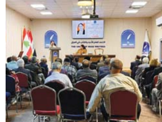
• الجلسة دليل على شغف الشاعرات بإبراز تجاربهن وأسواتهن

فلسفة يمكن يك سبياً وأحد بعينه هو المسؤول عن ذلك، وهذا يدل على أهمية الفلسفة بوصفها مجالاً حيويًا في الواقع، أما الأمر الثاني فهو أن الفلسفة تتداخل علمياً مع حقول ومجالات معرفية وممارسات عملية عدة، فهي متداخلة مع العلوم والطبيعات، لأنها تبحث في ظواهر الكون والعالم وتقدم إجابات في هذا الشأن، وكذلك تتزج مع السياسة بوصفها تشكل مبادئ كل سلوك سياسي للدولة. تاريخياً، الفلسفة لا تزال تهم في هذا المجال الإنساني المهم، فقد حضر افلاون الذي أسس الأكاديمية في اليونان كان يهدف إلى إيجاد رجال أكفاء بمقدورهم ممارسة السياسة كإلانة يكون أنبسطه العدالة حتى اليوم الفلسفة التي نحن فيه الآن تسعى الفلسفة إلى اقتراح أشكال مختلفة من الأنظمة التي تدبر شؤون الحاكمين والمحكومين، وقد ولدت نظريات كثيرة من قبيل الفلسفة تجري في هذا الاتجاه من قبل الجمهوريات واستعادة الفعل السياسي ونظرية العدالة كالتصاف، والتواصلية العقلانية والشيعوية والبرغماتية وغير ذلك من نظريات أخرى وأيضاً نلاحظ أن الفلسفة طريقة تفكير تساعد على تطوير السياسة الاقتصادية عبر البحث والتجليل والانتقد، وهي أدوات العقل التي من خلالها تعرض على الأفعال وتتأورها. إن الفلسفة تتحرك من جميع الجهات والتي الجهات جميعها، وهذا التعدد في عوامل نشأة الفلسفة قوة وشرها لها وليس مصدر ضعف على الإطلاق.