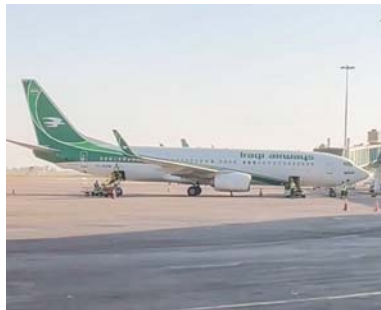
● تصوير، علي قاسم

وأضاف أن العملية سيقبها خطوط لاتعماد التقنيات الحديثة في توريد وتصدير المواد الداخلة إضافة إلى الخدمات الأرضية