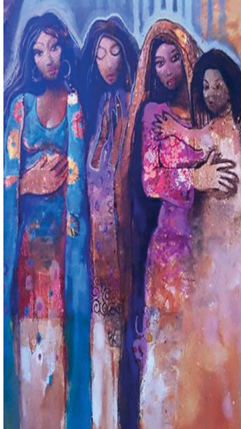
أعمال تشي بالانتماء الحقيقي للبيئة