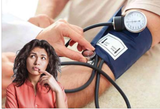
• حياة قنفة

وفقاً للكيبيسي، فإن العديد من الشباب يقضون ساعات طويلة أمام شاشات الهواتف وأجهزة الكمبيوتر، مما يسهم في تدهور صحتهم البدنية والنفسية، وهي أحد عوامل العزلة الاجتماعية والانفصال عن أسلوب الحياة الصحية الذي كان يتبعها الأجداد. وينصح الكيبيسي، الشباب بالجلوس إلى التغيير السلوكي بشكل جذري، من خلال تطوير مهارات التكيف