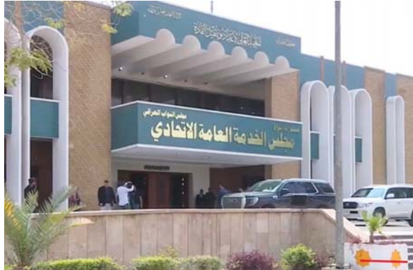
● جهود واسعة لاستحداث درجات وظيفية جديدة

وأضاف أن العمل يجري من أجل القيام بعمليات الاستحداث وتوفير التخصيص المالي للدرجات والمناوين الوظيفية بما يتواءم مع تخصصات المتقدمين، لافتاً إلى أن المجلس يبذل جهوداً كبيرة في إيجاد احتياجات المتبقين من المرحلة الثانية. وفي ما يخص ملف توظيف المجموعة الطبية والصحية، أوضح الملاحي أن المجلس ستم من وزارة الصحة 29 ألف اسم، إذ إن دوره يتحصر في تسلم البيانات بشكل تفصيلي بالتخصصات والأسماء والأعداد، وبدءاً بقرم عمليات التنسيق للبيانات وإصدار رقم التوظيف بعد موافقة مجلس الوزراء. وبين أن المرحلة الثالثة من التوظيف سيجري المباشرة بها بعد إنهاء المرحلة الثانية، وتشمل حجج البيانات للمشمولين من حملة الشهادات العليا والأوائل المشمولين بقانوني