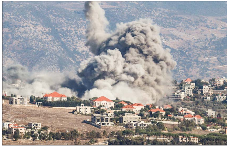
• معارك عنيفة بين حزب الله والقوات الصهيونية جنوب لبنان

ووافق نحو ألف مشارك في مؤتمر الشباب المناهض للفاشية من 72 دولة على بيان ختامي للمؤتمر يدين التدخل في الدول، والاستعمار والحوالات الإمبريالية لإطاحة الشعوب الحرة، وجاء في البيان، إن الفاشية تعاجم الديمقراطية وتحرم الشعوب من حقوقها الأساسية وترسخ عدم المساواة والتبجح والنفذ والجور، الفاشية عدوياً للدول، بينما اقترح المشاركون في المؤتمر إنشاء مركز تحليل لمكافحة الفاشية ومدرسة ومركز أبحاث في كاراكاس لدراسة الفاشية المعاصرة.