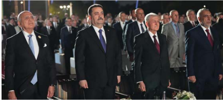
● الرياضات الثلاث تحضر الحفل الذي أقامته وزارة الخارجية مساء أمس الأحد بمناسبة الذكرى المئوية لتأسيسها