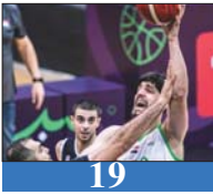
19 اليوم.. وطني السلة يواجه نظيره السعودي