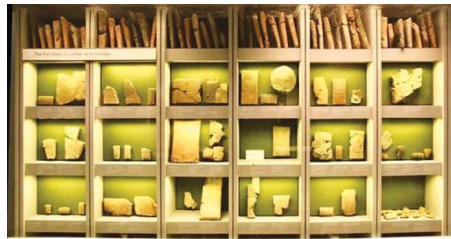
• الفلسفة في مكتبة شعور بنبيل

والذي هو من التفكير والذويون هم اتباع ديمقريطس ولوقيوس تيتوا فكرة الذرات الصغيرة التي تشكل العالم، وهيراقليطس ذهب إلى أن النار هي أصل الوجود، وهكذا تلحظ أنهم أشبه بفلاسفة علم، أو يمكن تصنيفهم بالكوزمولوجيين لو تخيلنا ذلك أكثر. في حين راج البعض إلى الفنون إن المدينية - الدولة سبب أساسية في نشأة الفلسفة أي أن طرح الفكرة من مصحوبة بالدليل عليها. فقد شاع في مدن اليونان القديمة اجتماع المواطنين الحُرار لناقشة الأوضاع السياسية لديهم، وكانوا يطرحون الأفكار برقة دلها لتبنيها أو إهمية ما يطرح كونه الحل الأنسب لمعالجة حالة سياسية معينة لا ما ملو. عند جماعة من هؤلاء القدرة على الاستدلال وتوسل البراهين، ظهرت إلى الواقع الفلسفة التي ليست هي إلا طريقة في التفكير مصحوبة بالدلائل العقلية، حتى قيل إن الفلسفة بنت المدينية أي أن المدينية - الدولة كانت عملاً في ظهورها. وإذا نظرنا بعمق إلى كل ما سبق نلاحظ أموراً مهمة أولها سامت فلسفة أرسطو