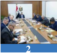
2 السوداني، الحكومة وضعت الأسس لتحويل الرقمي