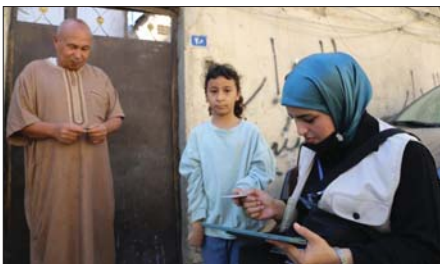
● بغداد: الصباح