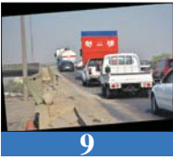
9 بغداد.. مصبرات جديدة وطرق متهاككة