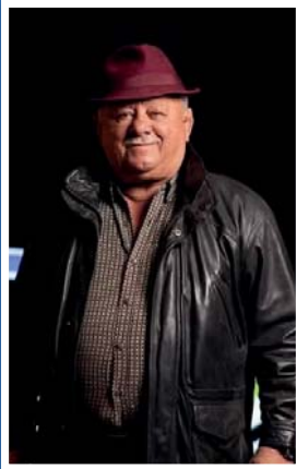
● مصارع القرن كمال عبود