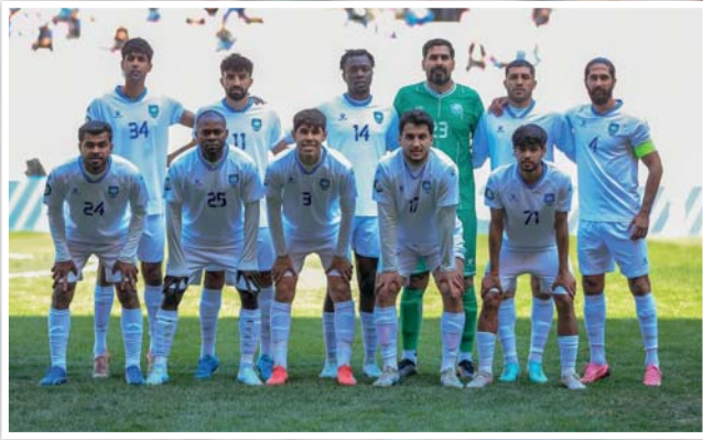
● فريق امانة بغداد