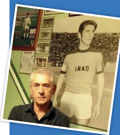
● دكلص عزيز